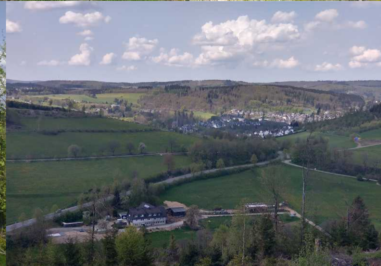
B: Lunch op de Felsklippen Fredlar. RO: Zicht vanaf de berg Frelar.