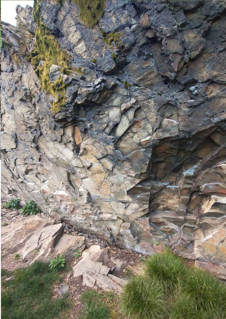
B, LO: De top van de Fredlar. MM: Rode bosmier, Formica sp. Gesteente op de Fredlar.