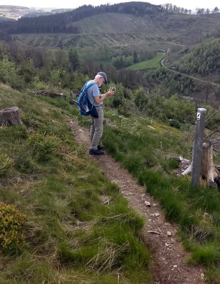
LB: De heuvel, waar we helemaal om heen lopen. RB, MM, RM, O: Zicht vanaf de Fredlar.