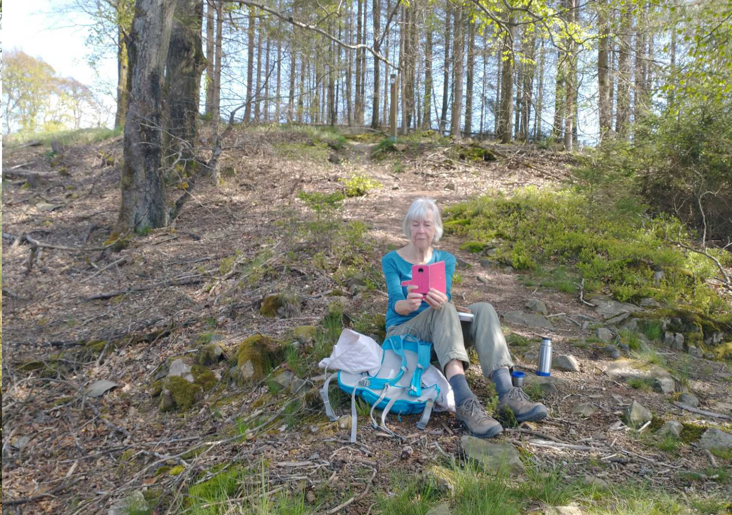
We lunchen op rotsen op de flank van de Fredlar (13:15). Later gaan we de bergtop over en krijgen Bad Berleburg weer in zicht.