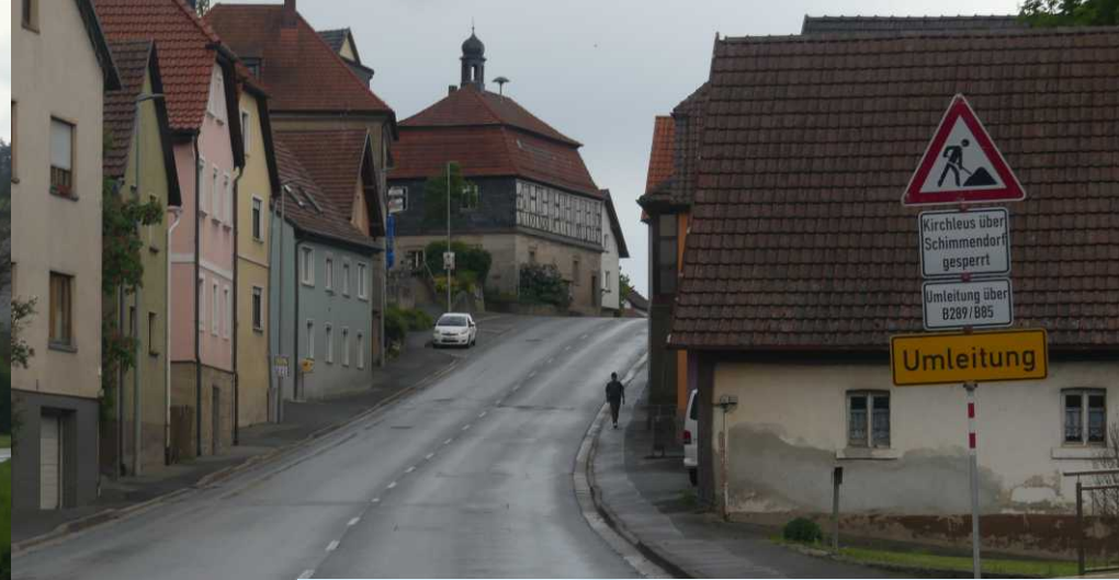
Mainroth 17:20, We zien de Plassenburg bij Kulmbach. Om 17:33 is het al weer droog. Brug bij Untersteinach (17:37). LB: Burgkunstadt. RB, MM; Mainroth. LO: Plassenburg, Kulmbach. RO: Brug over de Schorgast, Untersteinach.