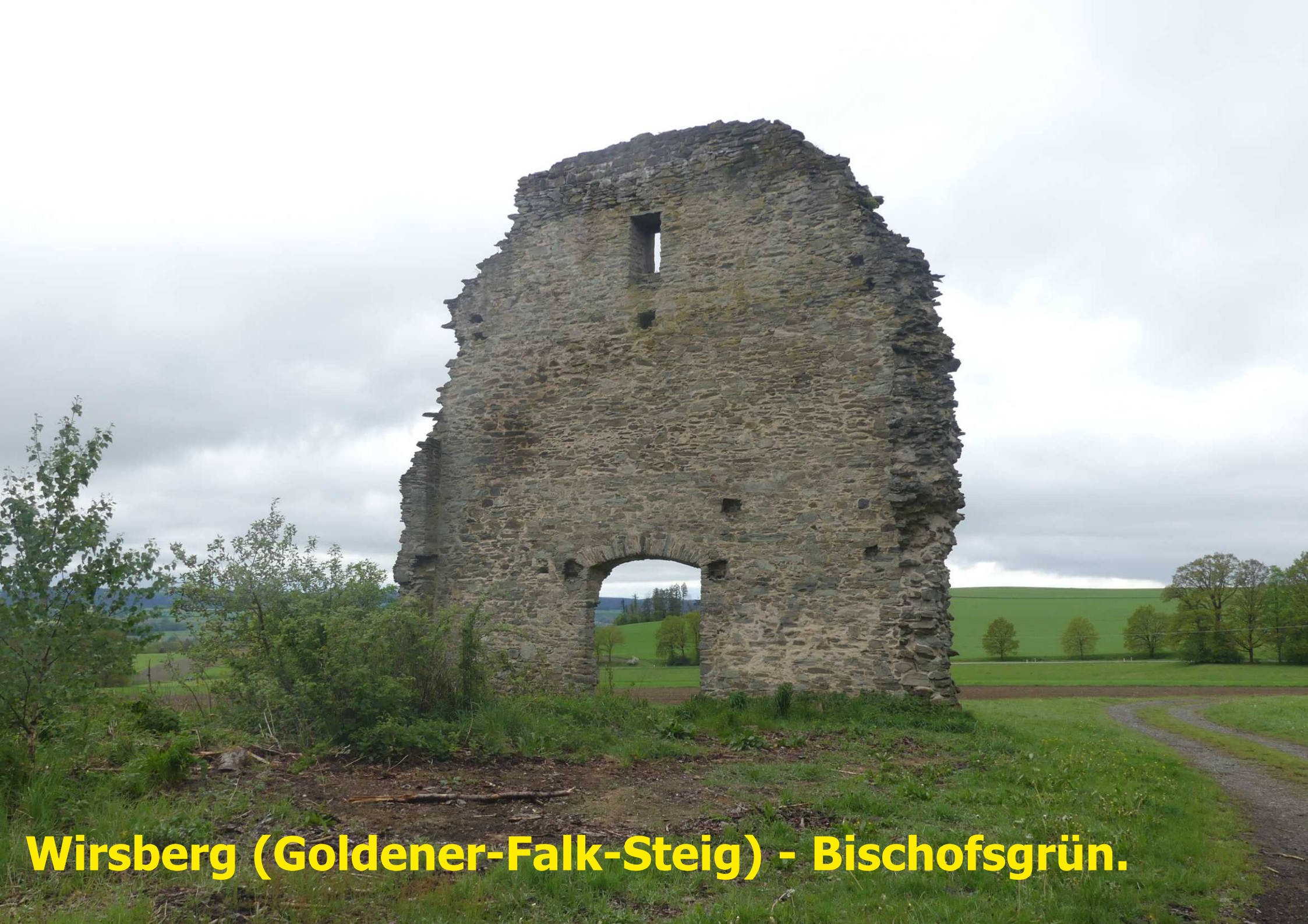
Wirsberg (Goldener-Falk-Steig) - Bischofsgrün.