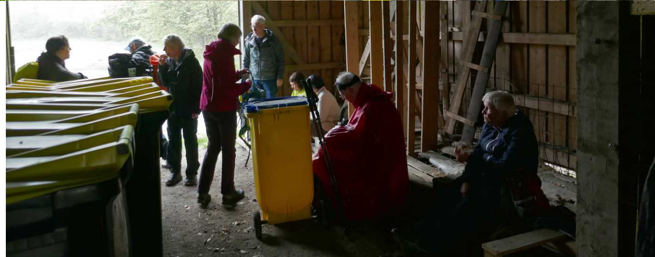
LB: Wandelingen om de Grosser Waldstein. MB, RB, RM, LO: Schuur bij het Waldsteinhaus. MO: De granieten beer met mal. RO: Rotsen van de Grosser Waldstein.

Om drie uur wordt de Gaststätte Waldsteinhaus bereikt, nadat we eerst Ton en daarna Attie even kwijt zijn. We schuilen een tijdje in de schuur aan de achterkant van het huis. De meegenomen lunchpakketjes worden opgemaakt en als het zo goed als droog is, bekijken we de berenval iets verderop met 'n granieten beer èn de steen waaruit die gesneden is. Hoe hebben ze dat gedaan? Een zwaar puzzelstuk is het in ieder geval.