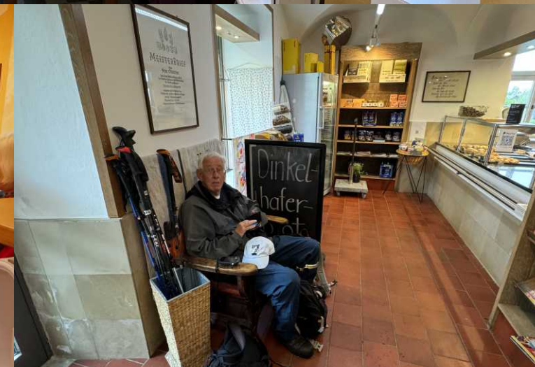
LB: Bäckerei Günther, foto Lan. RB, MM, RM, O: Bijkomen in Bäckerei Günther.