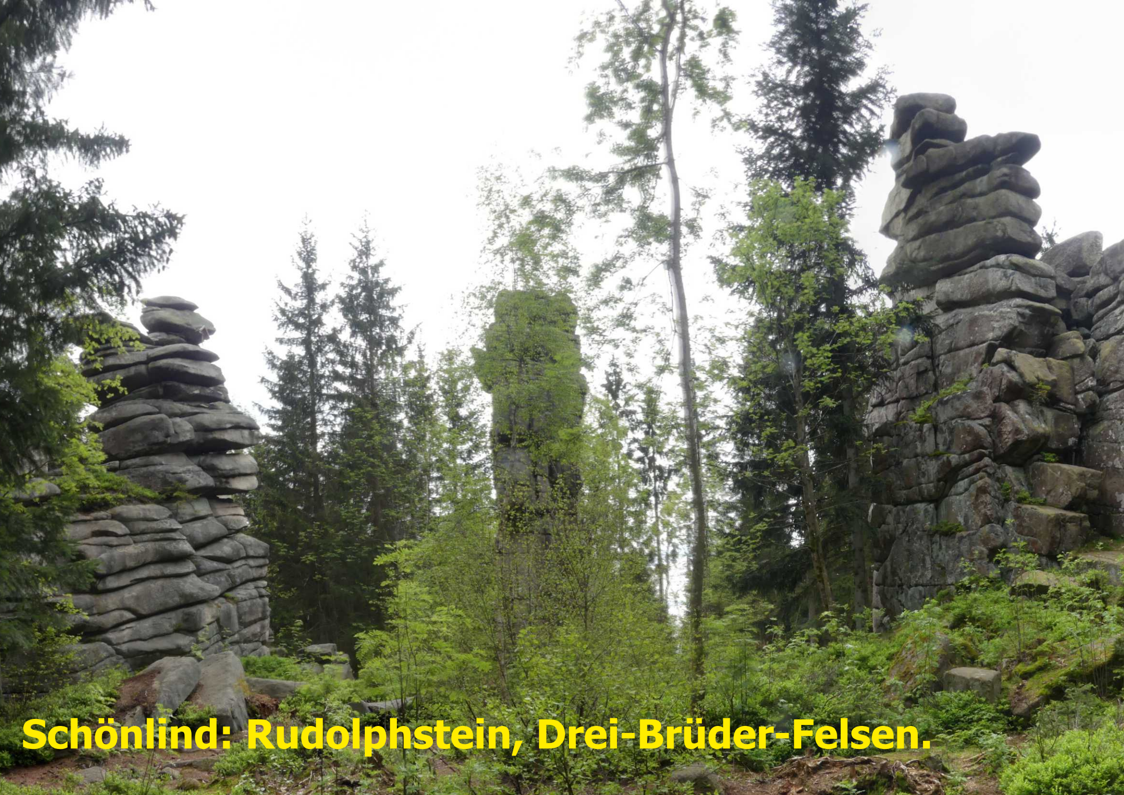
Schönlind: Rudolphstein, Drei-Brüder-Felsen.