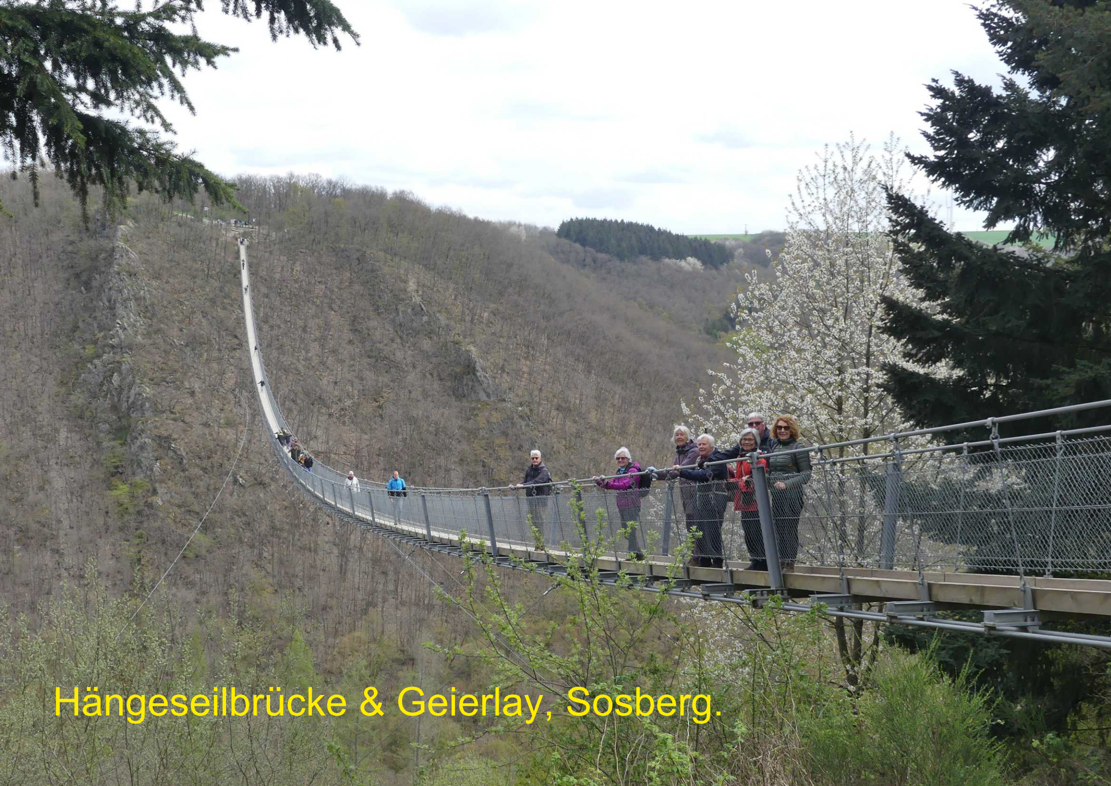
Hängeseilbrücke & Geierlay, Sosberg.