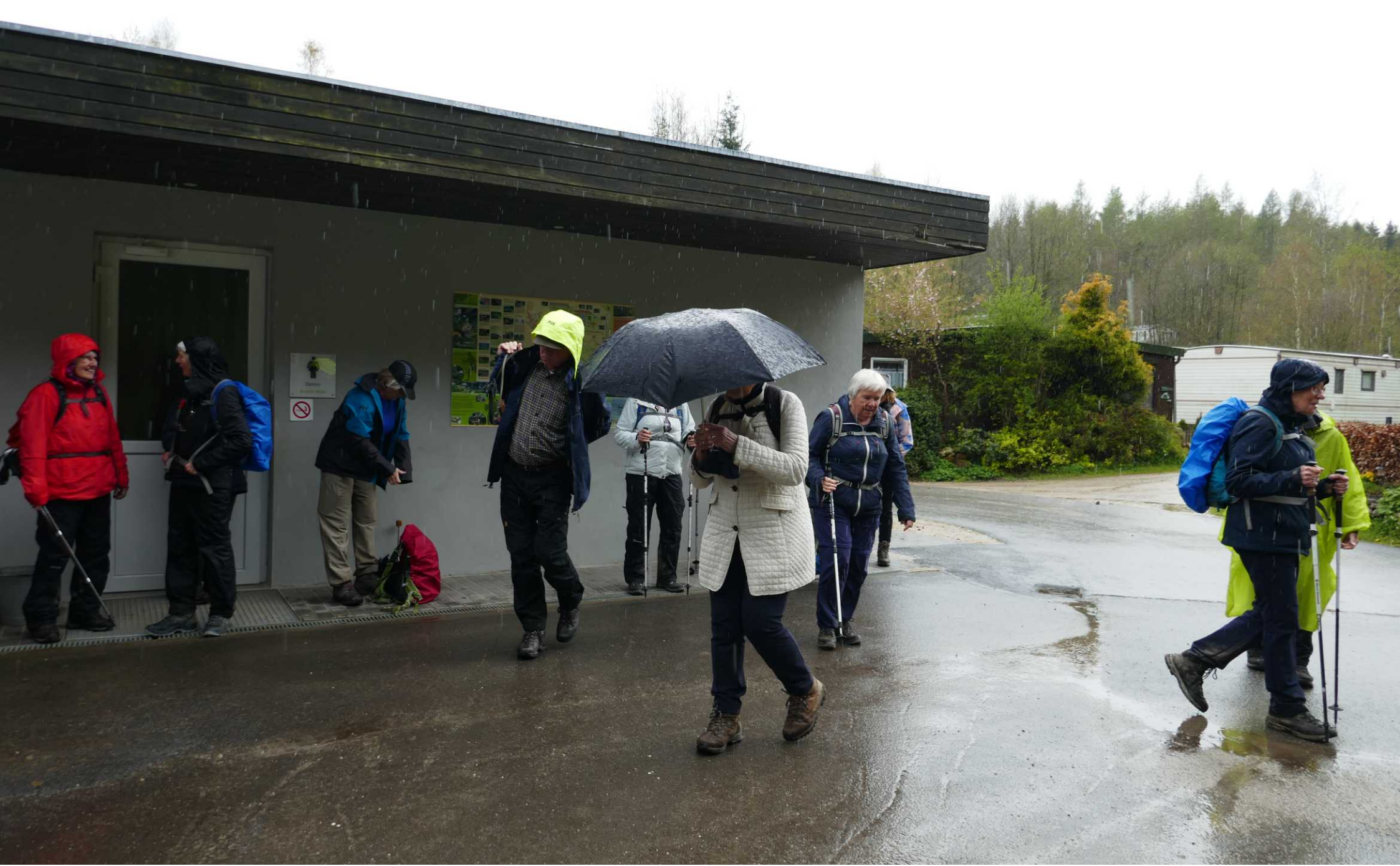
Helaas gaan de hemelstuizen weer direct wagenwijd open als de wandeling weer opgepikt wordt.