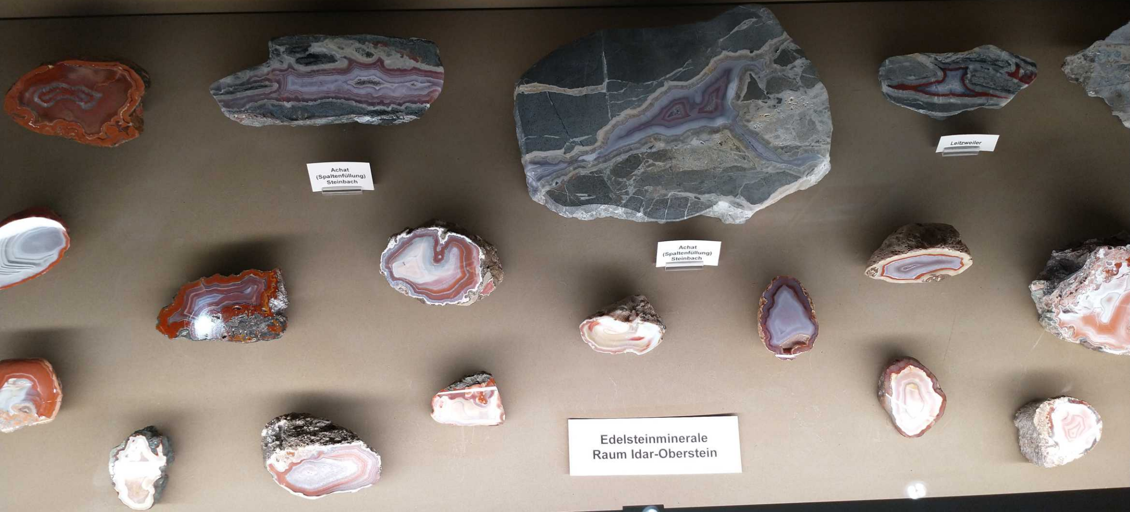
Achat (Spaltenfüllung) Steinbach