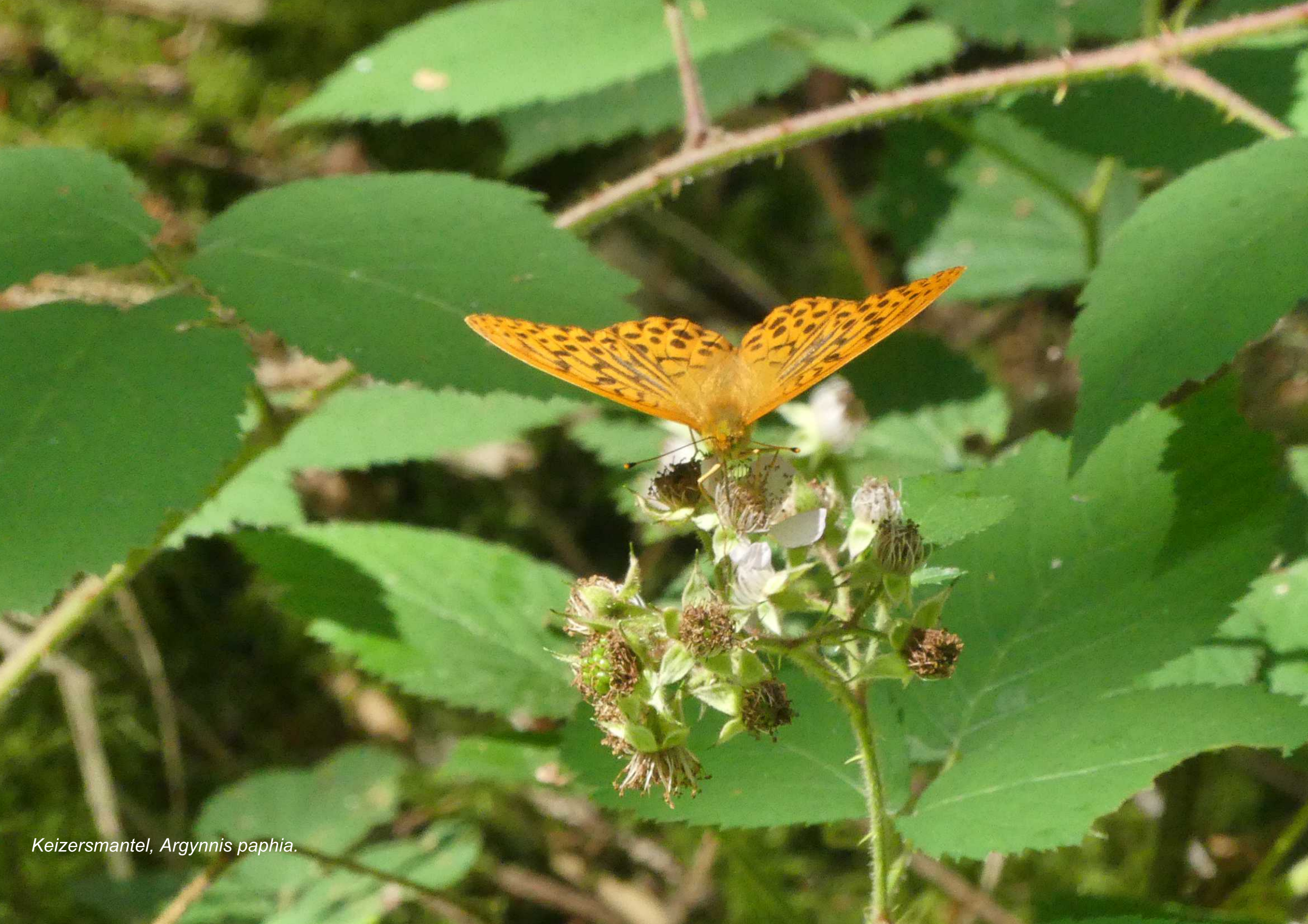
Keizersmantel, Argynnis paphia .