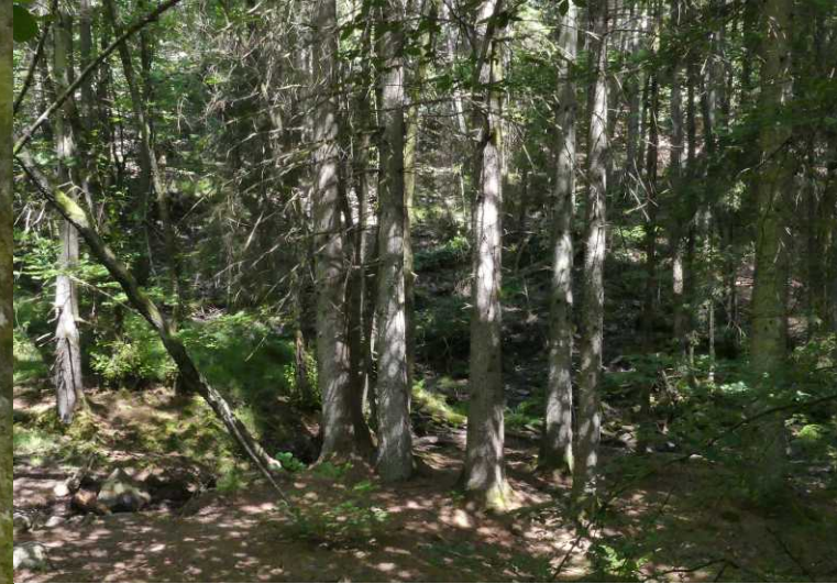
LB: Lautenbach. RB, LM: Lautenbachtal. MO: Klein geaderd witje, Pieris napi .