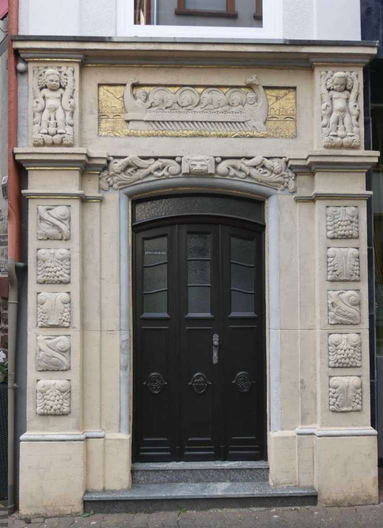
Via een ouderwets gezellige winkel-barretjesstraat lopen we weer terug. Via de B421-brug kunnen we weer terug naar de camperplaats.