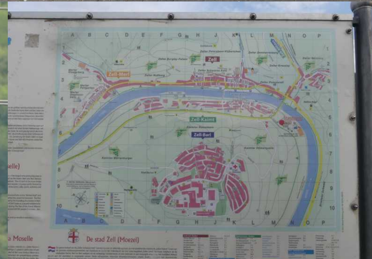
LB, RB: Balduinstraße, Zell. MO: Dergelijke ballen boven het Moseltal. RO: De plattegrond van Zell.