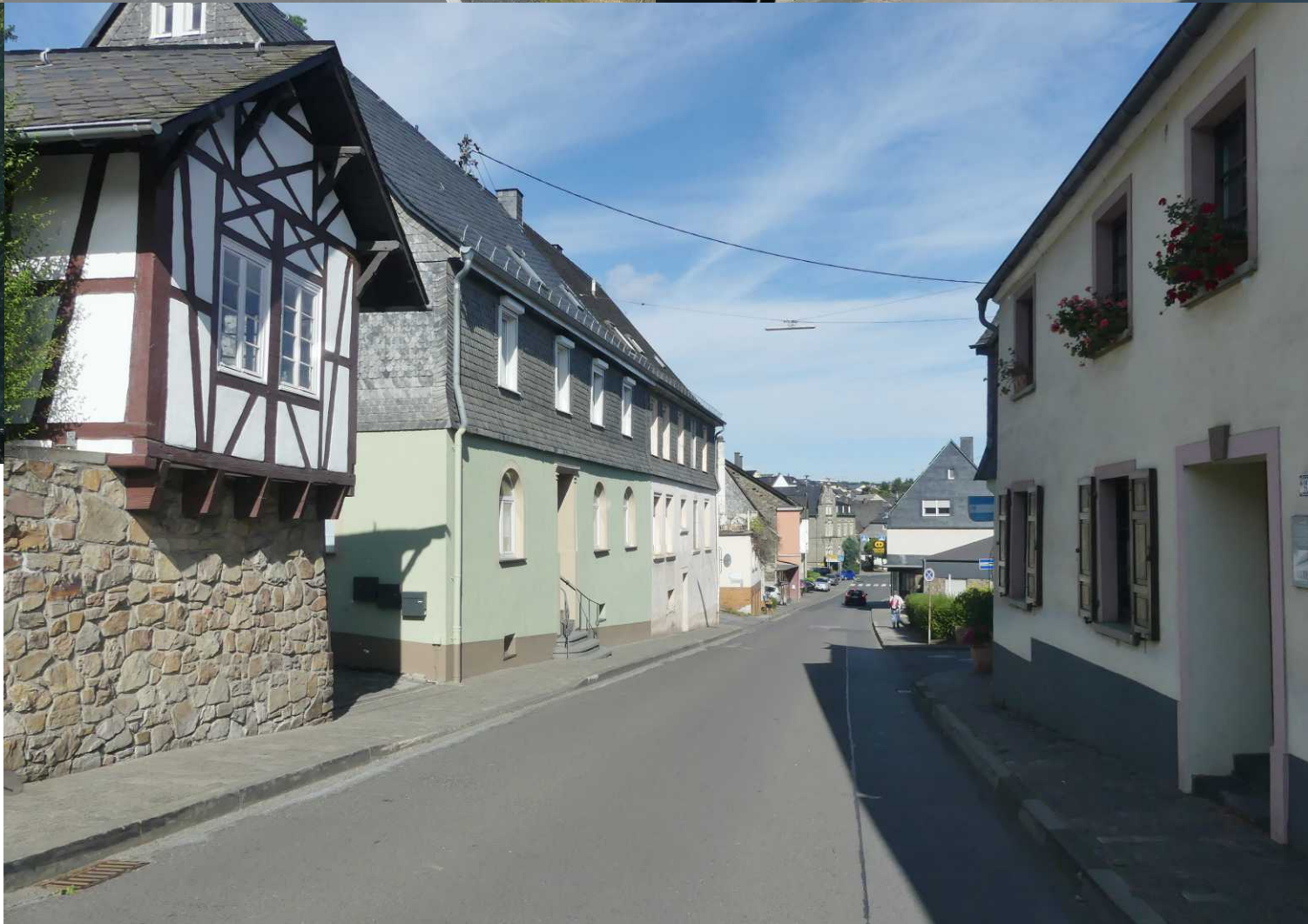
We rijden door het oude centrum van Rhaunen (9:42).