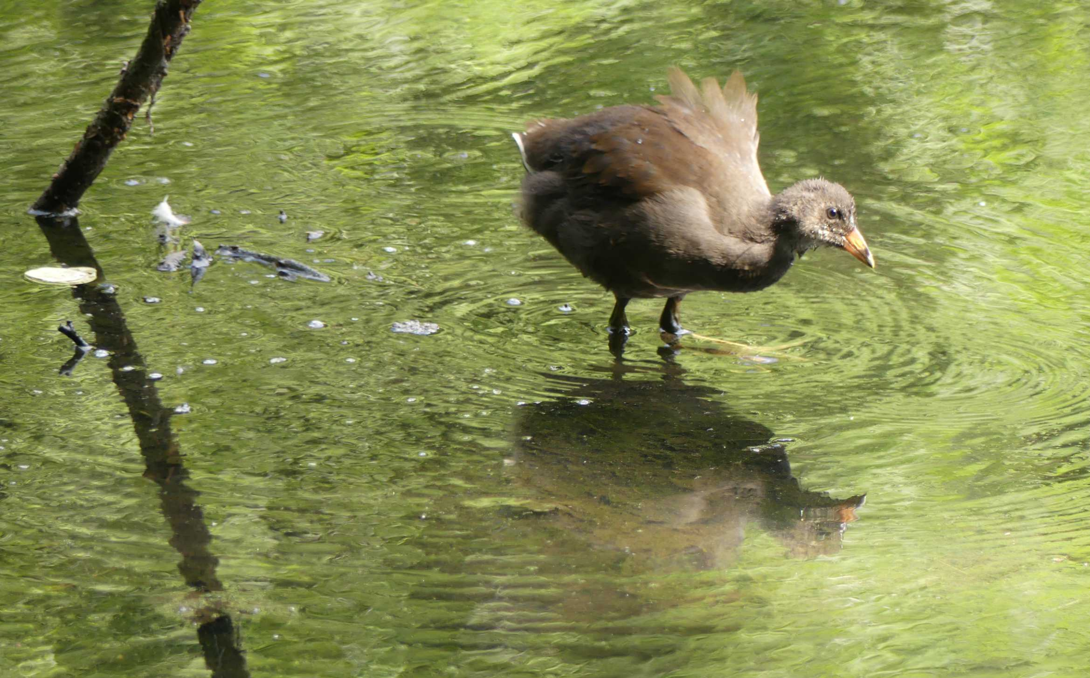
Waalre (NL) - Senne, Bielefeld (D).