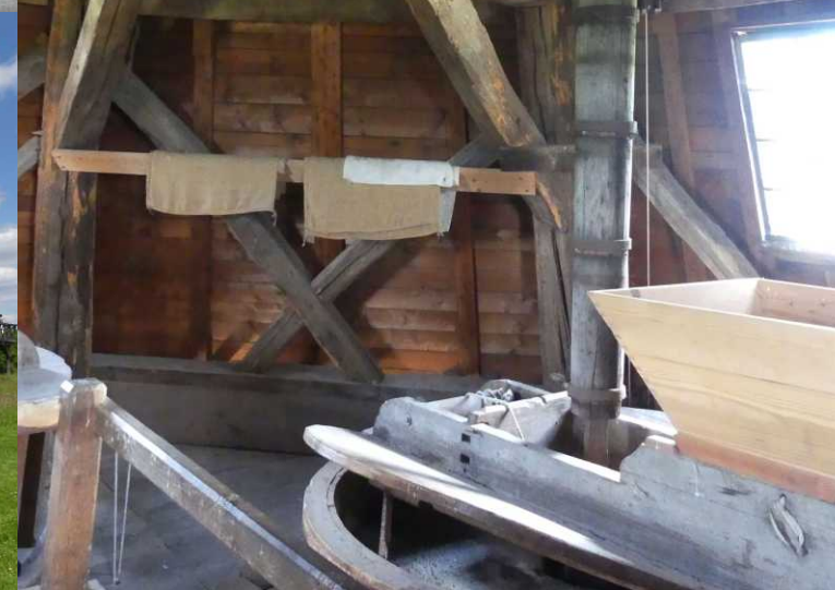
LB: Bruine kiekendief, Circus aeruginosus . MB, RB, M, MO, RO: Mühle Schaaf/Döpke.