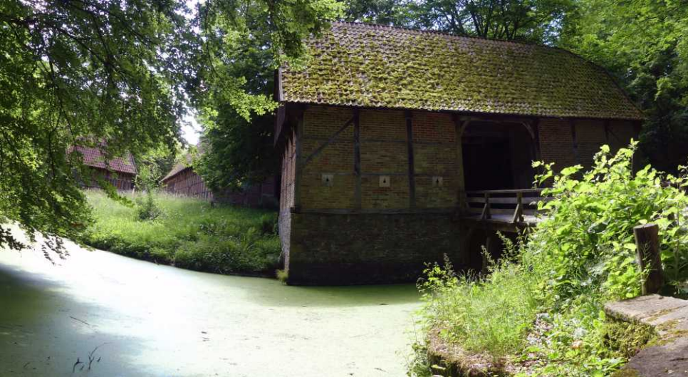
Vorige pagina: Watermolen.

Dan beginnen we aan een tijdreis langs vele oude gebouwen, die hier vanuit verschillende delen van Duitsland hierheen verhuisd zijn.