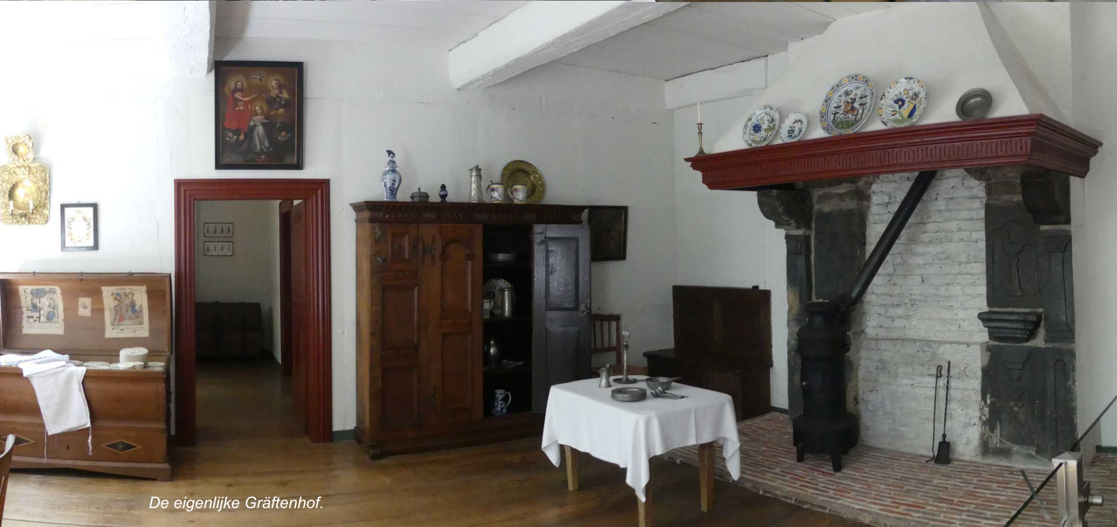
De eigenlijke Gräftenhof.