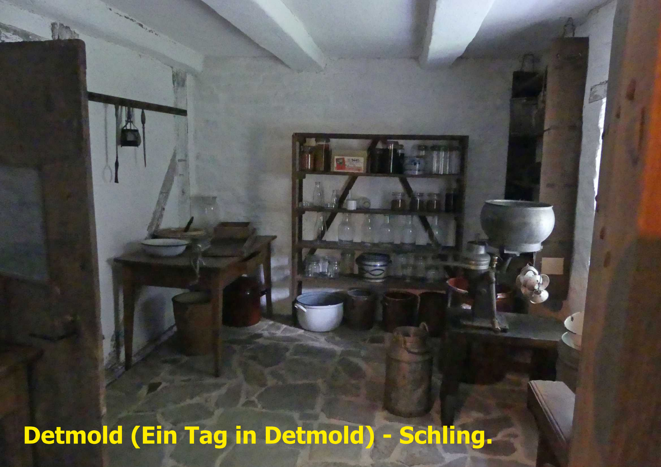
Detmold (Ein Tag in Detmold) - Schling.