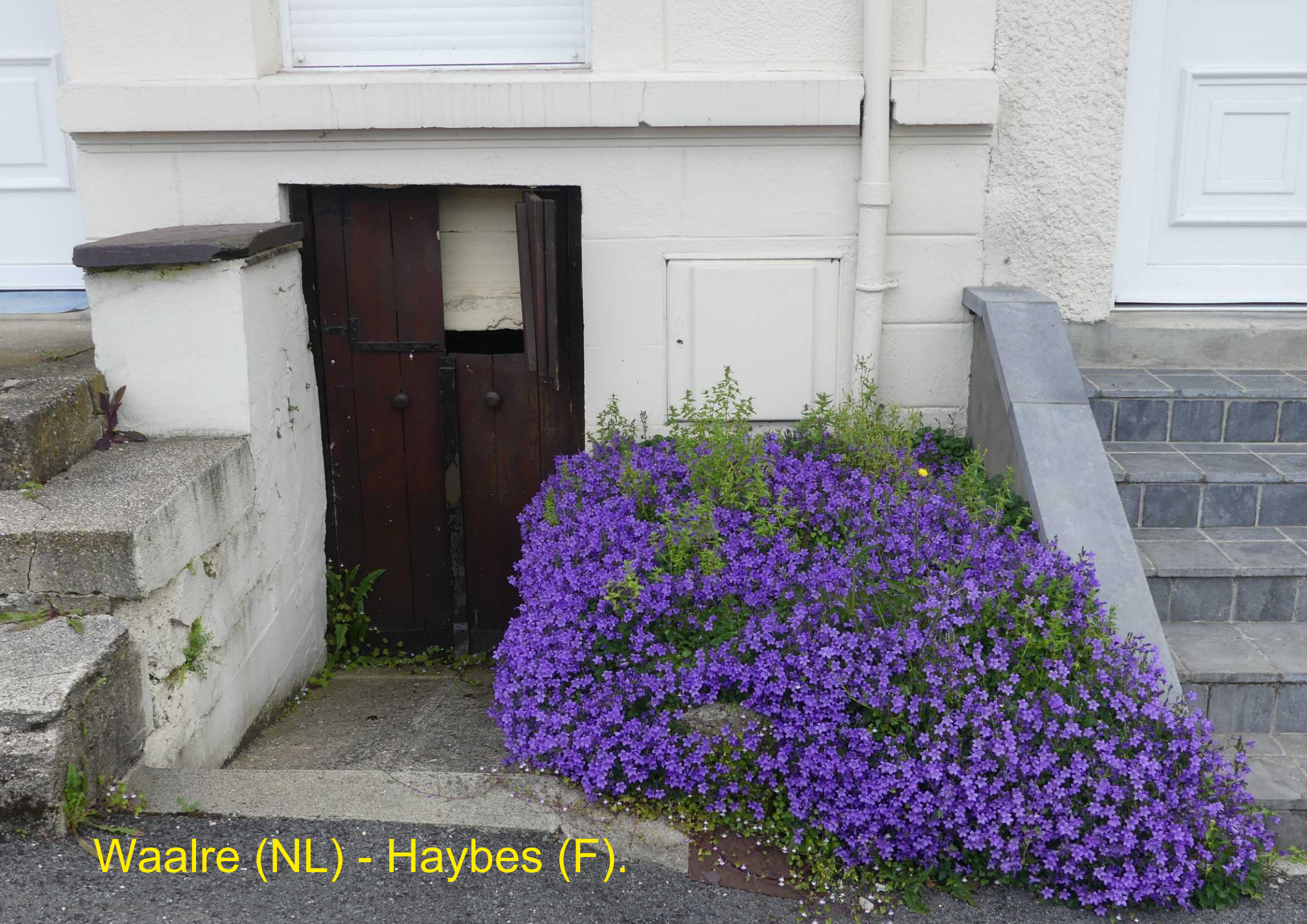
Waalre (NL) - Haybes (F).