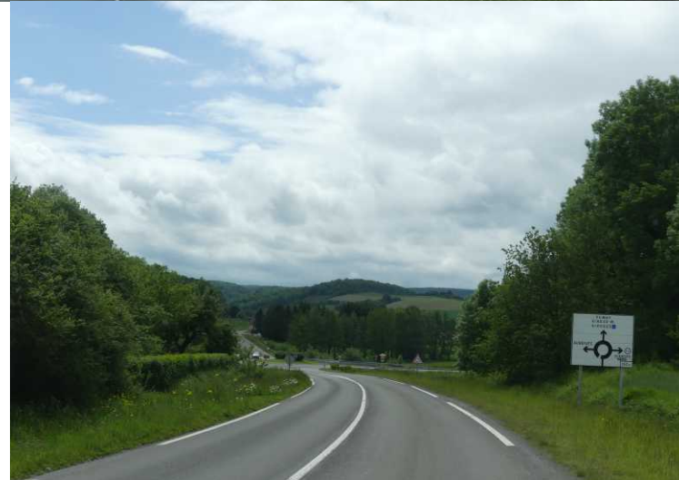
14:44 Vaucelles, Vireux-Molhain (14:49) met CP2.