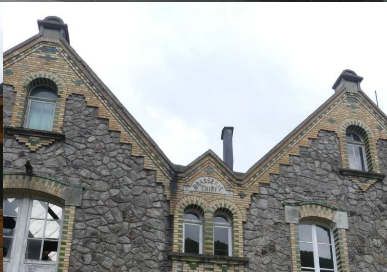
RM: Château, Vaucelles. O: Vireux-Molhain.

Om 14:59 beginnen we aan het laatste deel voor vandaag. Via de gehuchten Martigny-s-Meuse en Fépin rijden we naar CP3 in Haybes. 244 km hebben we er op zitten.