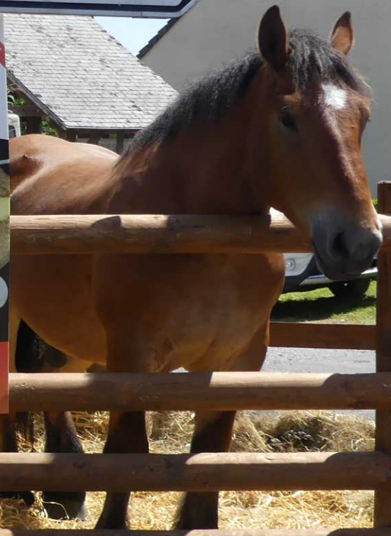
Monthermé - Vouziers.