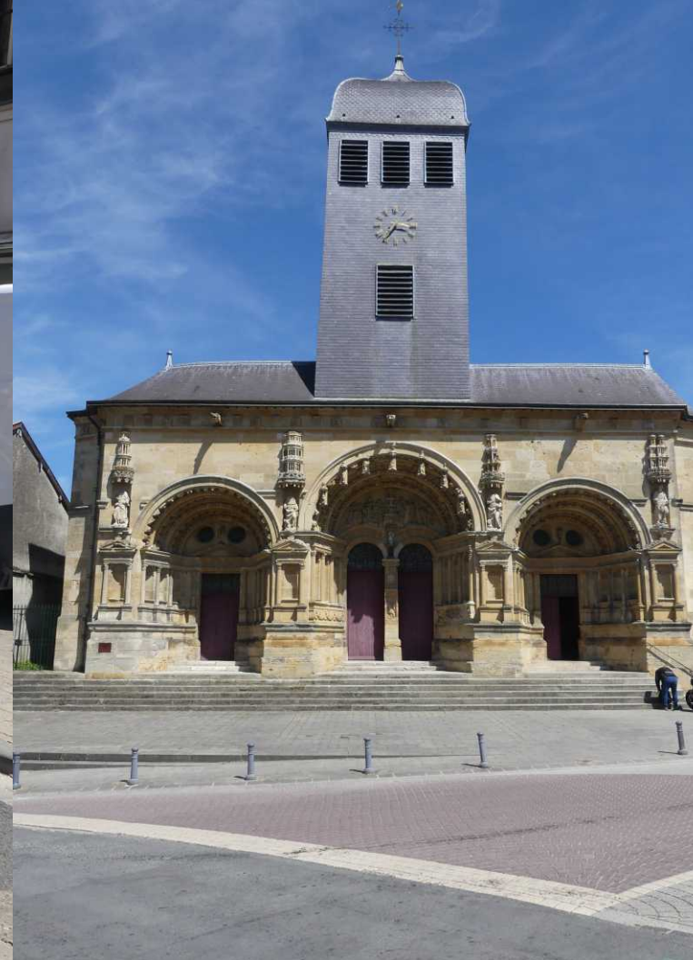
LB: Rue Chanzy. RB, MO: St. Maurille. RO: Huiszwaluw, Delichon urbica .