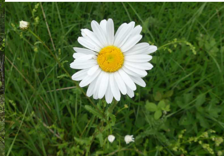
LB: Fau de Verzy, waarvan dikke tak is afgebroken. RM: Gewone margriet, Leucanthemum vulgare . RO: Cipreswolfsmelk, Euphorbia cyparissias .