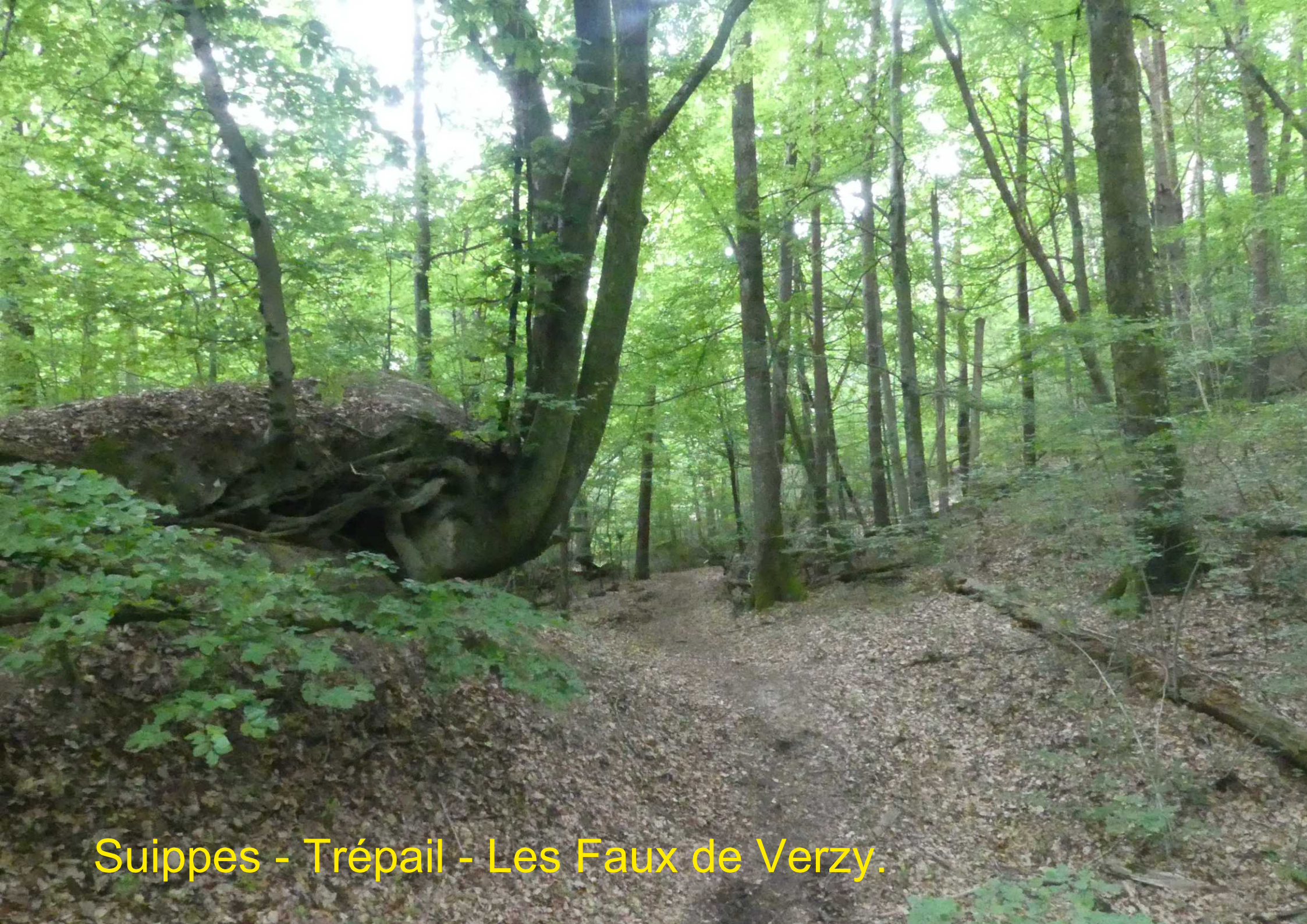
Suippes - Trépail - Les Faux de Verzy.