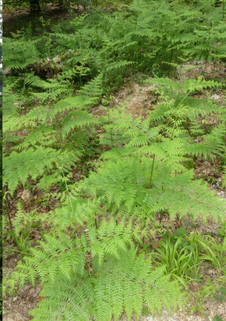
LB, RM: Forêt Domaniale de Verzy. MB: Wijfjesvaren, Athyrium Filix-femina . LO: Betonierapunzel, Phyteuma betonicofolium . RO: Scherpe boterbloem, Ranunculus acris .