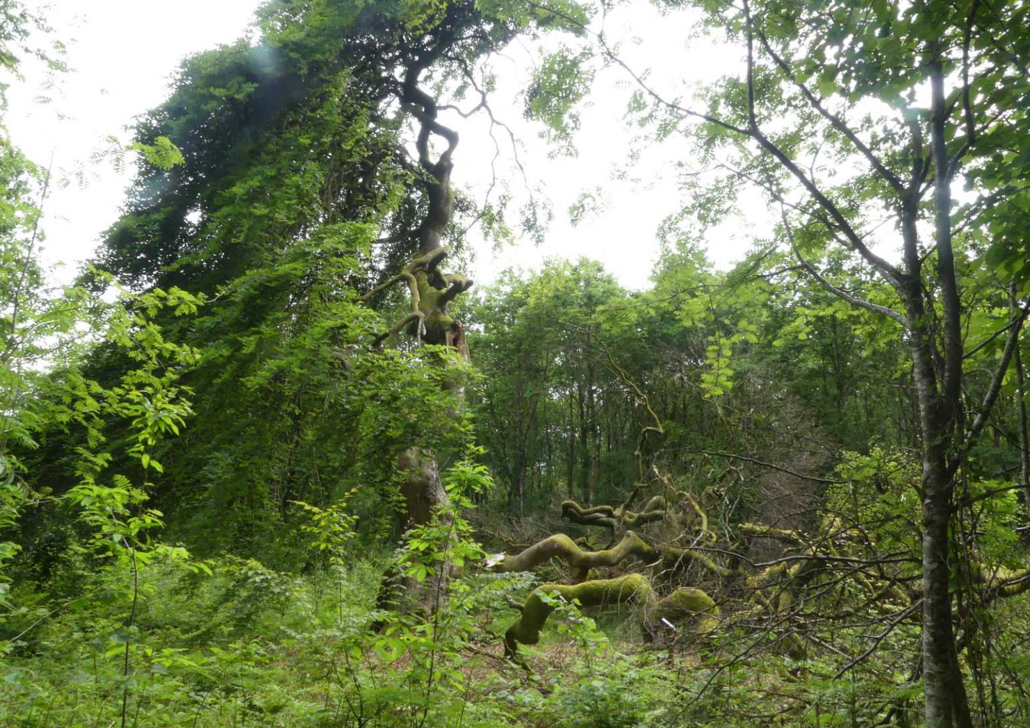
Faux de Verzy: They are not more than 4 or 5 metres (13 or 16 ft) high. In summer, they spread their leaves like heavy sun umbrellas; some looking like leaf igloos. In winter, their tortuous shape can be seen naked: trunks and branches are crooked, bent, twisted and pendulous to the ground. Wikipedia.