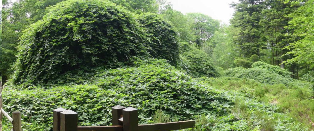
B, RM: Faux de Verzy. MO: Prachtanjer, Dianthus superbis. RO: Bont dikkopje, Carterocephalus palaemon.