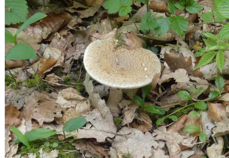
LB: Rode klaver, Trifolium pratense . RB: Parelamaniet, Amanita rubescens . LO: Forêt Domaniale de Verzy. RM, RO: Faux de Verzy.

Halverwege de route komen we bij de Faux de Verzy: Dit zijn kronkelende beuken, die met op de grond liggende takken nieuwe stammen maken. Zo bouwen ze een grote kruin, die er als een koepel uitziet.