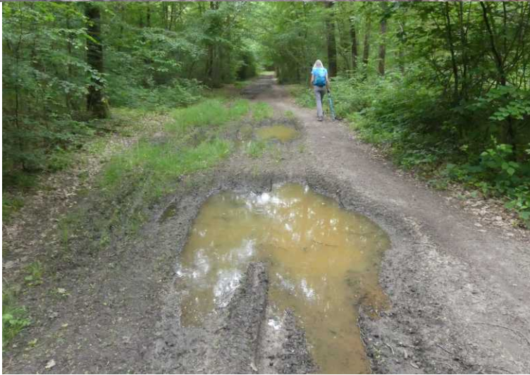
LB: versieringen aan de ingang van die grotten. RB, LO, RO: La Forêt Royale.