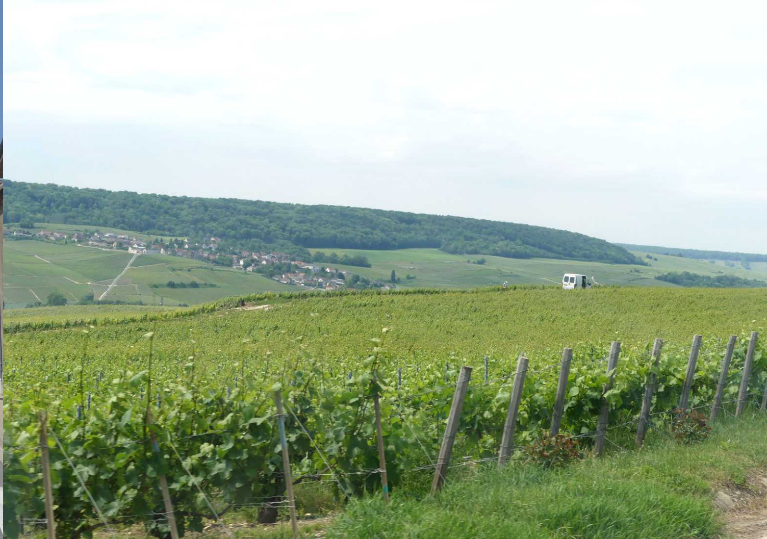
Door de wijnvelden naar Villers-s/s-Châtillion en CP17 (12:55).