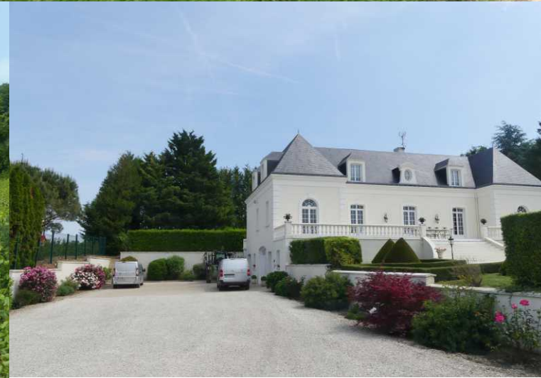
LB: Venteuil. RO: Villers-s/s-Châtillion.