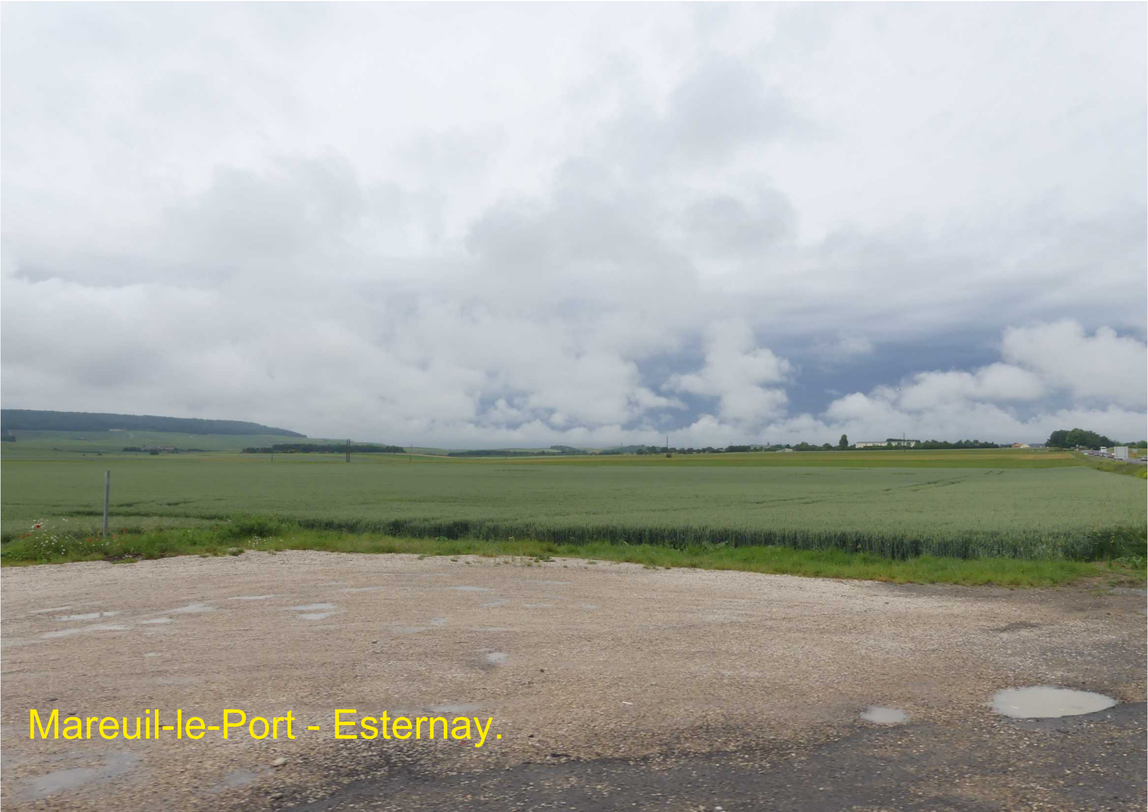
Mareuil-le-Port - Esternay.