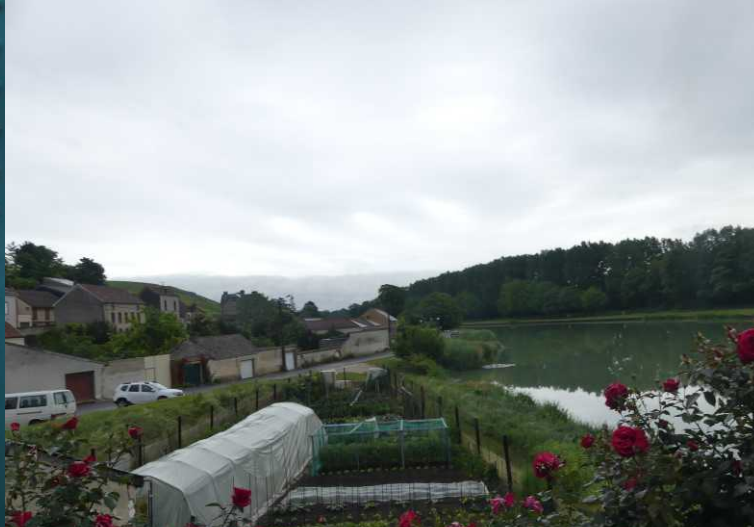
Ook Mareuil-s-Ay bezit vele wijnhuizen.