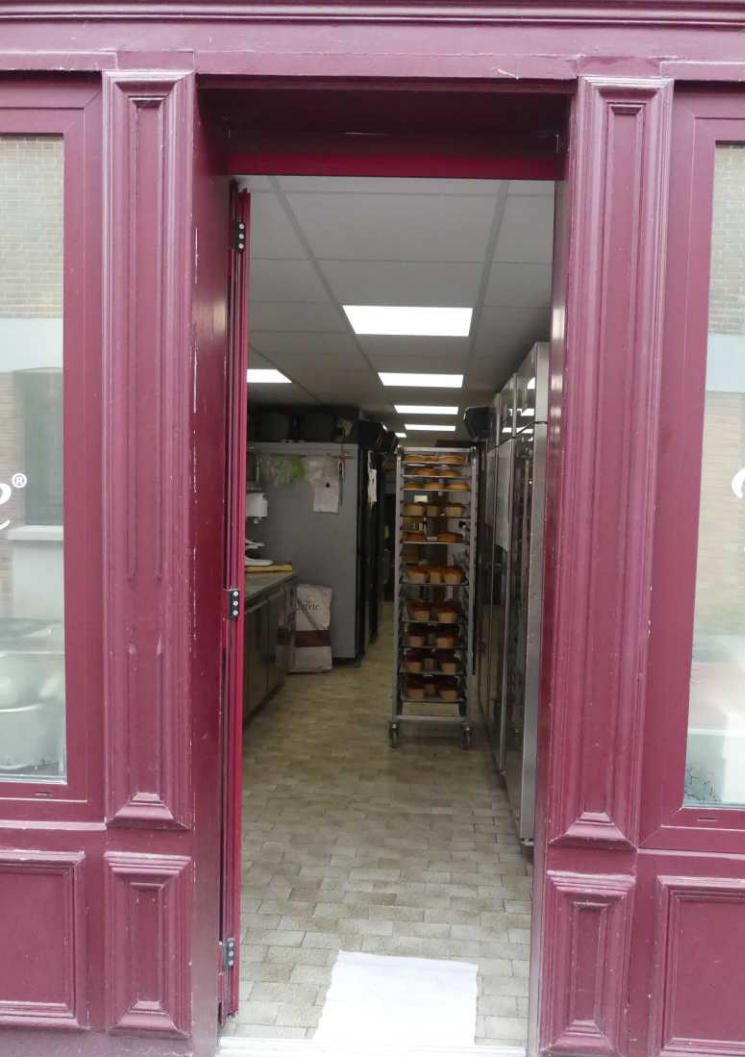
Deze pagina: Avize.