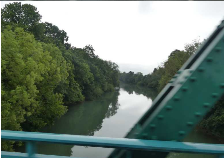
LB: Champagnehuis, V. Testulat, Epernay. MB: CP19. RB: St. Pierre-St. Paul. RO: De Marne bij Mareuil-s-Ay.

In Epernay zien we eerst een serviceplaats en later CP19 achter de St. Pierre-St. Paul (10:04), een overnachtingsplaats dus. Tot 11:05 halen we bij de LIDL boodschappen. De regen lijkt dan (even?) over te zijn. Mareuil-s-Ay passeren we voor de 1e keer om 11:22.