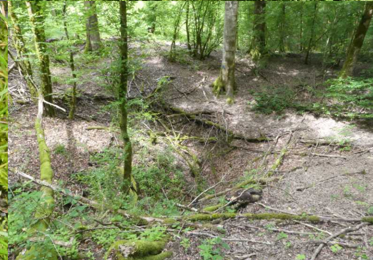
MO: Gewone weglak, Arion rufus . RO: Gouffre.