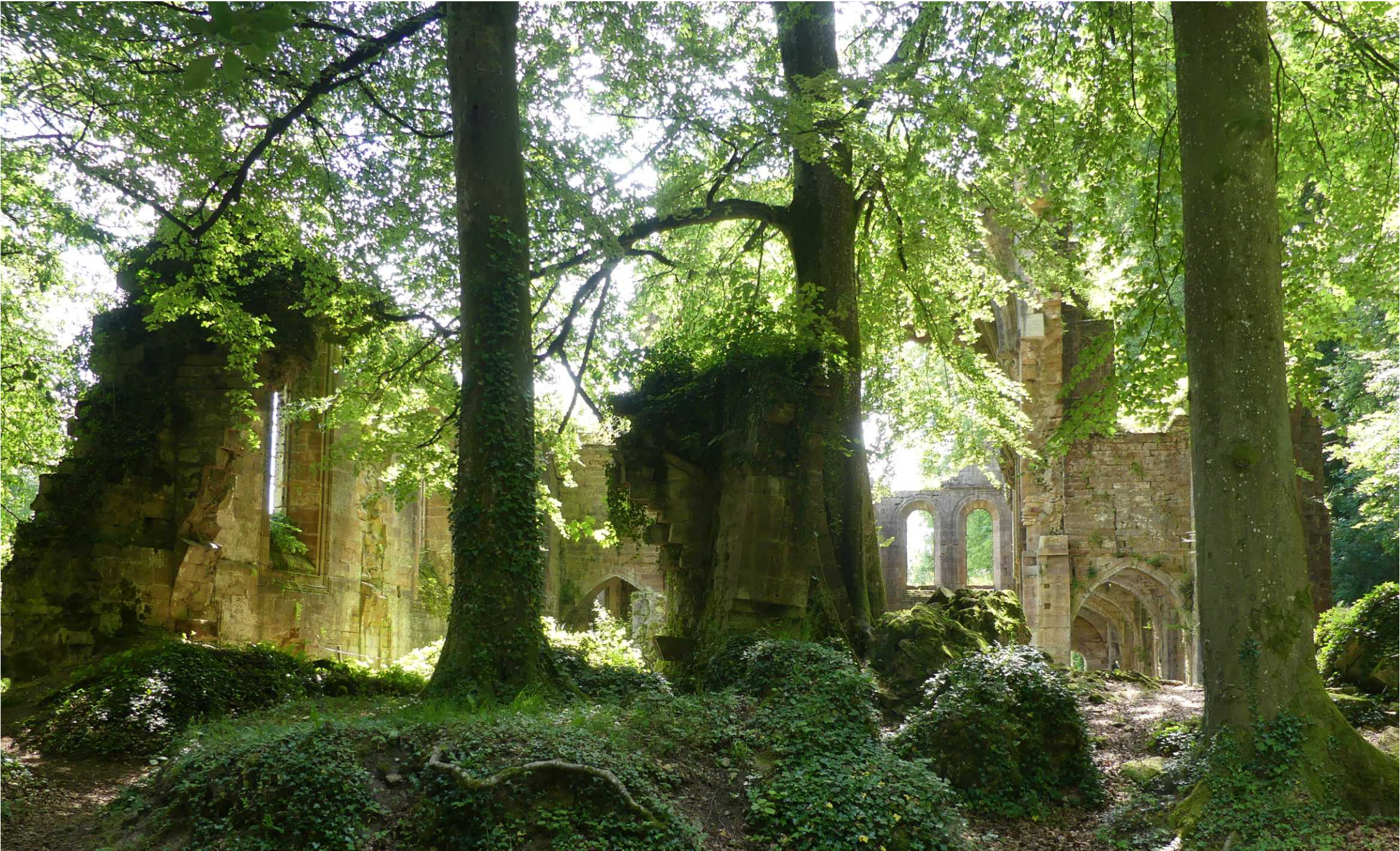
Trois Fontaines de l'Abbaye - Lac du Der.