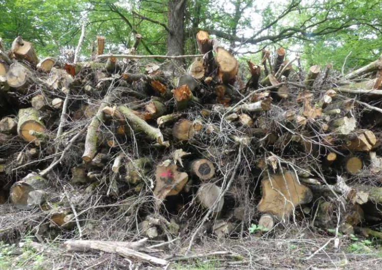
LB: Wallen van resthout? R, LM, MM: Fontaine au Hêtre. MO: Aven de la Taille Clergé.