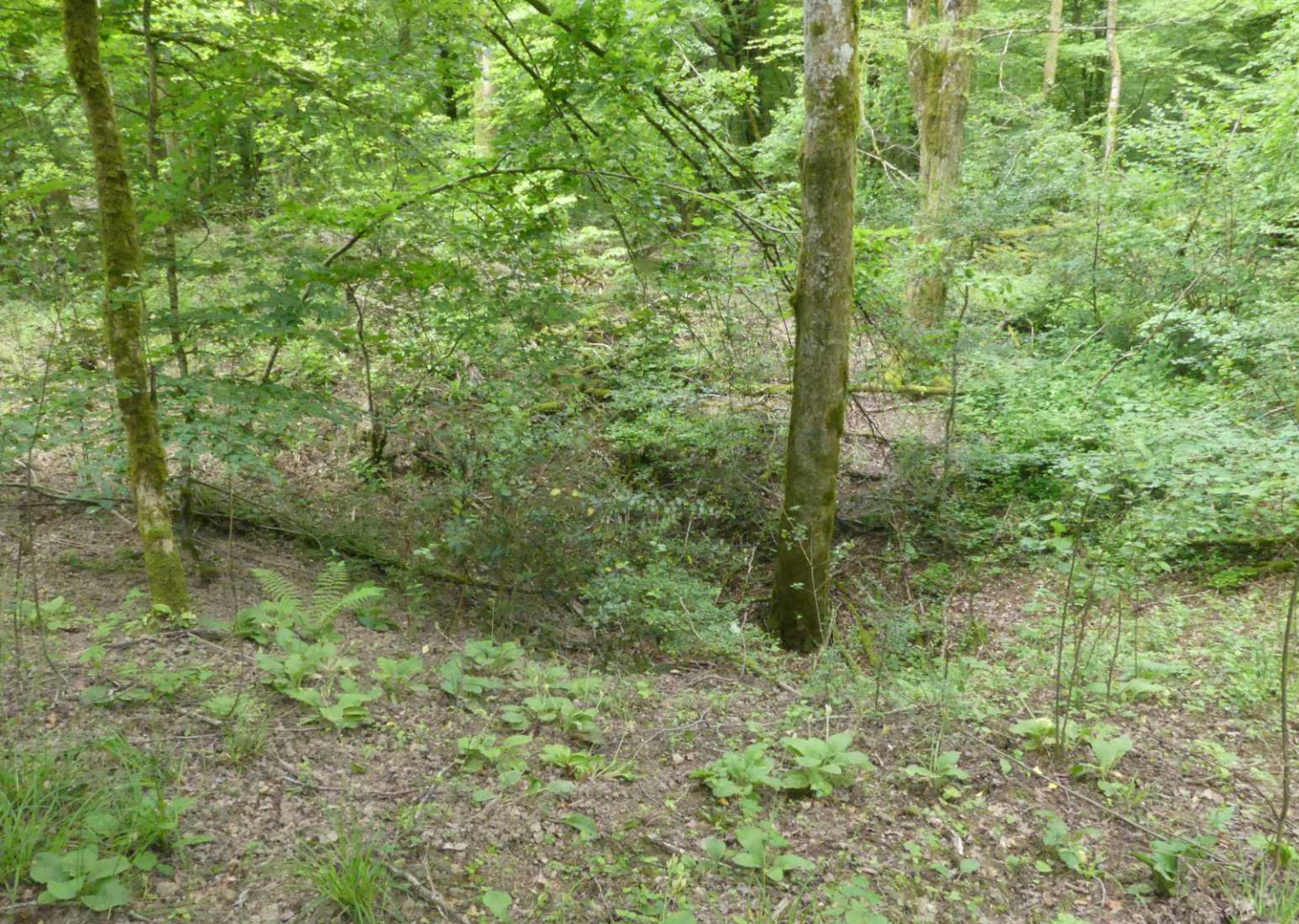
LB, LO, MO: Gouffres (dolines op zijn Nederlands). RO: Prachtanjer, Dianthus superbus .