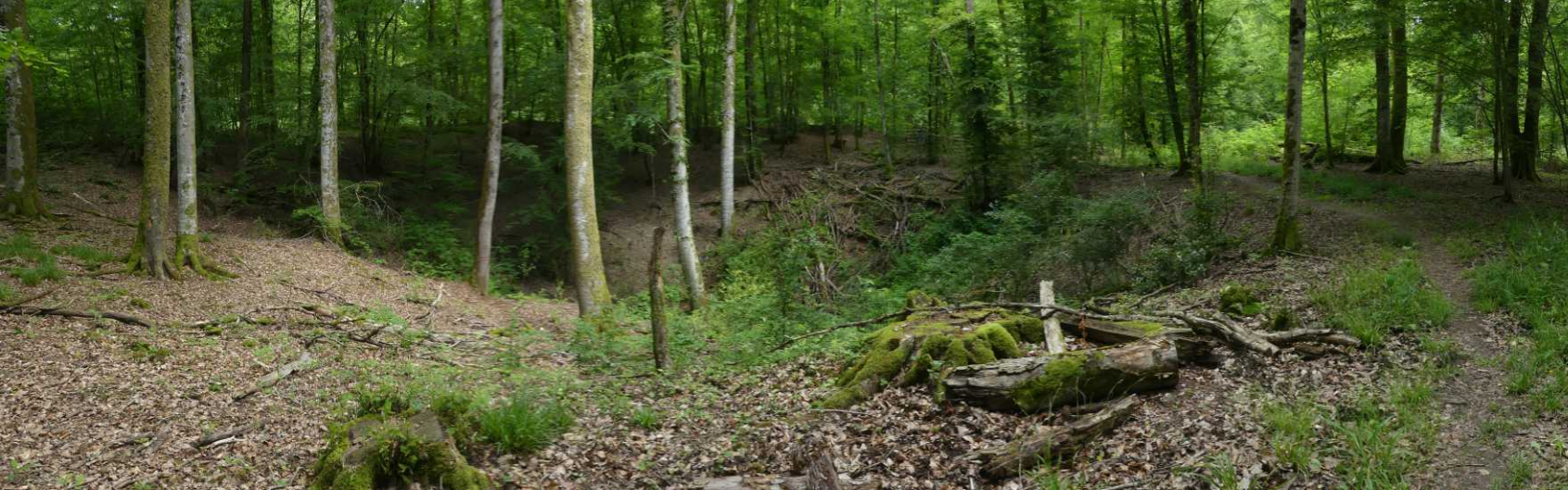
LB: Gouffre de la Béva. LM: Bosandoorn, Stachys sylvatica . RO: Mannetjes ereprijs, Veronica officinalis .