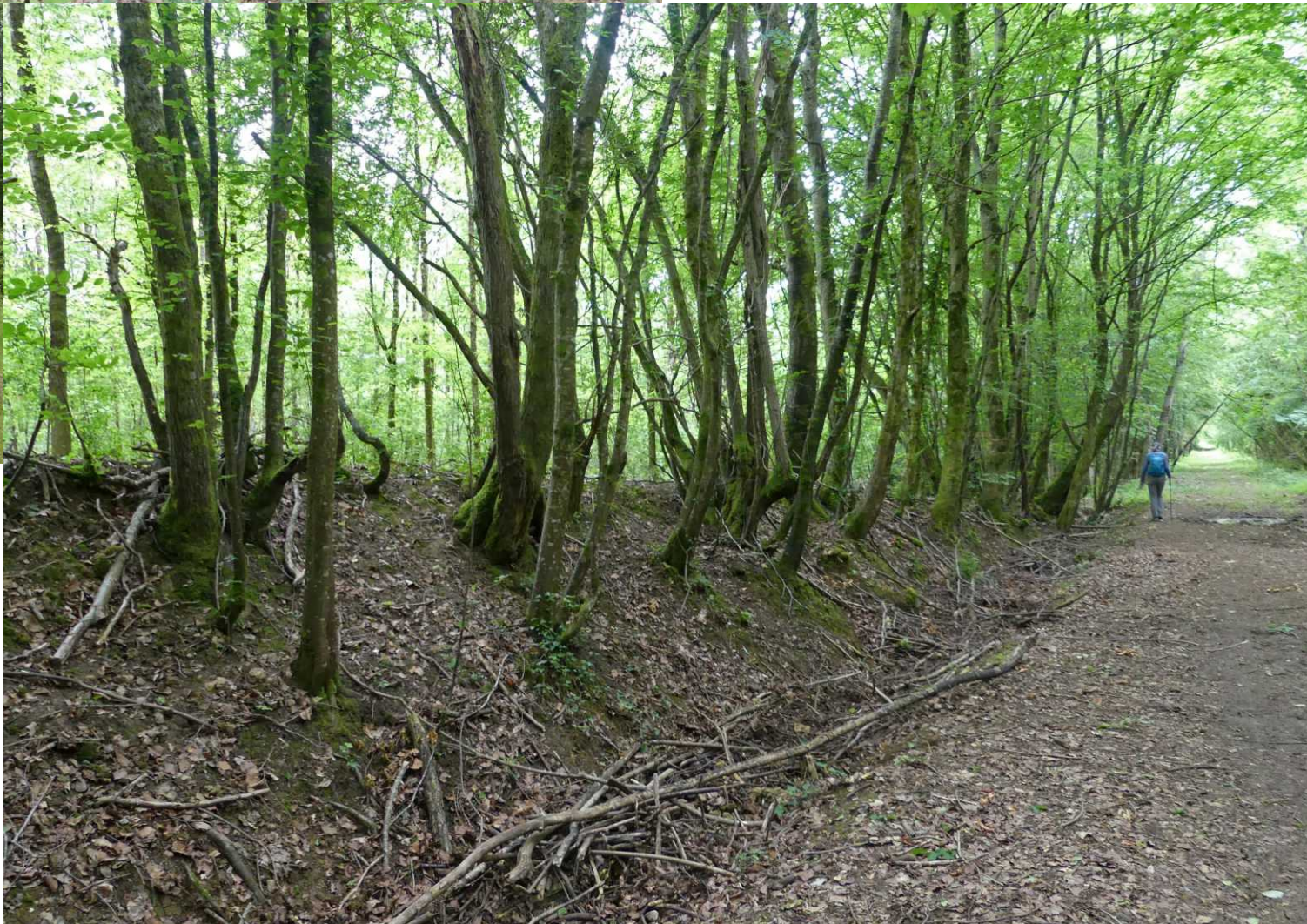
LB: Aven de la Taille Clergé. MB: Gouffre de la Taille Clergé. RB: Gouffre.