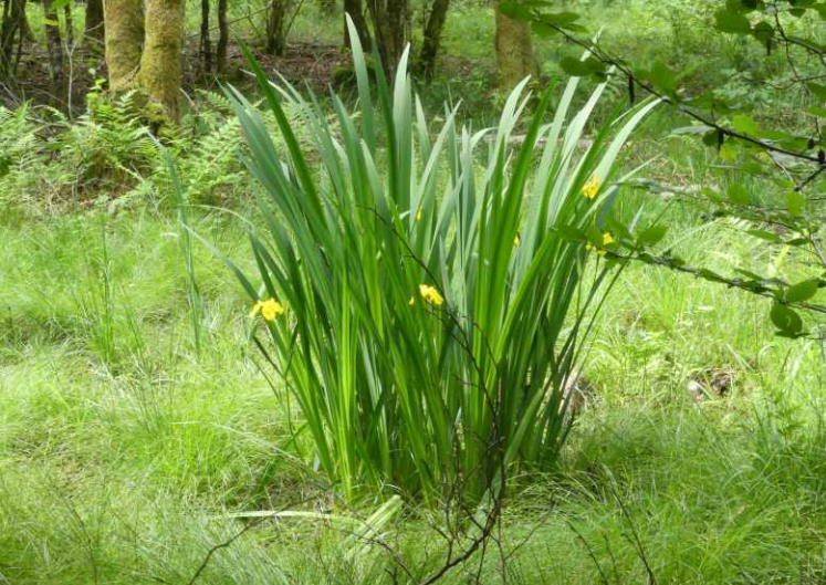
LB: Gele lis, Iris pseudacorus . RB: Blubberige paden. LM, LO: La Bruxenelle. RO: Source de la Bruxenelle.