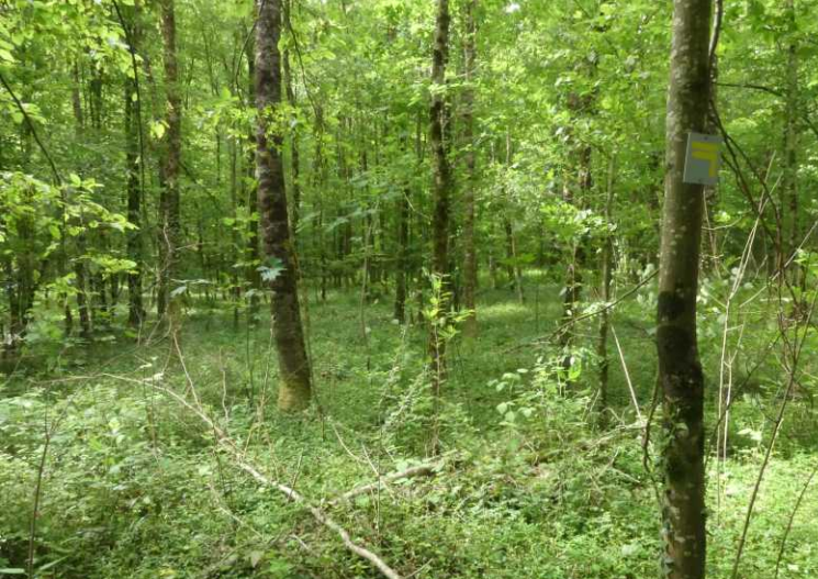
Deze pagina: La Forêt Domaniale de Trois Fontaines. RM: Een gekraakte brandkast. RO: ZO-punt van de route.