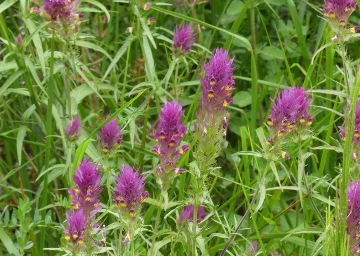
LB: Wilde weit, Melampyrum arvense . LO: Ruige weegbree, Plantago media . MO: Korenbloem, Centaurea cyanus . RO: Bleke klaproos, Papaver dubium .