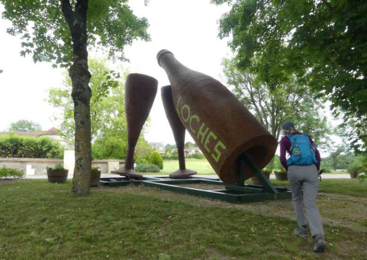
Langs met bloemen omrande velden gaat het naar Loches-s-Ource, een terechte Ville Fleurie. Knus dus.