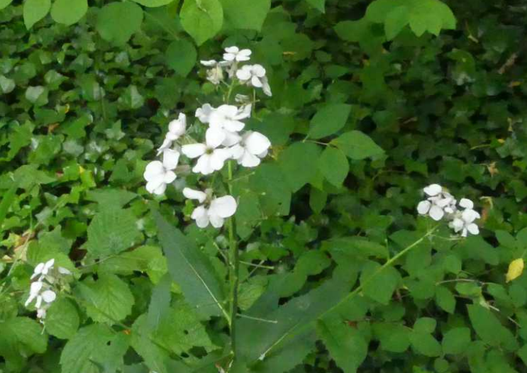
LB: Look zonder look, Alliaria petiolata . MM: Bijenblad, Melittis melissophyllum . RM: Bonte wikke, Vicia villosa . LO: Paardenhoeftklaver - Hippocrepis comosa . MO: Blaassilene, Silene vulgaris . RO: Hondskruid, Anacamptis pyramidalis .