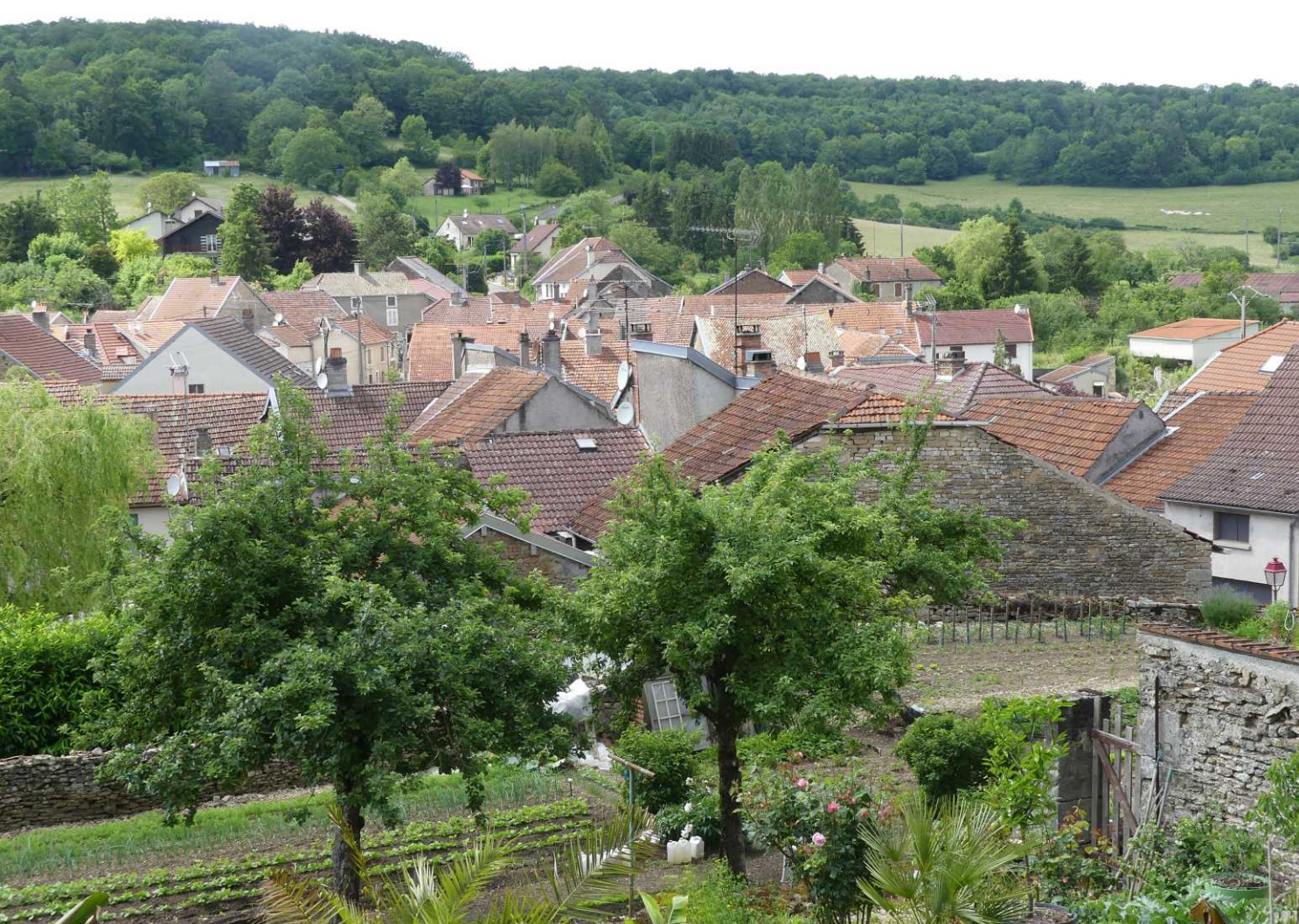
LB, RO: Andelot. RM, LO: De Rognon.