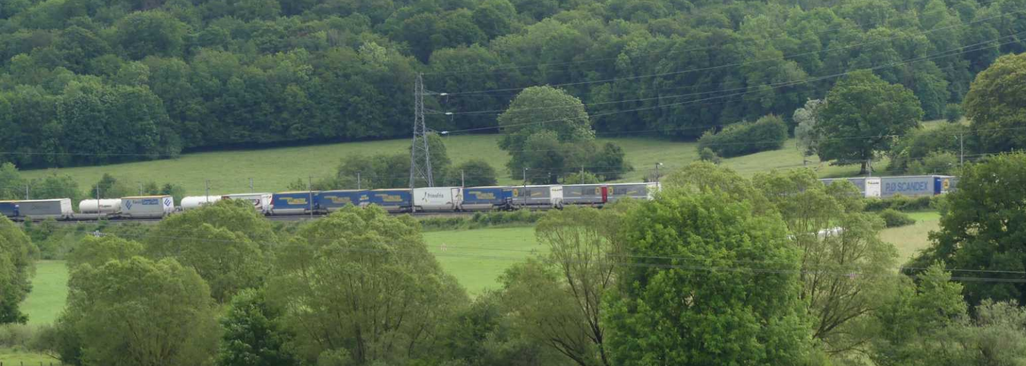
LB: Het vrachtverkeer over het spoor is zeer frequent. LB: Het Maasdal. RB: Gewone melkdistel, Sonchus oleraceus .