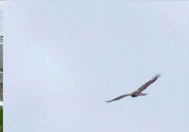
LB: Wilg. R: Buizerd, Buteo buteo. MO: Spoorwegovergang bij Goncourt.