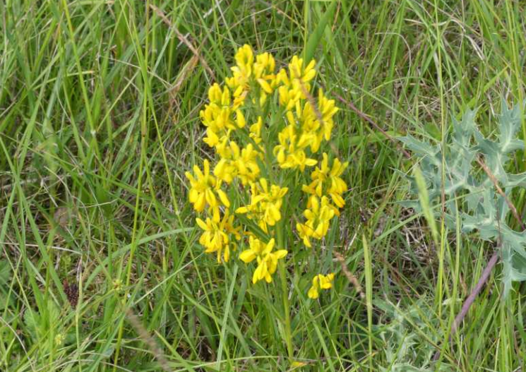
LB: Verfbrem, Genista tinctoria . RB: Hondskruid, Anacamptis pyramidalis . LM: Karthuiser anjer, Dianthus carthusianorum . MO: Bos ten westen van het plateau. RO: Dambordje, Melanargia galathea .