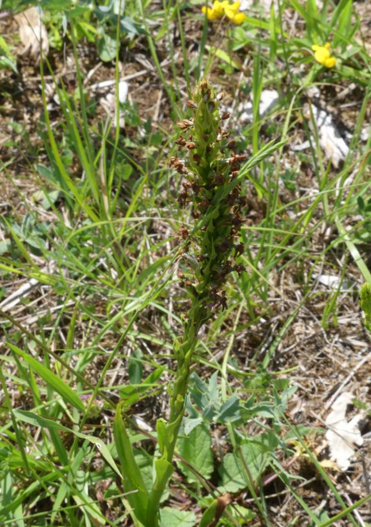
LB, RB: Grote muggenorchis, Gymnadenia conopsea . LO, MO: Door het bos terug. RO: Hondсроos, Rosa canina .