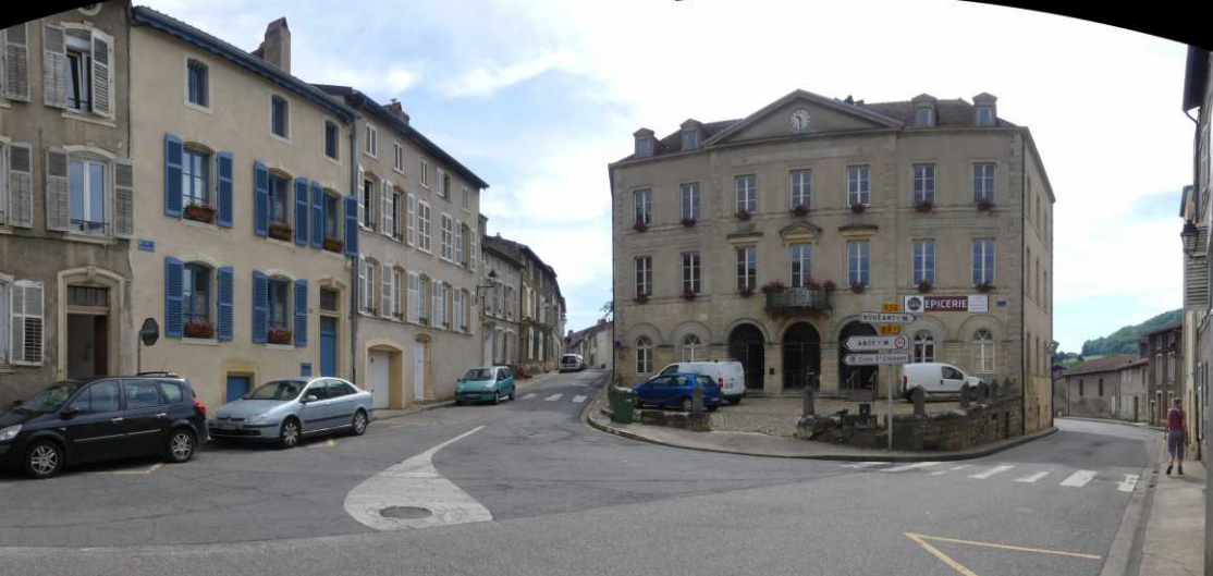
LB: Rue Raymond Mondon en Rue de Novéant. RB, LM: Rue de Novéant. LO: Lavoir.