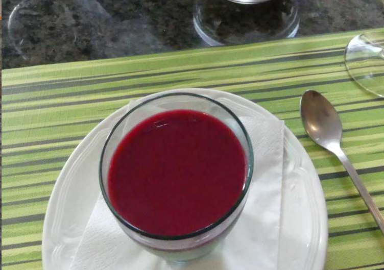
De pizza's in de Grand Ballon zijn heerlijk, de eigenaar komt af en toe even buurten en hij heeft een heerlijk toetje voor ons: Een zelfgemaakte pannacota met frambozensaus. Heerlijk.