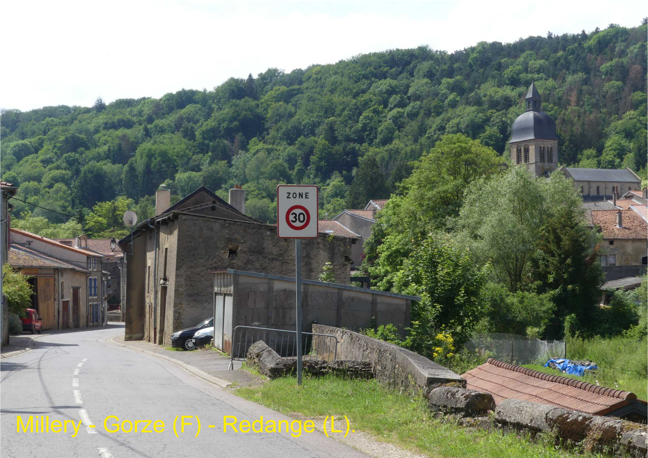
Millery - Gorze (F) - Redange (L).