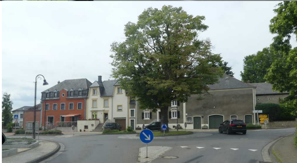
LB: Hobscheid. RM: Schweich. MO: Niederpallen.