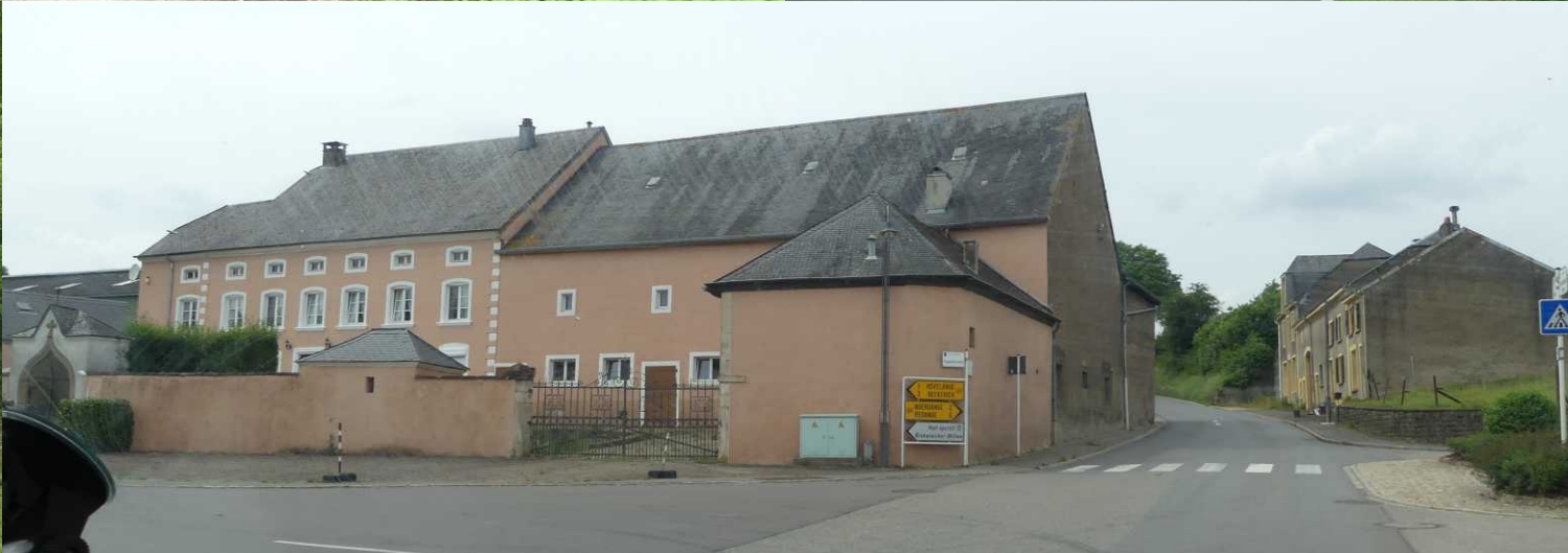
Hobscheid (15:52). Schweich (15:58) en Noerdange (16:02). We zien een begrafenis in Niederpallen (16:04).