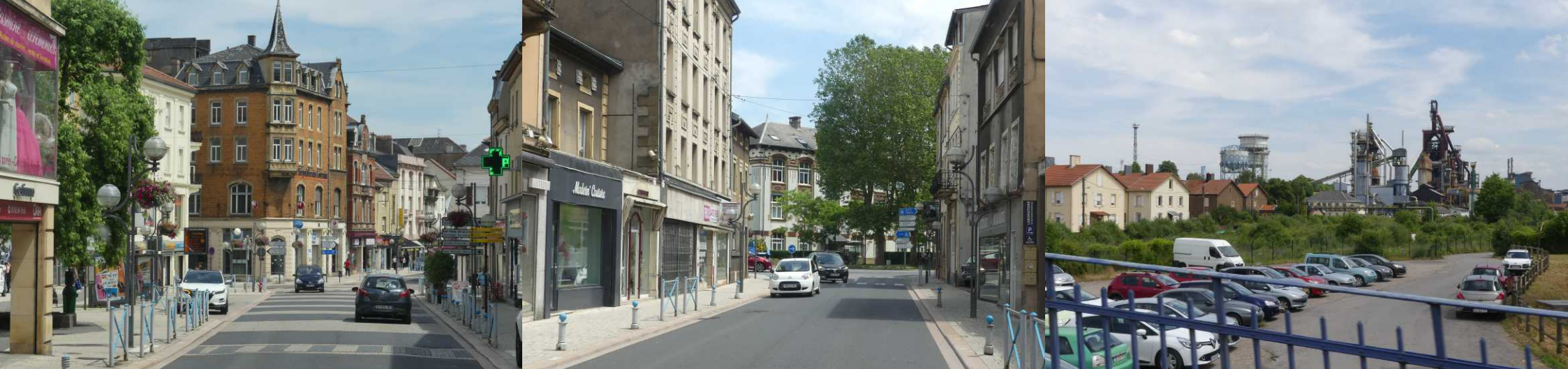
Bij Volmerange-les-Mines (14:26) gaan we Luxemburg in.