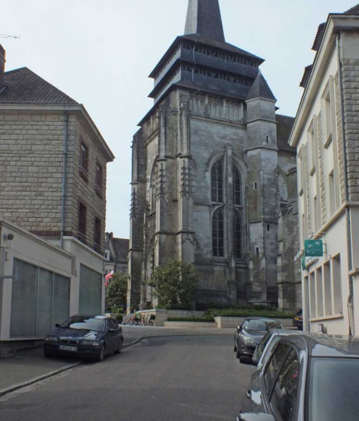
LB, RB: Notre-Dame. LO: Place Notre Dame.

We lopen de Place Notre Dame over en bekijken de kerk. Een infobord vertelt, dat die kerk zwaar te lijden had in de WOII. Het herstel van het gebouw heeft 50 jaar geduurd. En de torenspits is pas in 1978 terug gezet. Die ziet er ook apart uit, die "past" er niet bij. Om vijf uur zoeken we de camper weer op.