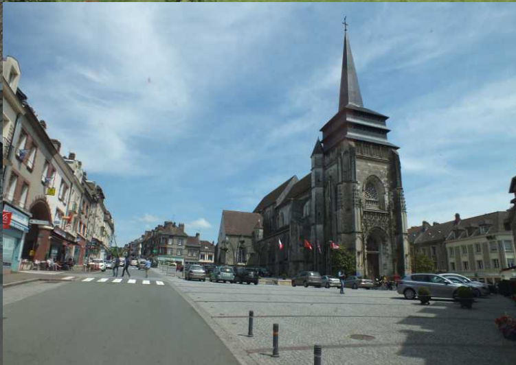
LB: Nempont-St.Firmin. LM: Normandie. LO, MO: Neufchâtel-en-Bray.