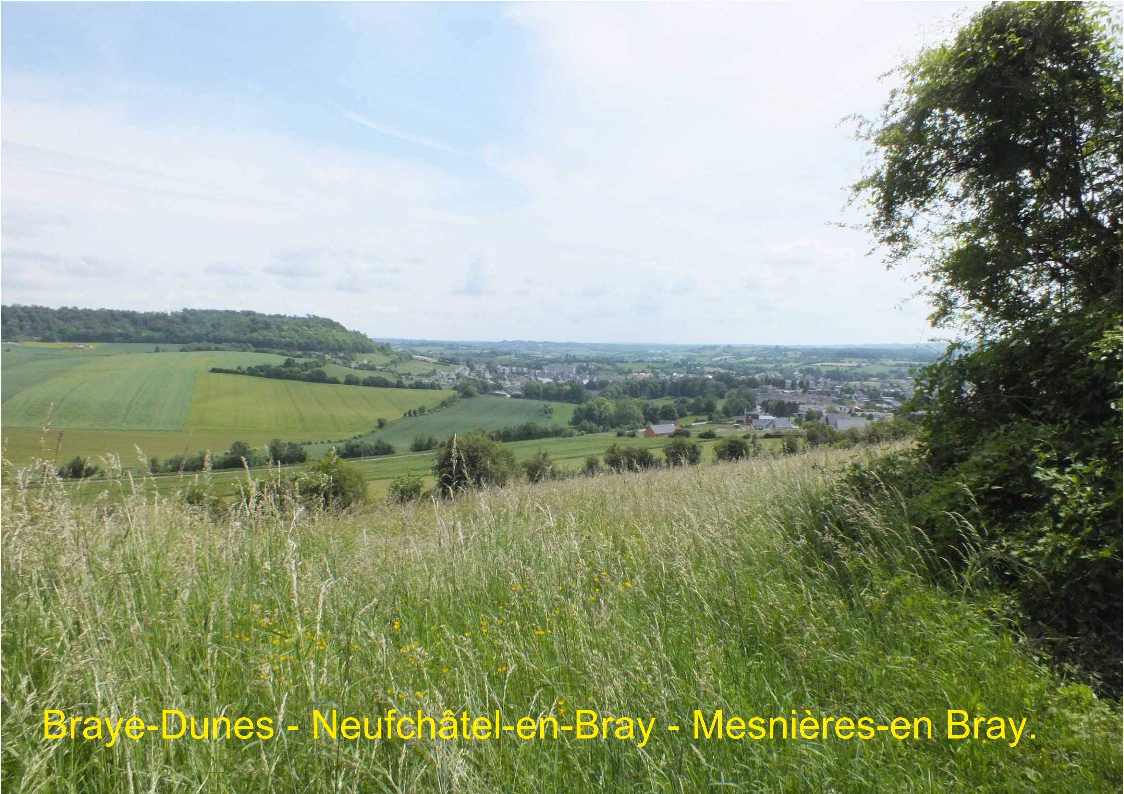
Braye-Dunes - Neufchâtel-en-Bray - Mesnières-en Bray.