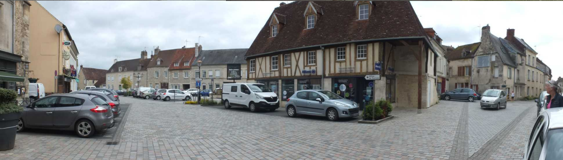
LB: Notre-Dame. MB: Notre-Dame, Rue François le Dortz. LO: Place du Général Warabiot.