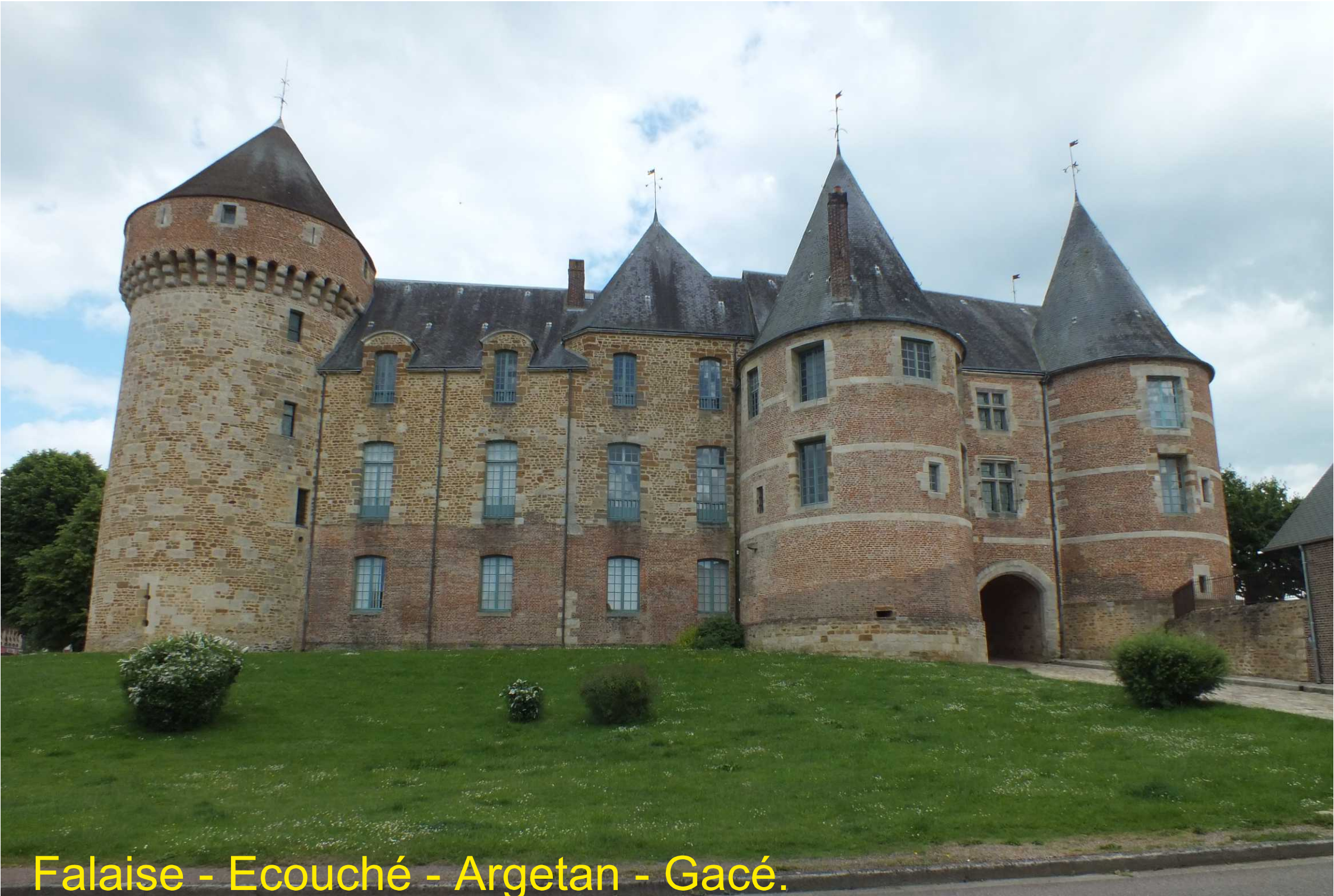
Falaise - Ecouché - Argetan - Gacé.