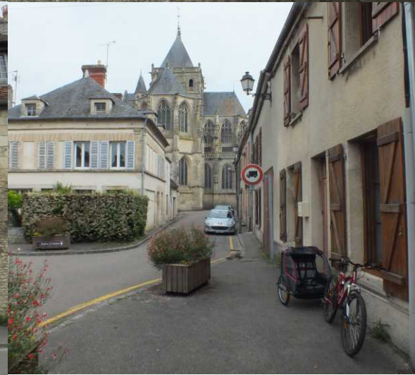
B: Notre-Dame. RO: Rue Notre-Dame.