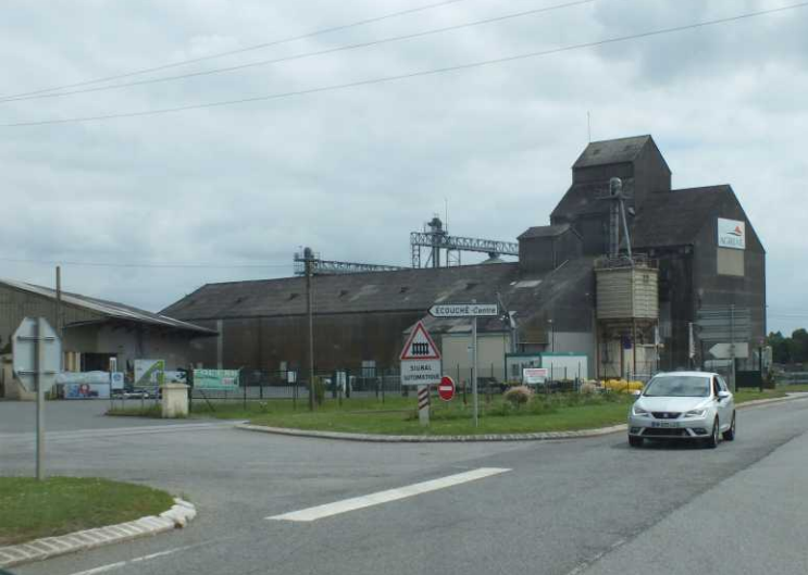
LB: Silo, Écouché. RB, LM, MM, LO: Argentan. LO, MO: Camperplaats bij Maison de la Dentelle.

12:11 rijden we verder naar Argentan voor CP28, die naast een groot herenhuis Maison de la Dentelle ligt. Daar kan men de historie van het kantslossen in deze streek bekijken.