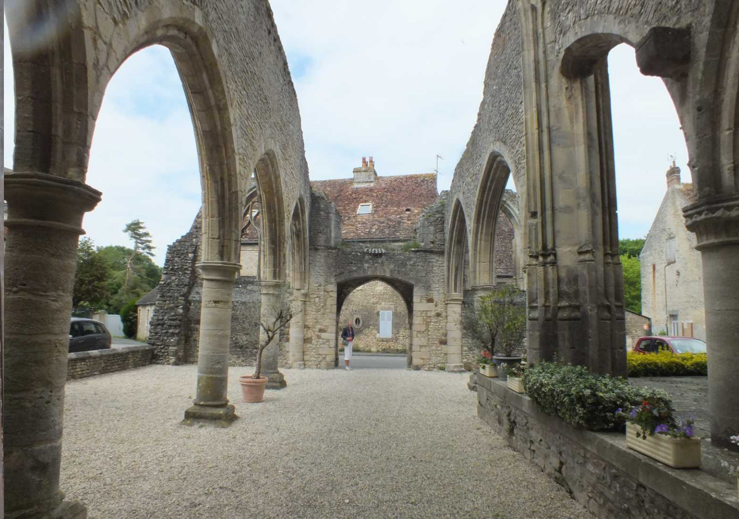
Een groot deel van de Notre Dame is een ruïne van enkele bogen en 2poorten, maar ook dit deel ziet er net verzorgd uit.