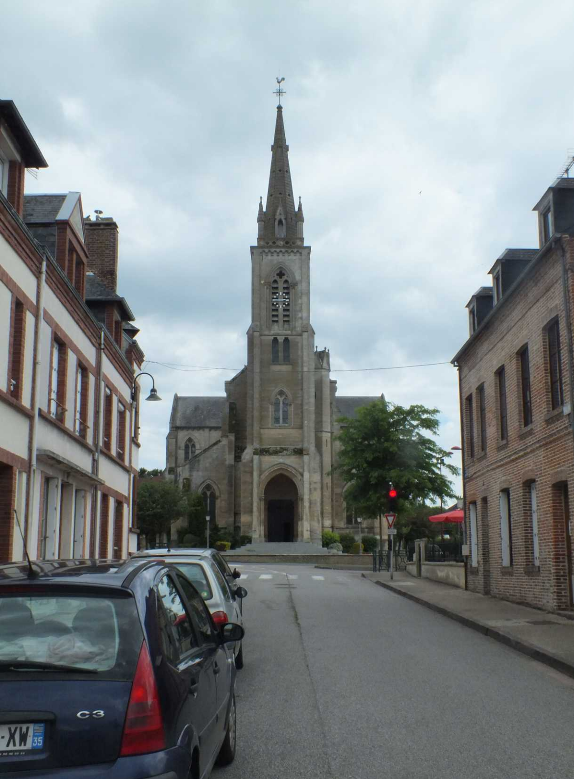
L: Rue de l'Église. RB, RM: Grande Rue D722C. RO: Place du Château.