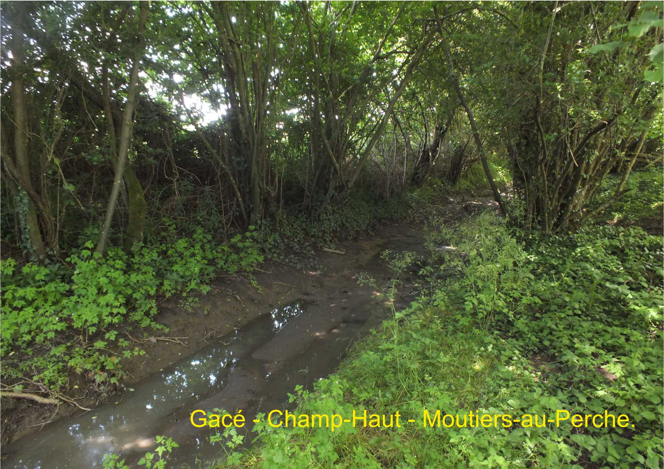
Gacé - Champ-Haut - Moutiers-au-Perche.