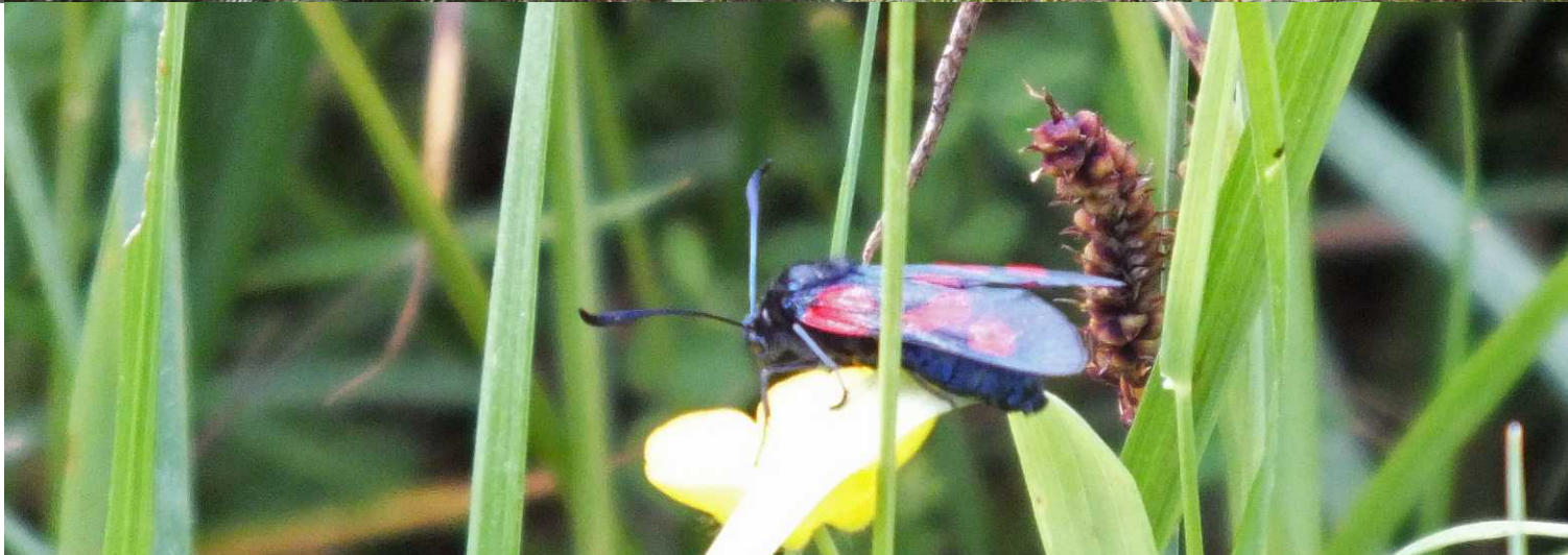
LB: kale jonker, Cirsium palustre . RO: Vijfvlek-sint-jansvlinder, Zygaena trifolii .