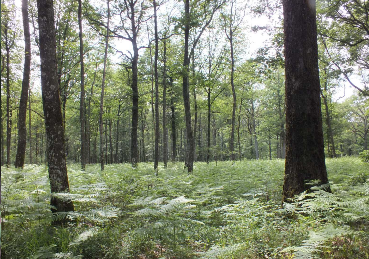
Het gaat door een open bos met veel varens.