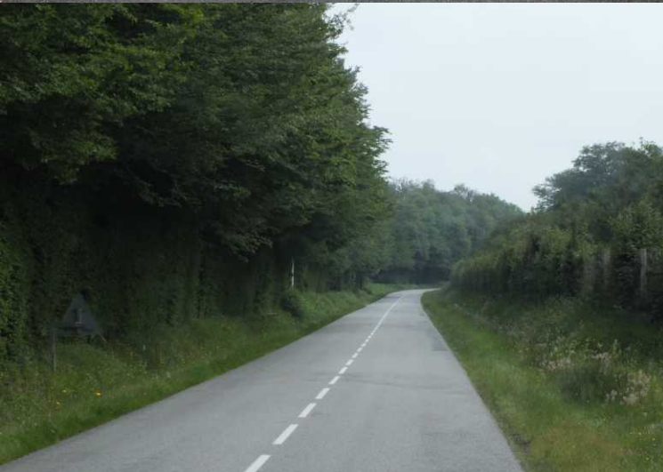
LB: Camperplaats bij Longny-au-Perche. R, LO: Camping les Abrias du Perche.