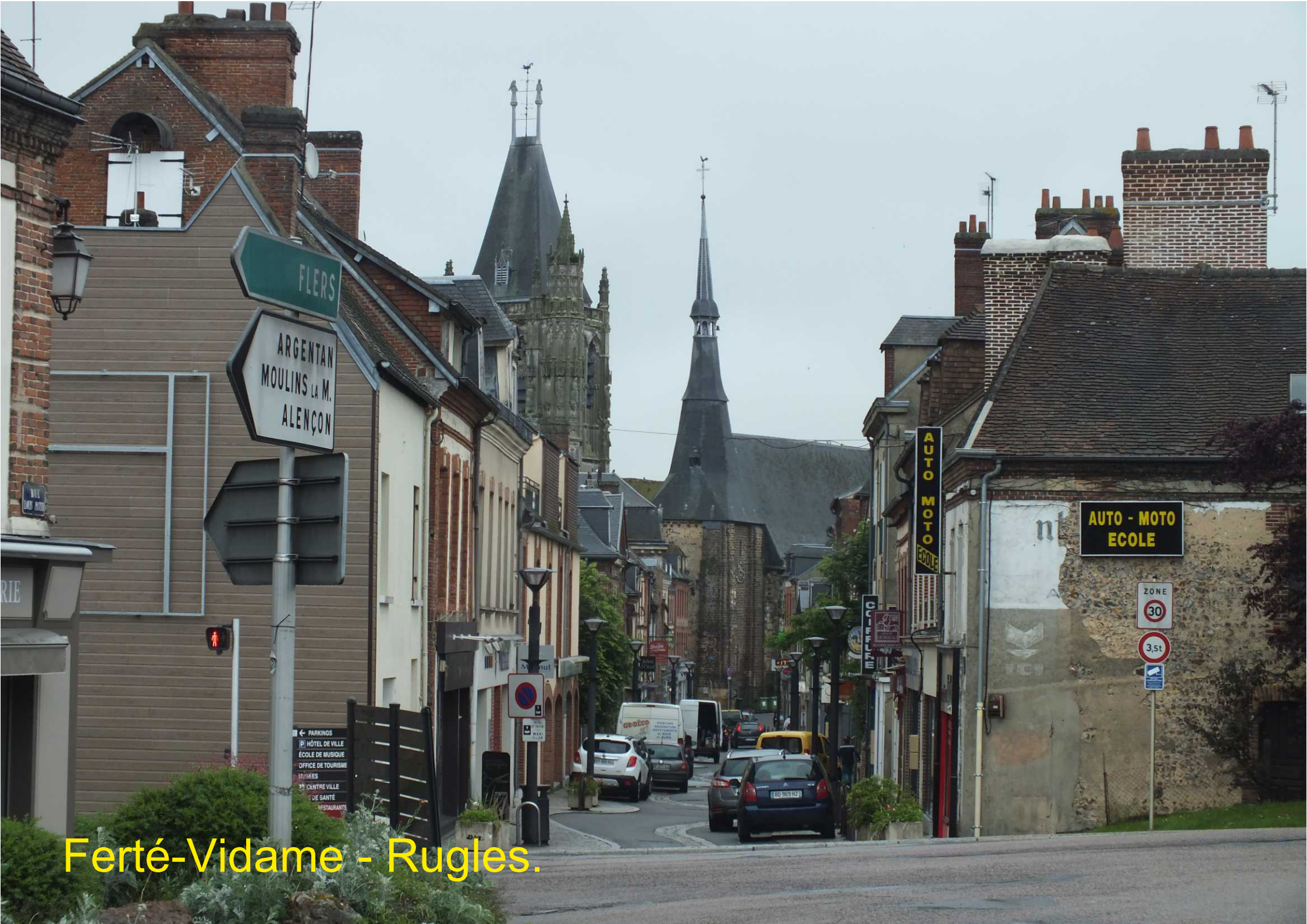
Ferté-Vidame - Rugles.