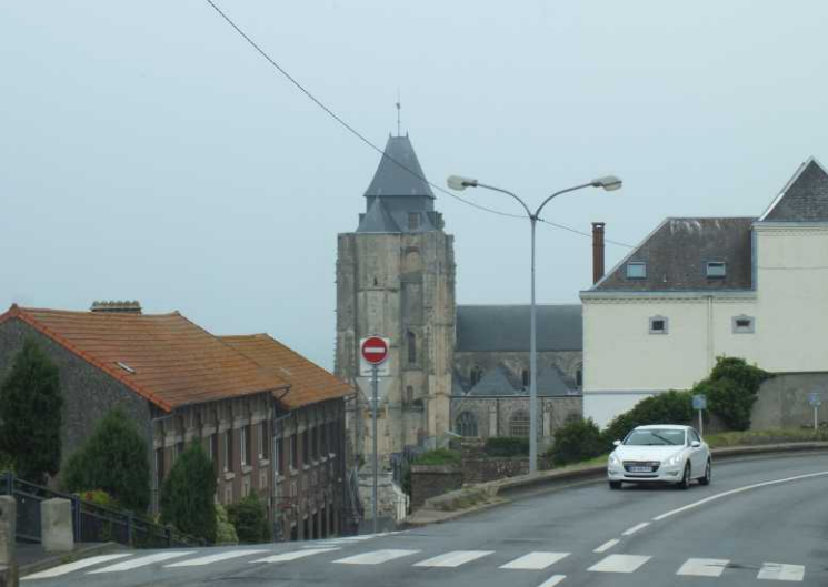
LB: St. Jacques, Route de Dieppe. RB: Chapelle St. Laurent boven Eu. O: Cayeux-sur-Mer.

Om 14:20 na de lunch op weg (na 1353 km). Om Tréport heen rijden we naar de LIDL in Eu voor boodschappen. Boven Eu op een heuvel zien we een kapel. We kijken even bij een weggetje na Ault dat naar de Marais du Hable zou gaan, maar vinden daar geen voortzetting en geen natuurgebied (14:07). 15:22: Cayeux-s-Mer.