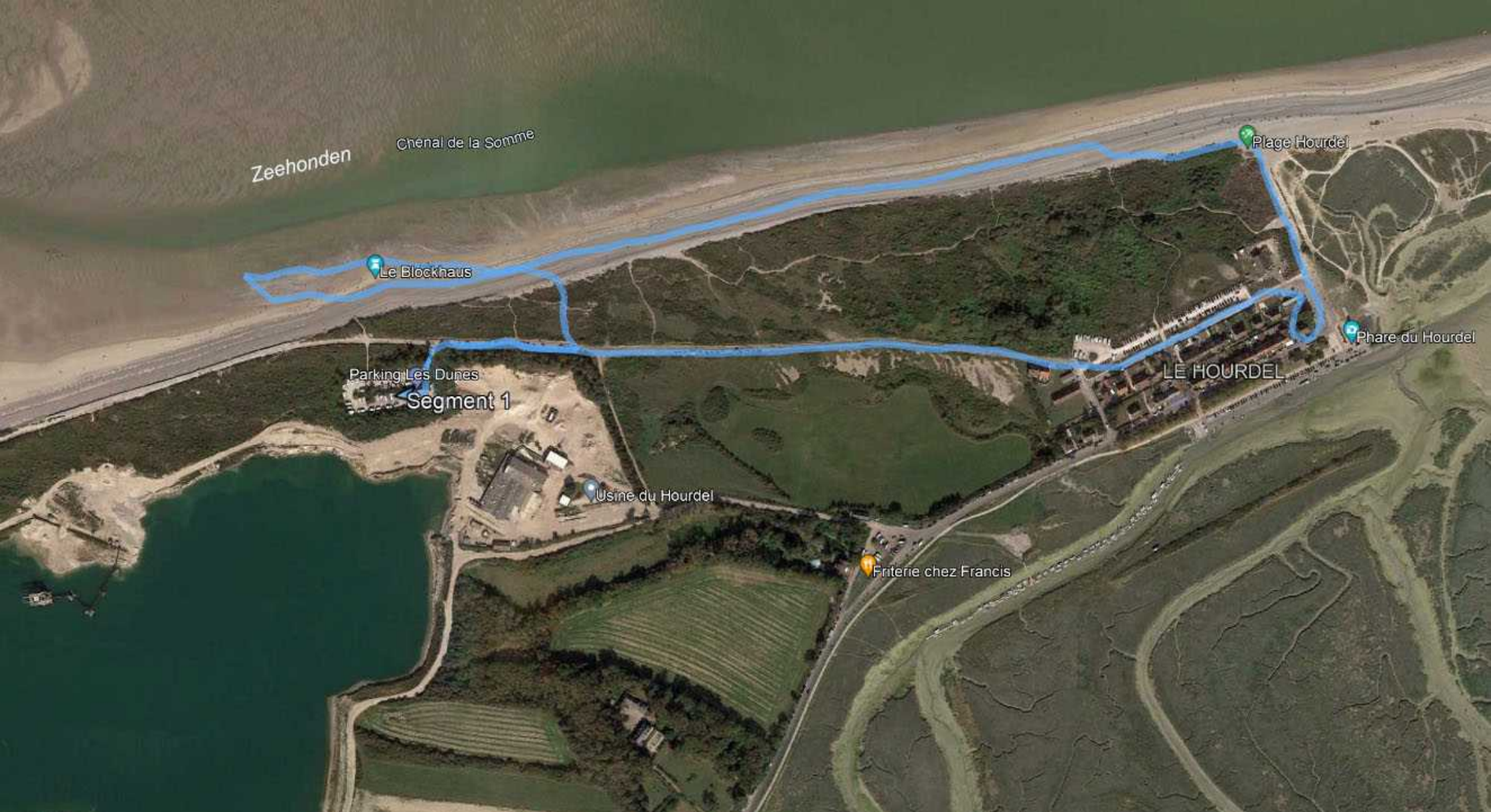
Wandeling van 3 km langs het strand van de uitloop van de Somme in zee. Via het dorpje Le Hourdel weer terug.