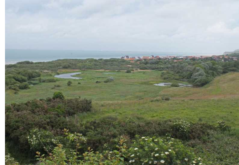
RB, M, O: Zicht vanaf de Motte du Bourg.