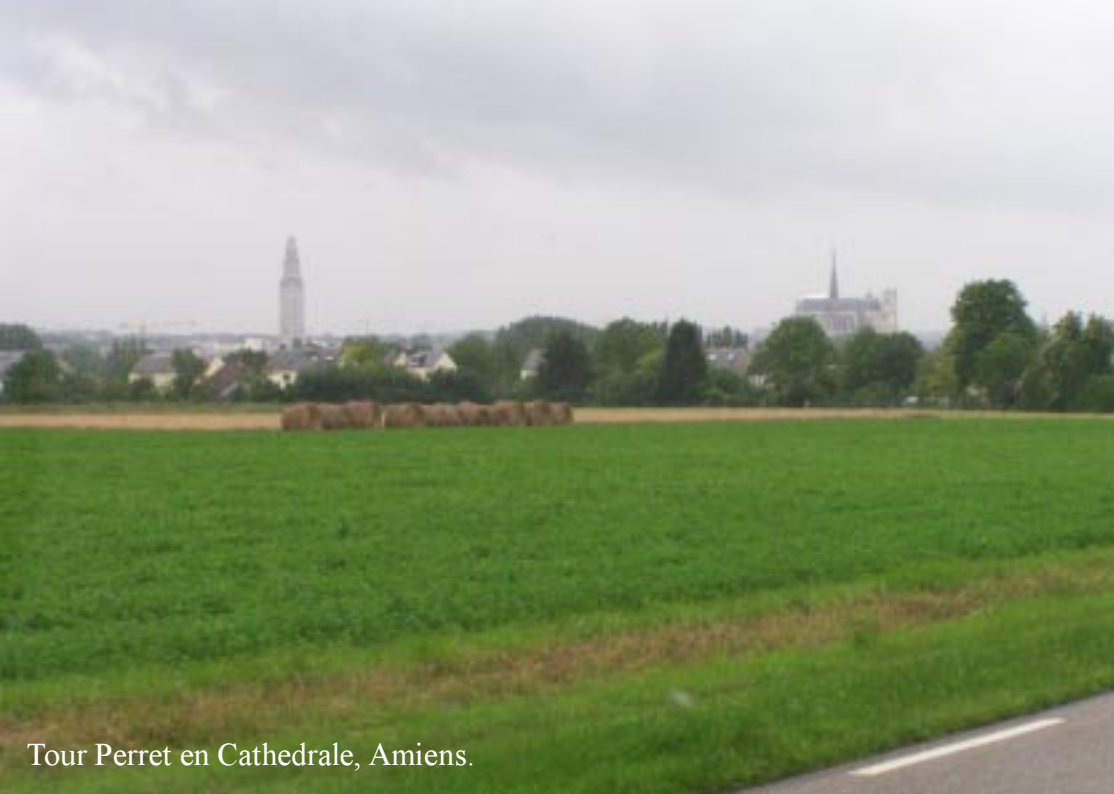
Tour Perret en Cathedrale, Amiens.