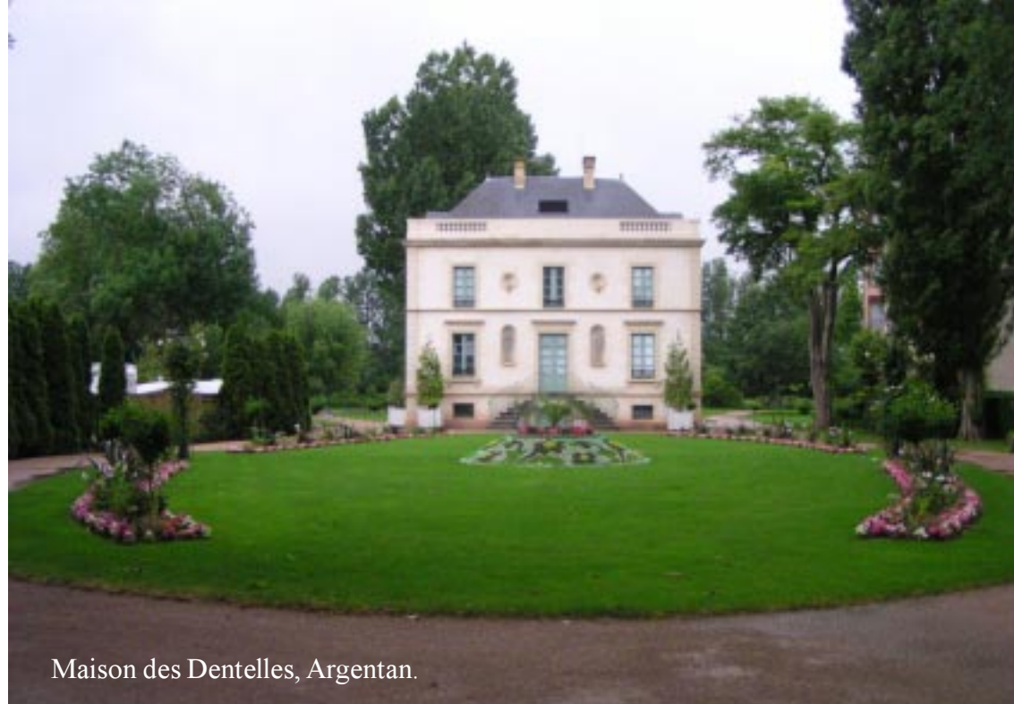
Maison des Dentelles, Argentan.

's Avonds liggen we er vlot in. Ik maak nog wel een foto van de villa en de centrale kerk van Argentan.