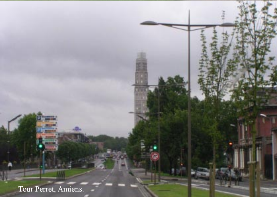
Tour Perret, Amiens.