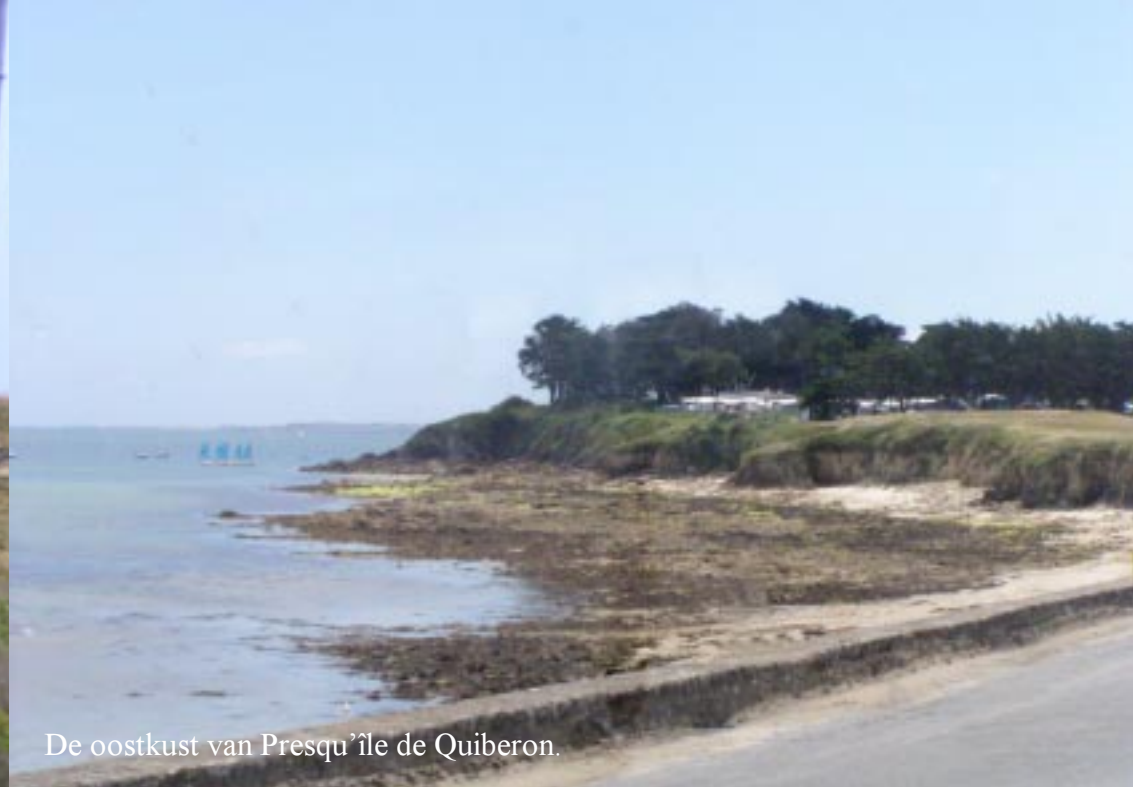
De oostkust van Presqu'île de Quiberon.