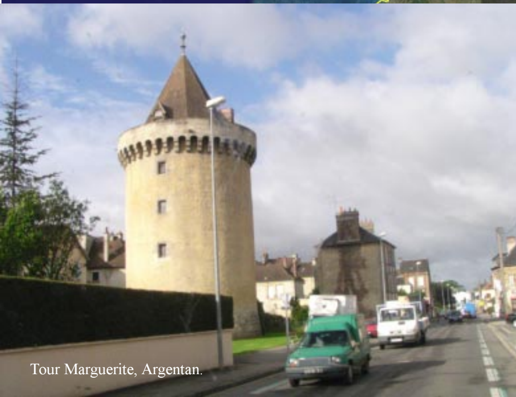
Tour Marguerite, Argentan.

Na Mayenne schiet het beter op: Laval en dan bij la Gravelle de autoweg N157 naar Rennes op.