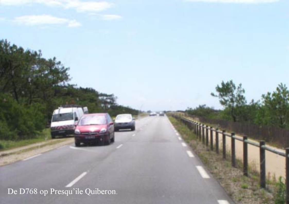
De D768 op Presqu'île Quiberon.