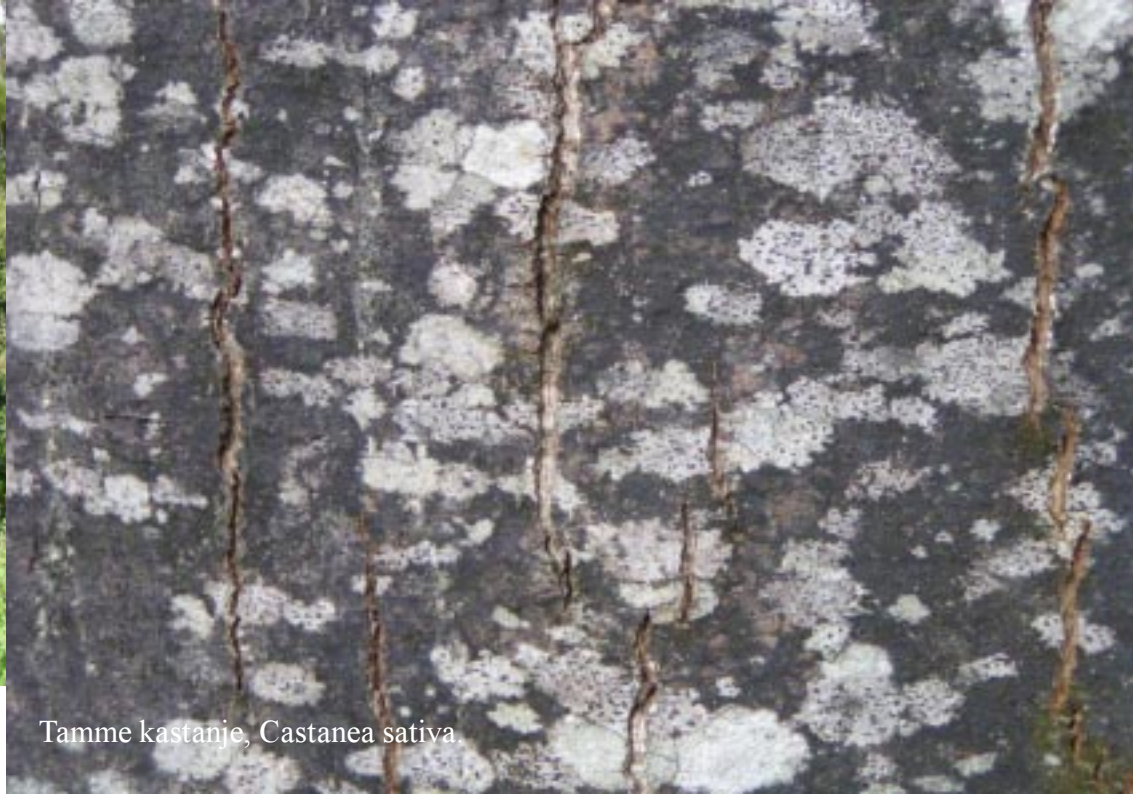
Tamme kastanje, Castanea sativa .