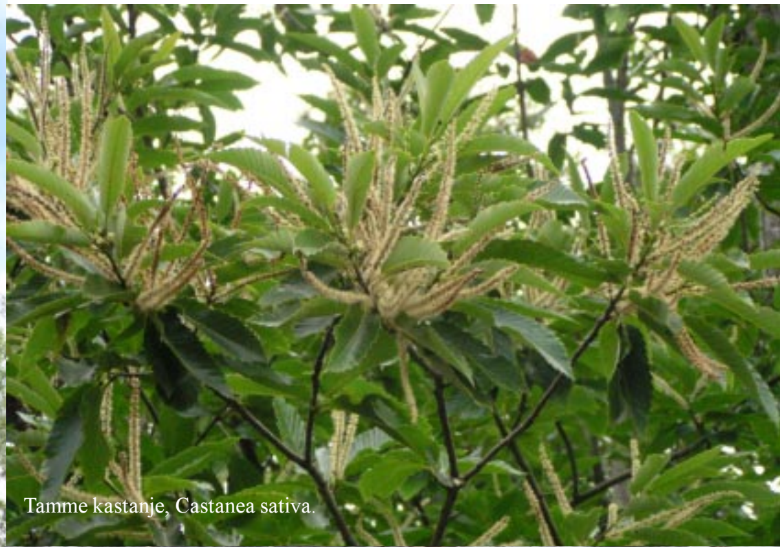
Tamme kastanje, Castanea sativa .

Even pauze op een parkeerplaats net voor Châteaubourg. (11.30)