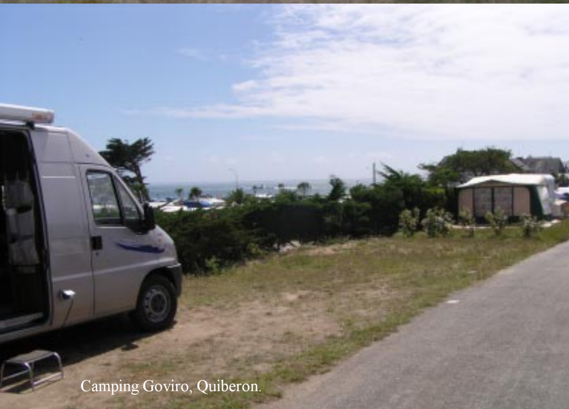
Camping Goviro, Quiberon.