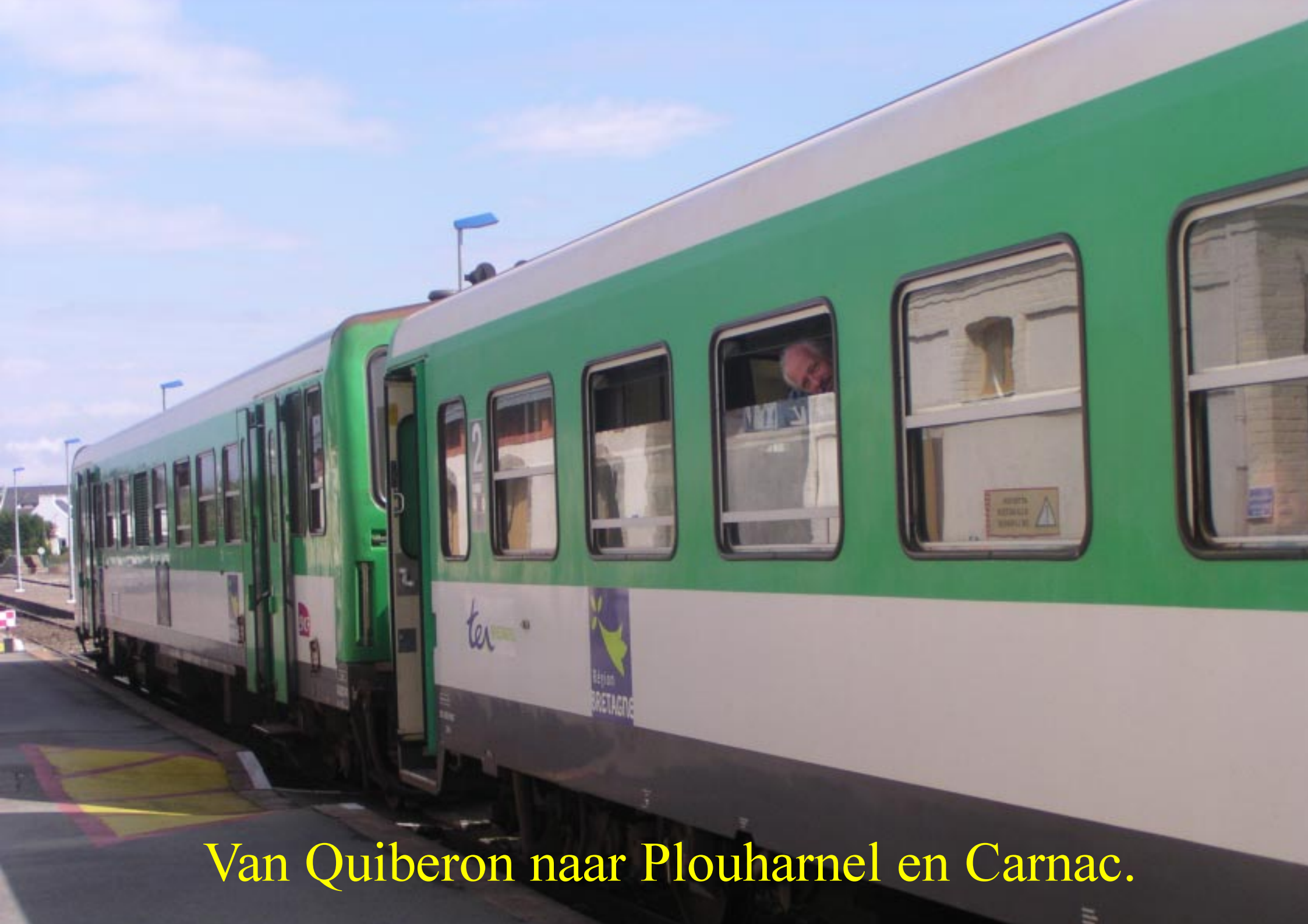
Van Quiberon naar Plouharnel en Carnac.