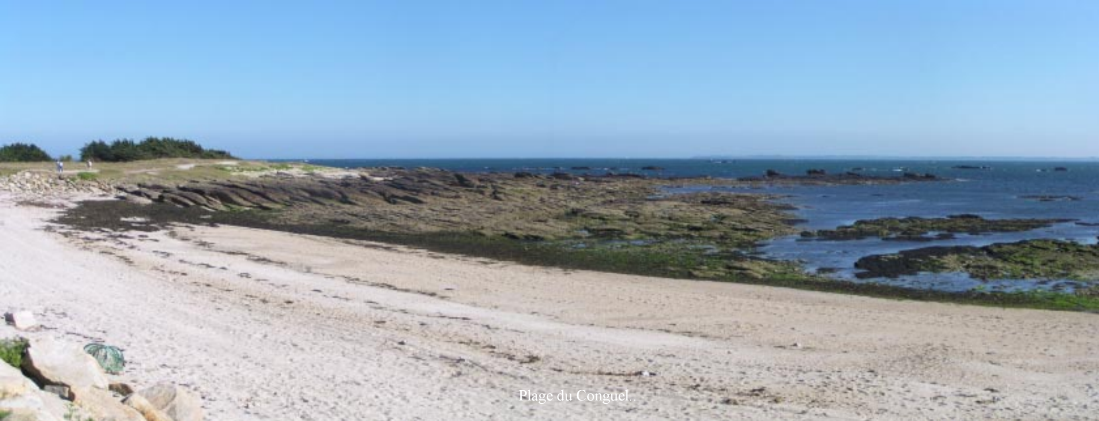
Plage du Conguel.