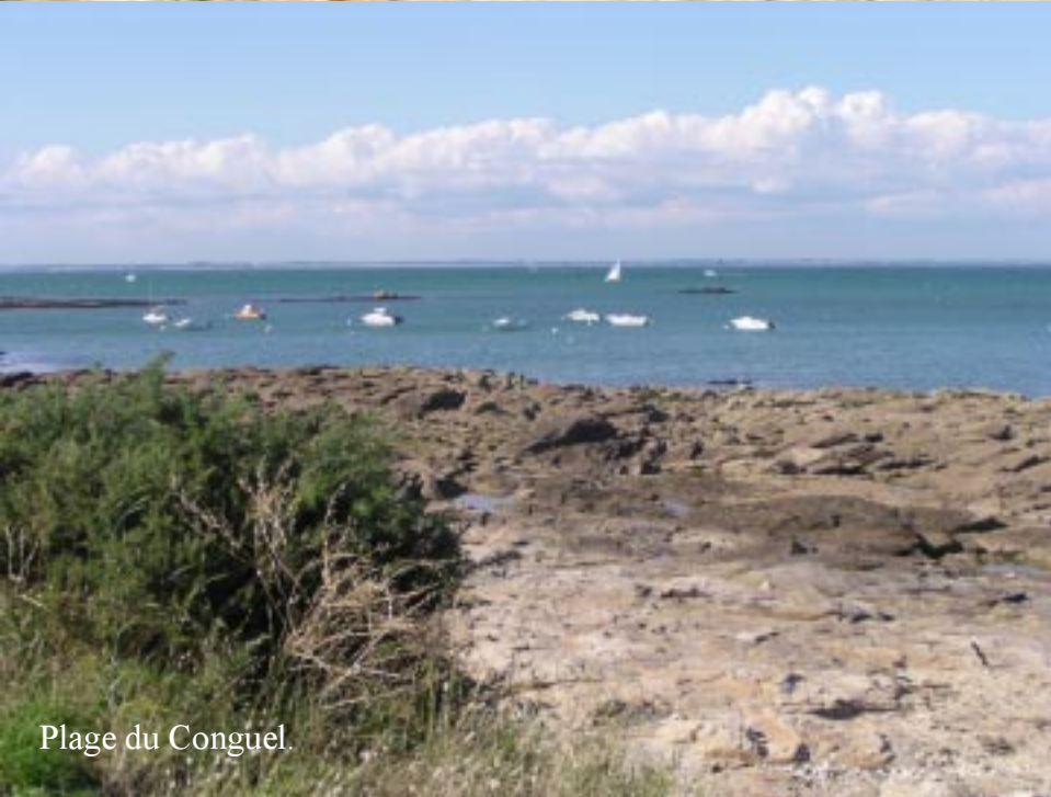
Plage du Conguel.

Tegen zevenen zijn we op de camping terug en hebben dan geen zin meer in nieuwe escapades vandaag. 's Avonds wordt er dus brood en "île flottant" gegeten en plannen gemaakt voor de komende dagen.