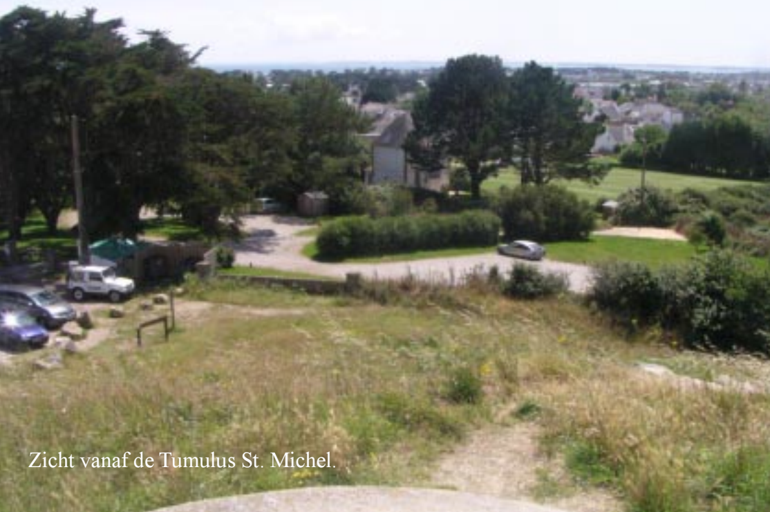
Zicht vanaf de Tumulus St. Michel.