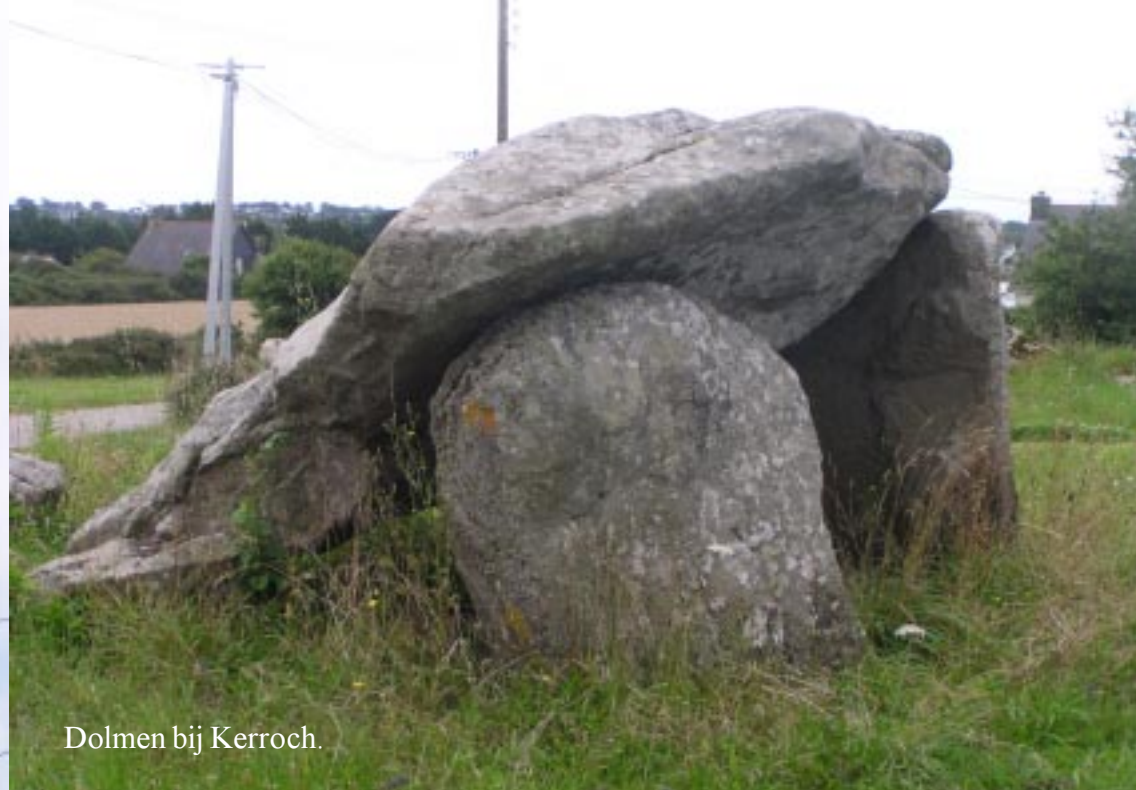
Dolmen bij Kerroch.