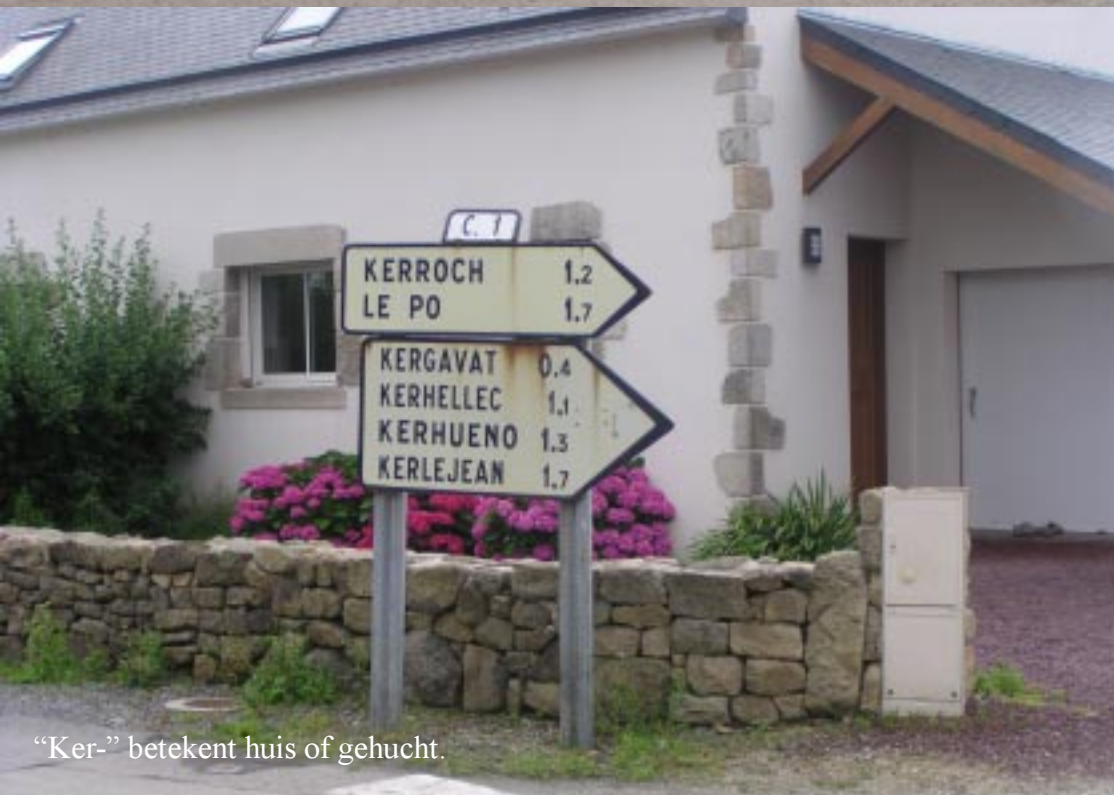
“Ker-” betekent huis of gehucht.