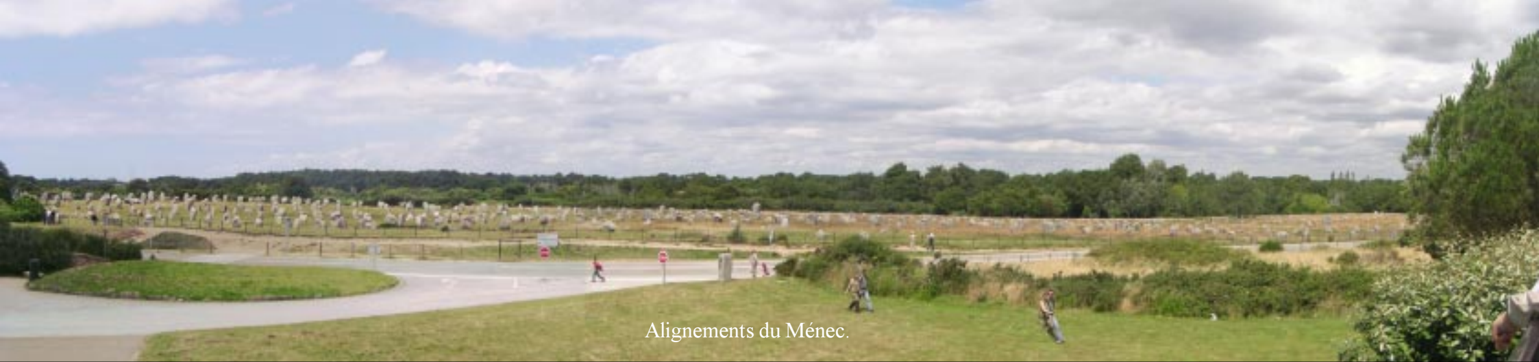
Alignements du Méneac.

We bekijken de veelkleurige St. Cornély aan de gevel van de gelijknamige kerk (net Urbanus met zijn aerodynamische wielrenmuts!) en gaan dan wat drinken in een café daar. (13.40) Achter in de zaak ligt een reusachtige Newfoundlander. Aan de bar staat o.a. een klein oud vrouwtje, dat nauwelijks over het ding kan kijken. Ze rookt een buitennissig grote sigaar.