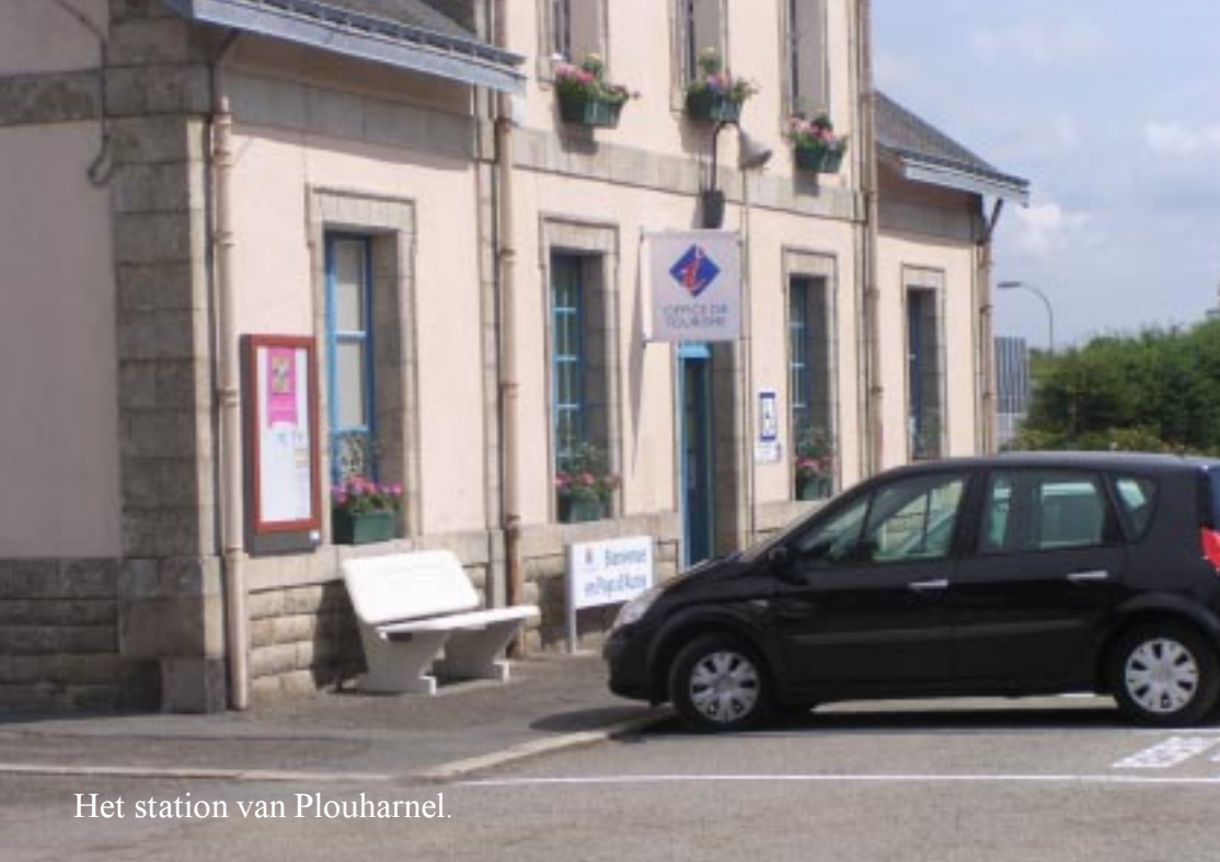
Het station van Plouharnel.