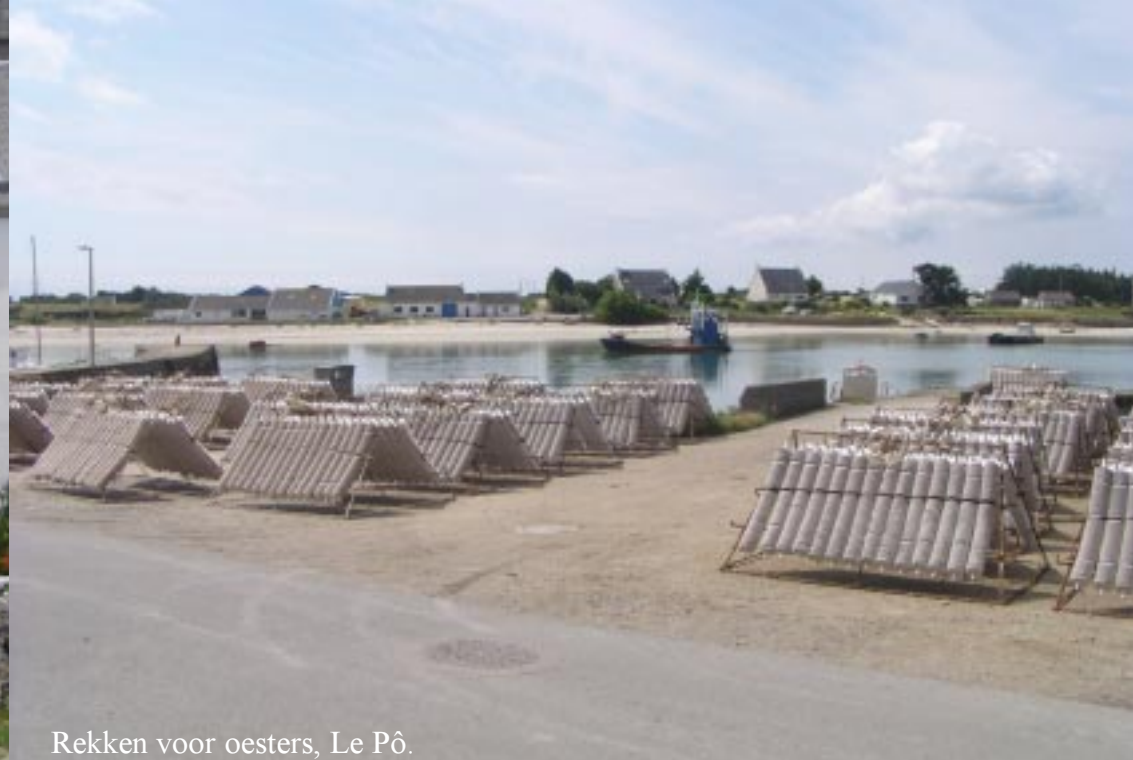
Rekken voor oesters, Le Pô.

We komen aan de Baie de Plouharnel. Tegen deze kust zijn uitgestrekte oesterbanken. Verder liggen er aardig wat vreemde platte schuiten met takels en primitief aandoende kajuiten. Boten om die oesters op te vissen? Her en der worden oesters te koop aan geboden of hangen borden van oesterfirma's. De sfeer hier is dan ook van een echt vissersdorp. Voor een deel zijn de huizen en gebouwen puur functioneel, zonder opsmuk. Andere zijn ware Holly Hobby huisjes, perfect in de verf met hoge hortensia's voor de deur.