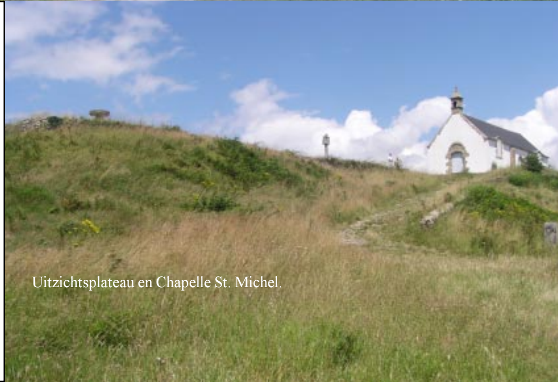
Uitzichtsplateau en Chapelle St. Michel.

Tegen kwart voor vier stappen we op. Eerst een stuk van het bekende Rue de Pô, dan door de nieuwbouwwijk daar NW-waarts naar de andere kant van de D781. We passeren een groot restaurant en camping Les Goelands.