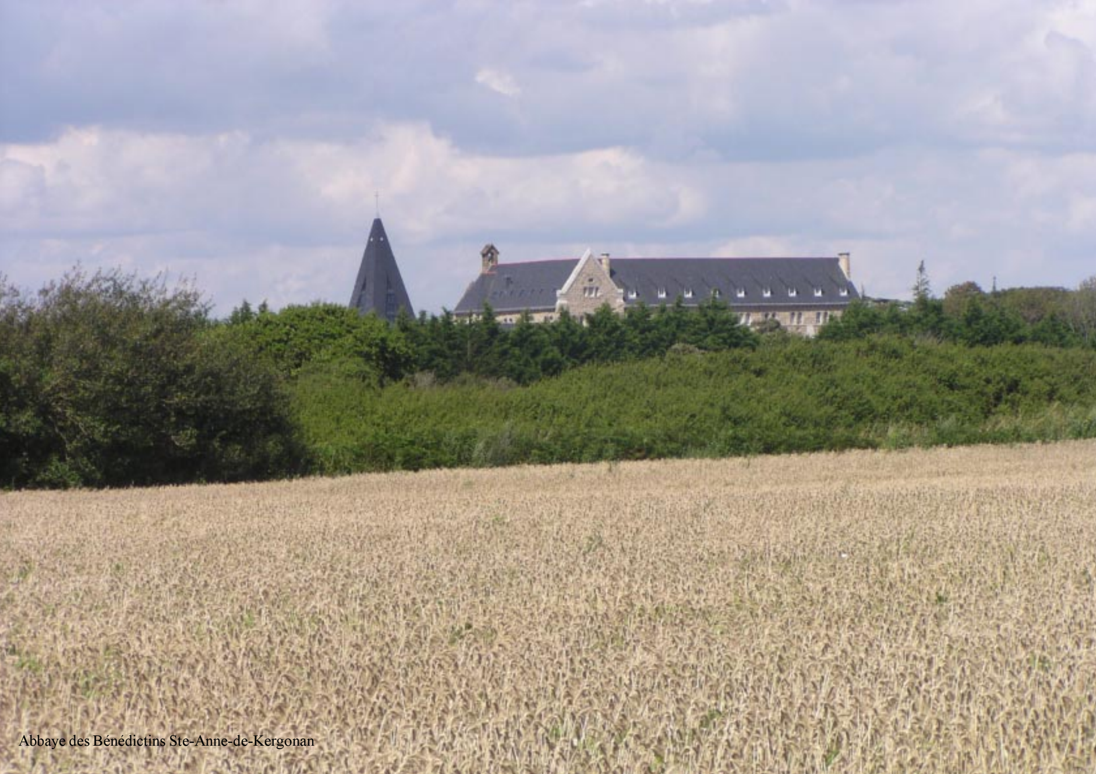
Abbaye des Bénédictins Ste-Anne-de-Kergonan