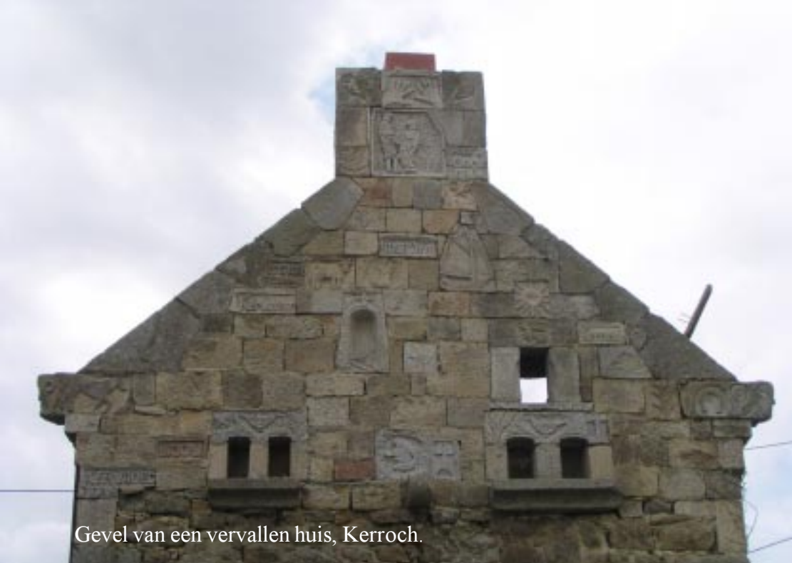
Gevel van een vervallen huis, Kerroch.