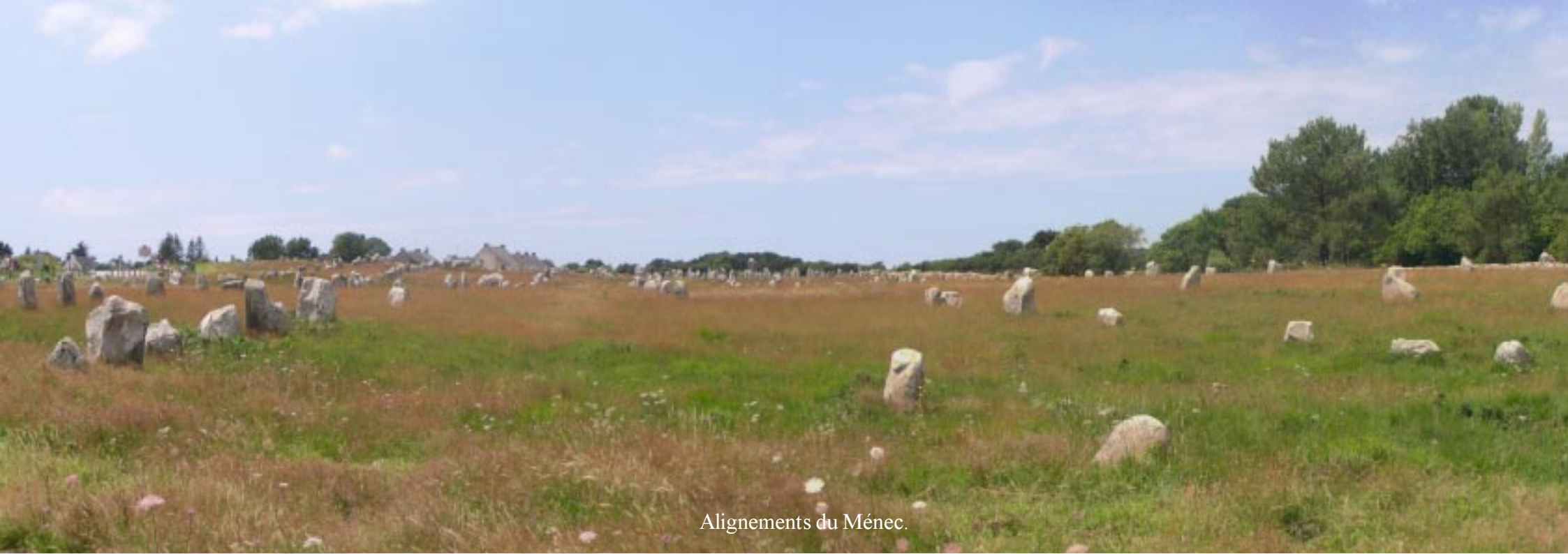
Alignements du Ménéac.