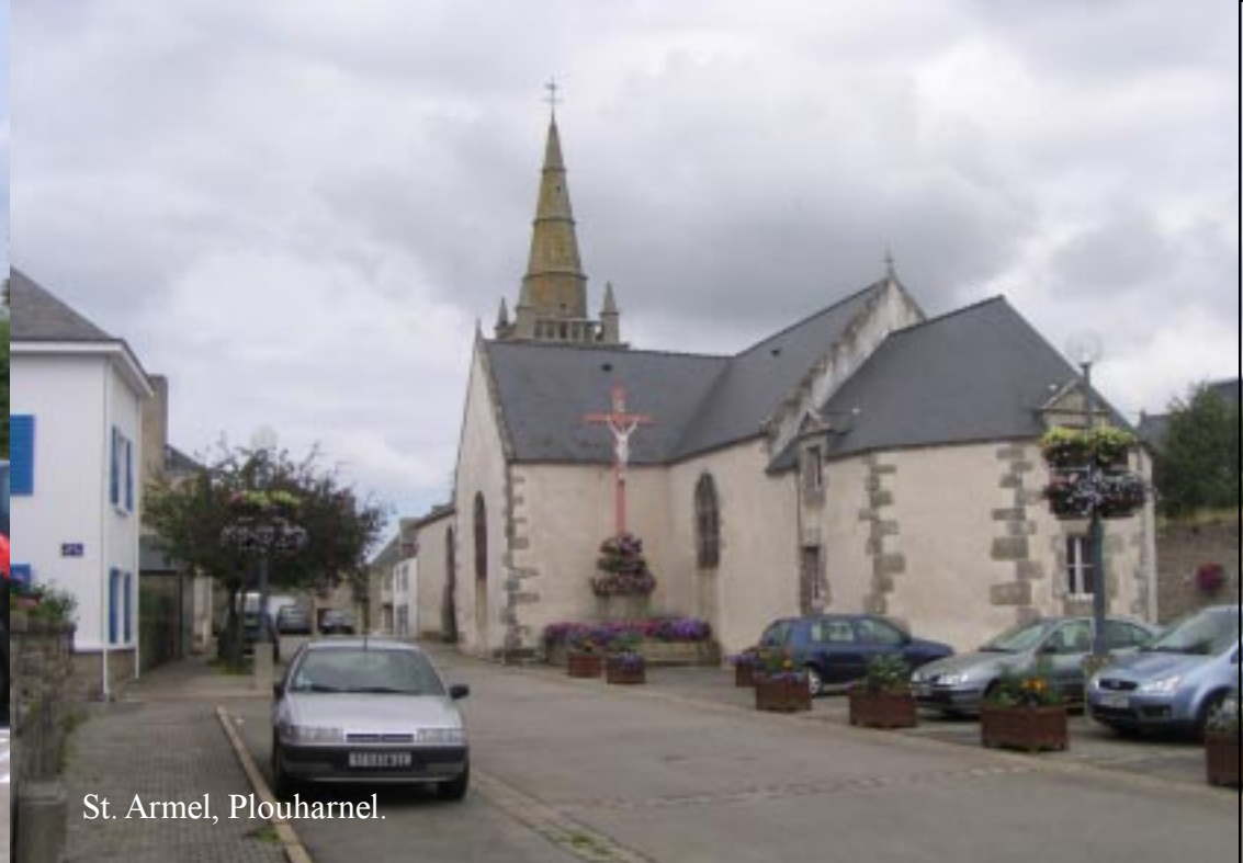
St. Armel, Plouharnel.