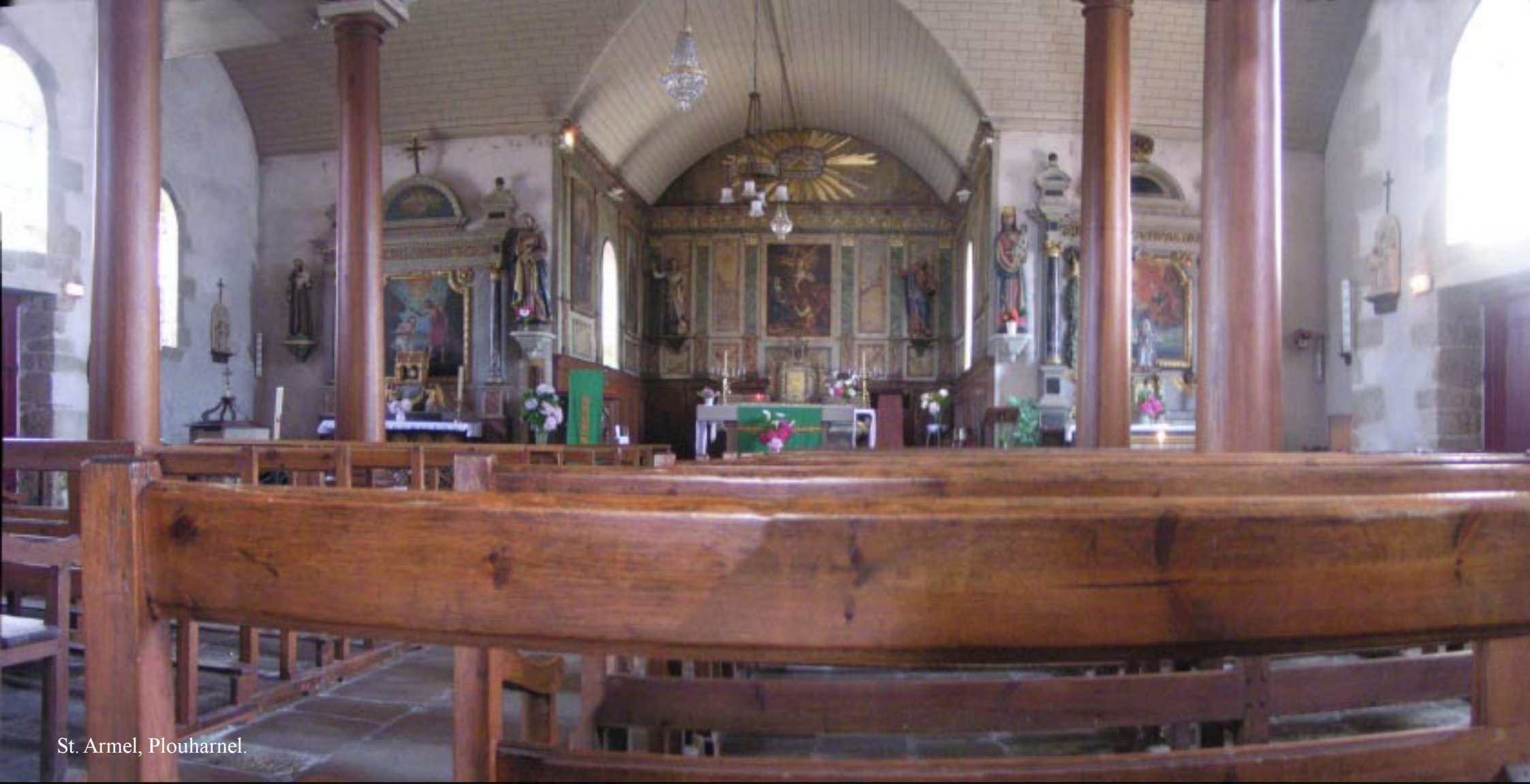
St. Armel, Plouharnel.

Tegen vijf uur zijn we dan in Plouharnel terug. We moeten er tot de trein van 18.00 hr wachten. We halen bij de bakker een “millesfeuilles” en een “flan” en eten die op het plein achter de kerk op. We kijken even binnen rond in deze kerk. Het blijkt een alleraardigst kerkje te zijn.