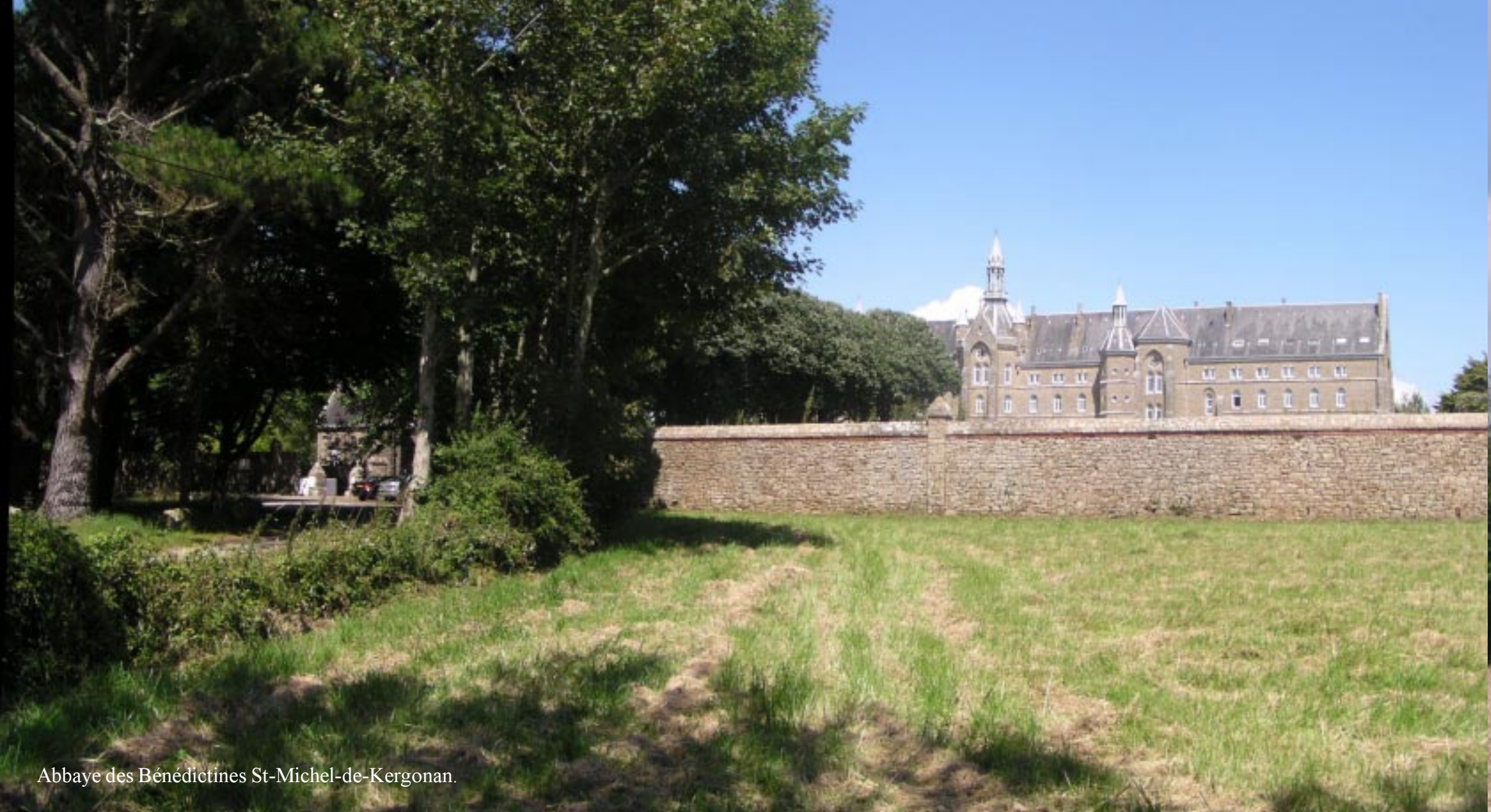
Abbaye des Bénédictines St-Michel-de-Kergonan.

Langs akkers af passeren we eerst een groot vrouwenklooster: Abbaye des Bénédictines St-Michel-de-Kergonan. Door een hoge muur en nog hogere coniferen zien we er echter maar weinig van. Verderop (dicht bij Plouharnel) staat een zo te zien moderner mannenklooster Abbaye des Bénédictins Ste-Anne-de-Kergonan.