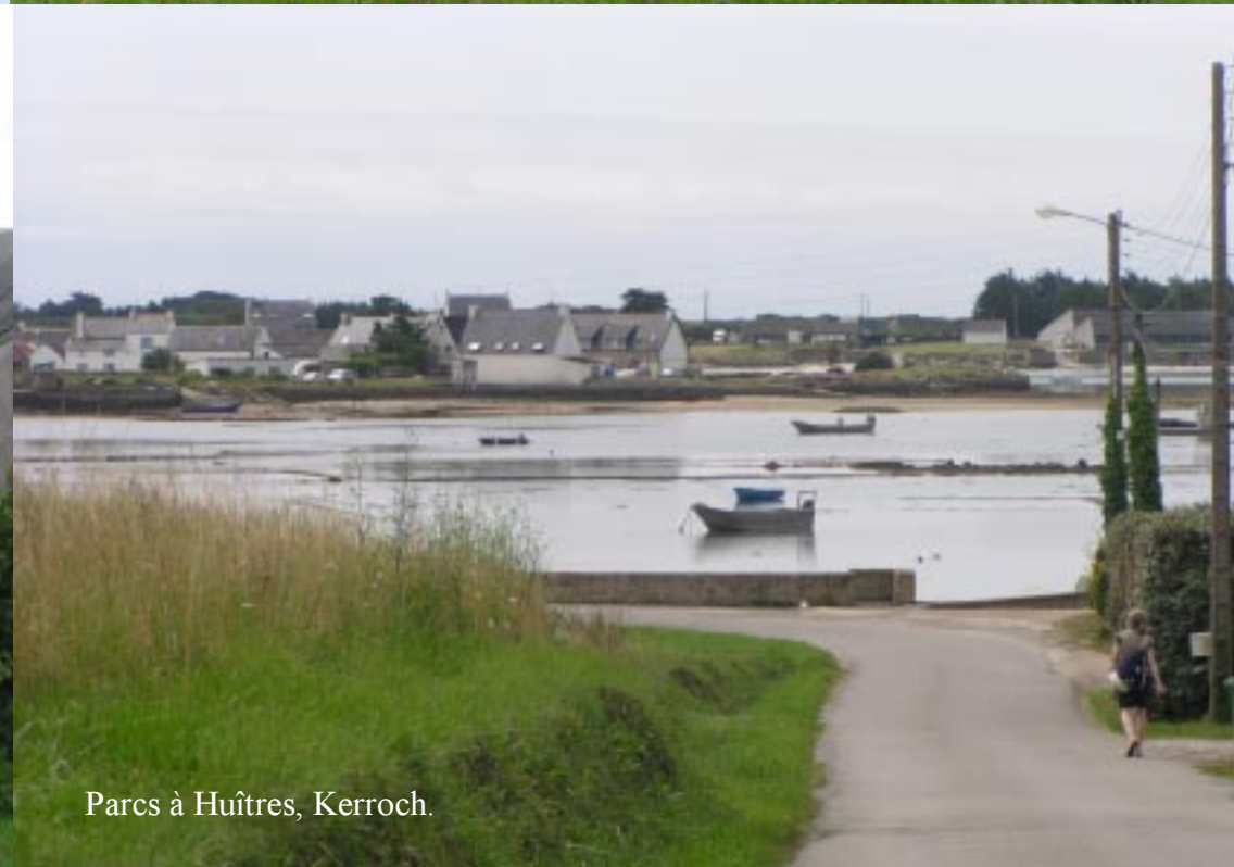
Parcs à Huîtres, Kerroch.