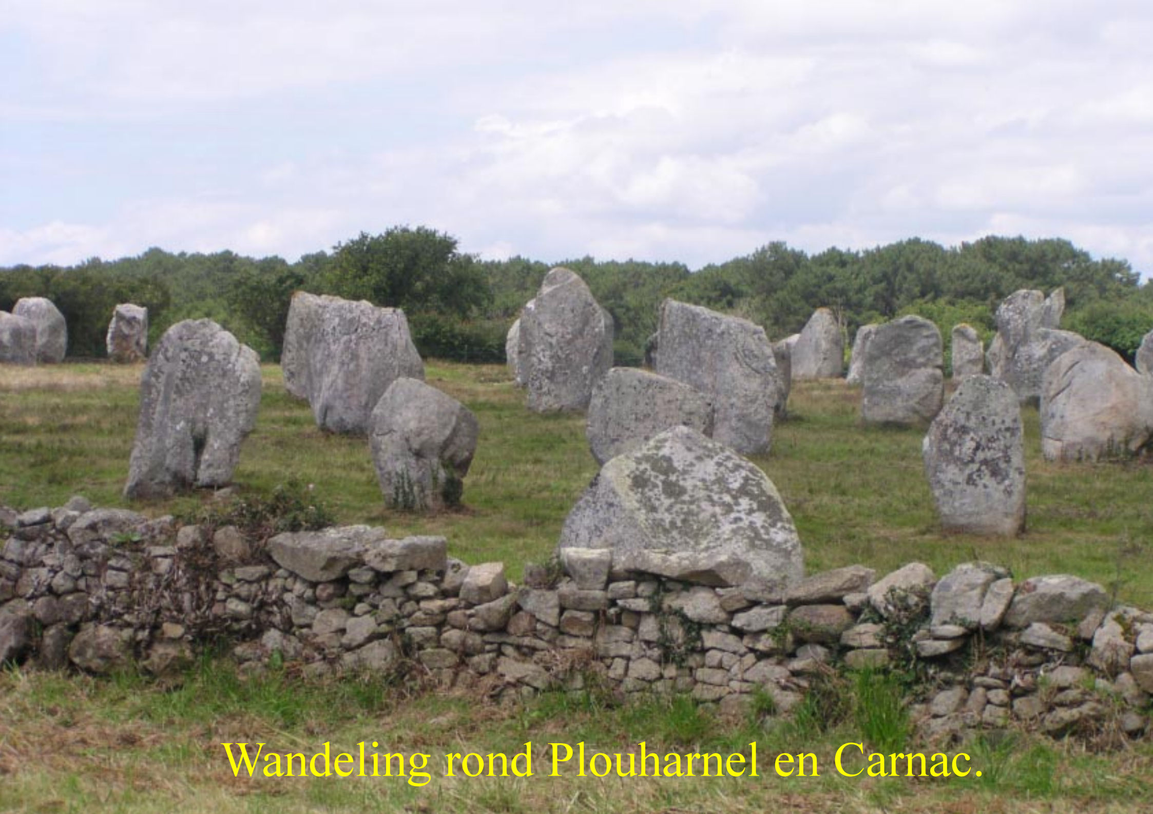
Wandeling rond Plouharnel en Carnac.