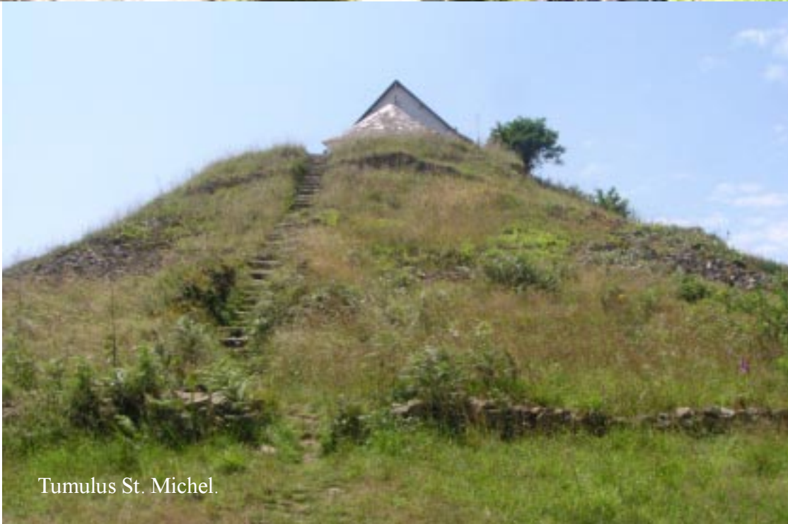
Tumulus St. Michel.