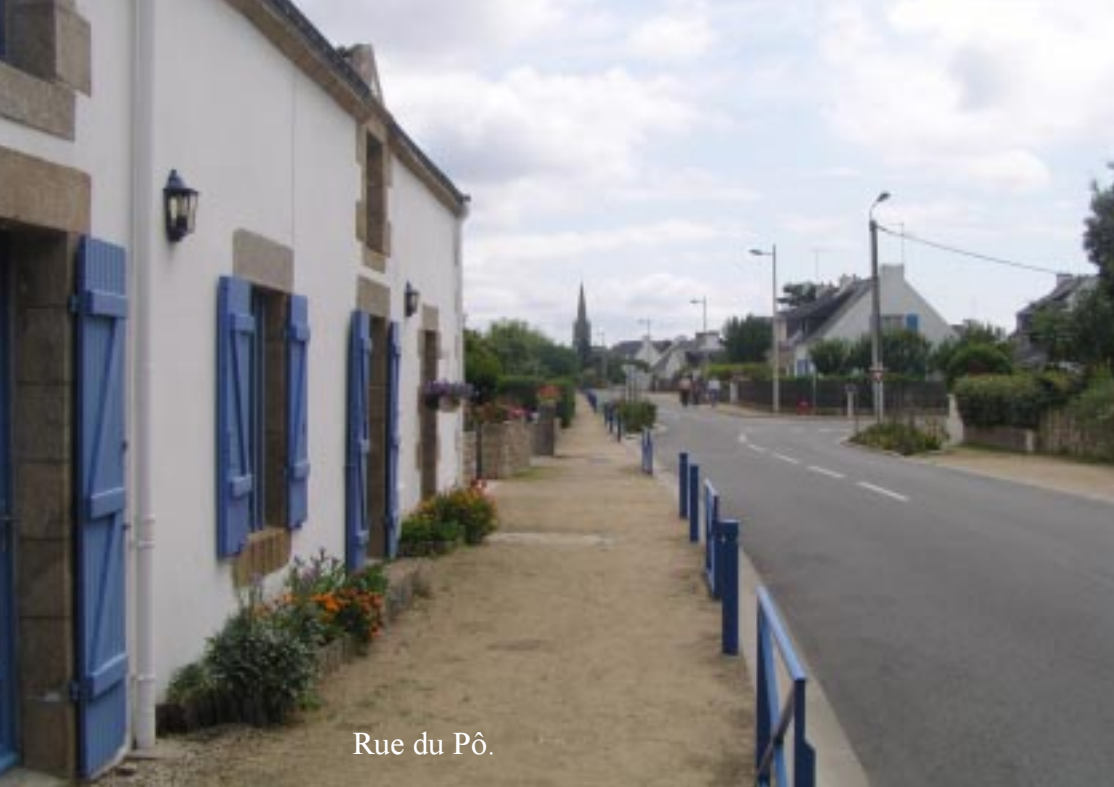
Rue du Pô.