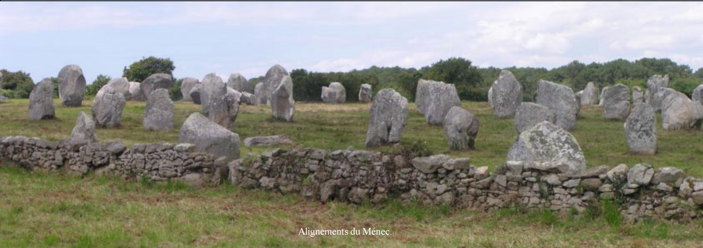
Alignements du Méneac.

Rond twee uur gaan we kijken bij de grootste attractie van Carnac: De Alignements de Méneac. Lange rijen menhirs op een grasveld. Op het dak van een bezoekerscentrum heeft men een overzicht over dit veld. We lopen langs het veld naar het kruispunt met de Rue des Korrigans, waar een volgend veld keien ligt.