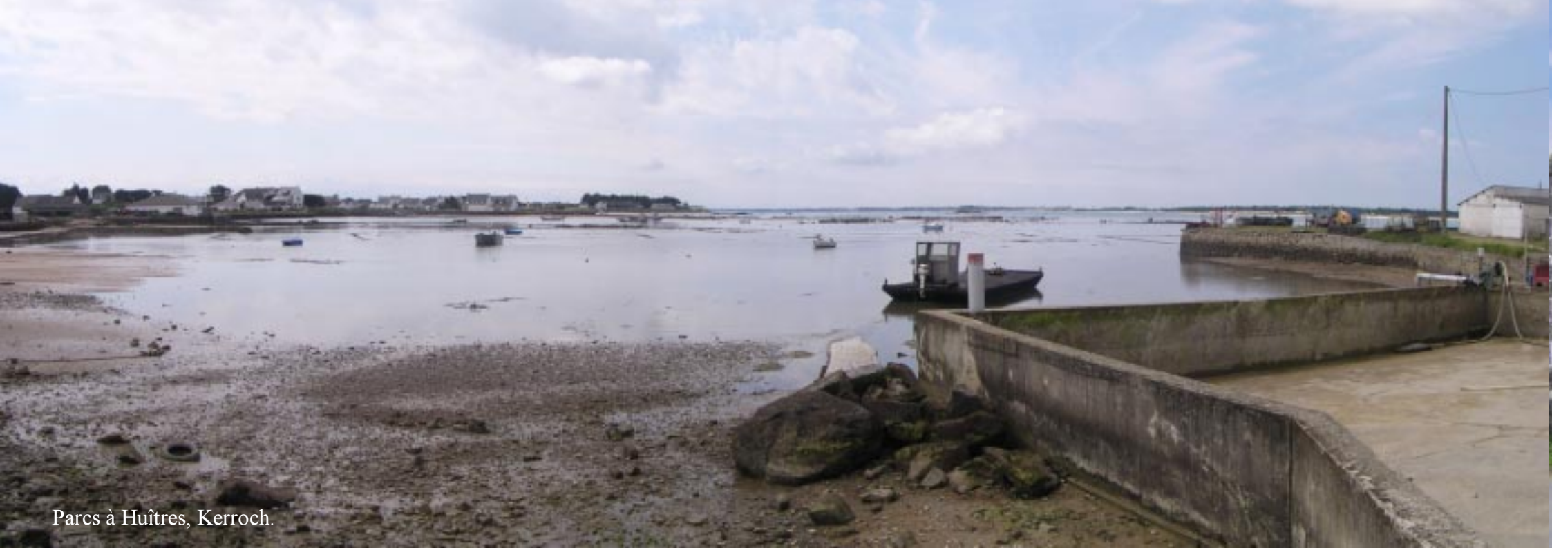
Parcs à Huîtres, Kerroch.