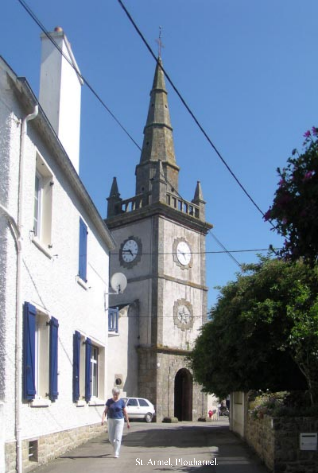
St. Armel, Plouharnel.