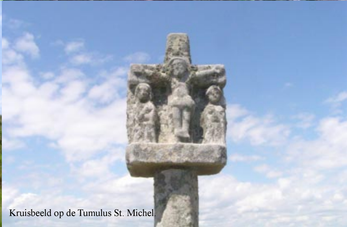
Kruisbeeld op de Tumulus St. Michel.