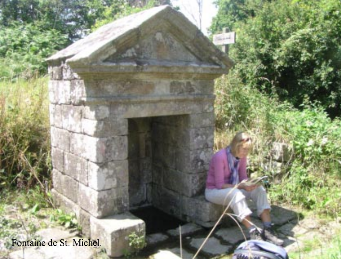
Fontaine de St. Michel.