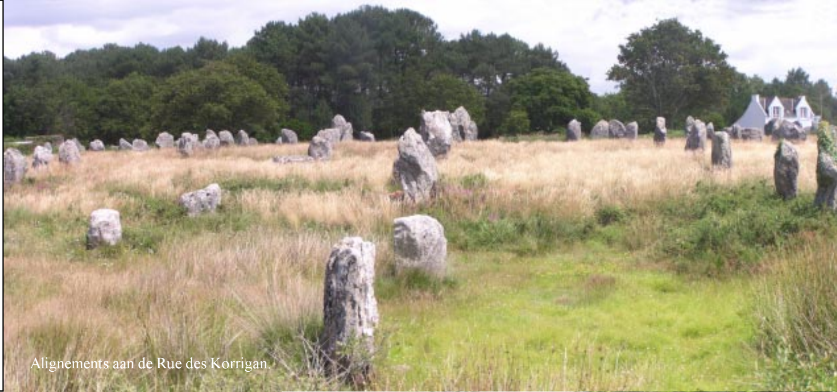
Alignements aan de Rue des Korrigan.

Aan de Rue des Korrigans zien we nog een bron met vierkante vijver. Even verder slaan we links een overwoekerd bospad in, dat ons in een grote boog over oude holle paden langs muurtjes naar de Fontaine de St. Michel brengt, de volgende overdekte bron. (15.00)