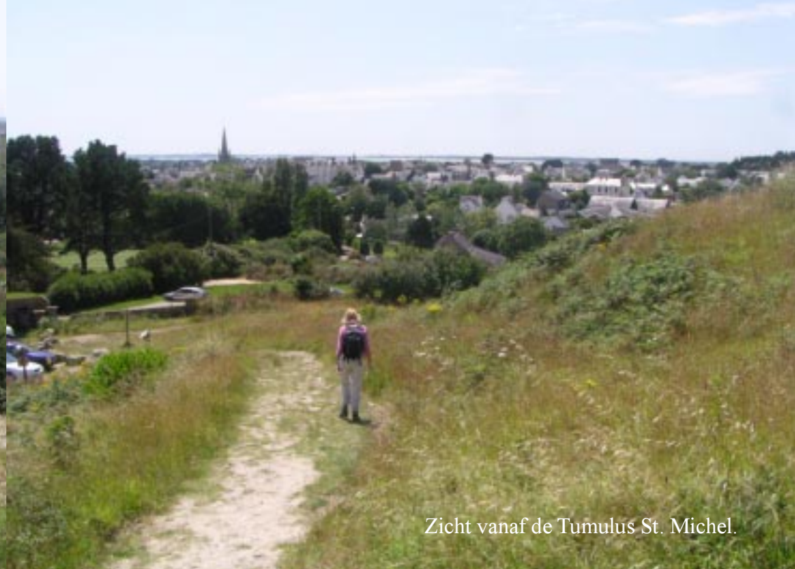
Zicht vanaf de Tumulus St. Michel.

Dan is het nog maar enkele minuten naar de Tumulus de St. Michel. Een hoge grafheuvel, waar een kapel op is gebouwd. Helaas is de kapel gesloten en kunnen we het onderaardse deel van de heuvel ook niet bezoeken.