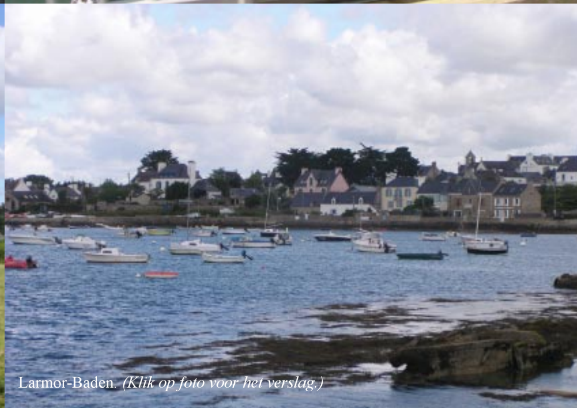
Larmor-Baden. (Klik op foto voor het verslag.)