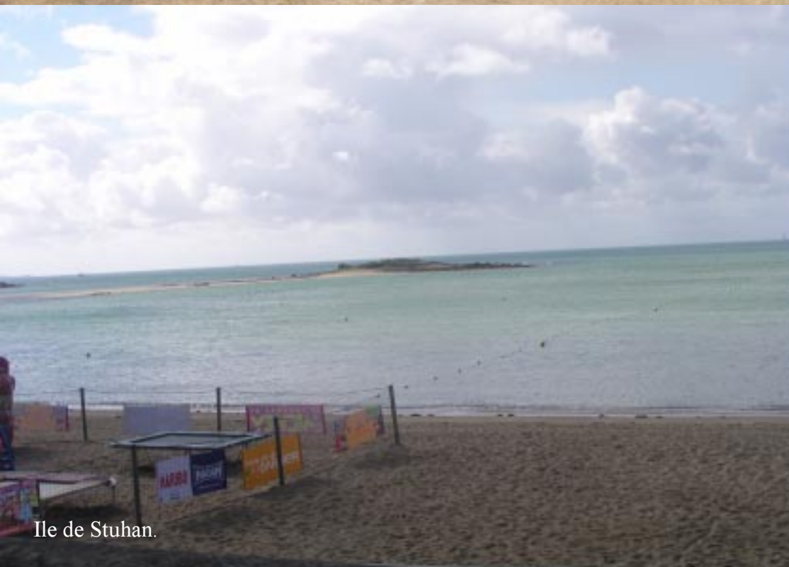
Ile de Stuhan.