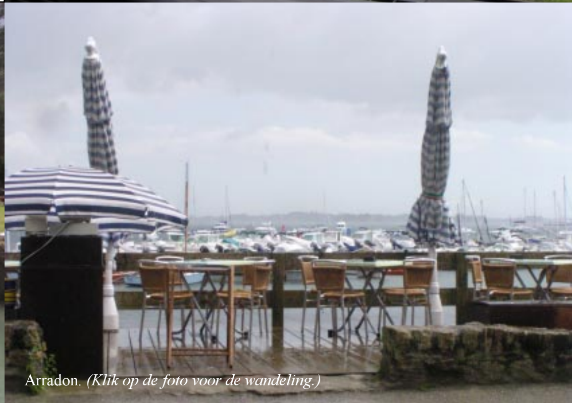
Arradon. (Klik op de foto voor de wandeling.)