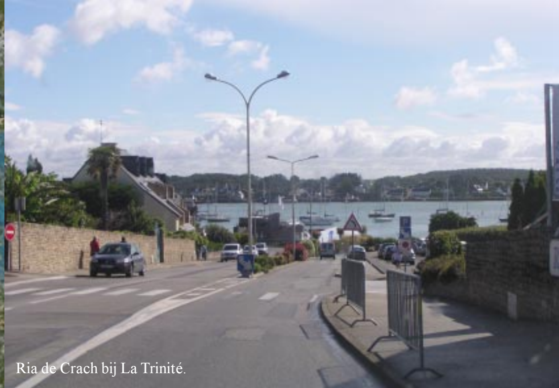
Ria de Crach bij La Trinité.