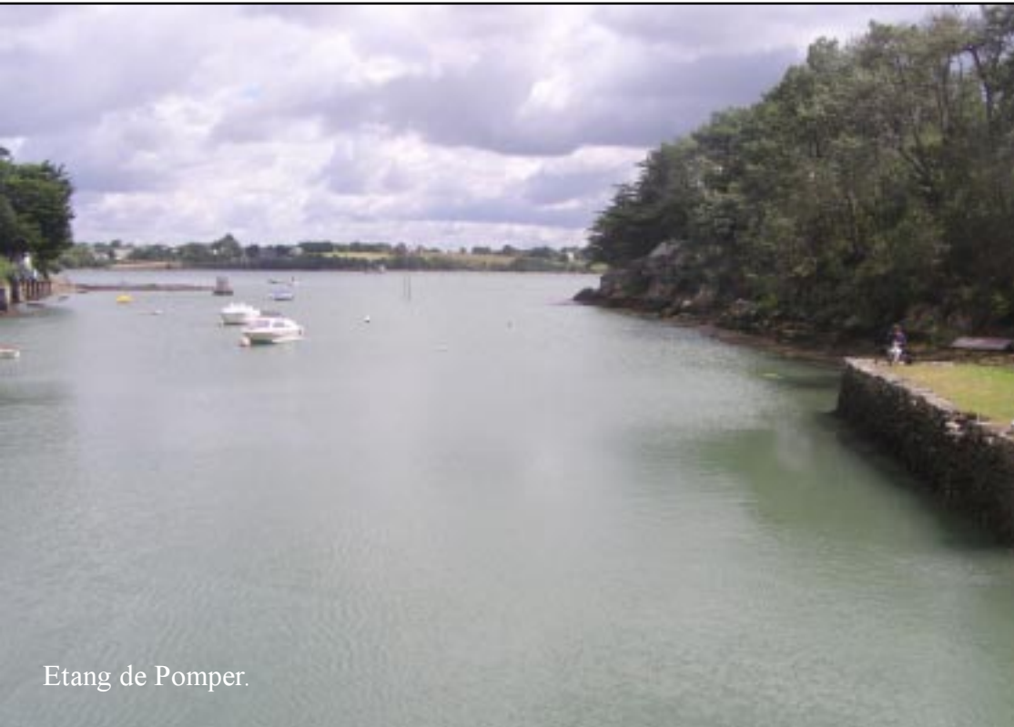
Etang de Pomper.