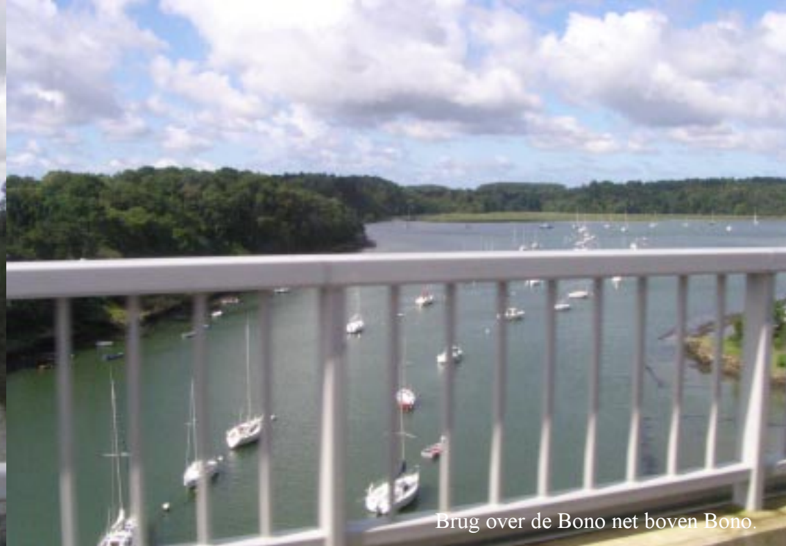
Brug over de Bono net boven Bono.