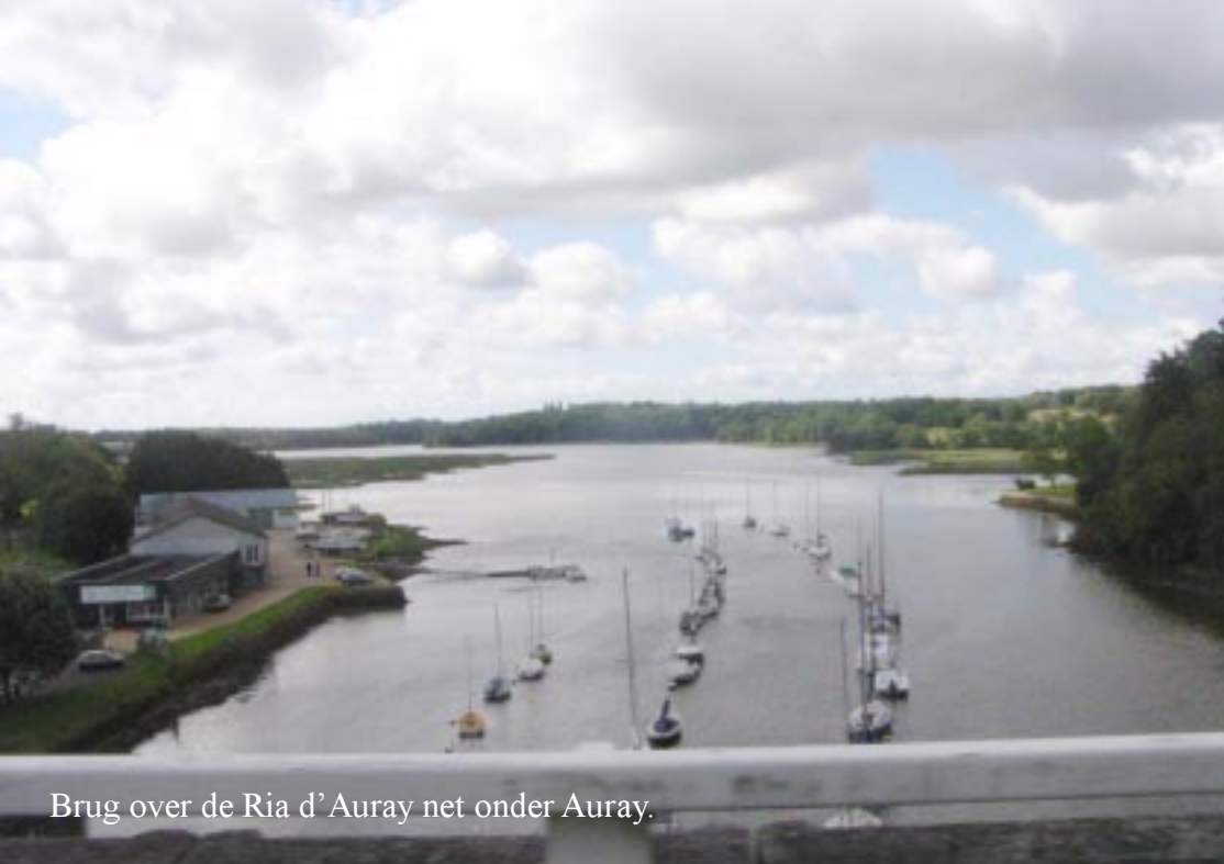
Brug over de Ria d'Auray net onder Auray.