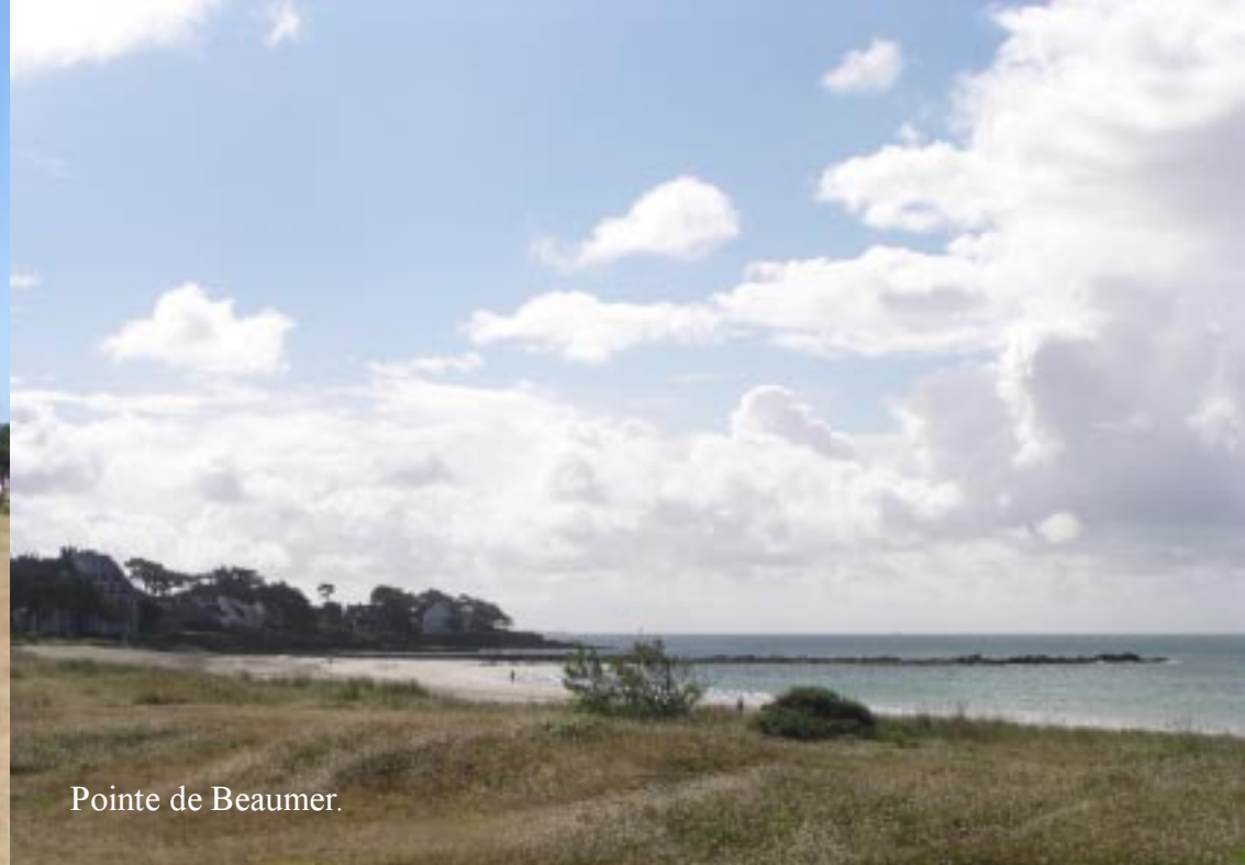
Pointe de Beumer.