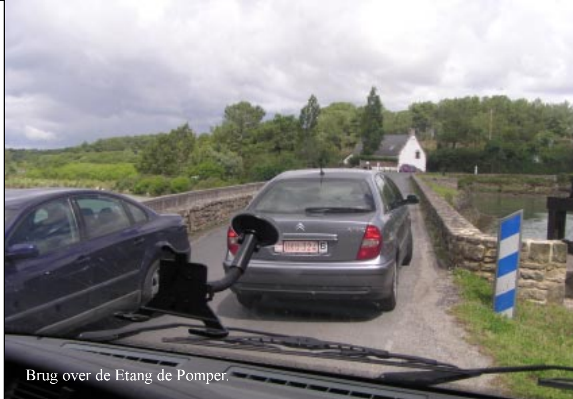
Brug over de Etang de Pomper.

's Avonds eten we tortellini met broccoli. We spelen een versoepelde Franse triviant. Versimpeld: Elk goed antwoord levert een blokje op. Anders komen we er nooit uit.