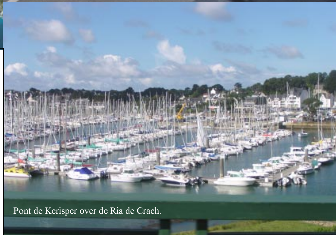
Pont de Kerisper over de Ria de Crach.

Via Auray (bijna maar), Bono, Baden gaan we naar Larmor-Baden. Daar zetten we Zippy op een parkeerplaats bij de kerk. (11.30) We maken een wandeling langs de zee. Klik op de foto (bladzijde 5) voor het verslagje.