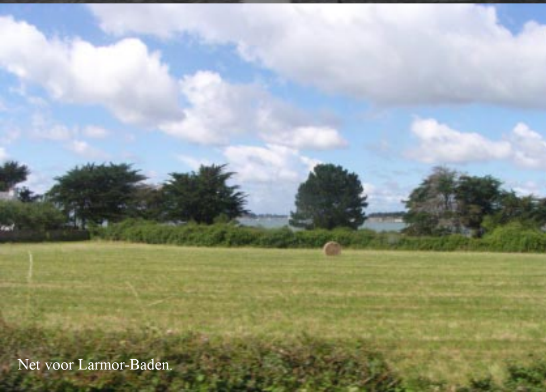
Net voor Larmor-Baden.