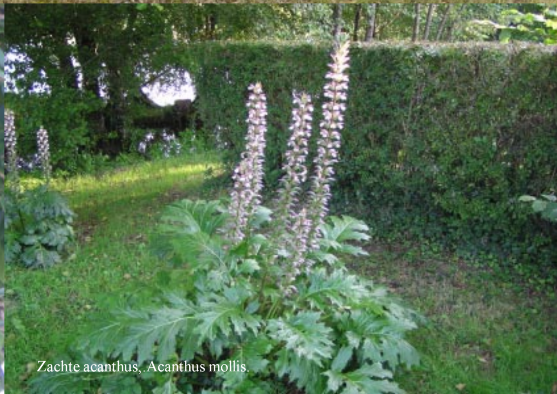
Zachte acanthus, Acanthus mollis .