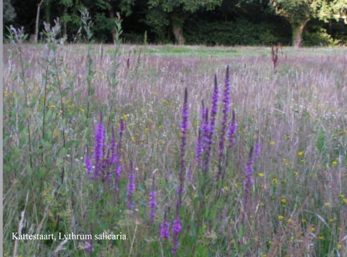
Kattestaart, Lythrum salicaria.

Goed drie uur zijn we dan op het landgoed du Deffay. •41.50 voor twee nachten. Alles is hier zeer ruim opgezet. Tenissen, waterfietsen en vissen kan men voor niets. Alles ziet er goed uit. Op een veld tegenover ons bij de vijver staan enkele enorme paddestoelen.