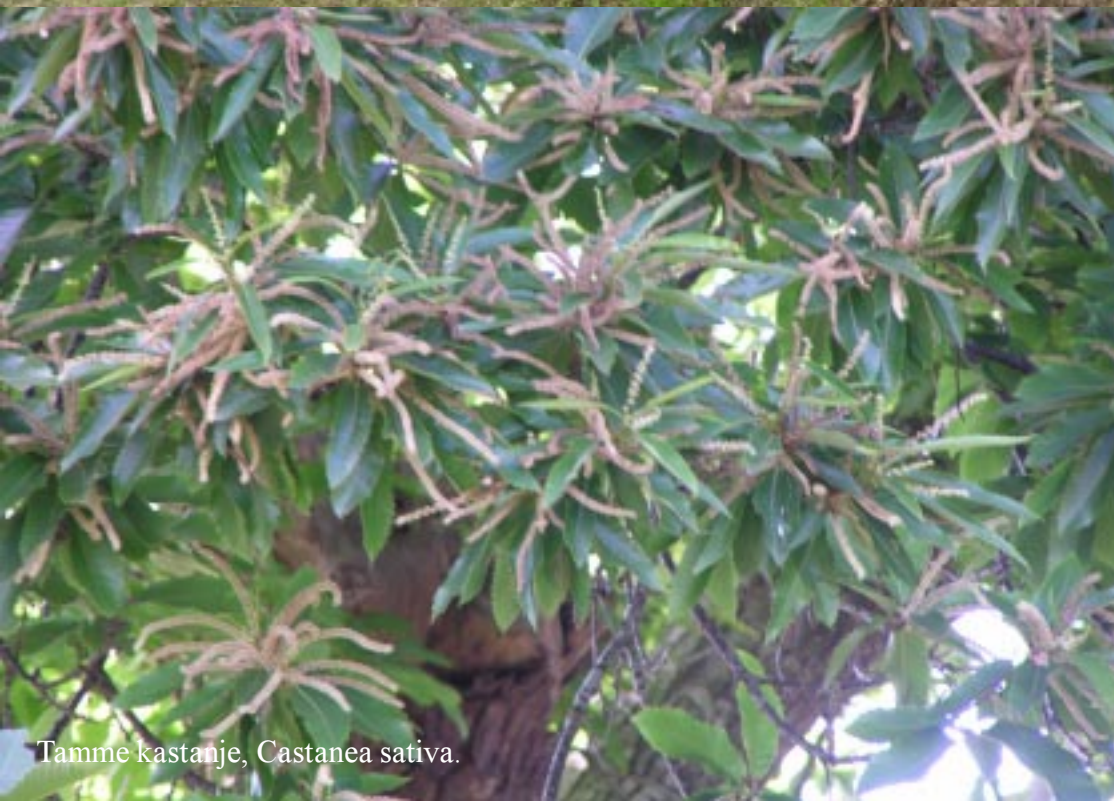
Tamme kastanje, Castanea sativa .