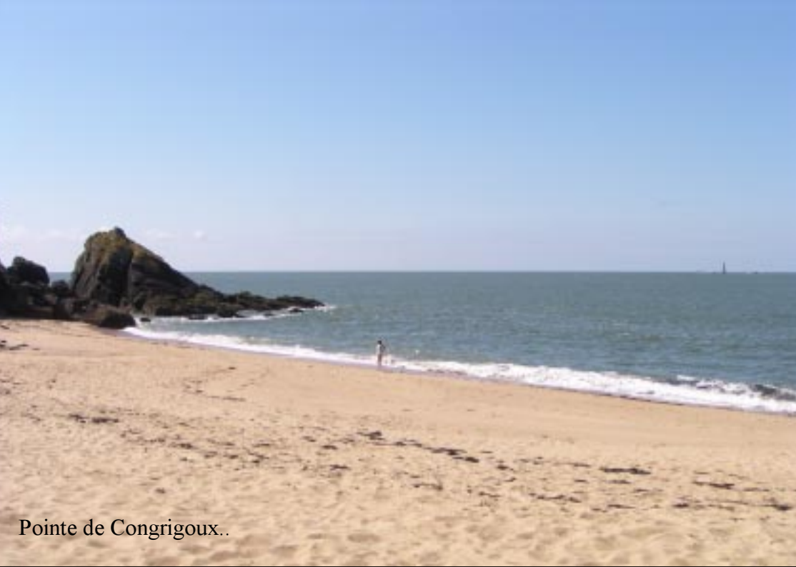
Pointe de Congrigoux..