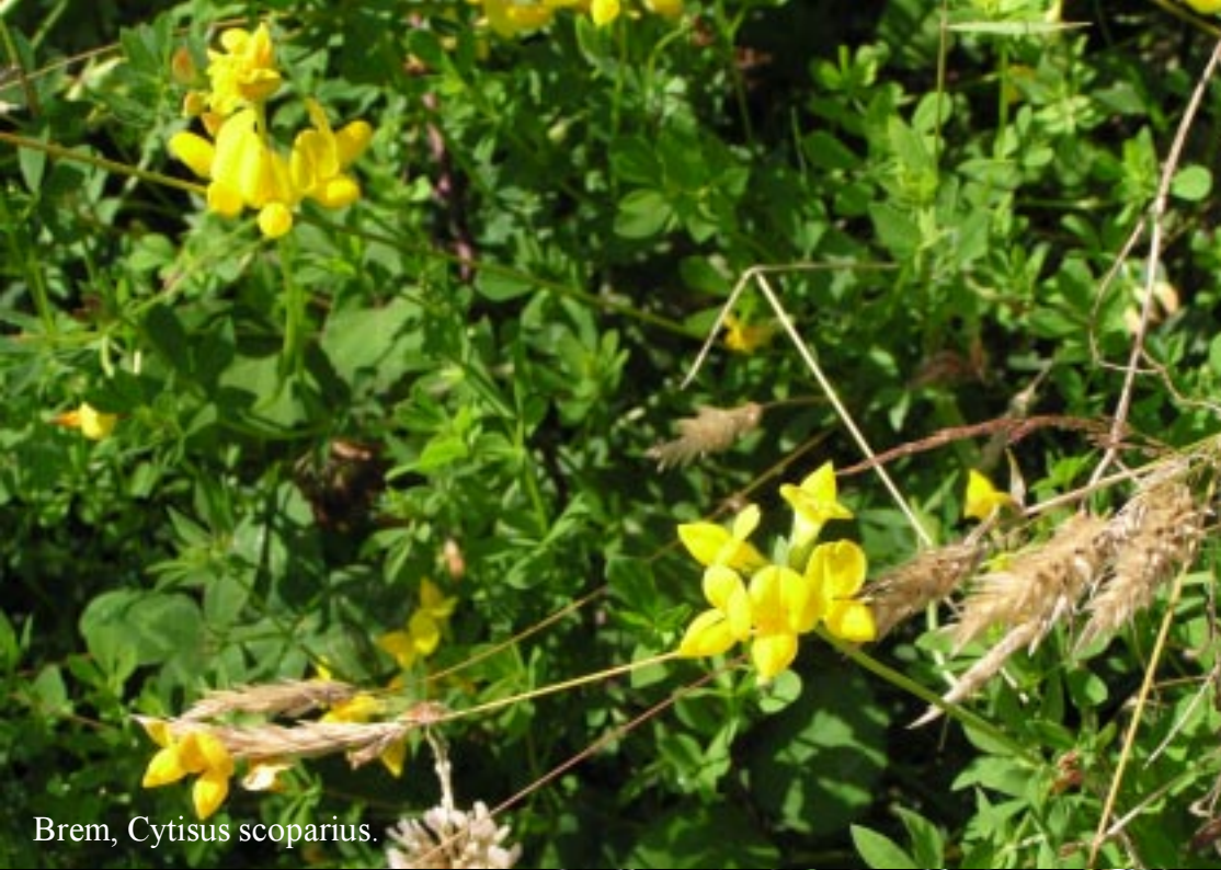
Brem, Cytisus scoparius .