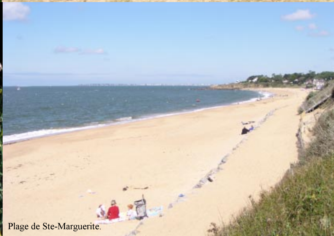
Plage de Ste-Marguerite.