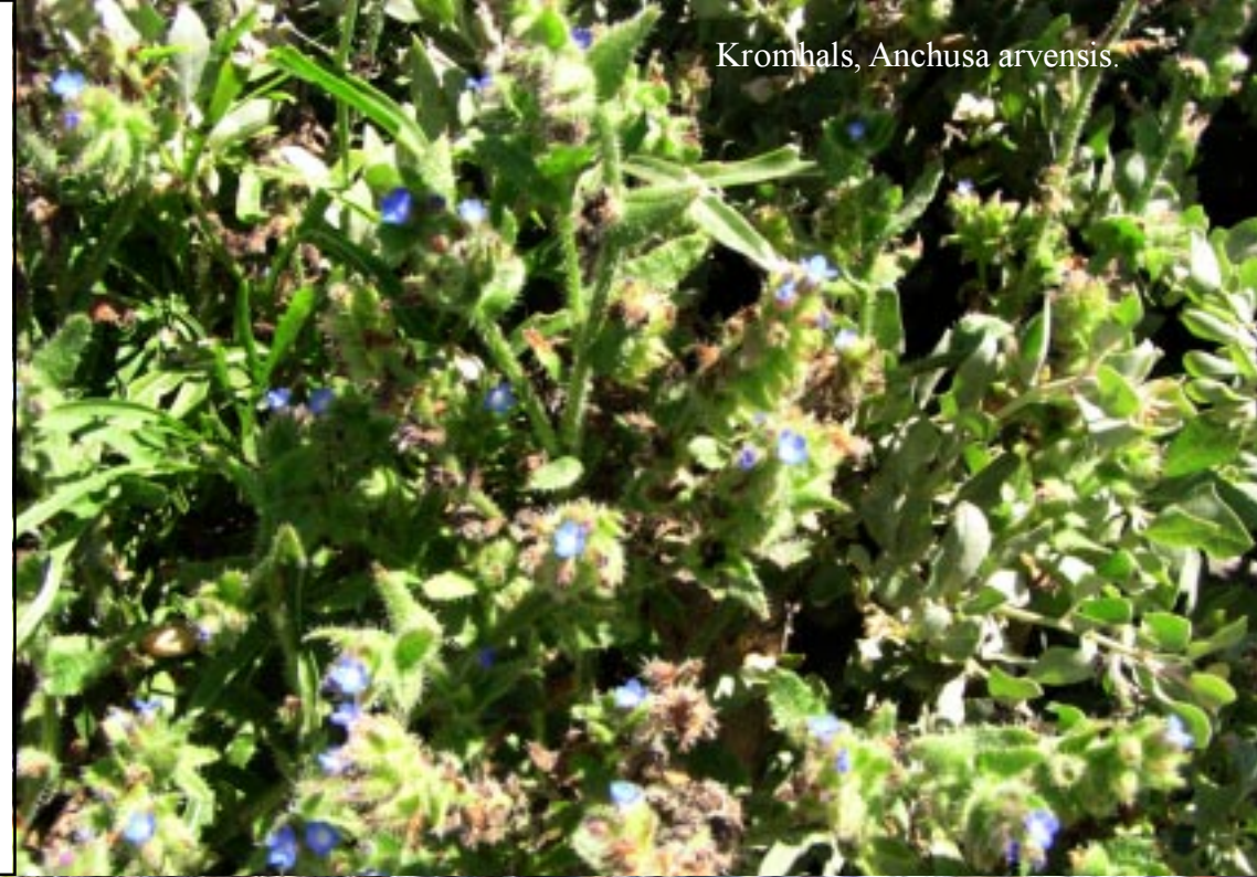
Kromhals, Anchusa arvensis .

We struinen ook een beetje over de rotsen en langs de getijdepoelen tegen de zee aan. Daar vind ik een mooie halfgeopende oester met een levende mossel en twee krukels erin. De laatste 3 krijgen vanwege mogelijke stankoverlast de vrijheid terug, de eerste wordt een souvenir aan deze vakantie.