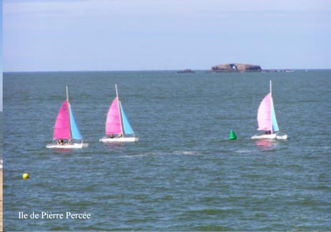
Ile de Pierre Percée.

In de verte zien we boten, zeilbootjes en twee eilandjes op zee. Dit is het Ile de Pierre Percée. De naam komt vanwege het grote gat door het eiland. Het eilandje in het zuiden zit aan de grotere vast. Maar dat zie je niet bij vloed.