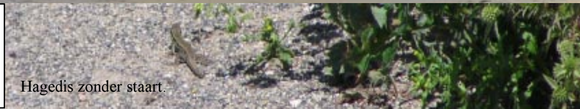
Hagedis zonder staart.

Na de haven over de Bd de la Republique naar een aflopende markt. Geen wonder, want het is al weer 12.55. Via de lange Av de Prieux en Av. des Noës terug naar Zippy. Terug naar het verslag.