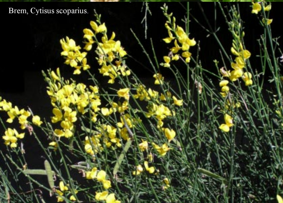
Brem, Cytisus scoparius .