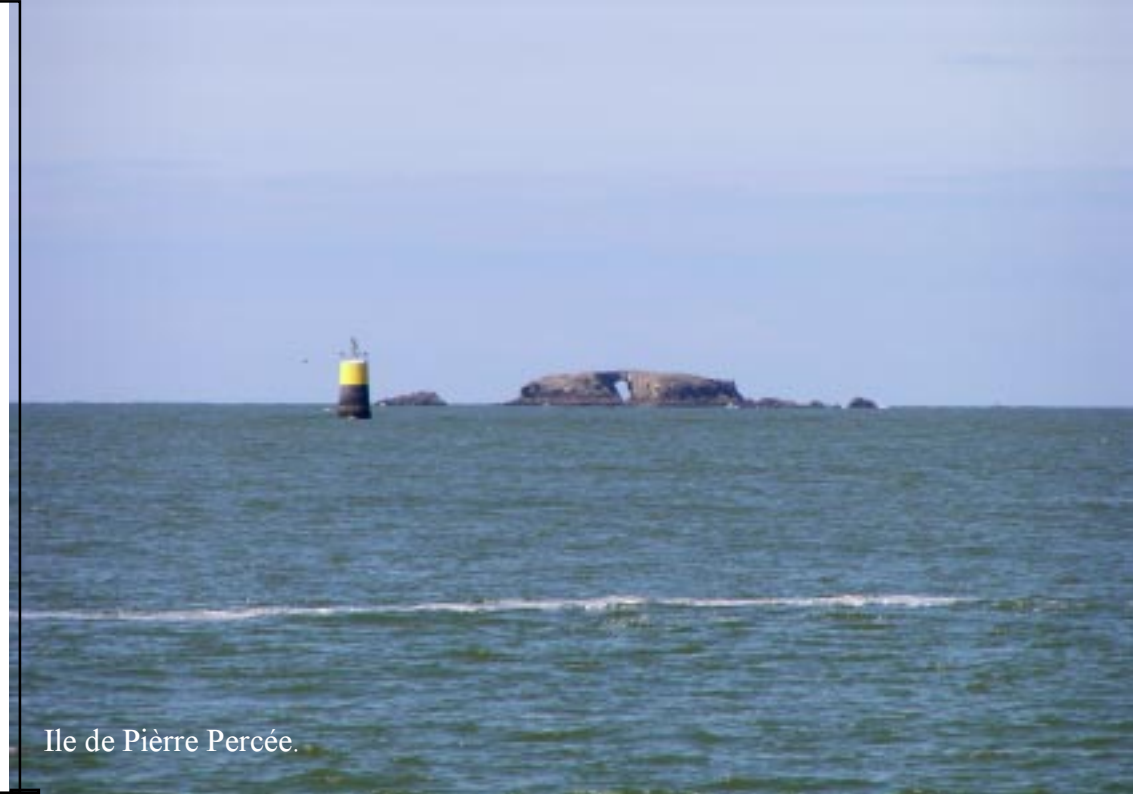
Ile de Pierre Percée.

Het eerste stuk gaat over het totaal kale strand. Alles (rotzooi en schelpen) is weggepoetst. Dan lopen we over een vlonder boven het strand door. Her en der fotografeer ik planten langs het pad.