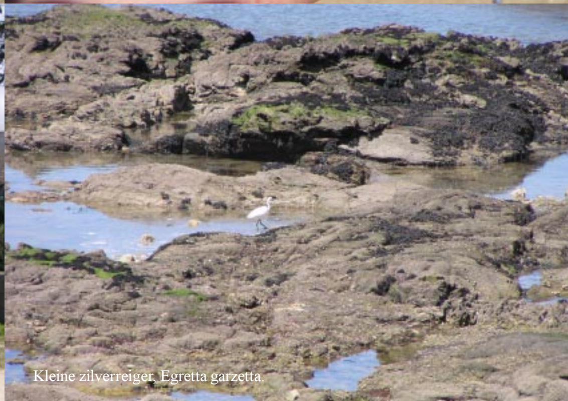
Kleine zilverreiger, Egretta garzetta .