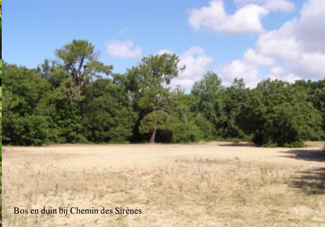
Bos en duin bij Chemin des Sirènes.