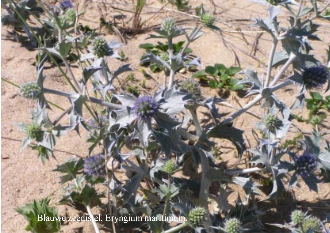
Blauwe zeedis el, Eryngium maritimum .