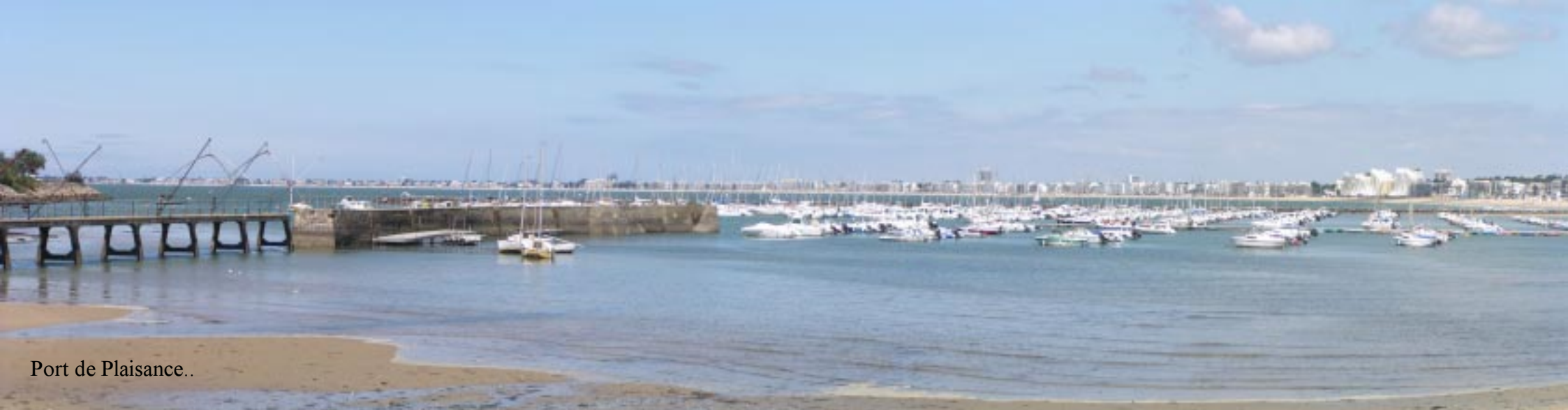
Port de Plaisance..

Na de haven over de Bd de la Republique naar een aflopende markt. Geen wonder, want het is al weer 12.55. Via de lange Av de Prieux en Av. des Noës terug naar Zippy. Terug naar het verslag.