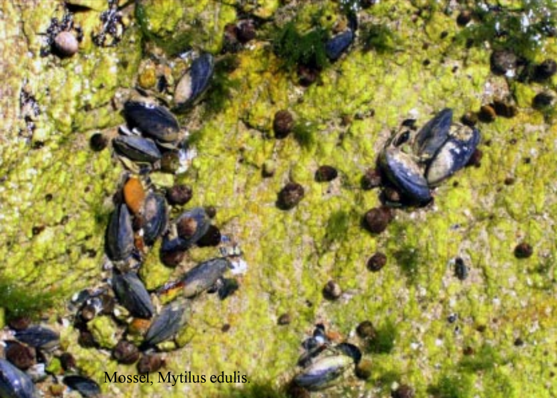
Mossel, Mytilus edulis .