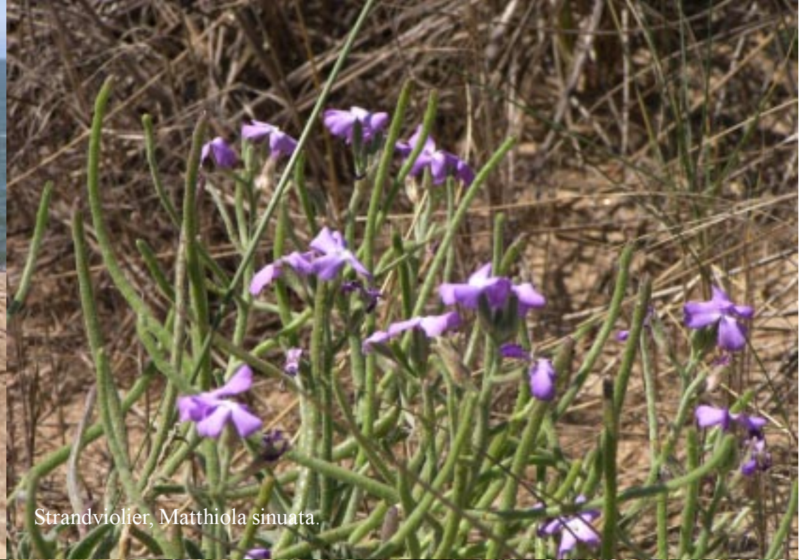
Strandviolier, Matthiola sinuata .