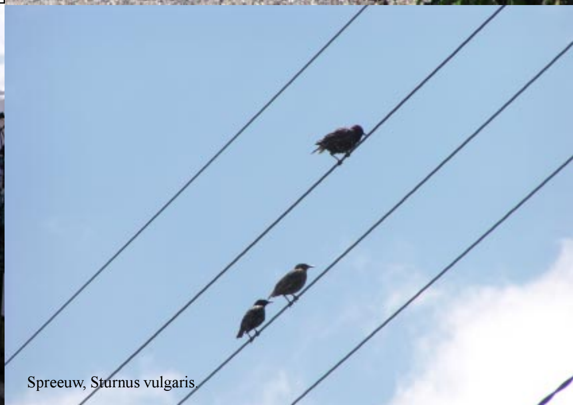
Spreeuw, Sturnus vulgaris .