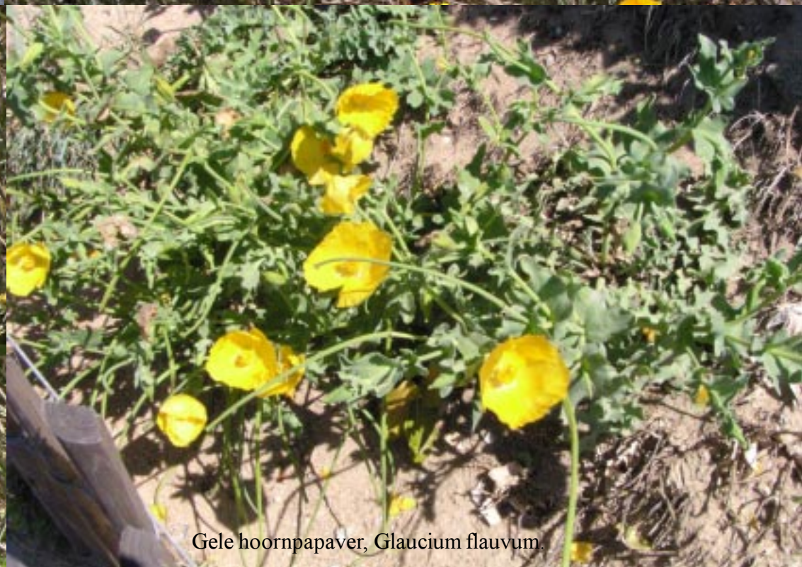
Gele hoornpapaver, Glaucium flavum .