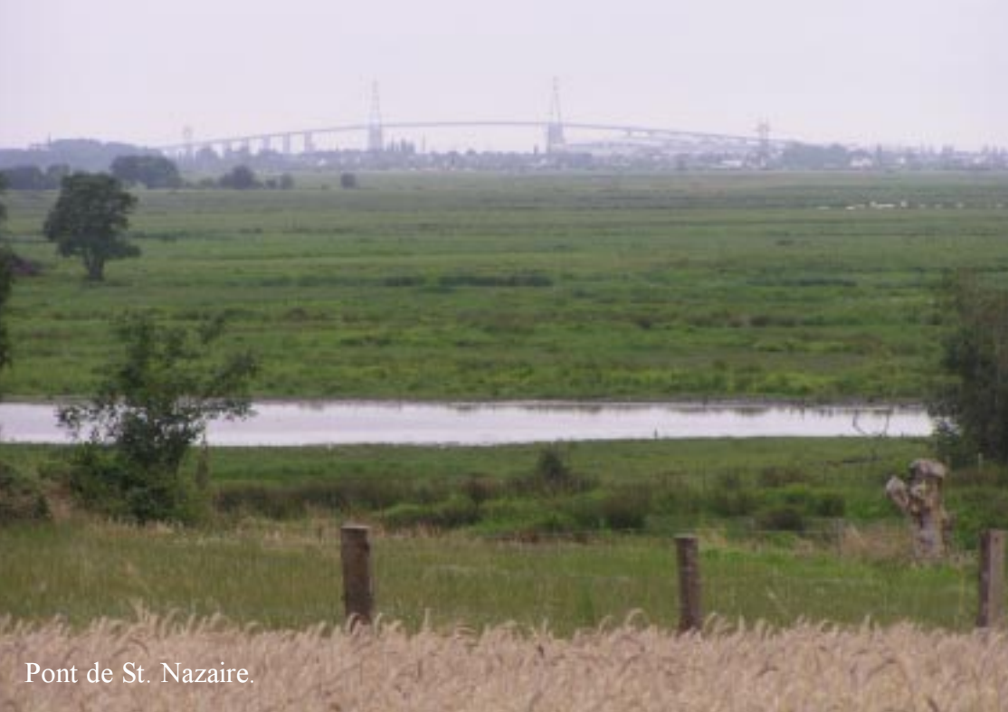
Pont de St. Nazaire.