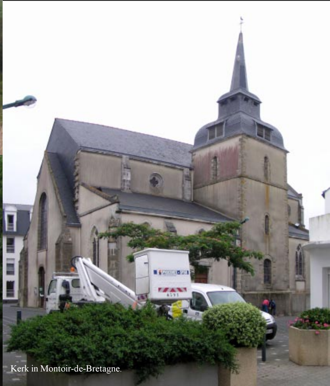
Kerk in Montoir-de-Bretagne.

10.40. Crossac kenmerkt zich door een typisch bleek grijze kerk. Het gangbare type hier blijkt later. Verder staat er een Calvarieberg op een kruispunt. Net buiten het dorp vinden we een dolmen zo'n 50 m een pad links in. De mooiste tot nu toe in deze vakantie. 11.05. In de verte rechts zien we een enorme brug aan de einder. (De Loirebrug bij St. Nazaire.)