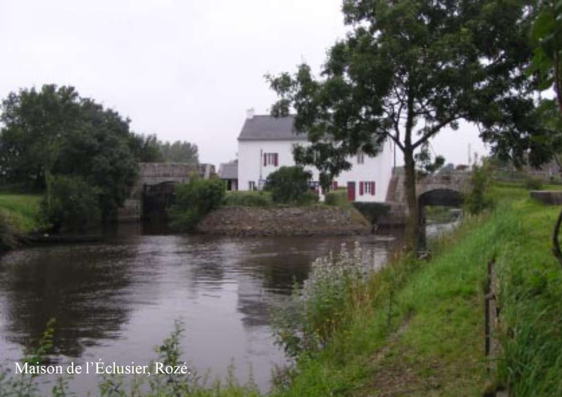
Maison de l'Éclusier, Rozé.