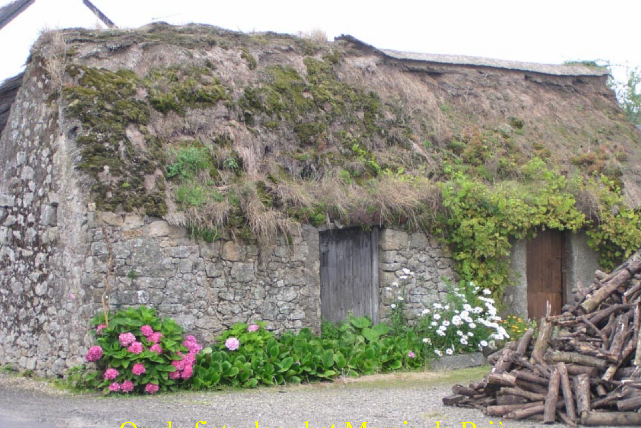
Op de fiets door het Marais de Brière.