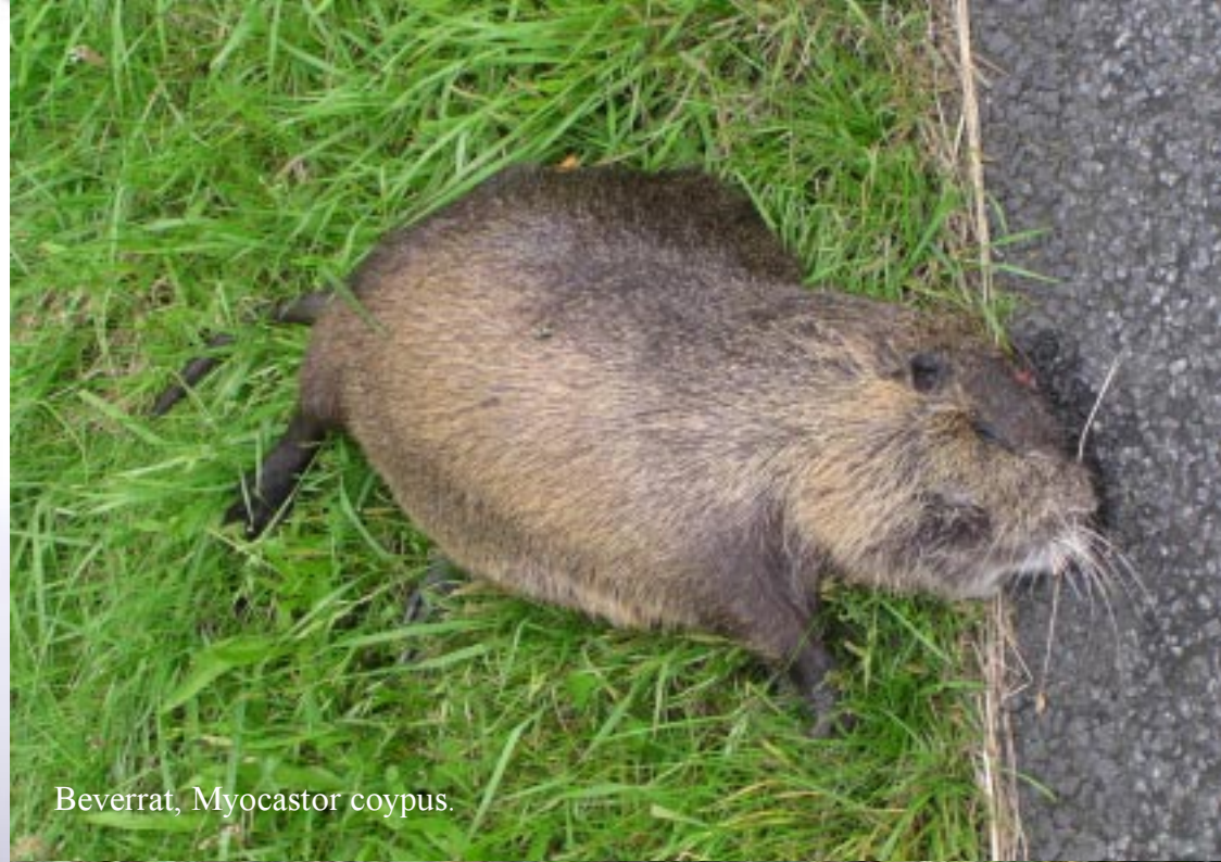
Beverrat, Myocastor coypus .