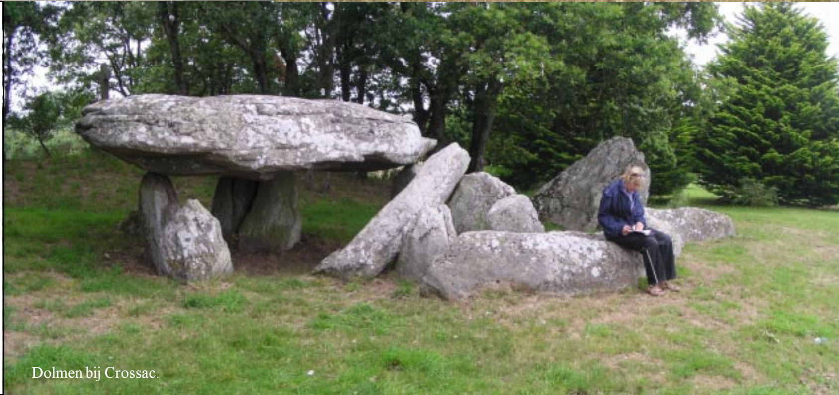
Dolmen bij Crossac.

Ik zie een kreeftje dat agressief zijn scharen in de lucht steekt. Geen slimme methode om gevaar te bejegenen. Een flink aantal van zijn maatjes zijn hier tot gort gereden. Een vrouw weet te vertellen dat ze uit de moerassen komen en niet te eten zijn. Dat is typisch Frans: Waterdieren horen eetbaar te zijn.