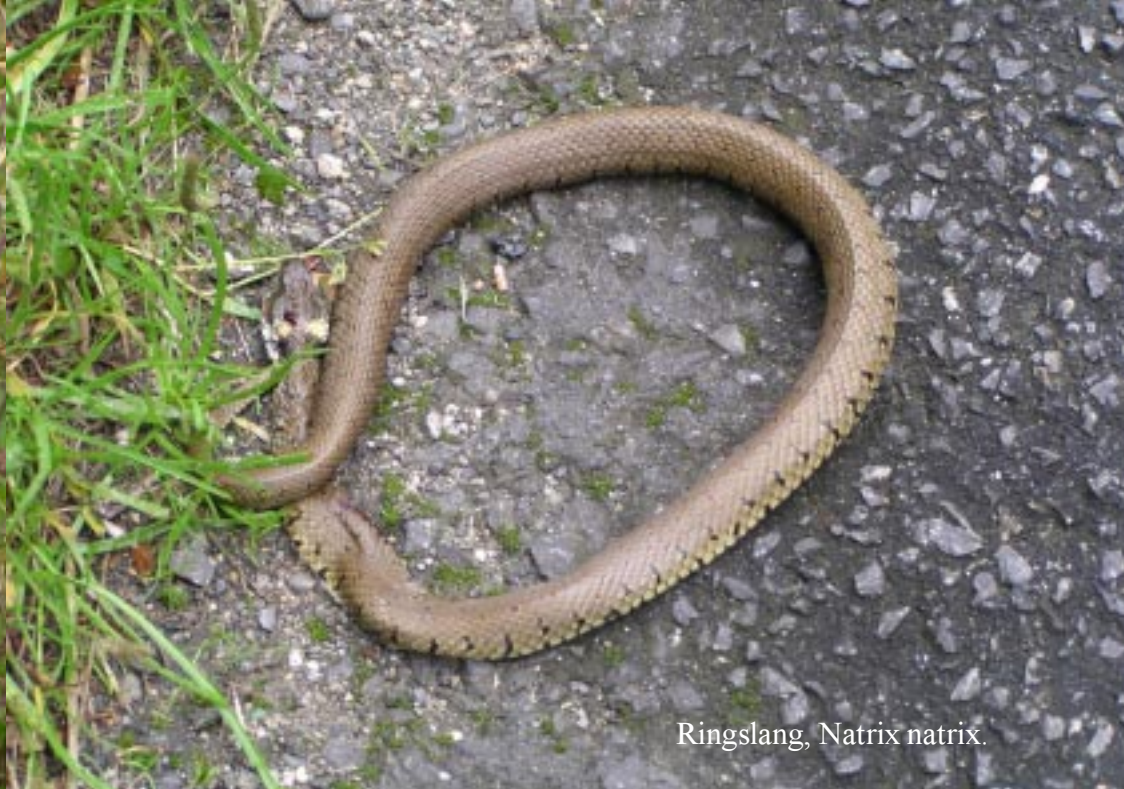
Ringslang, Natrix natrix .