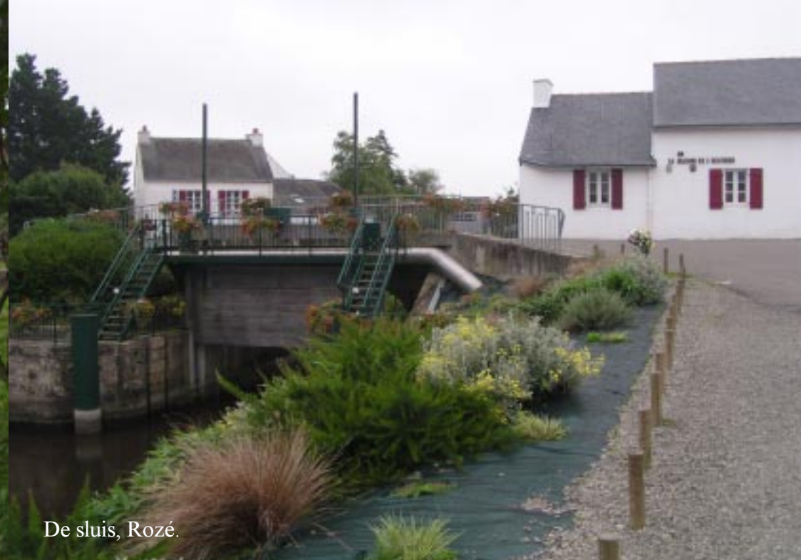
De sluis, Rozé.

Rechtsaf een gravelpad op, bij het Café de la Guesne. De routeomschrijving is hier niet erg eenduidig, maar de afdaling naar rechts een zandpad op is blijkbaar OK. We vinden de Rue du Marais tenminste.