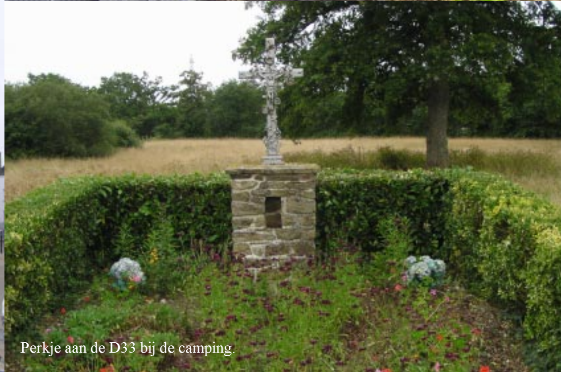
Perkje aan de D33 bij de camping.