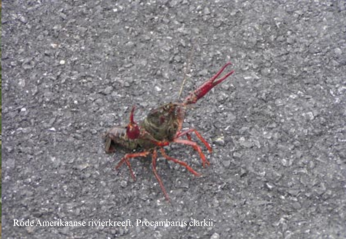
Rode Amerikaanse rivierkreeft, Procambarus clarkii .

Donderdag 12-7-2007. Rondje door het Marais de Briere. We komen er pas om negen uur eruit! Na het ontbijt gaan we ondanks het miezerige weer toch op pad met de fietsen. We doen fietstocht 4 uit de Actief & anders gids Bretagne.