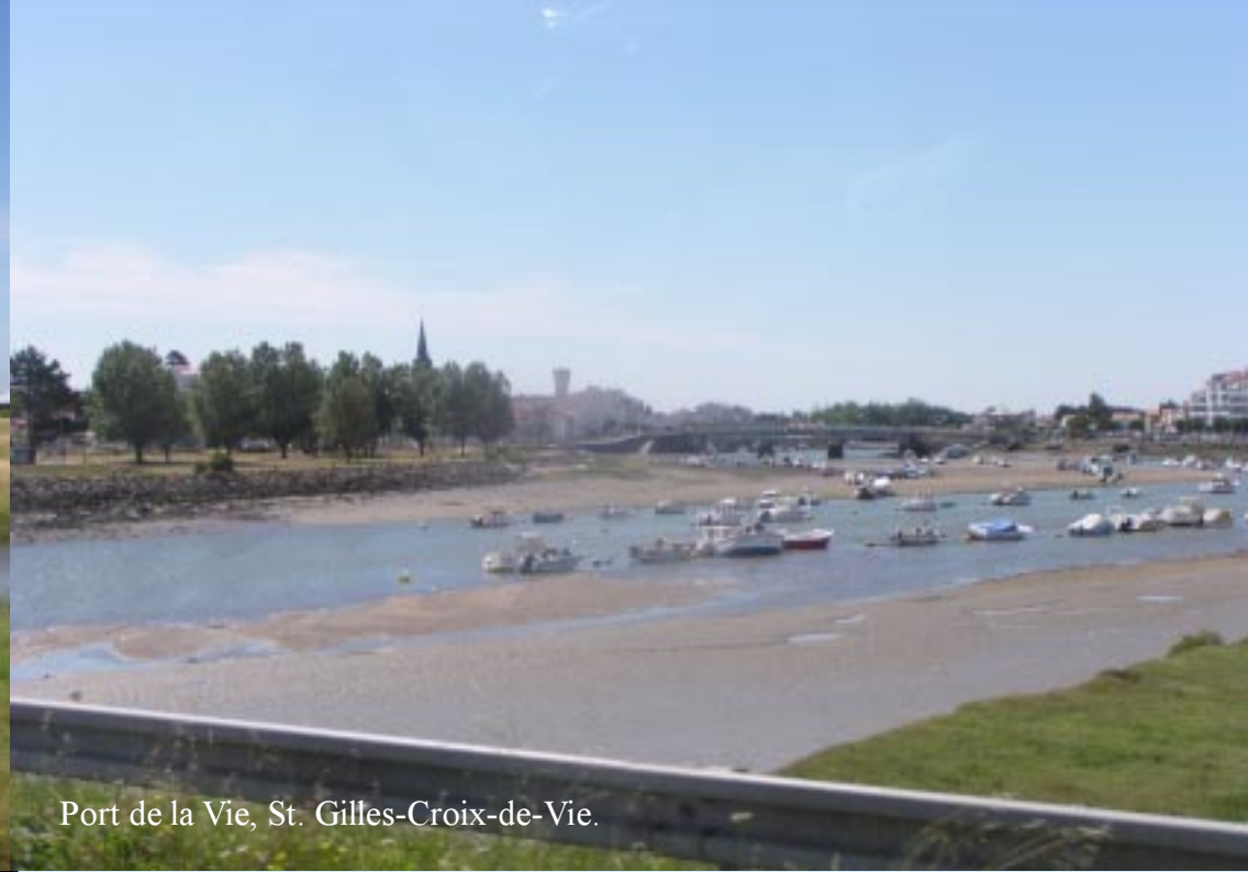
Port de la Vie, St. Gilles-Croix-de-Vie.

Na Bourneuf komt het Marais Breton. Bourgneuf, De Bouin en Beauvoir liggen tussen natte graslanden en watertjes. Dit "moeras" is veel sterker dan in het Marais de Brière cultuurland. En daarom ook minder interessant.