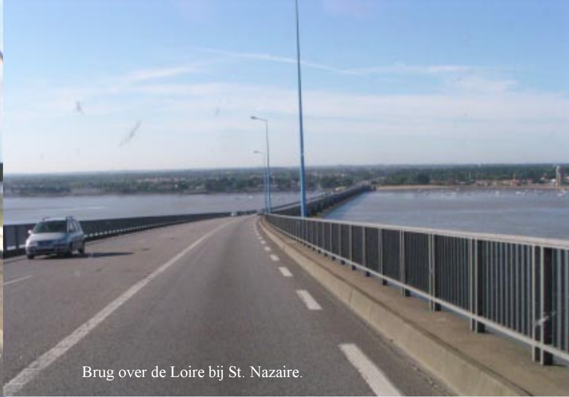
Brug over de Loire bij St. Nazaire.