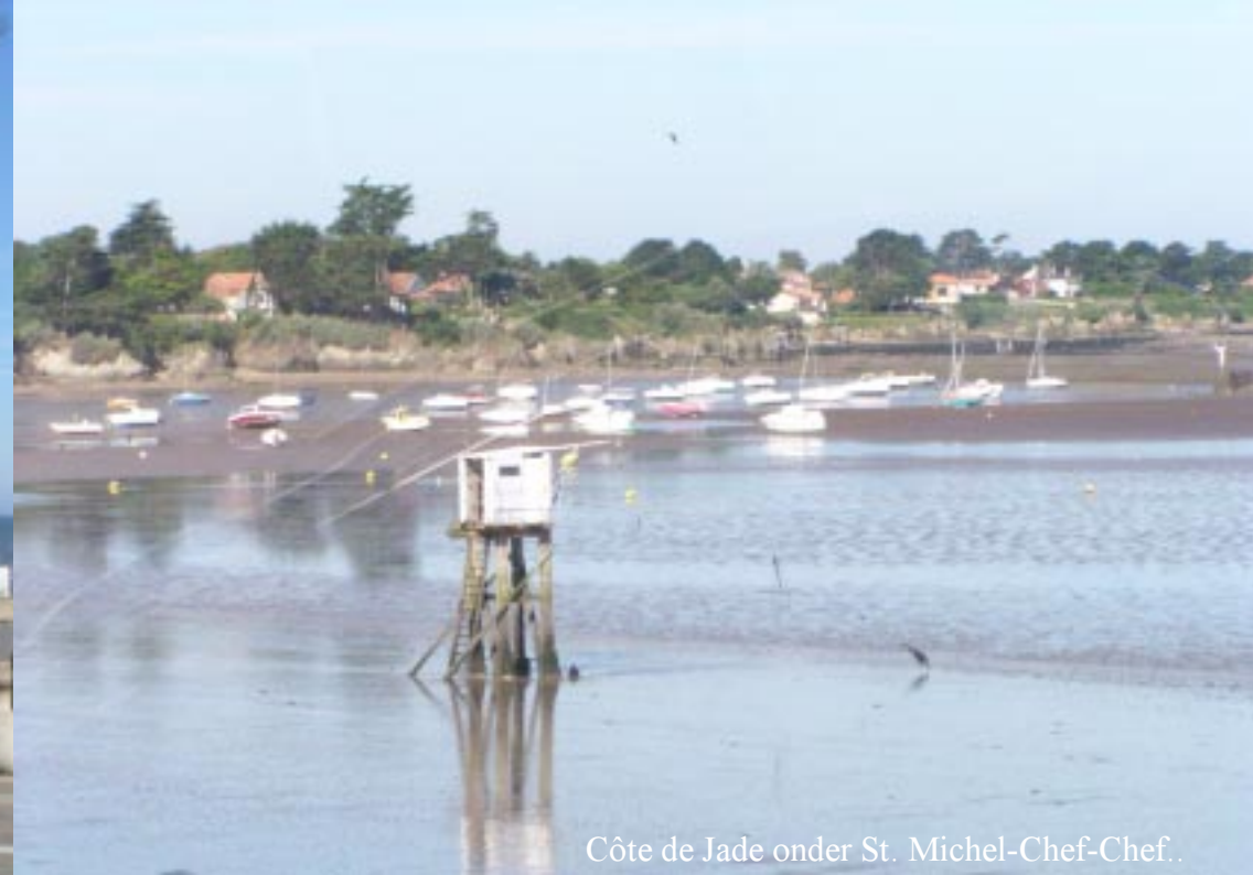
Côte de Jade onder St. Michel-Chef-Chef.