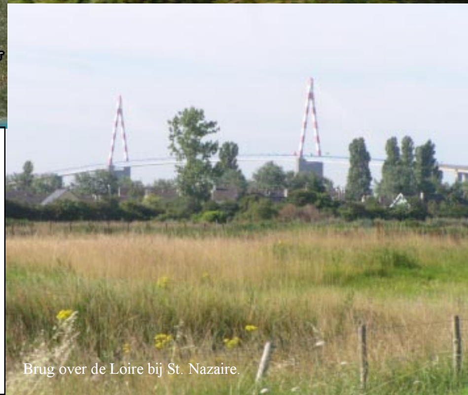
Brug over de Loire bij St. Nazaire.