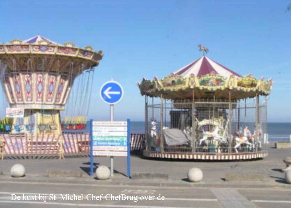
De kust bij St. Michel-Chef-Chef Brug over de