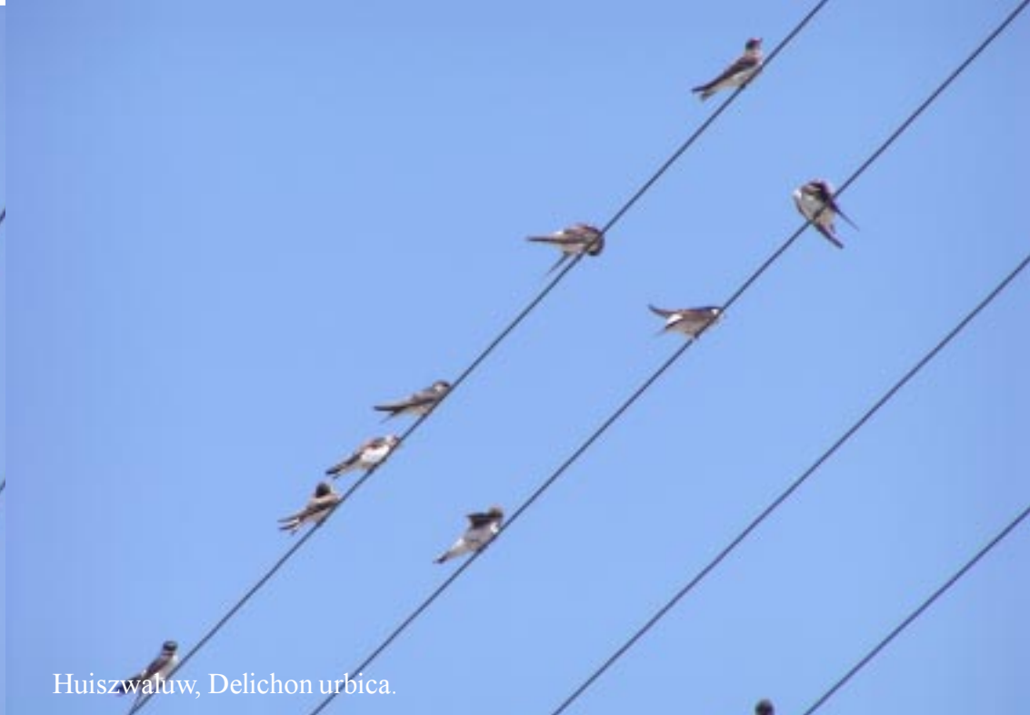
Huiszwaluw, Delichon urbica .