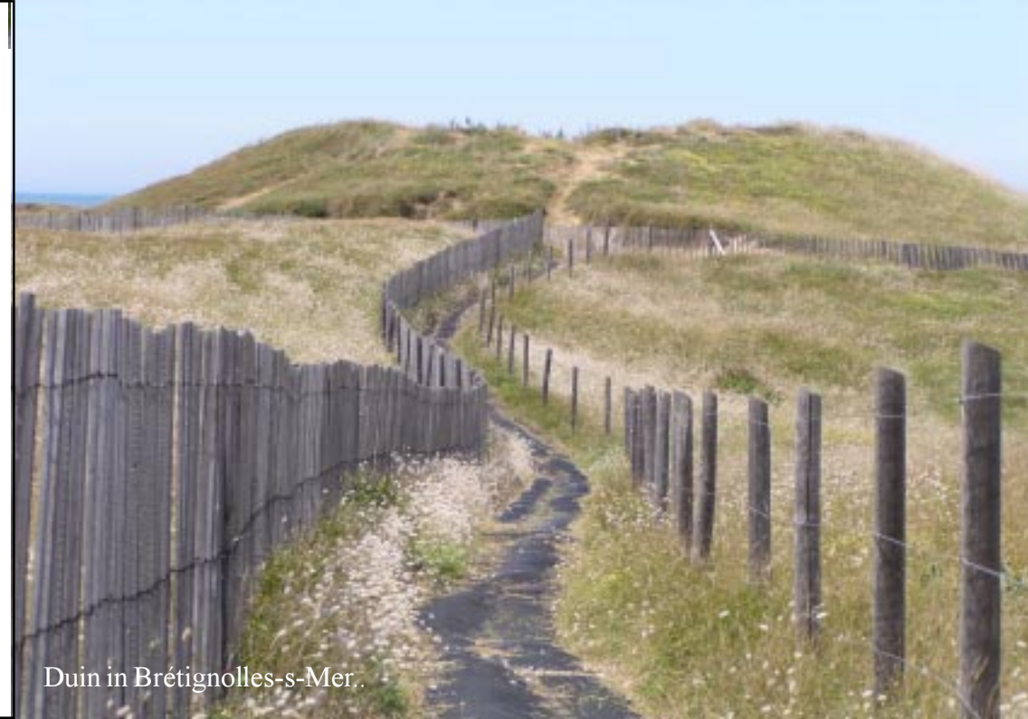
Duin in Bretignolles-s-Mer.

Klik op de foto rechts voor het verslag van deze wandeling.