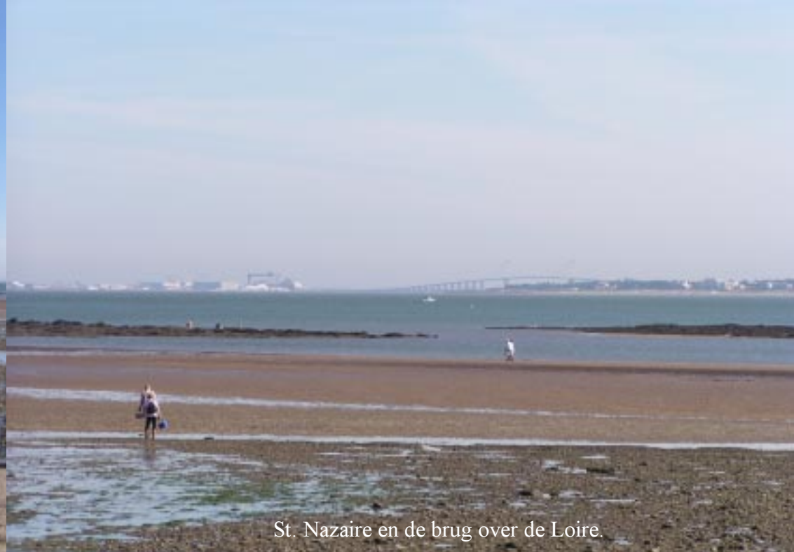
St. Nazaire en de brug over de Loire.