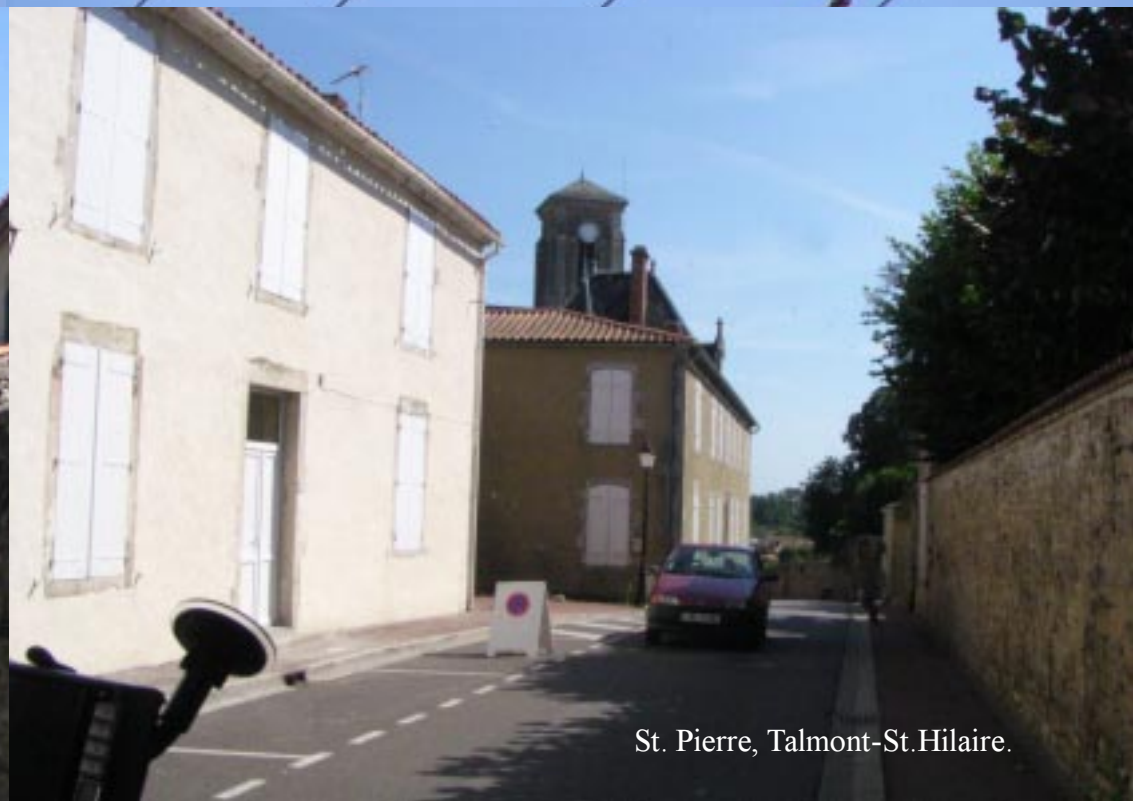
St. Pierre, Talmont-St.Hilaire.