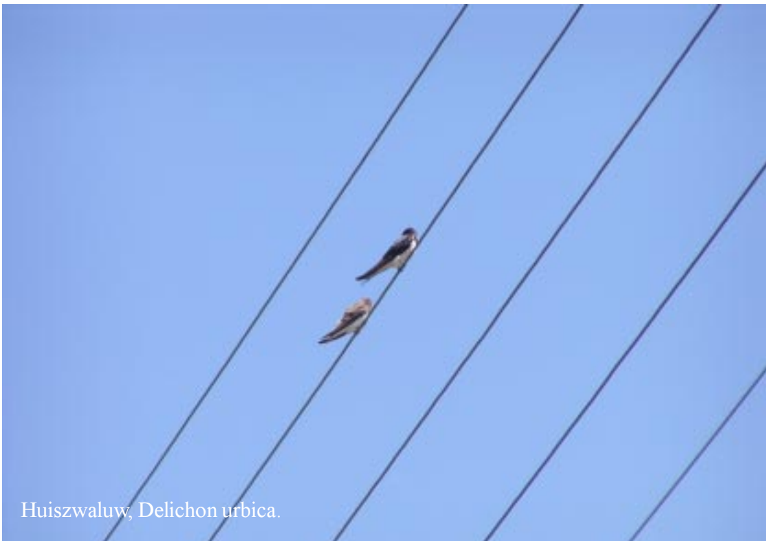
Huiszwaluw, Delichon urbica .