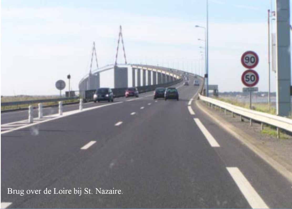
Brug over de Loire bij St. Nazaire.