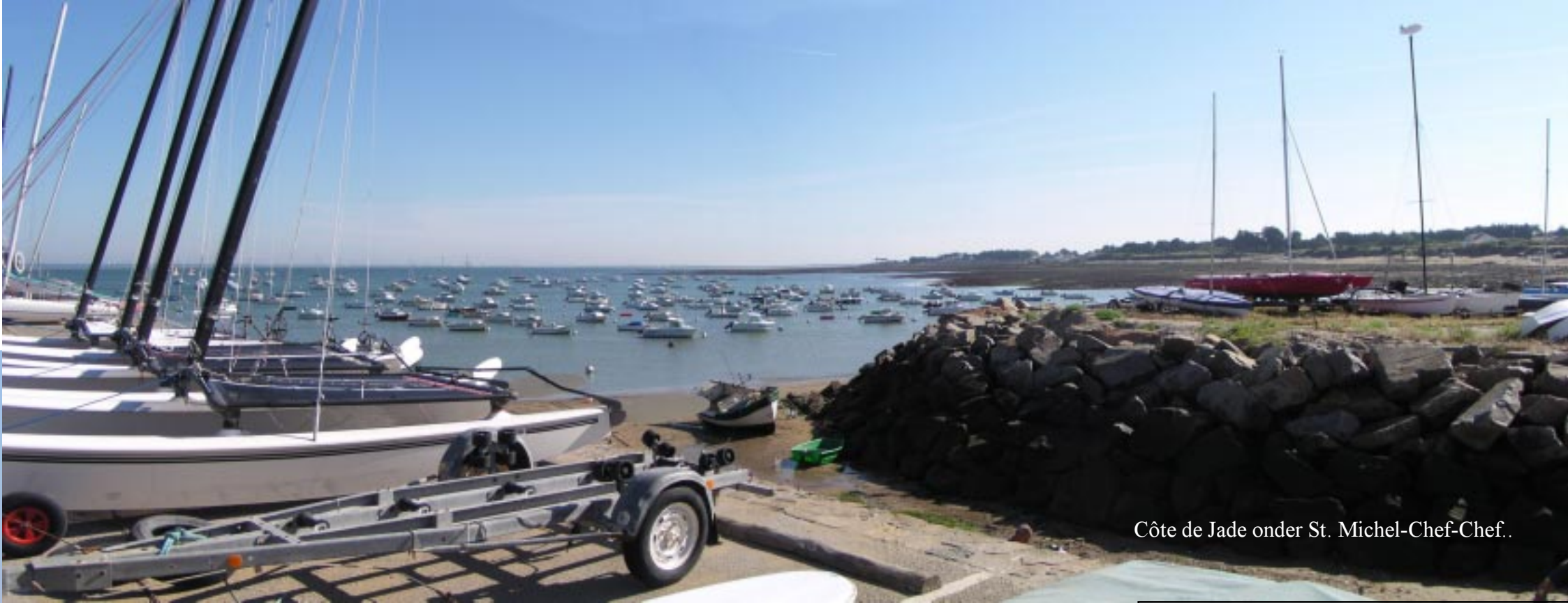
Côte de Jade onder St. Michel-Chef-Chef..