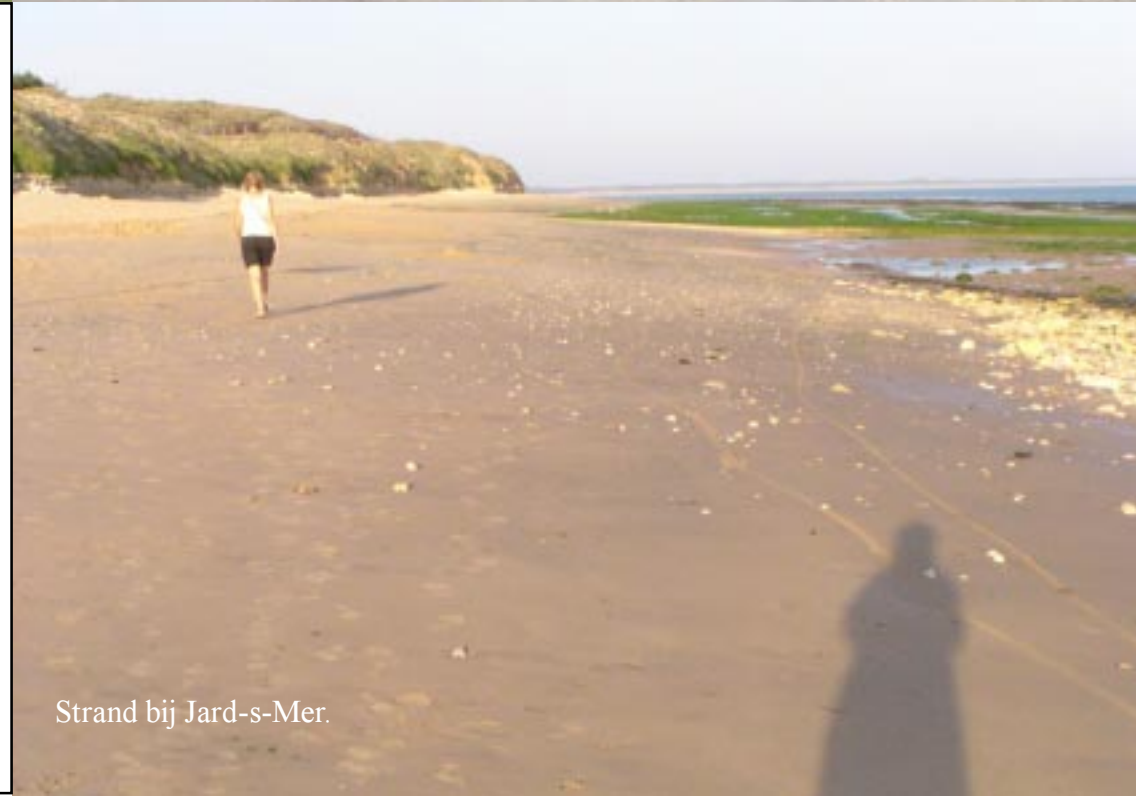
Strand bij Jard-s-Mer.

Veel puf is er niet meer over bij thuiskomst en zo blijft het deze avond verder bij wat lezen.