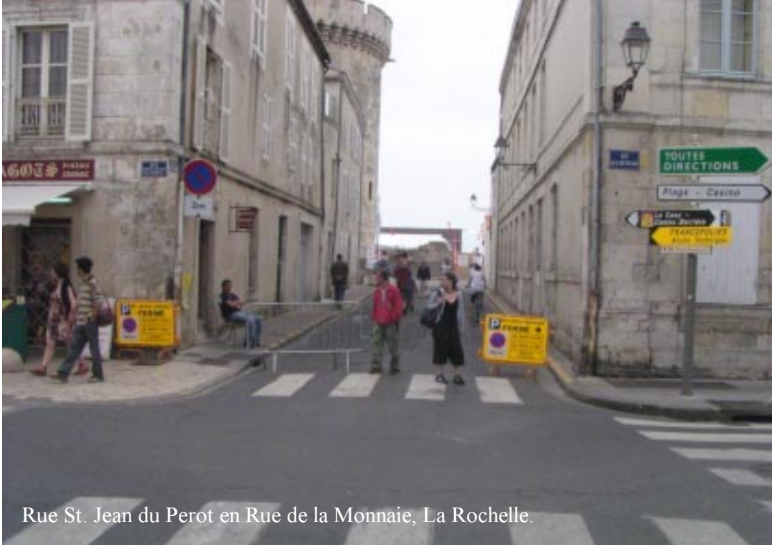
Rue St. Jean du Perot en Rue de la Monnaie, La Rochelle.

11.45 rijden we La Rochelle in. We proberen tevergeefs in de buurt van de Plage een parkeerplaats te vinden. 3x gaat het door een park en bloemenstraatje bij de Rue Franck Delmas. Allerlei Quartorze Juillet activiteiten zien we onderweg door het mooie centrum. Met veel gevoel voor magie loodst de MIO ons dwars de historische binnenstad met zijn smalle en zeer drukke straten. Typisch zijn de gallerijen à la Bern.