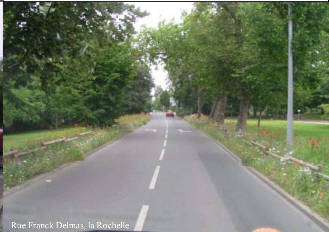
Rue Franck Delmas, la Rochelle.