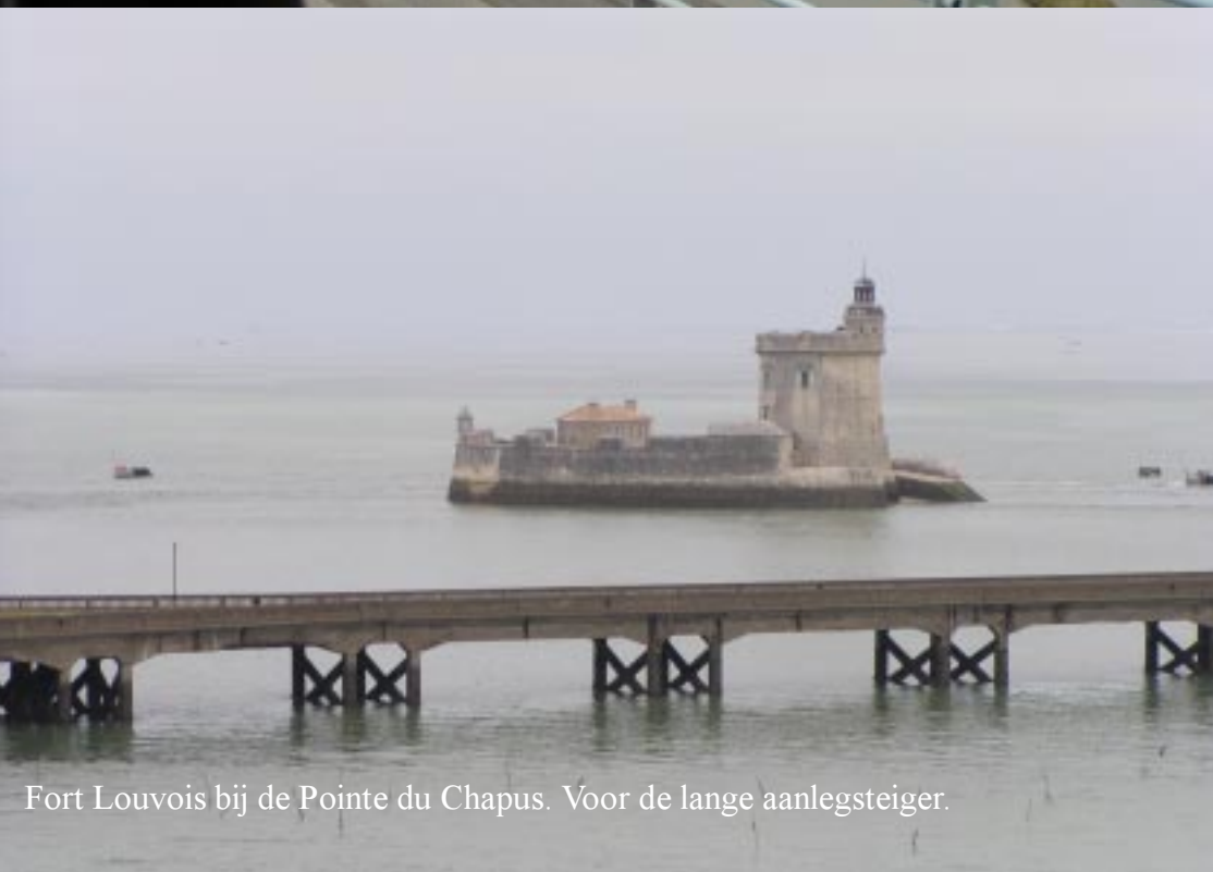
Fort Louvois bij de Pointe du Chapus. Voor de lange aanlegsteiger.

De D123 doet zijn naam eer aan, zodat om twee uur de brug naar Ile d'Oleron overgestoken wordt. Rechts ligt het Fort Louvois. Het pad van Pointe du Chapus erheen ligt nu nog onder water. Ook rechts liggen de twee zeer lange aanlegsteigers. Die werden vroeger gebruikt door de veerboten, die de Coureau d'Oleron over moesten steken.