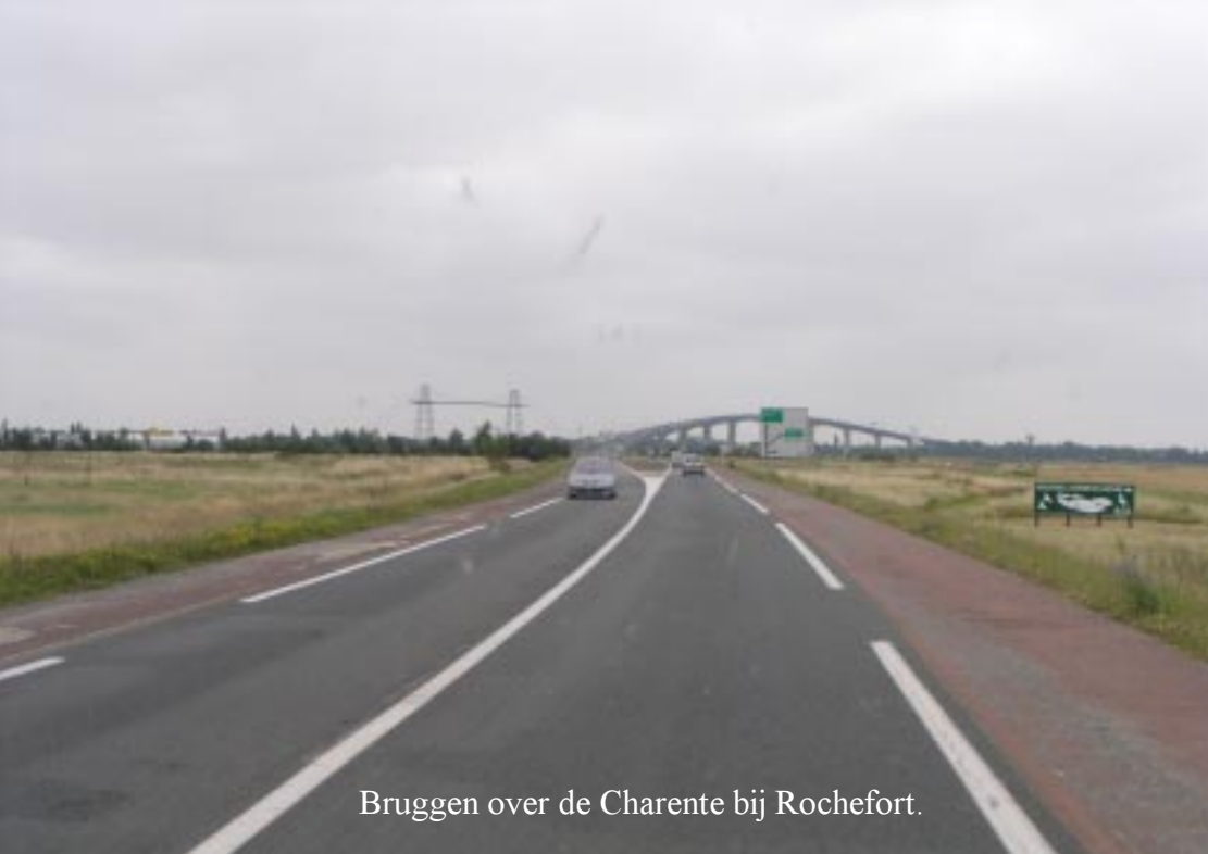
Bruggen over de Charente bij Rochefort.

Om half twee steken we onder Rochefort de Charente over. Links zien we weer de "Ancient Pont Transpordeur la Renaissance". Die kennen we nog van de terugreis uit Portugal (2001), toen we in Fouras geweest zijn.