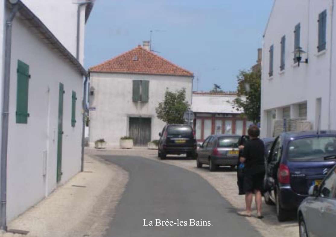
La Brée-les Bains.