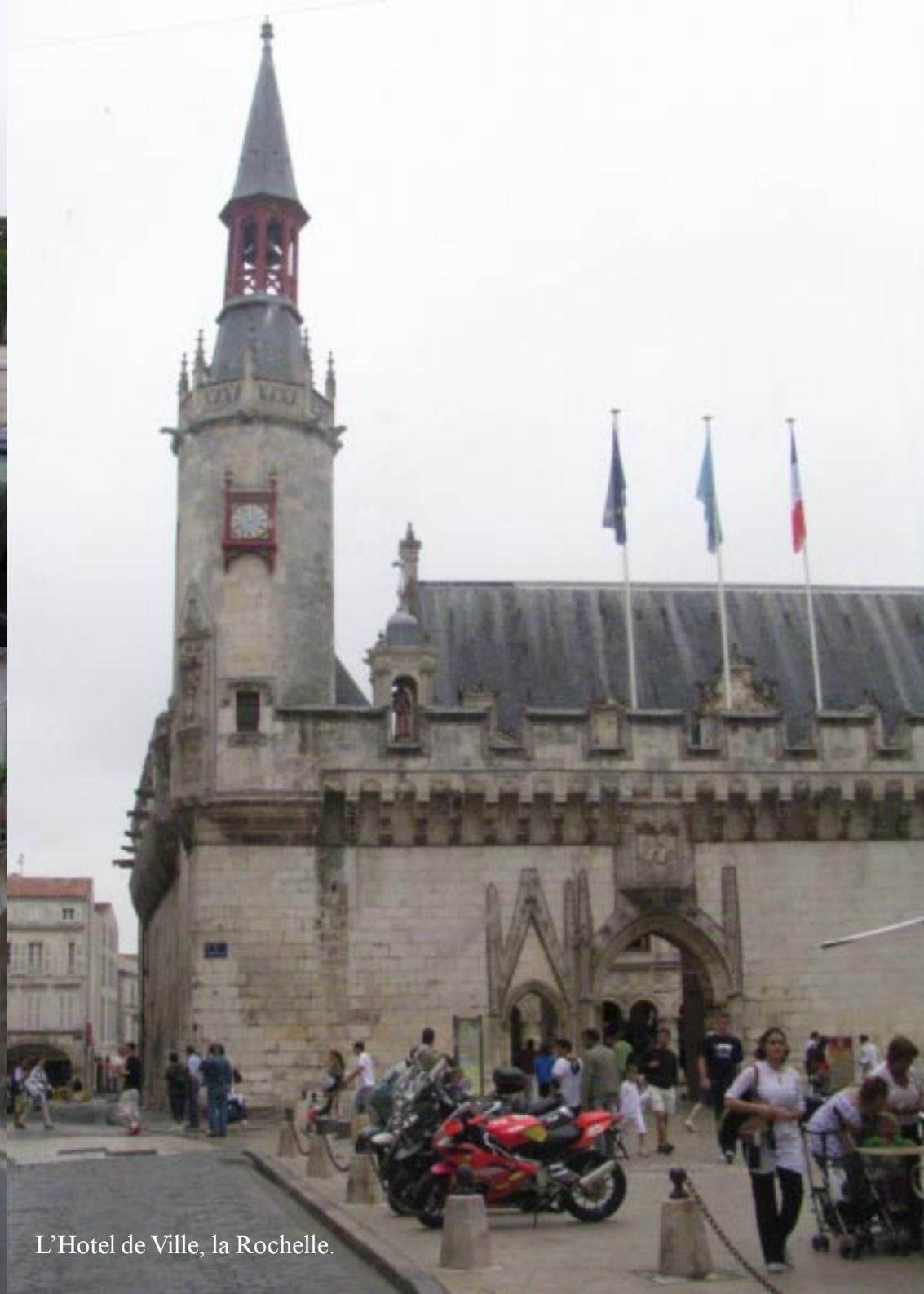
L'Hotel de Ville, la Rochelle.