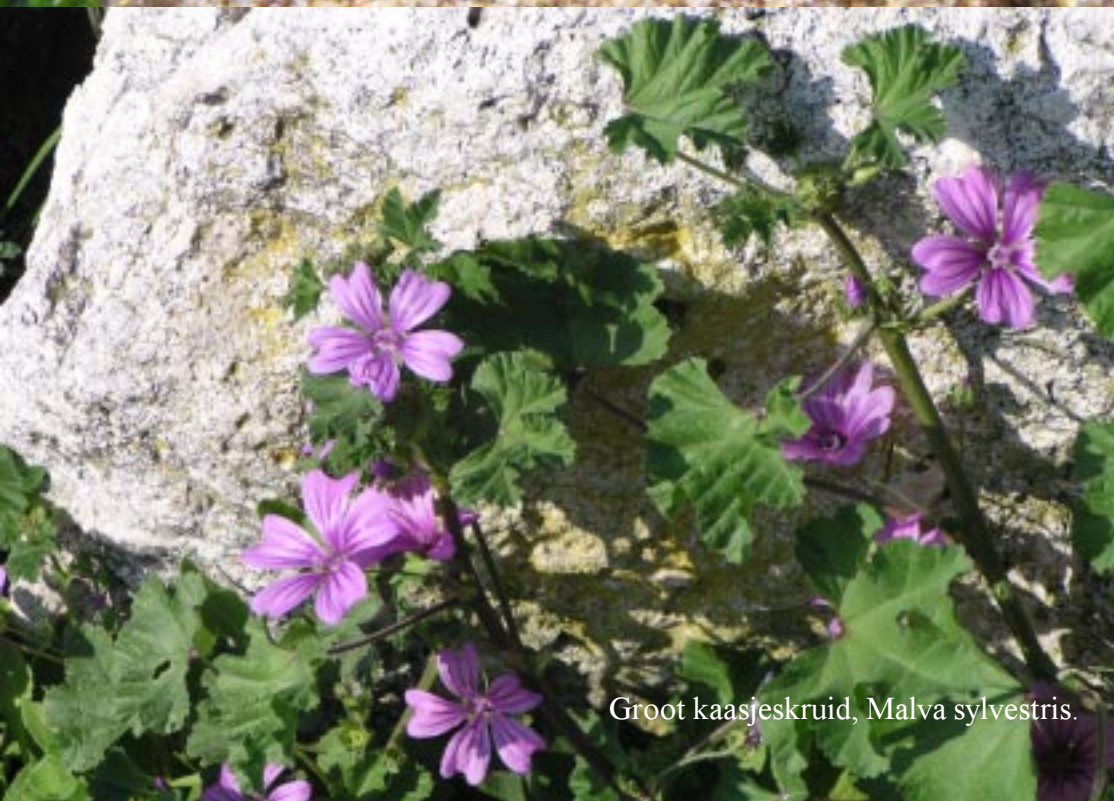
Groot kaasjeskruid, Malva sylvestris .

Later gaan we op het strand kijken naar het volk, de lange kuststrook, het ford Boyard, de brug van het vasteland naar Ile de Ré. Ik zie kleine garnaalachtige beestjes in het grove strandzand.