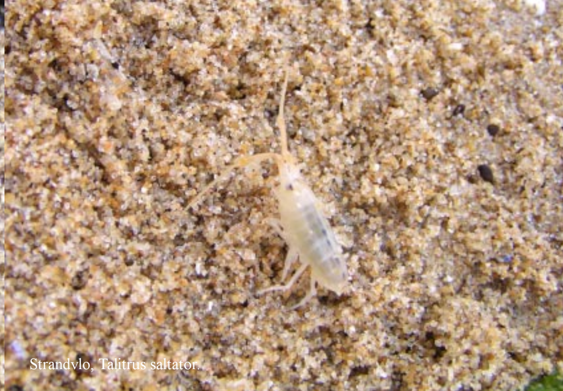
Strandvlo, Talitrus saltator .