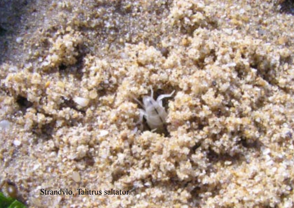
Strandvlo, Talitrus saltator .