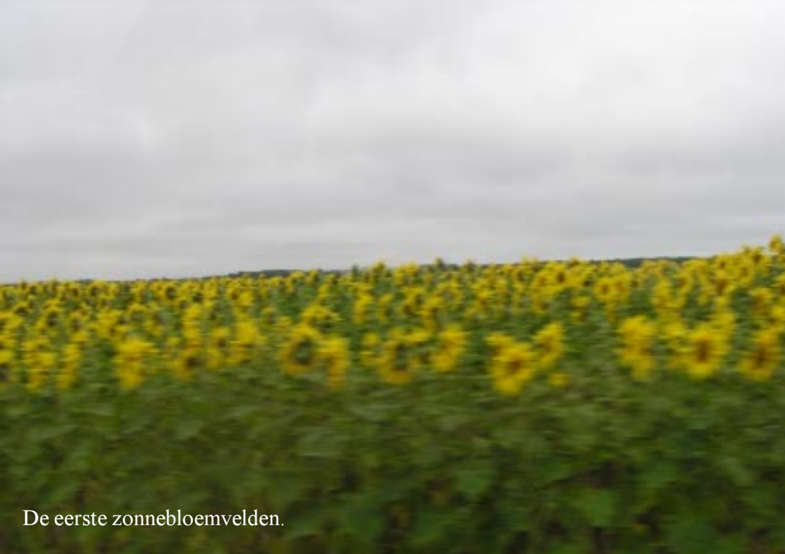
De eerste zonnebloemvelden.