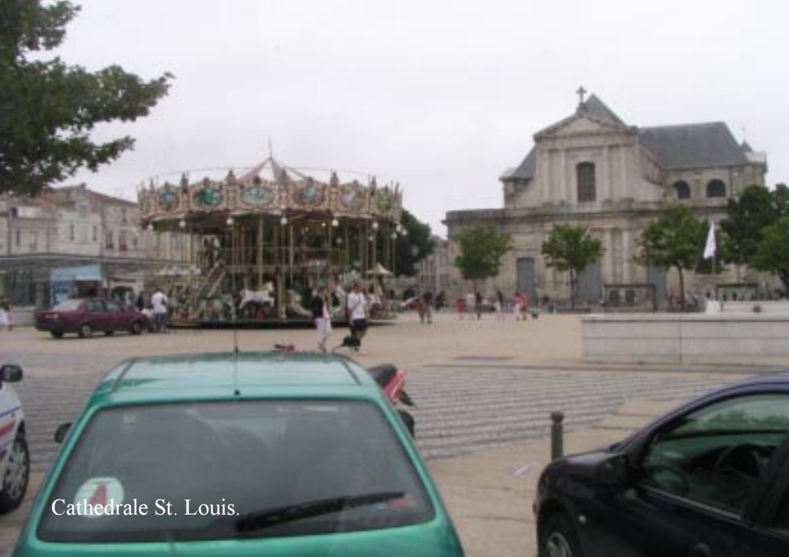
Cathedrale St. Louis.