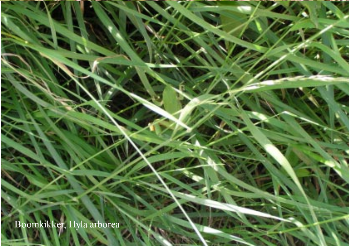
Boomkikker, Hyla arborea .