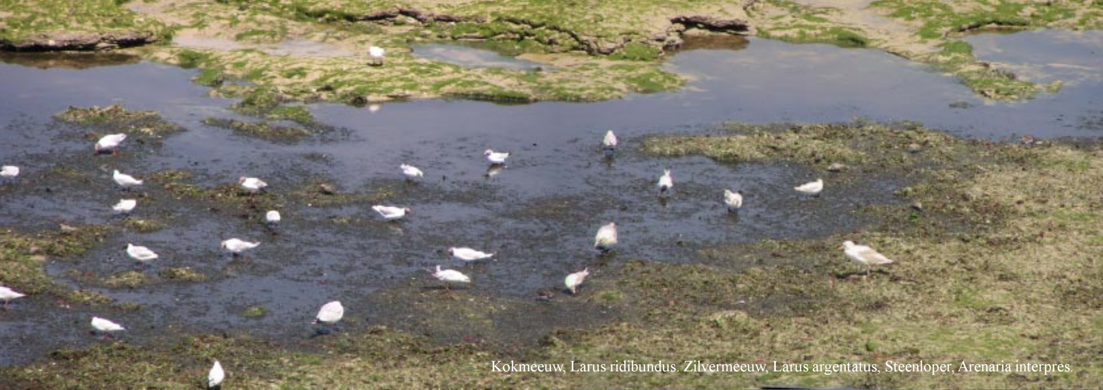
Kokmeeuw, Larus ridibundus . Zilvermeeuw, Larus argentatus , Steenloper, Arenaria interpres .