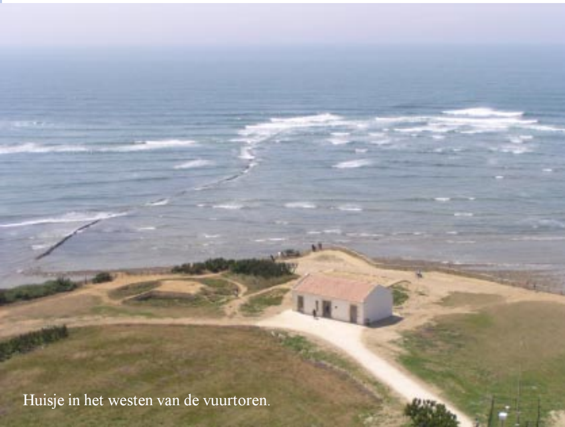
Huisje in het westen van de vuurtoren.

Ik maak toch foto's in de 4 windrichtingen, want dichterbij is er genoeg te zien. Om de vuurtoren ligt bijvoorbeeld een mooie tuin met tableau's over de geschiedenis van de vuurtoren en wat technische speeltjes.