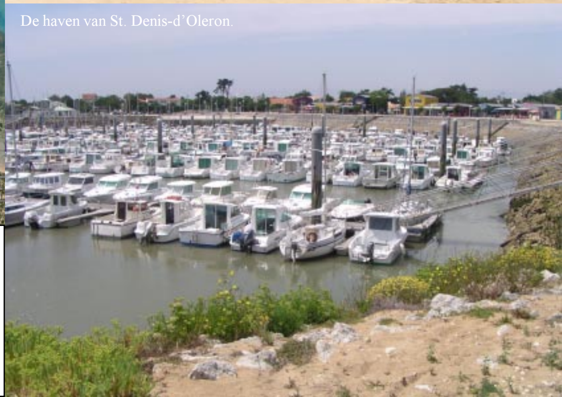
De haven van St. Denis-d'Oleron.