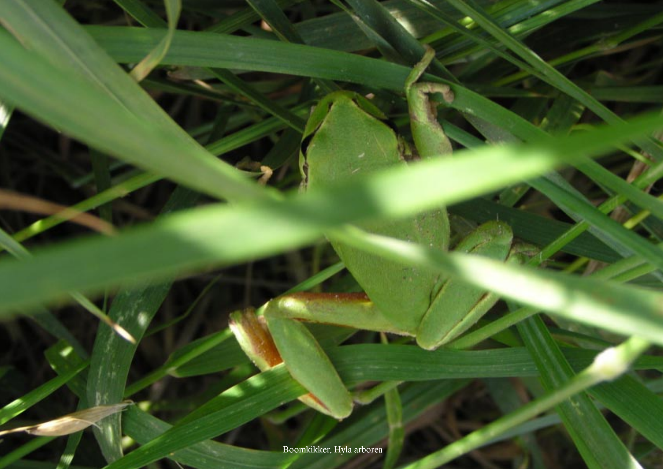
Boomkikker, Hyla arborea