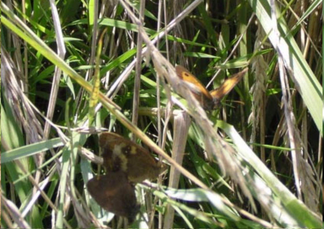
Oranje zandoogje, Pyronia tithonus .