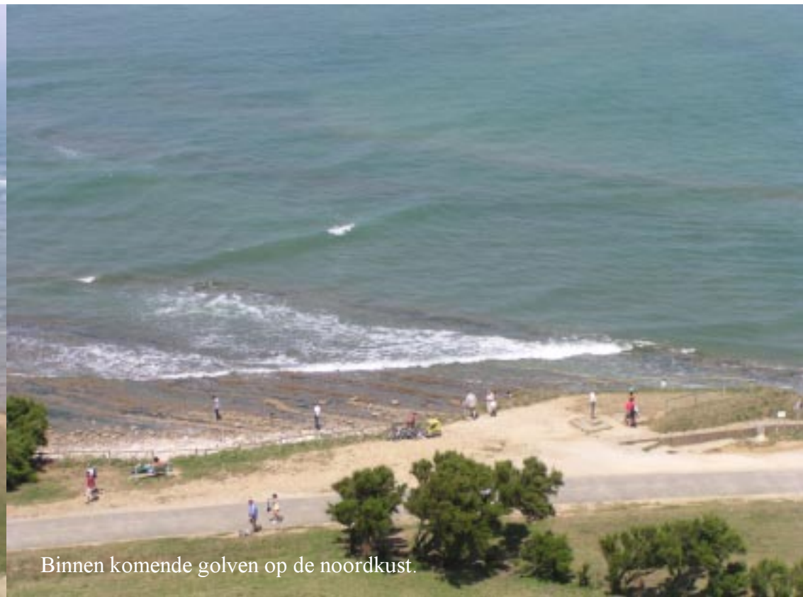
Binnen komende golven op de noordkust.