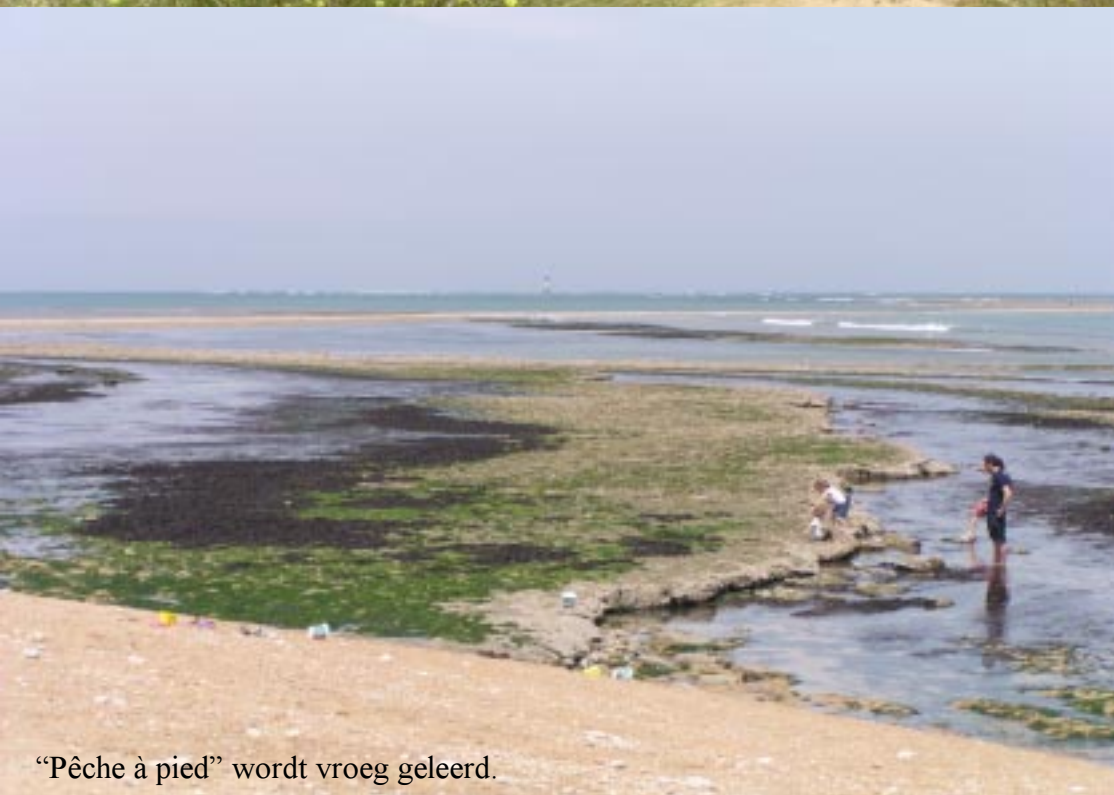
“Pêche à pied” wordt vroeg geleerd.