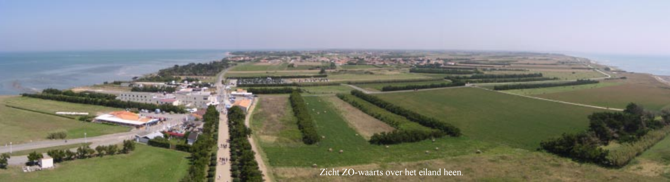
Zicht ZO-waarts over het eiland heen.

Via het gehucht Chassiron door naar de vuurtoren met die naam. We klimmen de 224 treden op. Het zicht is prachtig. Helaas is de vertenevel nu te sterk om iets aan het vasteland te herkennen.