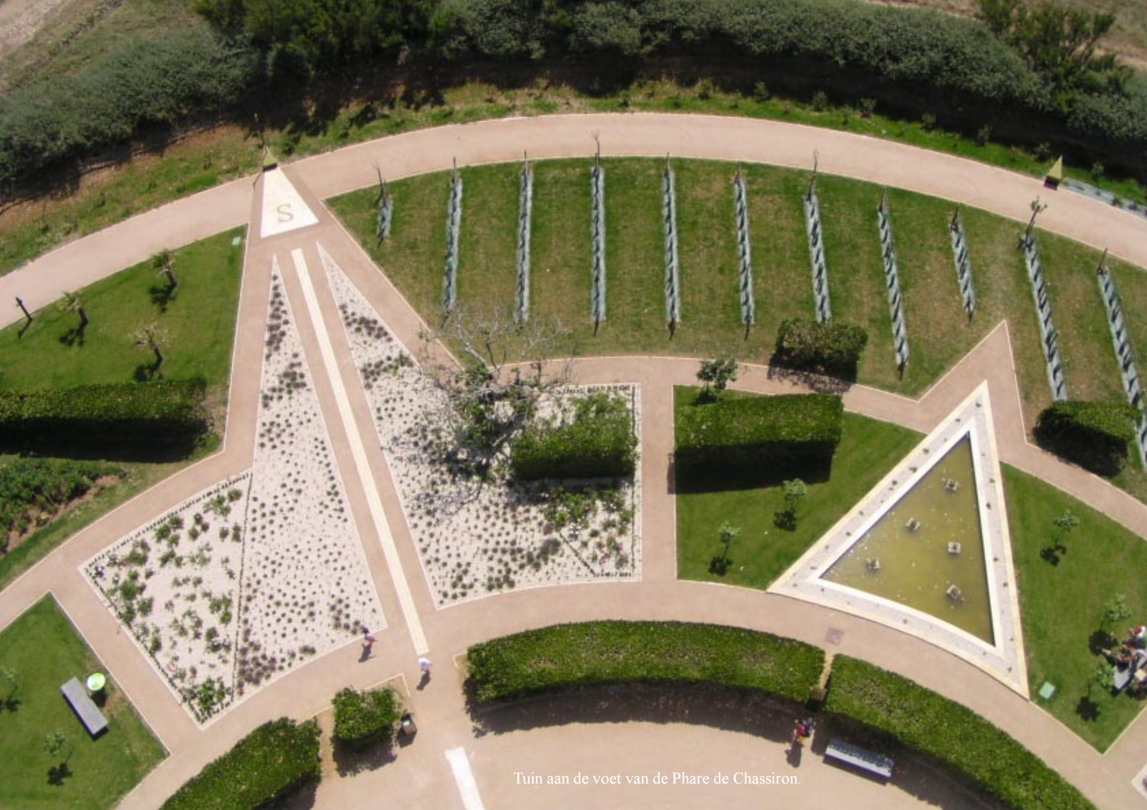
Tuin aan de voet van de Phare de Chassiron.