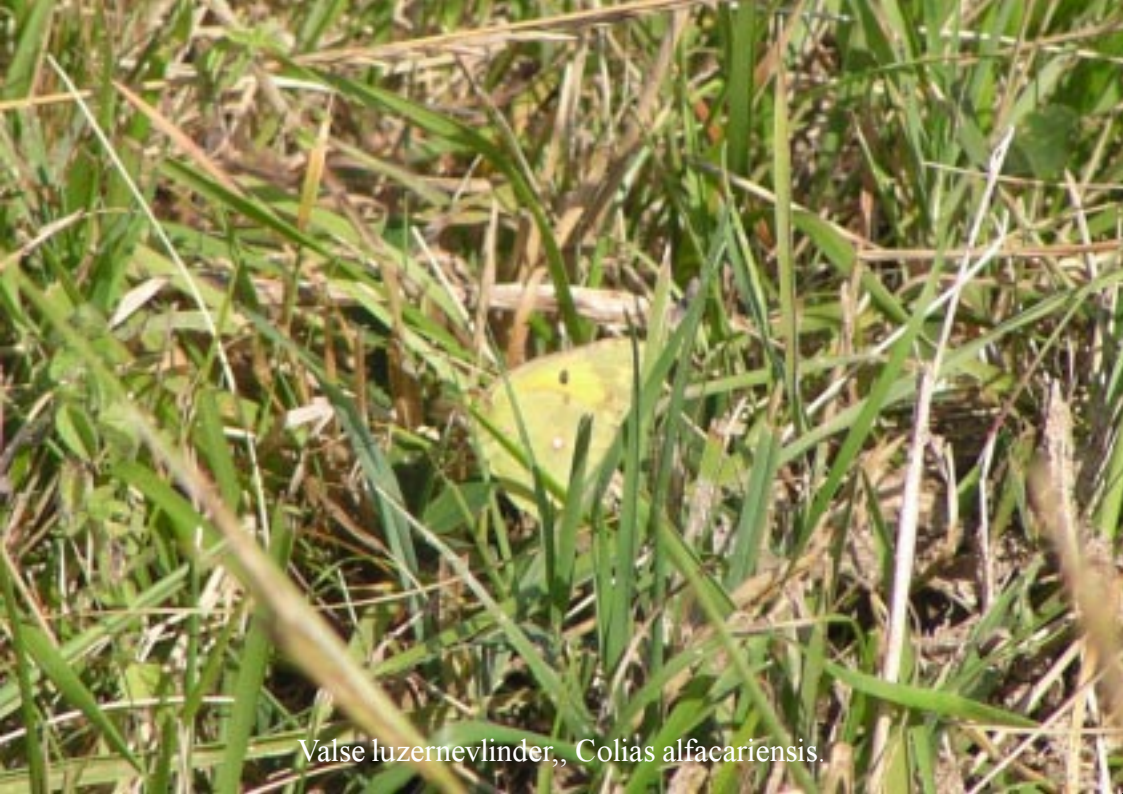
Valse luzernevlinder, Colias alfacariensis .