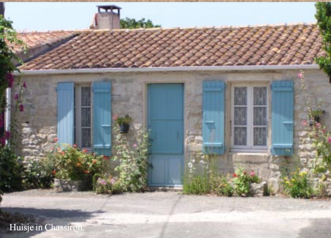
Huisje in Chassiron.