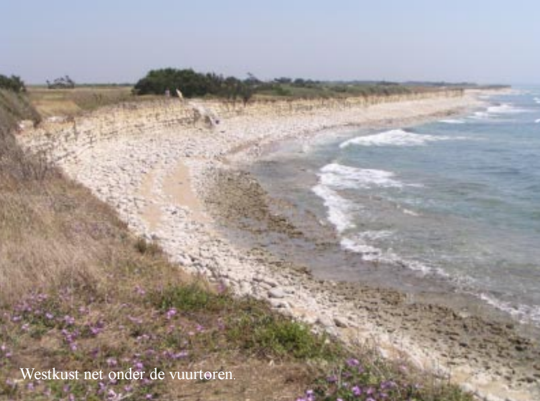
Westkust net onder de vuurtoren.