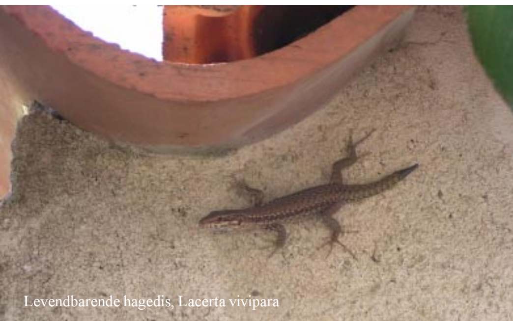
Levendbarende hagedis, Lacerta vivipara

Op het plein aan de haven treedt een zevental jonge mensen op, met een verhaal voor de jeugd, vol acrobatiek, show en jongleren. Tineke vertelt intussen over "het Verdriet van België" van hugo Claus. Terwijl we terug rijden naar de camping begint de lucht te betrekken, de wind steekt op. Het wordt kouder. 's Avonds brengen we de tijd door met lezen. Buiten steekt een langdurige onweersbui op. Het het regent hard. Weerlicht en donder weerklinken tot de kleine uurtjes weer langer worden.