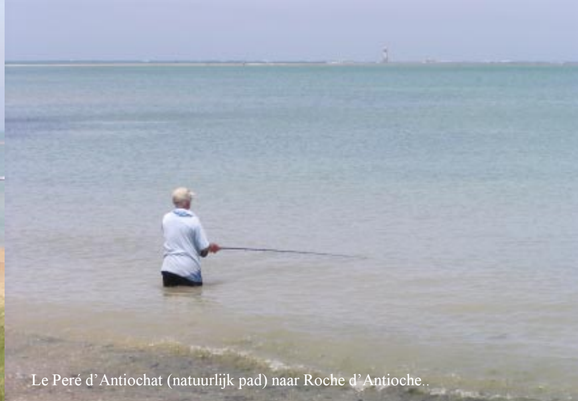
Le Peré d'Antiochat (natuurlijk pad) naar Roche d'Antioche..