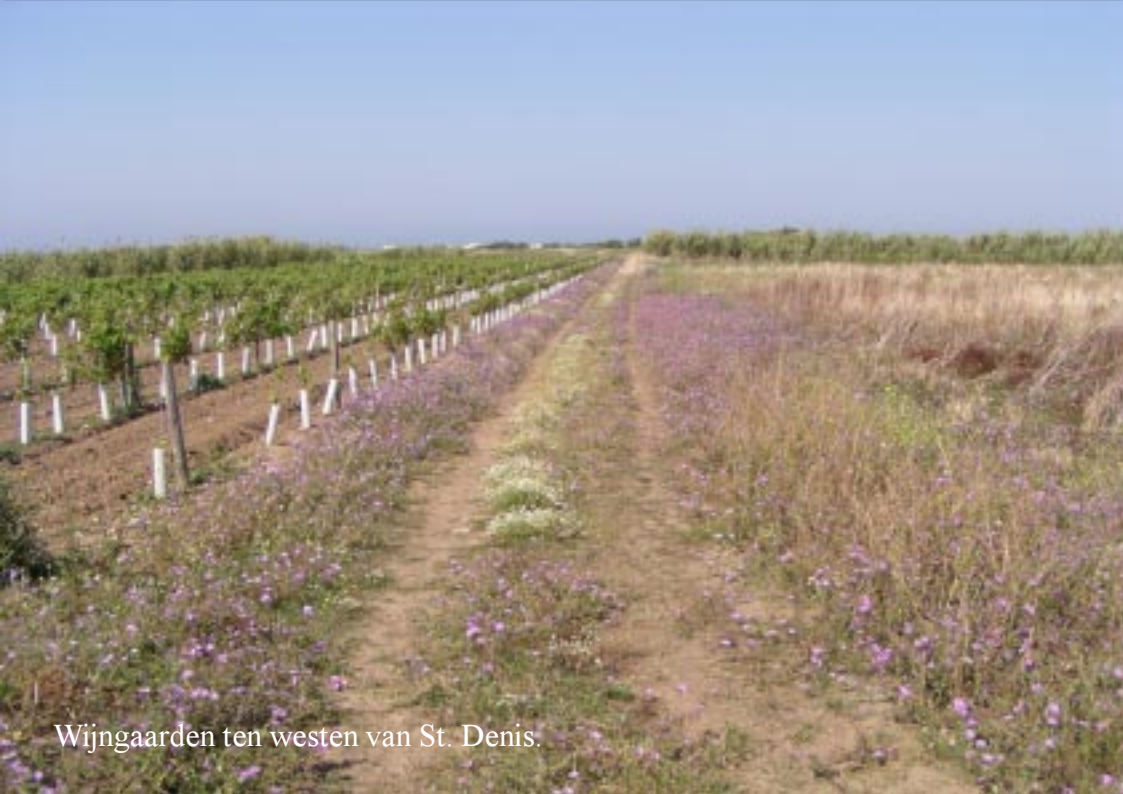
Wijngaarden ten westen van St. Denis.