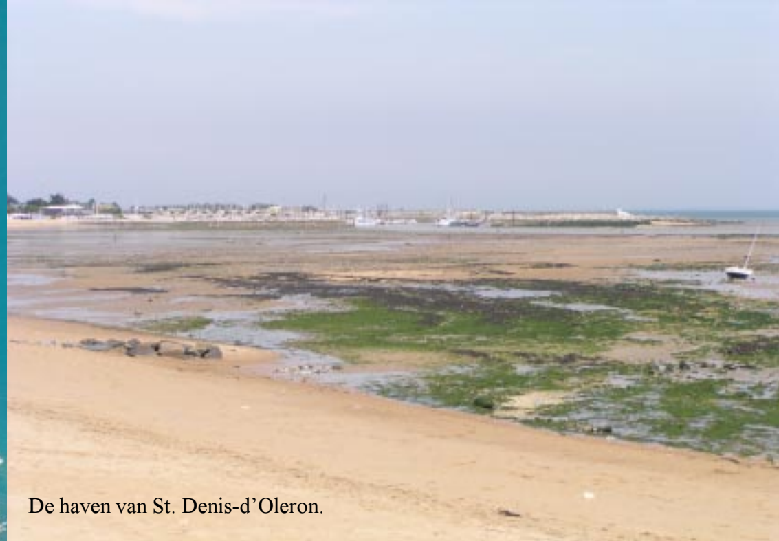
De haven van St. Denis-d'Oleron.