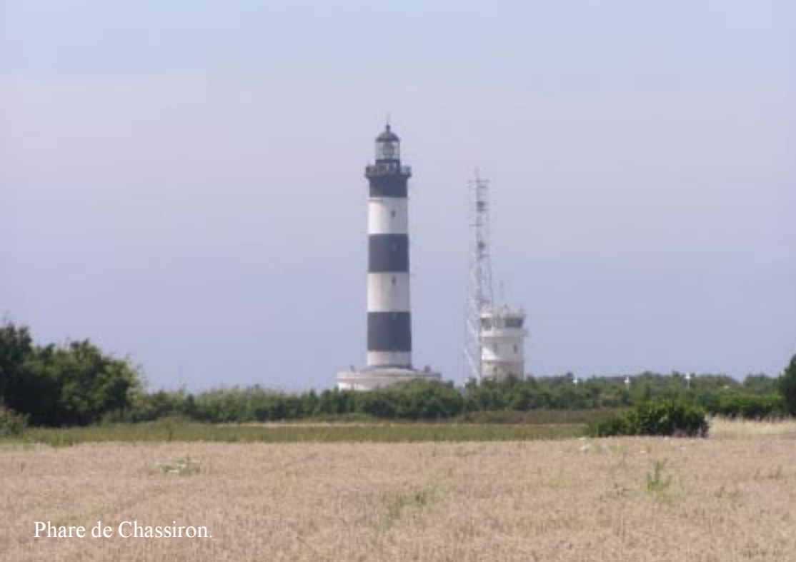
Phare de Chassiron.