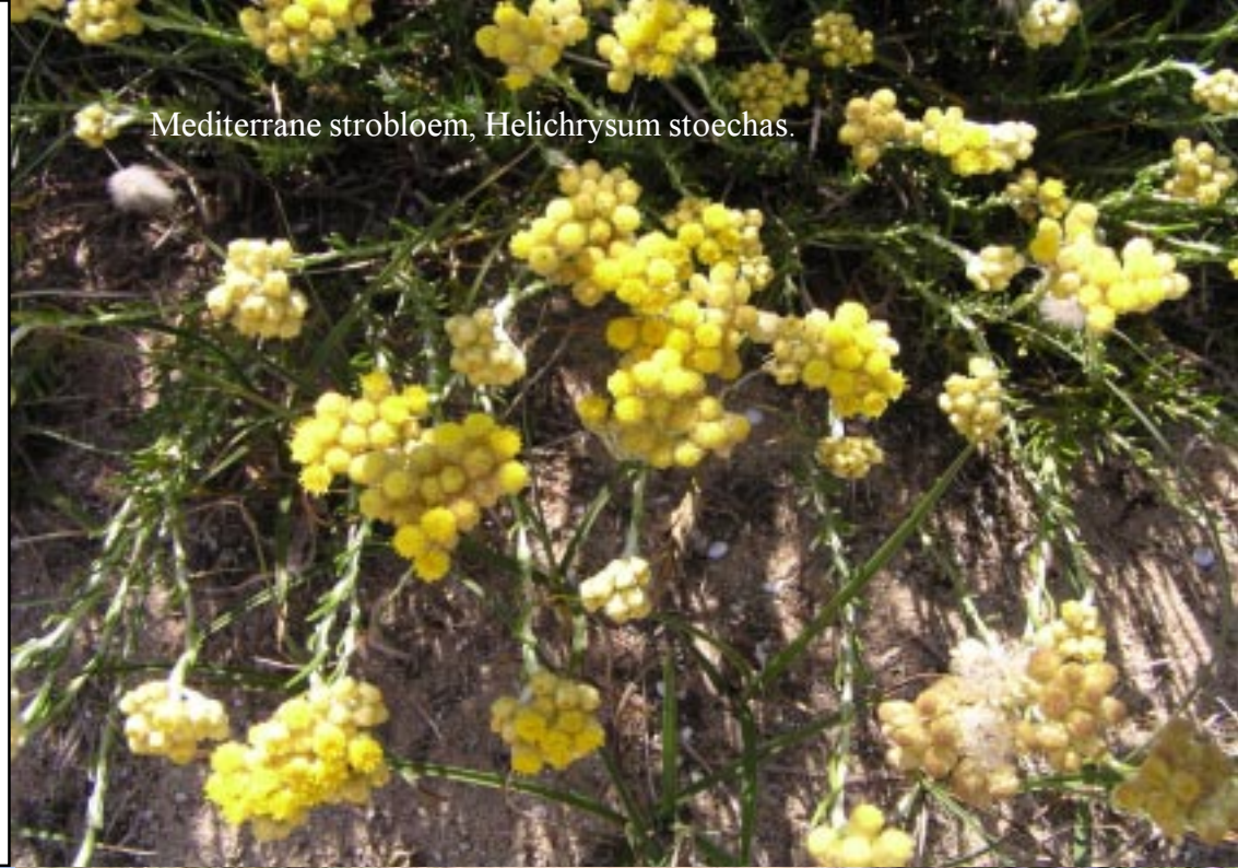
Mediterrane strobloem, Helichrysum stoechas .