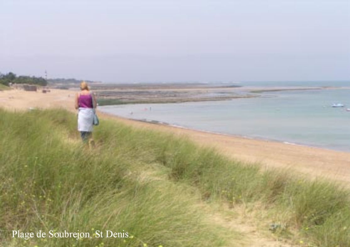
Plage de Soubrejon, St Denis.