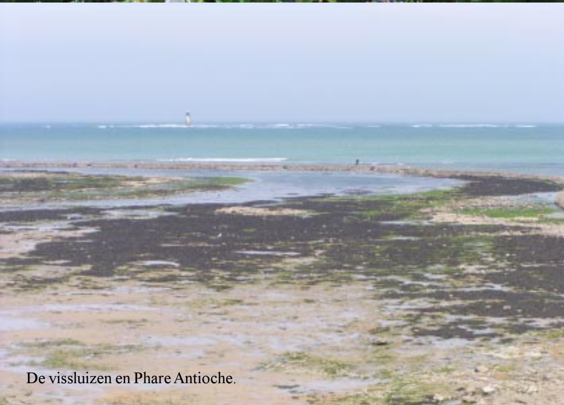
De vissluizen en Phare Antioche.

Daarom scharrelt daar een menigte meeuwen en strandlopers hun kostje bijeen. Gelukkig hebben we de verrekijker nu wel meegenomen: kok- en zilvermeeuwen, spreeuwen en diverse strandlopers.