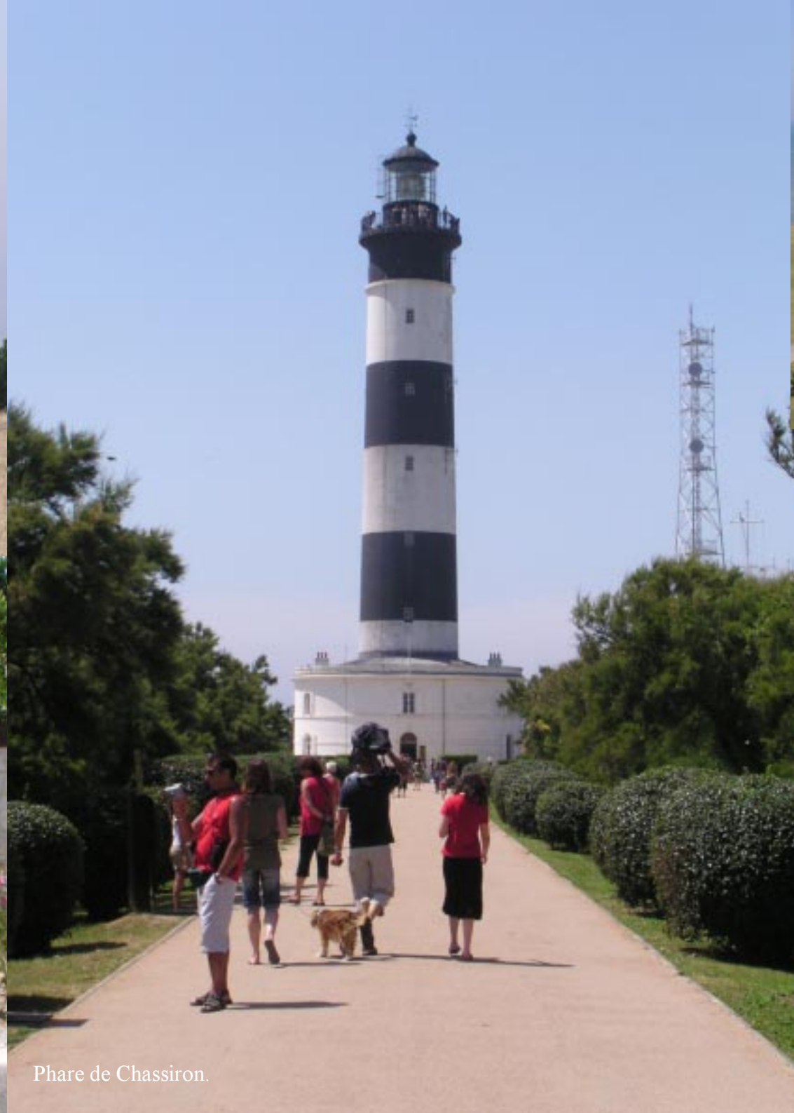
Phare de Chassiron.