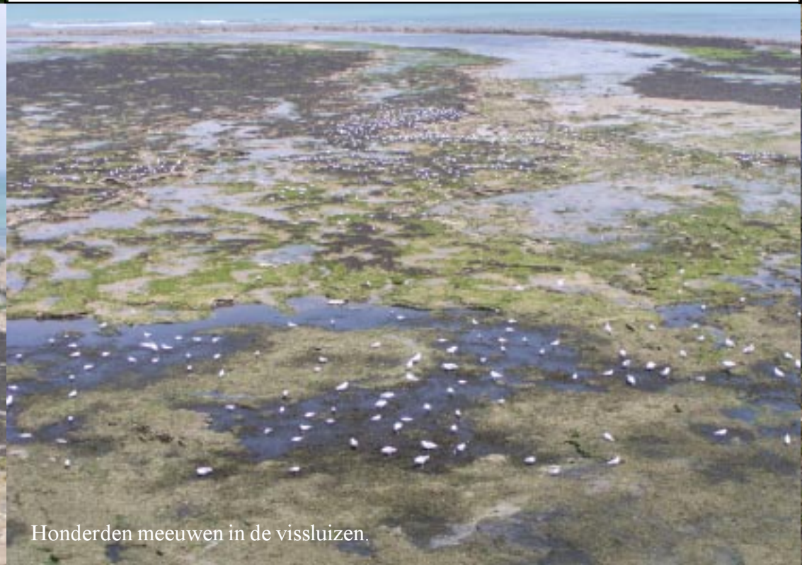
Honderden meeuwen in de vissluizen.