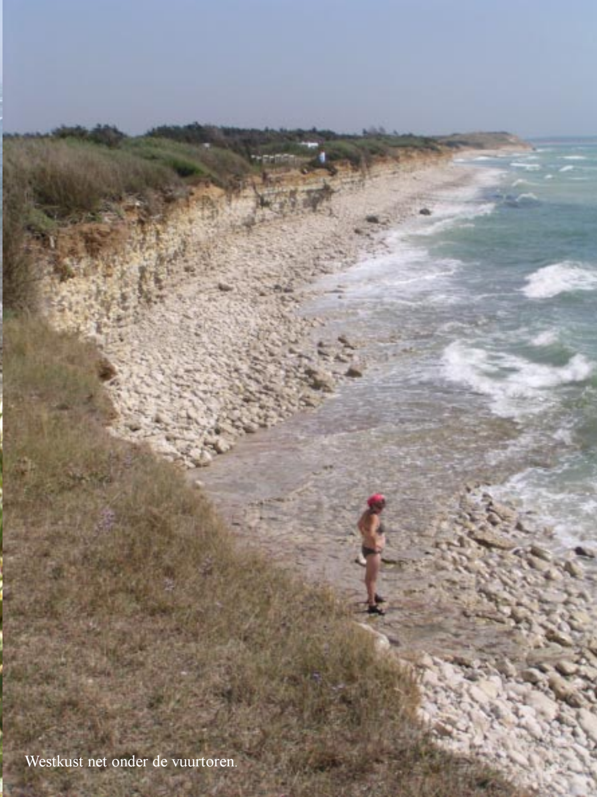
Westkust net onder de vuurtoren.