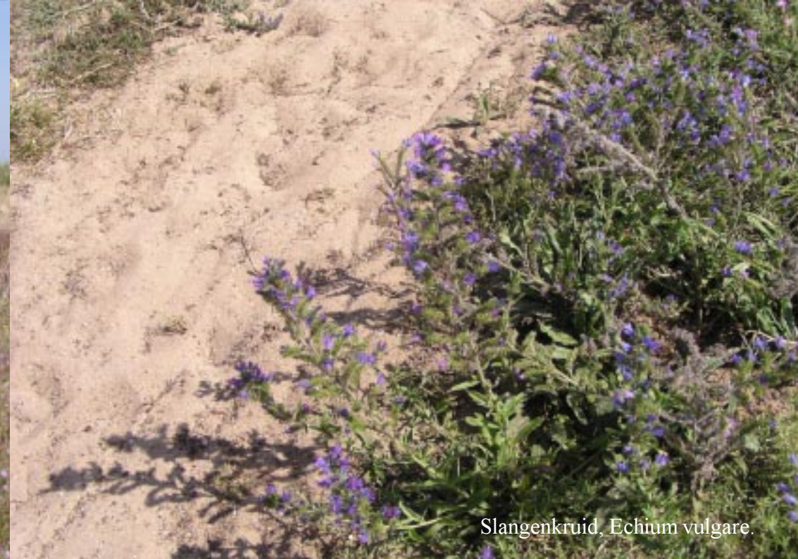
Slangenkruid, Echium vulgare .