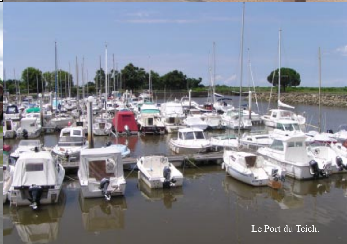
Le Port du Teich.