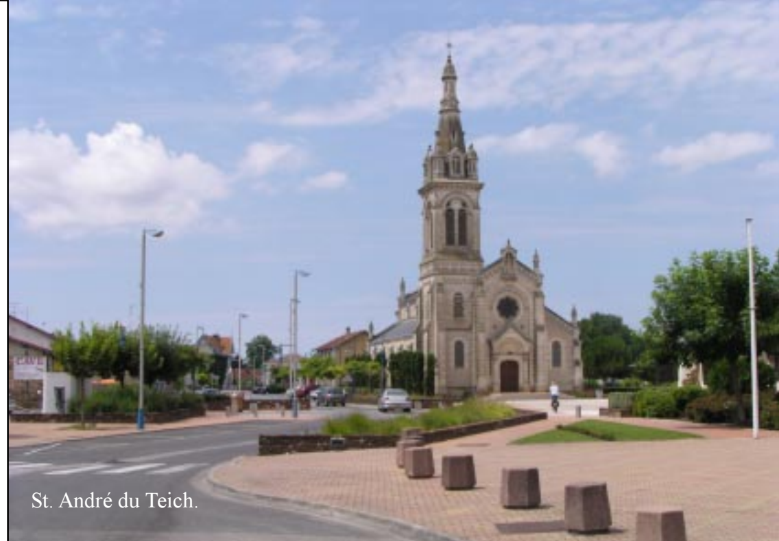
St. André du Teich.

We steken La Leyre over, wiens delta we straks gaan verkennen. Het gaat naar Le Teich en het Parc Ornithologique daar. We maken wandeling 370 uit de 500 wandelingen: De delta van de Eyre, vogelparadijs. De fietsen worden bij de speeltuin en het zwembad rechts naast de jachthaven achtergelaten. 14.50.