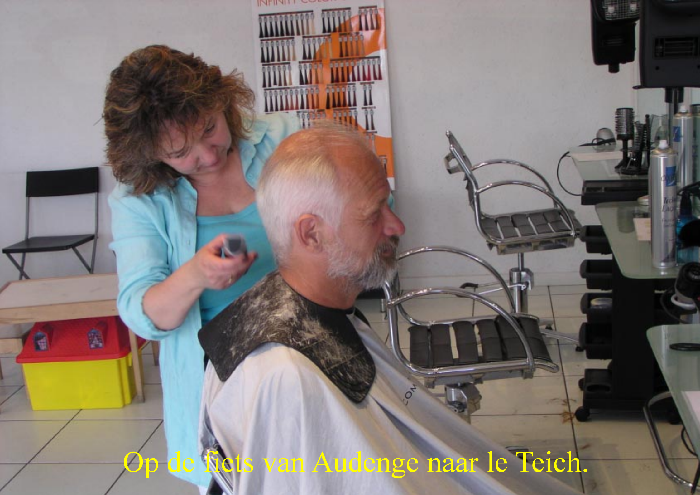
Op de fiets van Audenge naar le Teich.