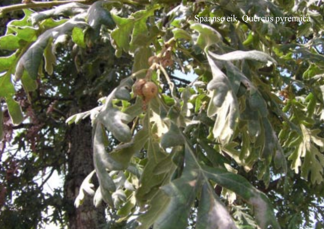
Spaanse eik, Quercus pyrenaica .