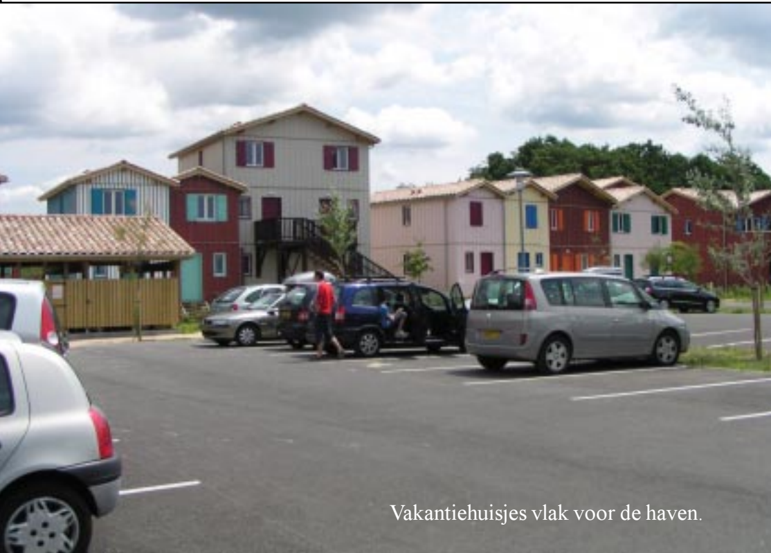
Vakantiehuisjes vlak voor de haven.