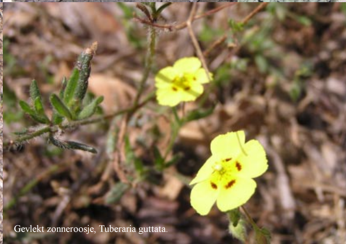
Gevlekt zonneroosje, Tuberaria guttata .