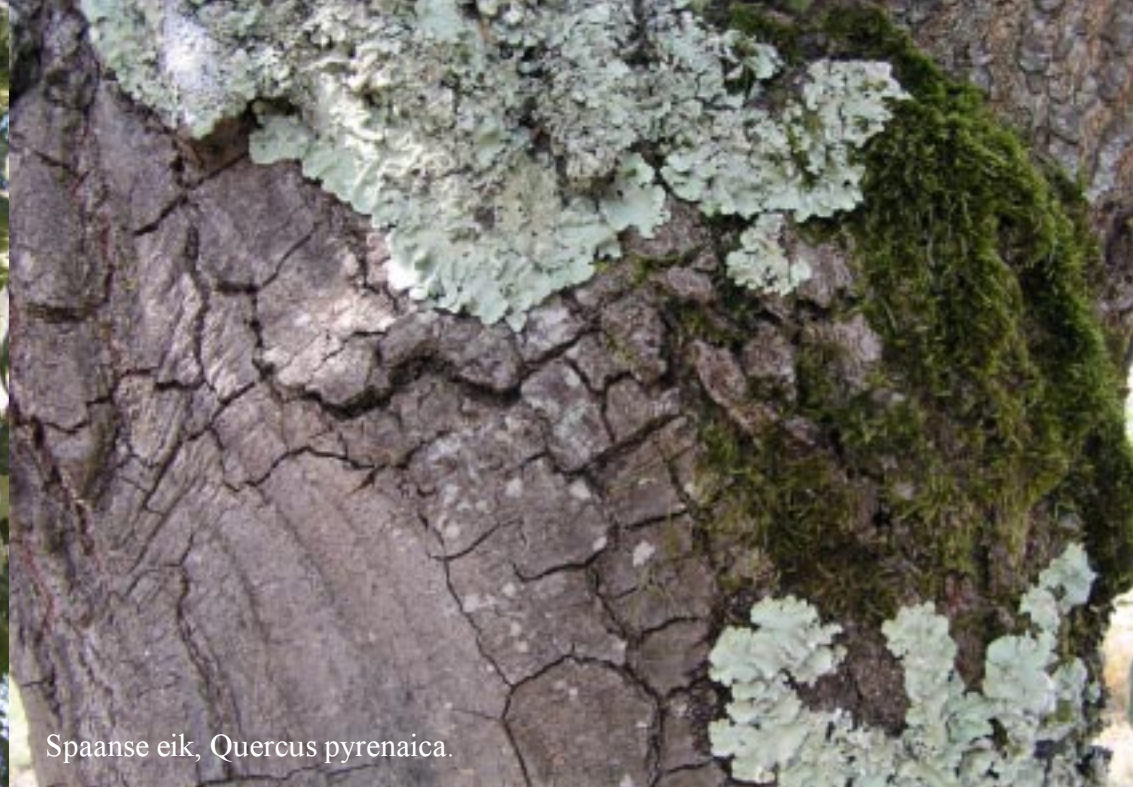
Spaanse eik, Quercus pyrenaica .