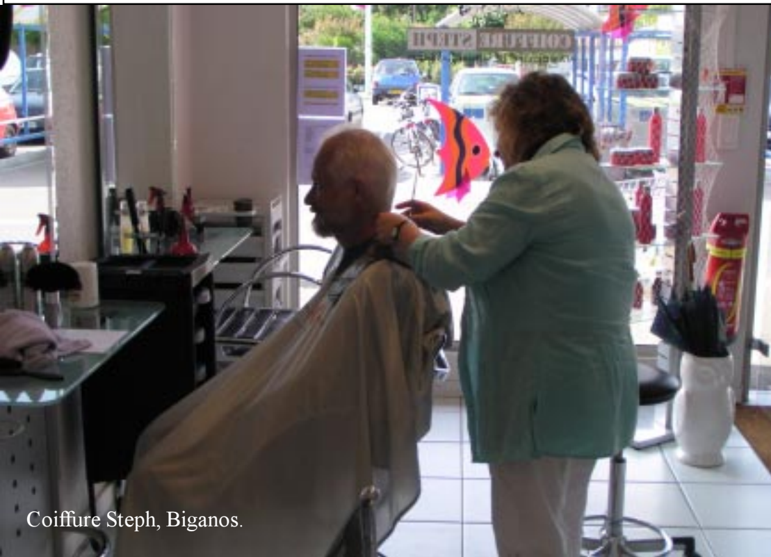
Coiffure Steph, Biganos.