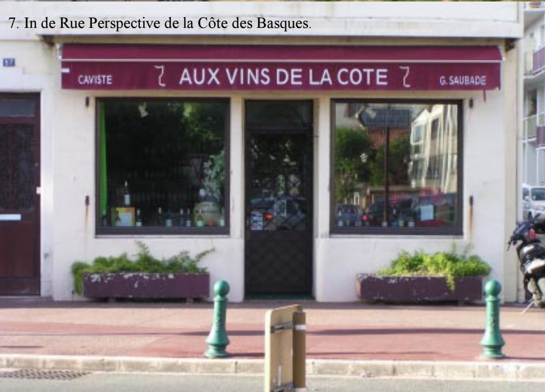
7. In de Rue Perspective de la Côte des Basques.