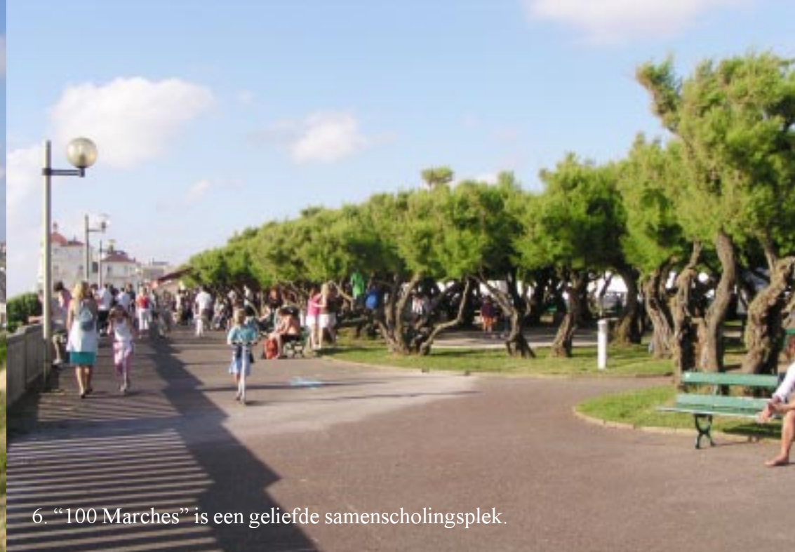
6. "100 Marches" is een geliefde samenscholingsplek.