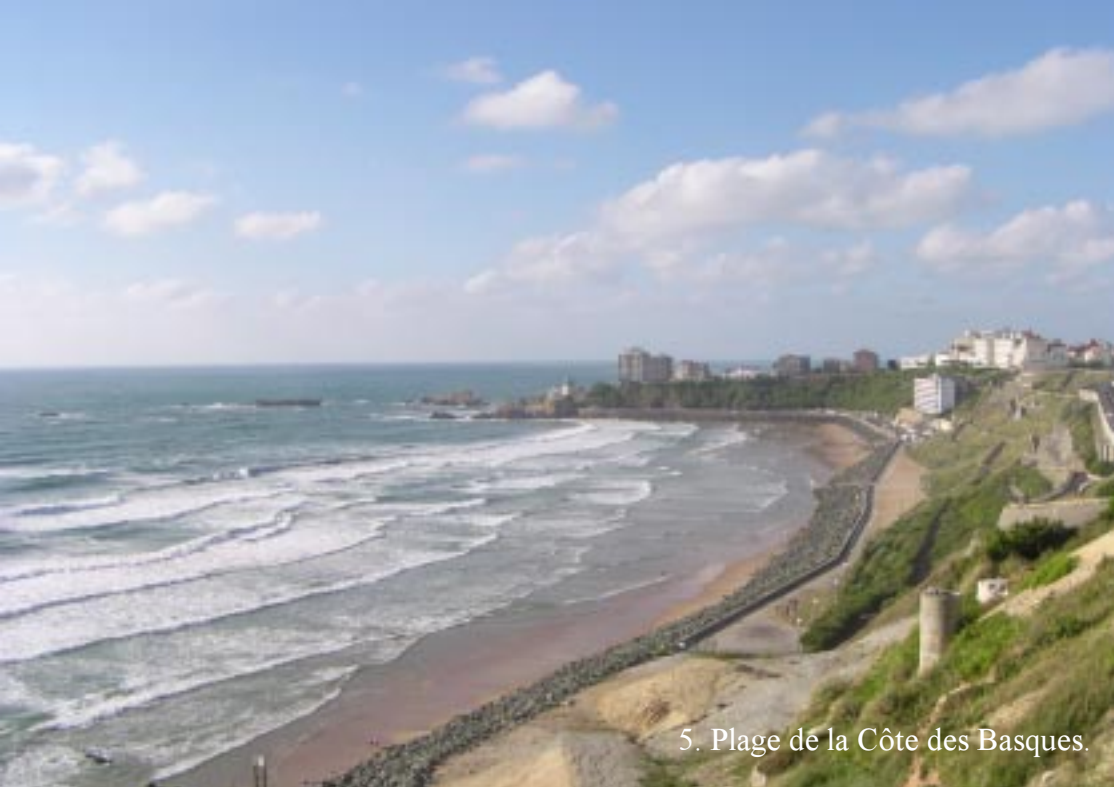
5. Plage de la Côte des Basques.