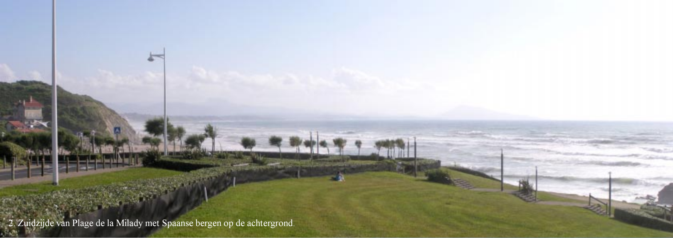
2. Zuidzijde van Plage de la Milady met Spaanse bergen op de achtergrond.