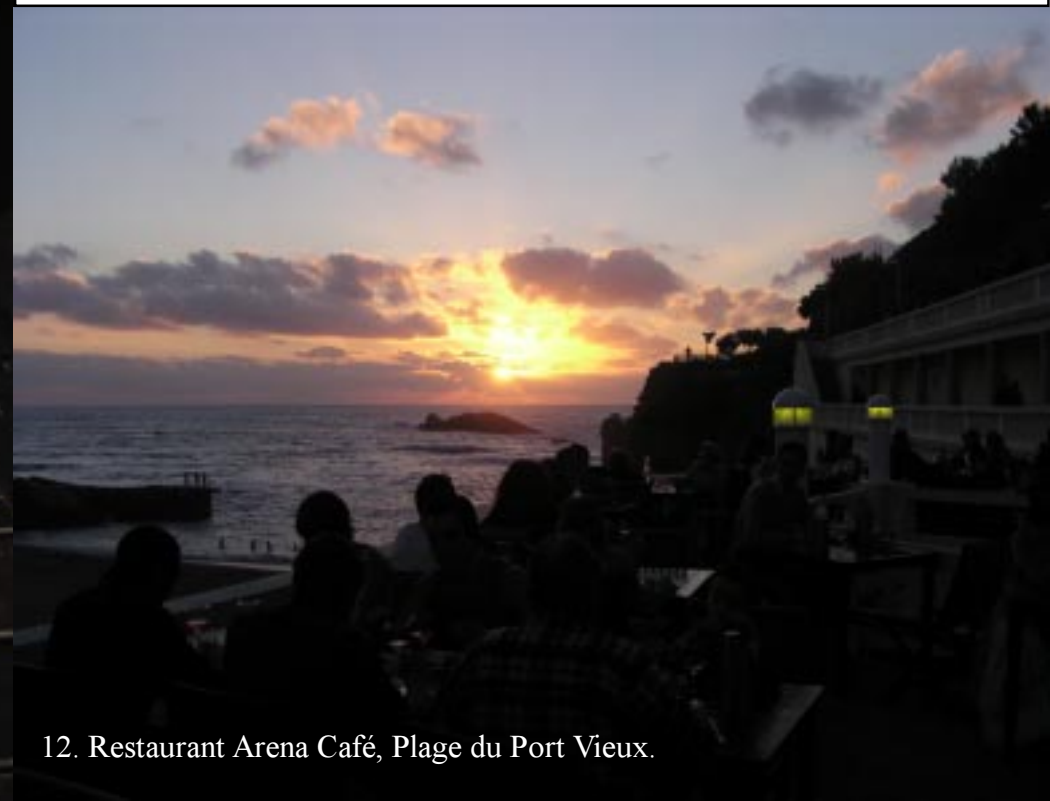
12. Restaurant Arena Café, Plage du Port Vieux.

Klik hier om naar het verslag terug te gaan.