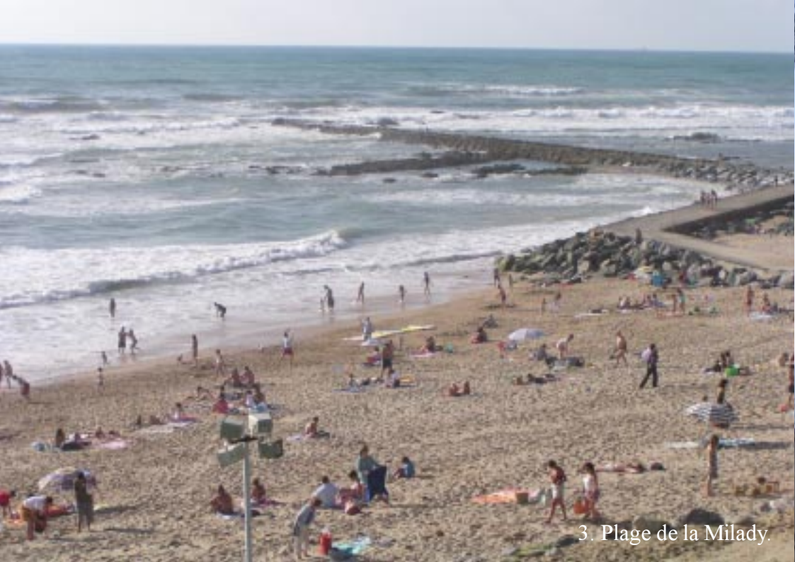
3. Plage de la Milady.