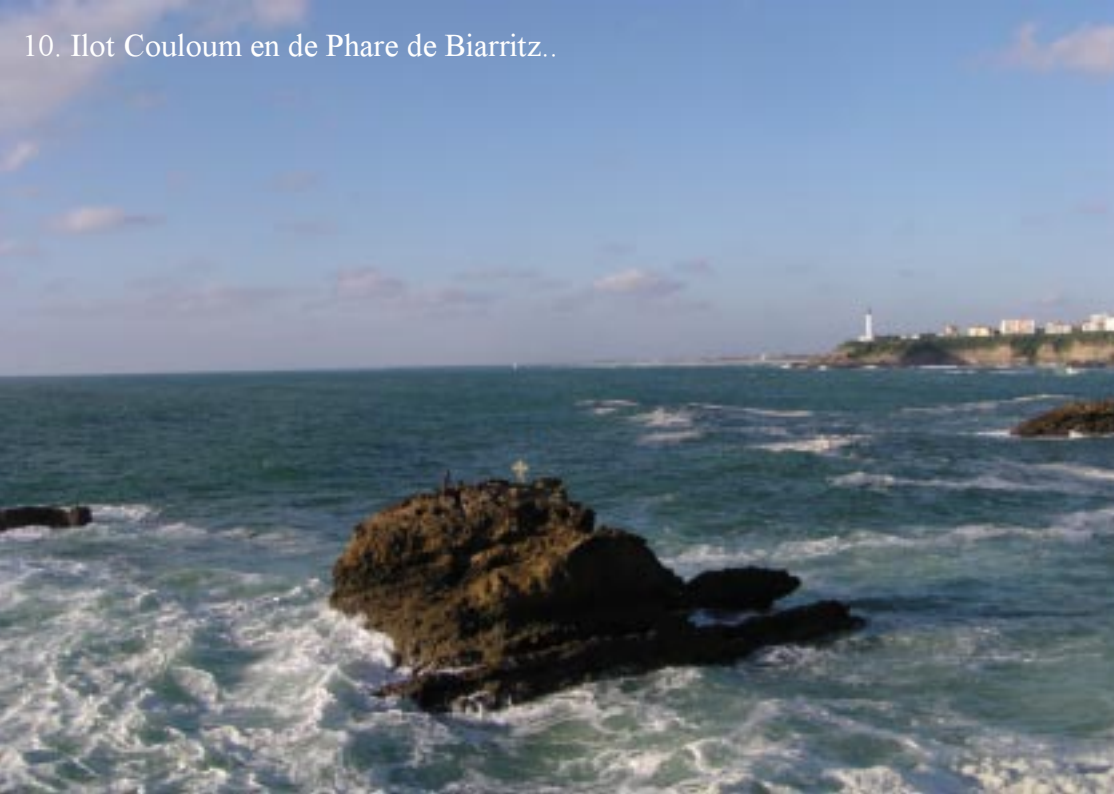
10. Ilot Couloum en de Phare de Biarritz..