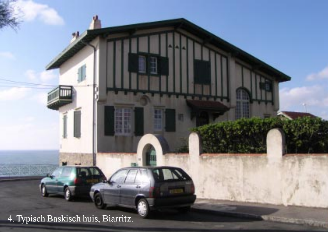
4. Typisch Baskisch huis, Biarritz.