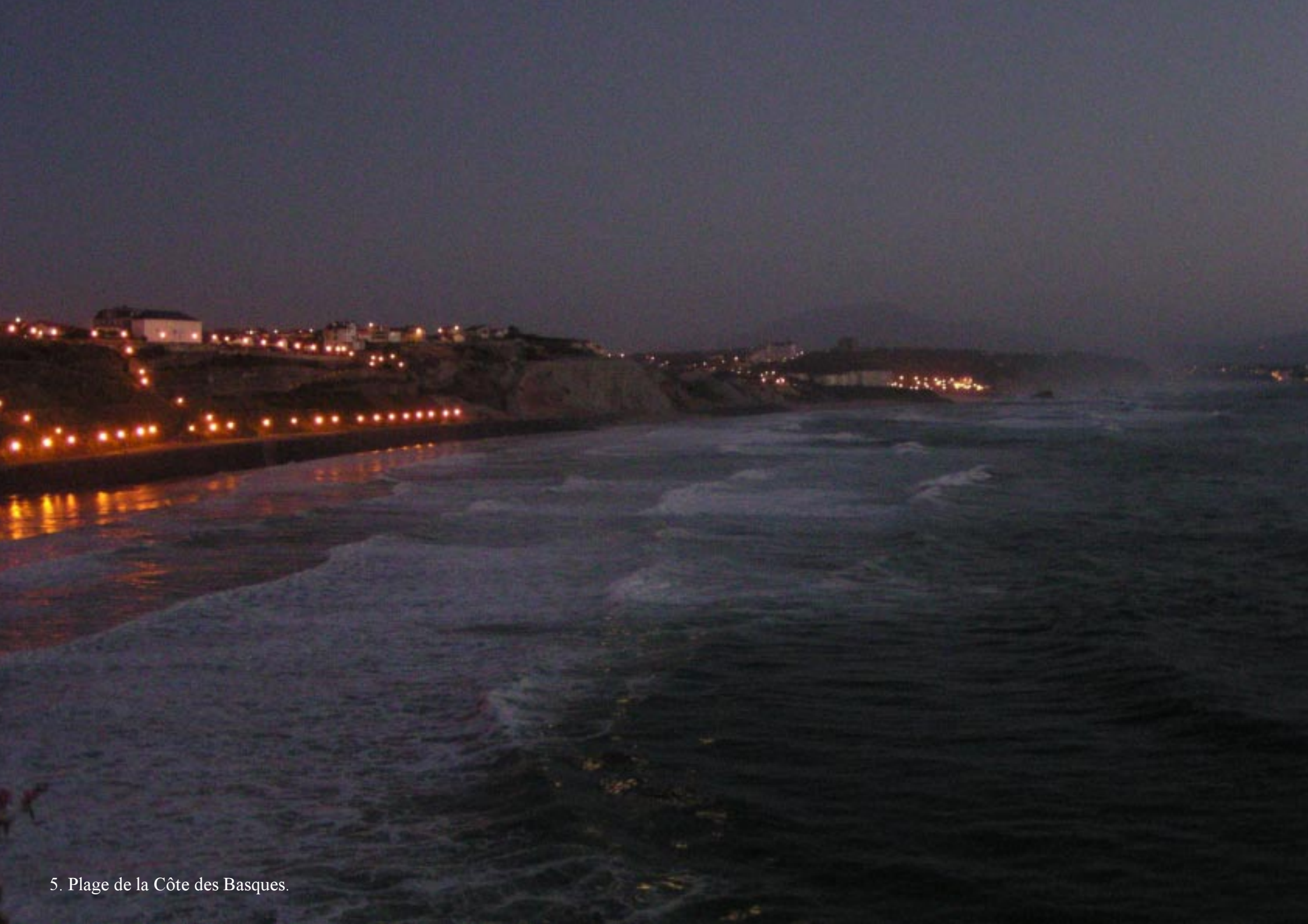
5. Plage de la Côte des Basques.