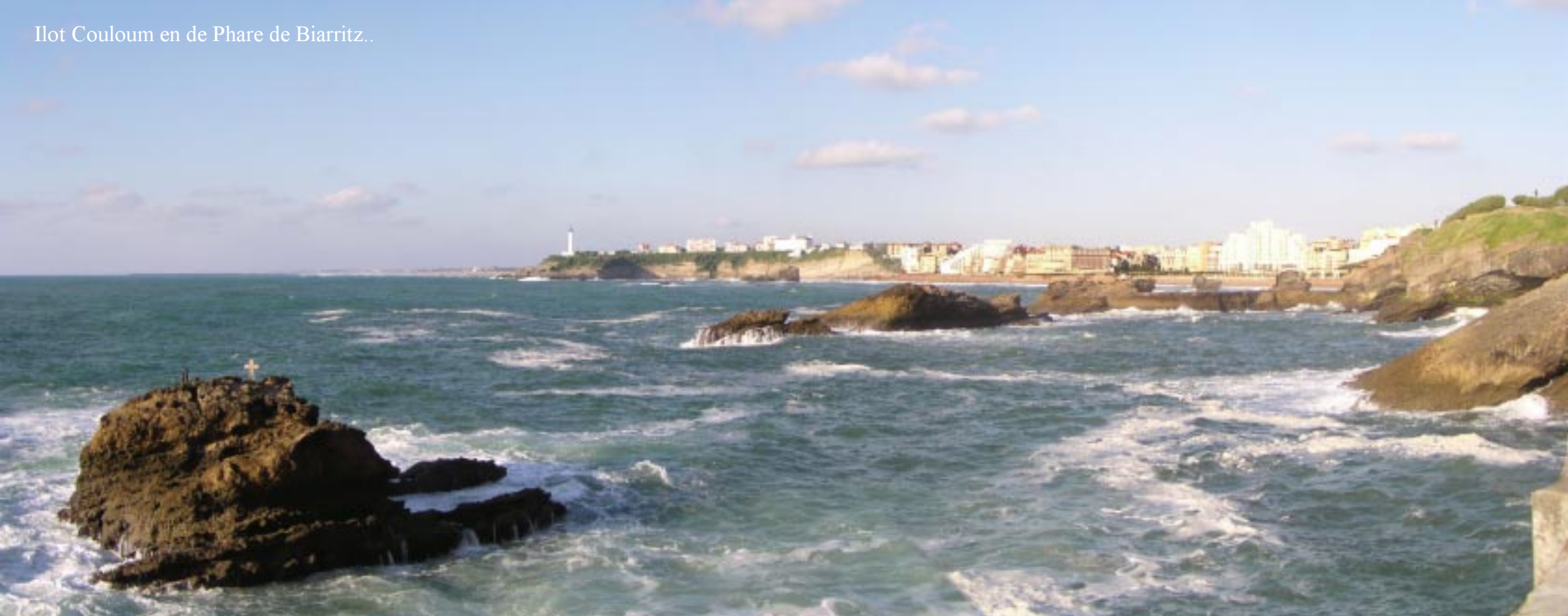
Rotsen in zee voor de Rocher de la Vierge.