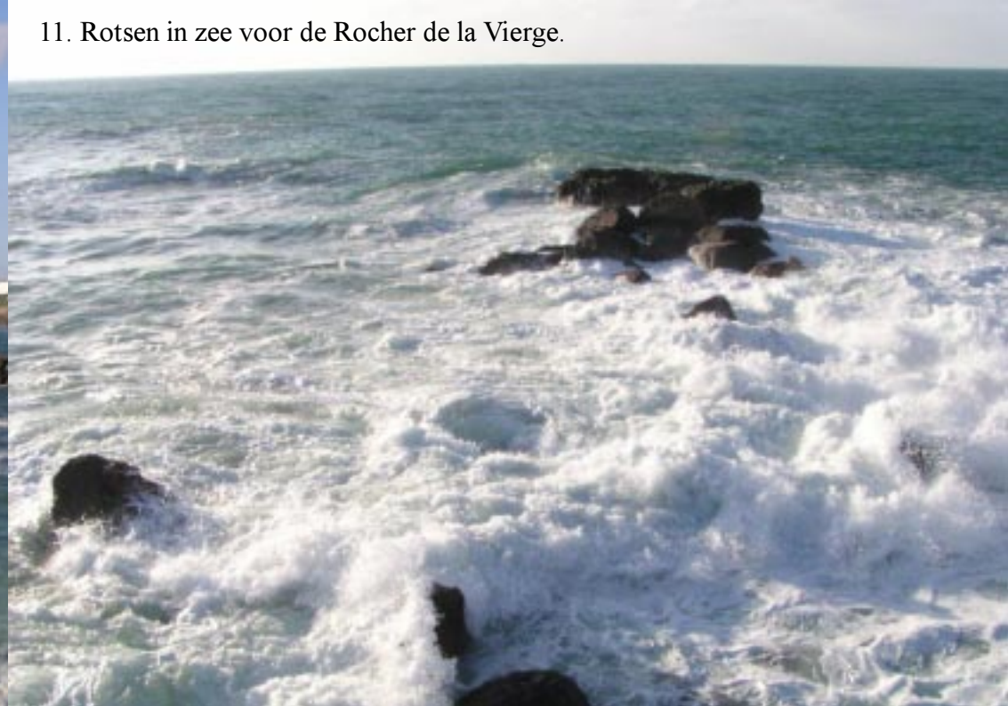
11. Rotsen in zee voor de Rocher de la Vierge.