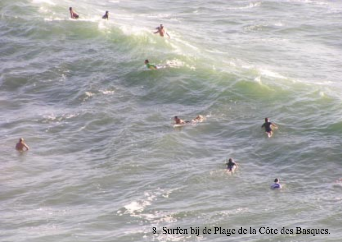
8. Surfen bij de Plage de la Côte des Basques.