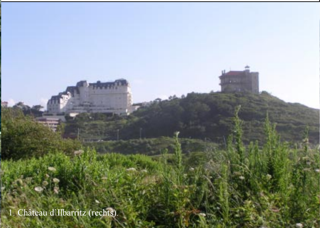
1. Château d'Ibarritz (rechts).

Nummers voor de fototeksten geven de plek op de kaart links aan, waar die foto's zijn gemaakt.