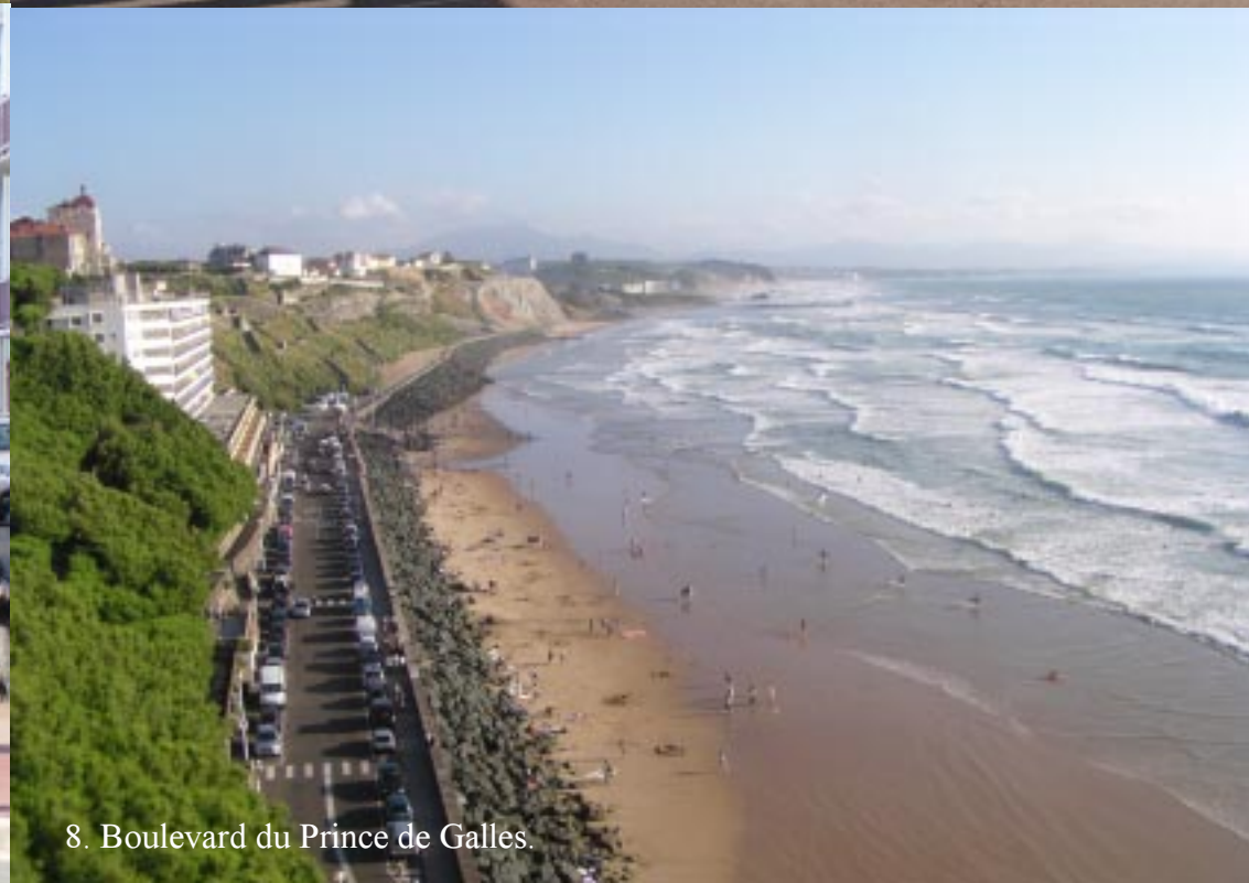
8. Boulevard du Prince de Galles.