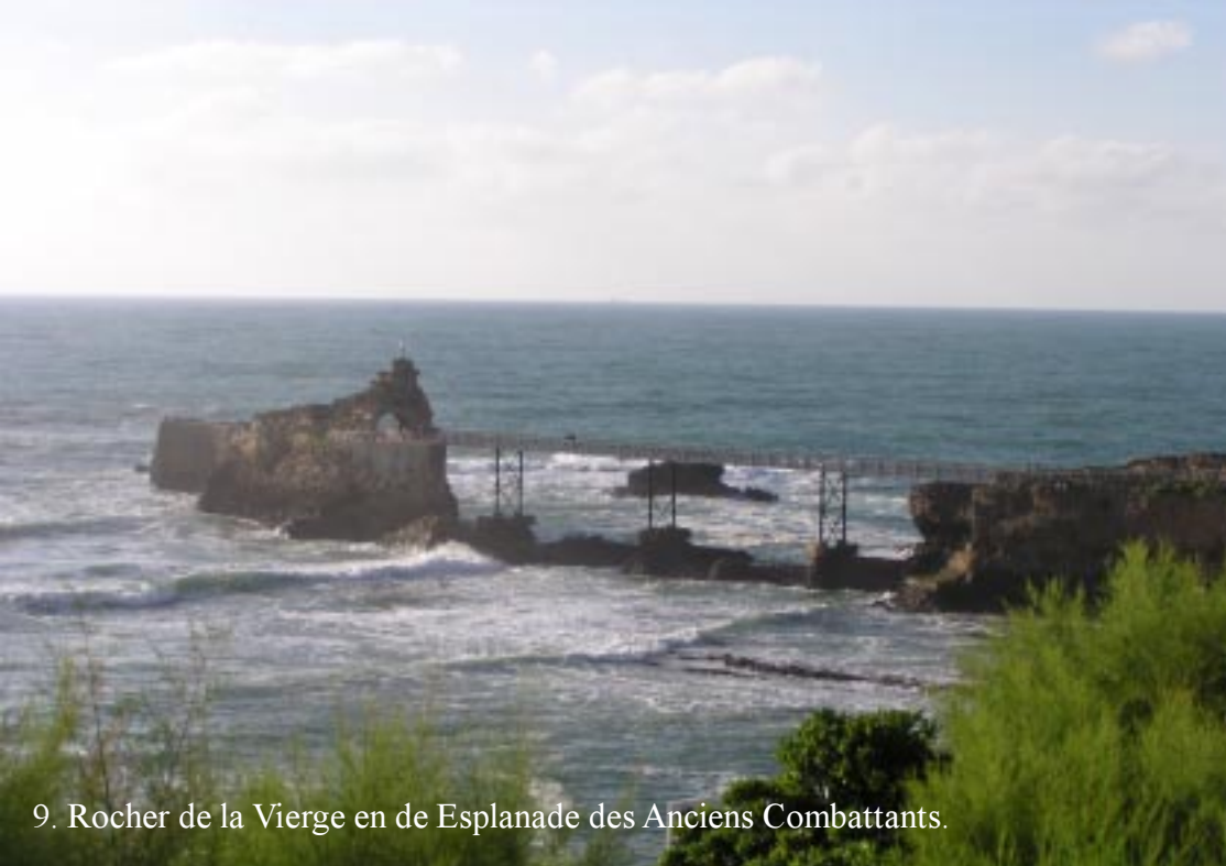
9. Rocher de la Vierge en de Esplanade des Anciens Combattants.