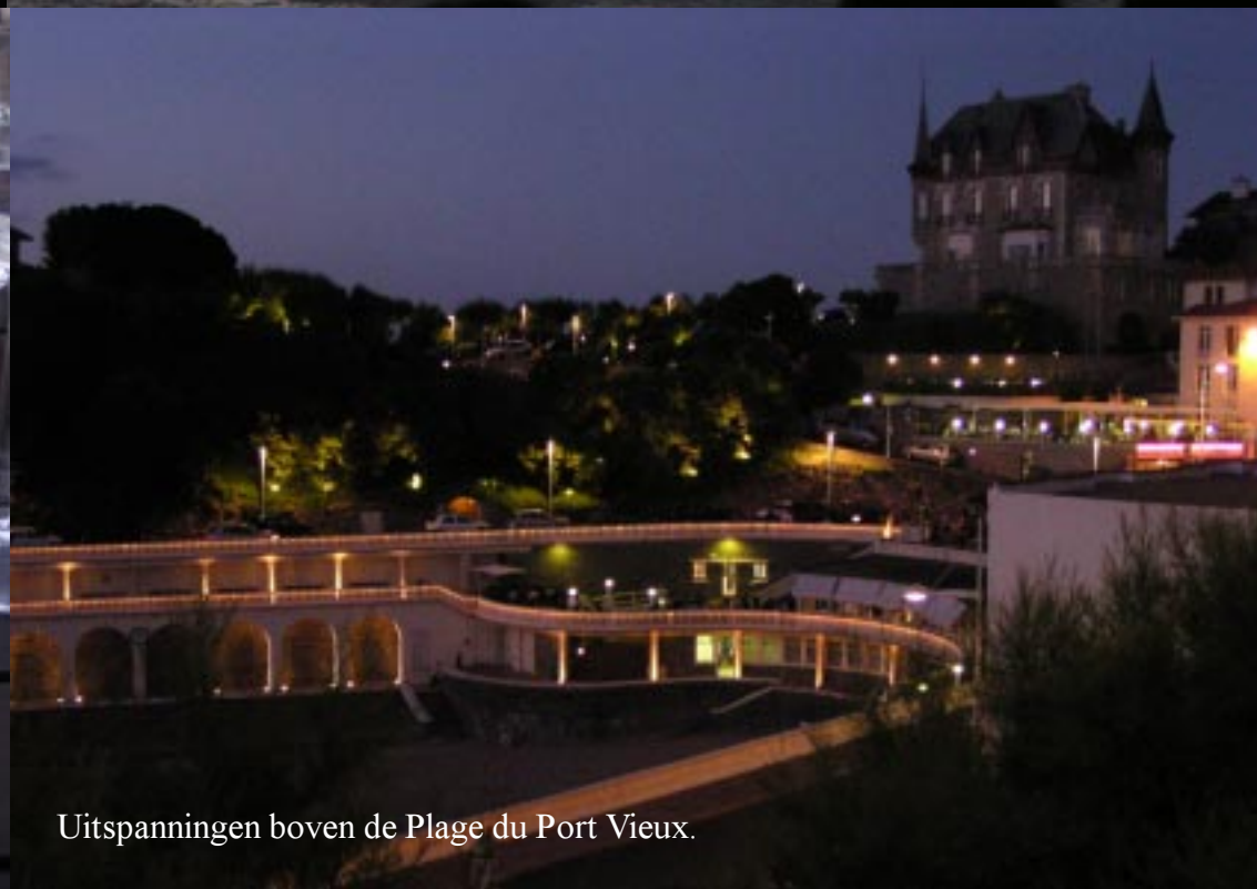
Uitspanningen boven de Plage du Port Vieux.