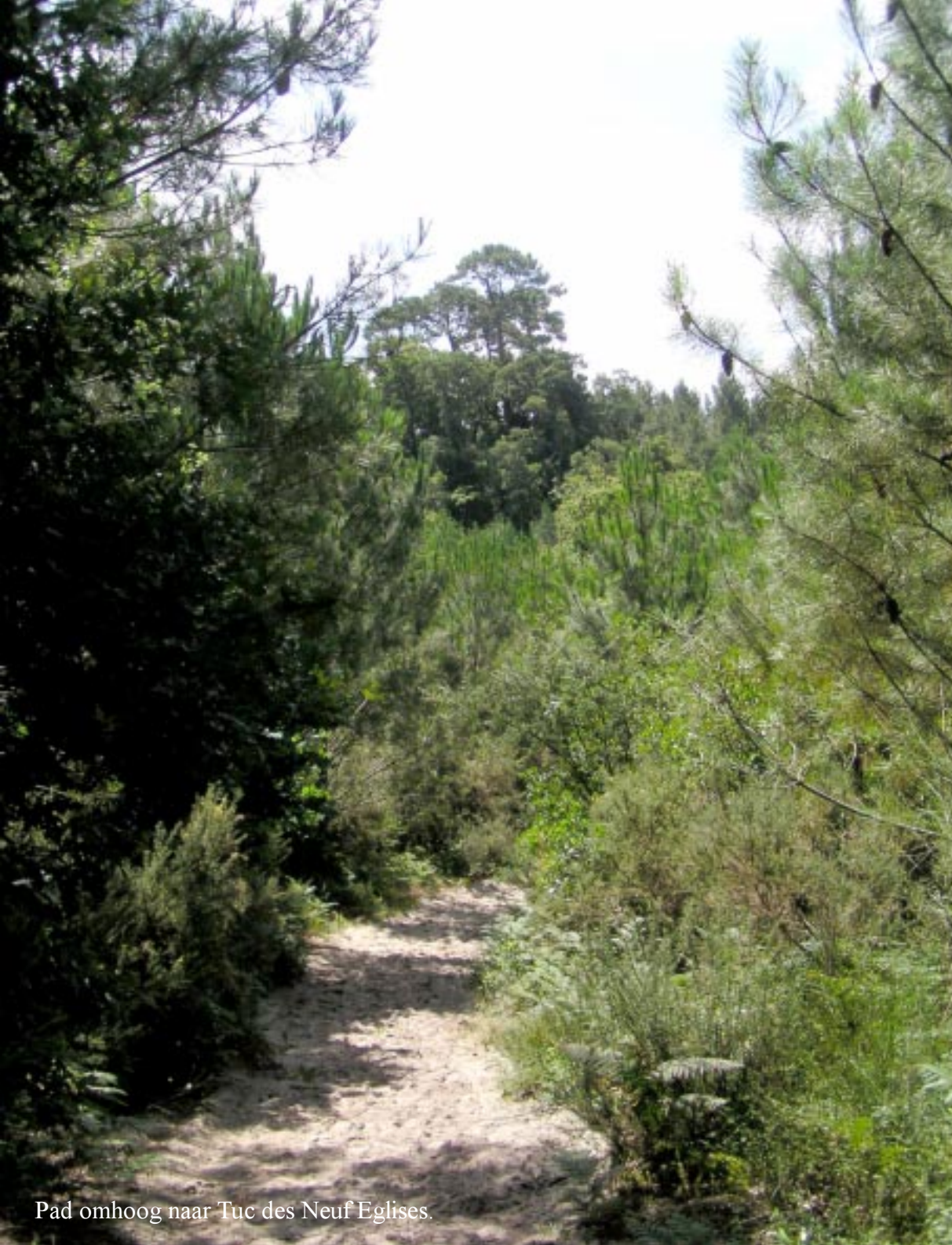
Pad omhoog naar Tuc des Neuf Églises.

20 minuten later staan we na flink klimmen op het uitzichtpunt Tuc des neuf Églises. Die negen kerken halen we er niet uit. Maar wel zien we zeer hoge bergen in het zuiden. De Pyreneeën dus.