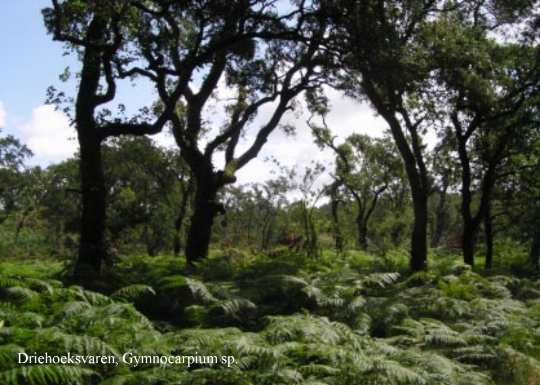
Driehoeksvaren, Gymnocarpium sp.

Door bossen van hoge dennen en kurkeiken met veel driehoeksvarens eronder gaat het.