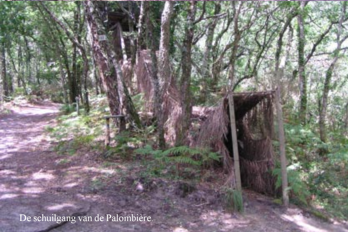
De schuilgang van de Palombière.