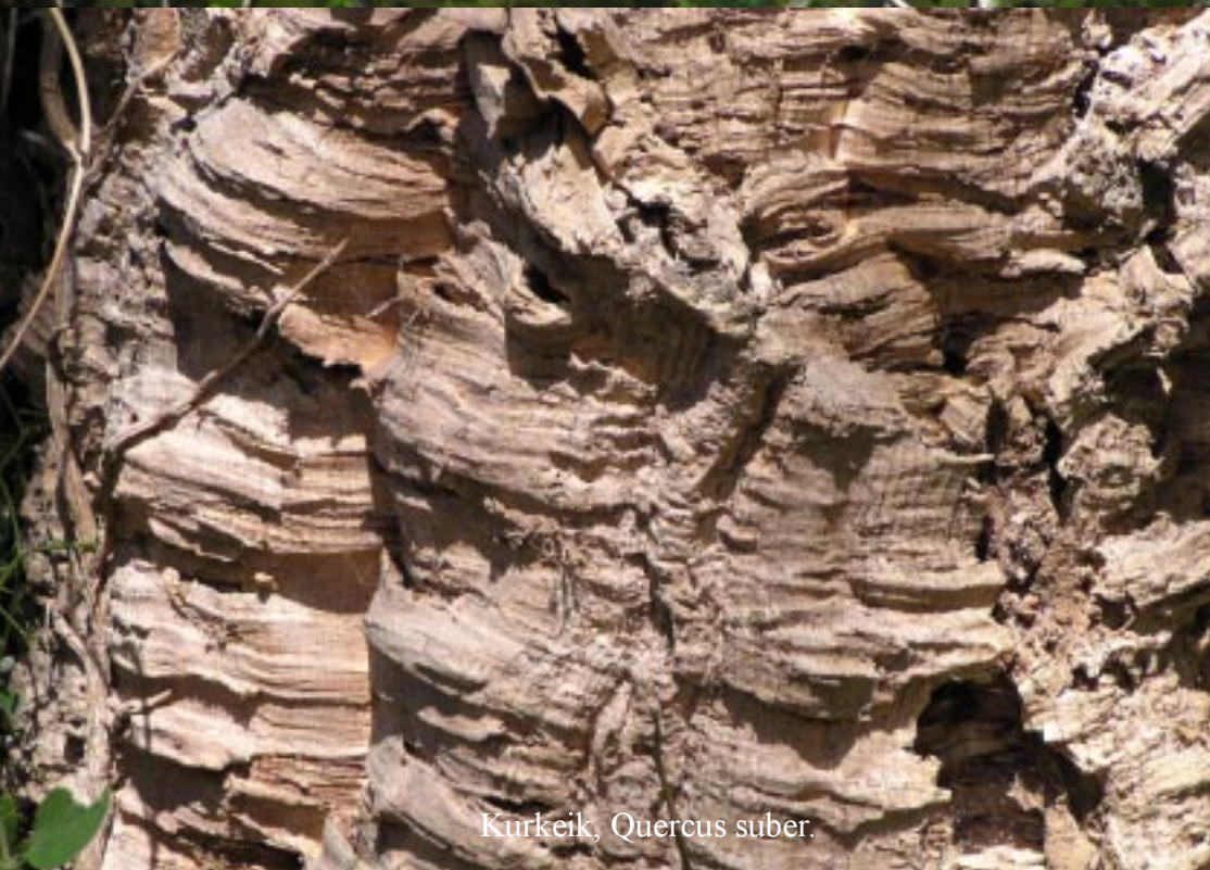
Kurkeik, Quercus suber .