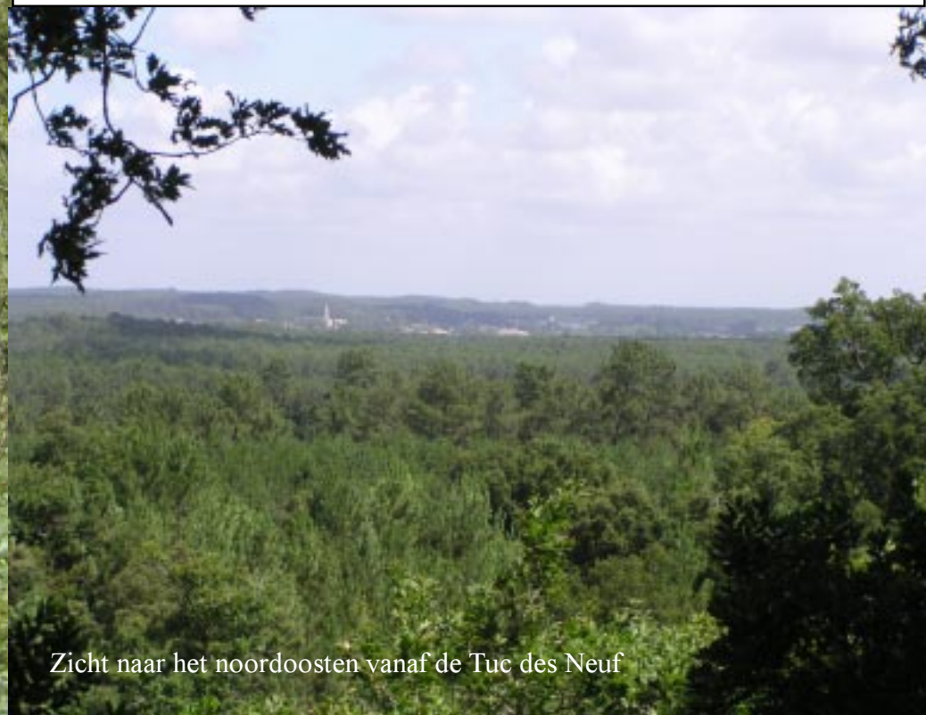
Zicht naar het noordoosten vanaf de Tuc des Neuf

20 minuten later staan we na flink klimmen op het uitzichtpunt Tuc des neuf Églises. Die negen kerken halen we er niet uit. Maar wel zien we zeer hoge bergen in het zuiden. De Pyreneeën dus.