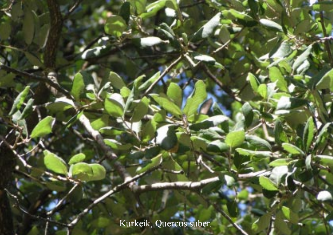
Kurkeik, Quercus suber .