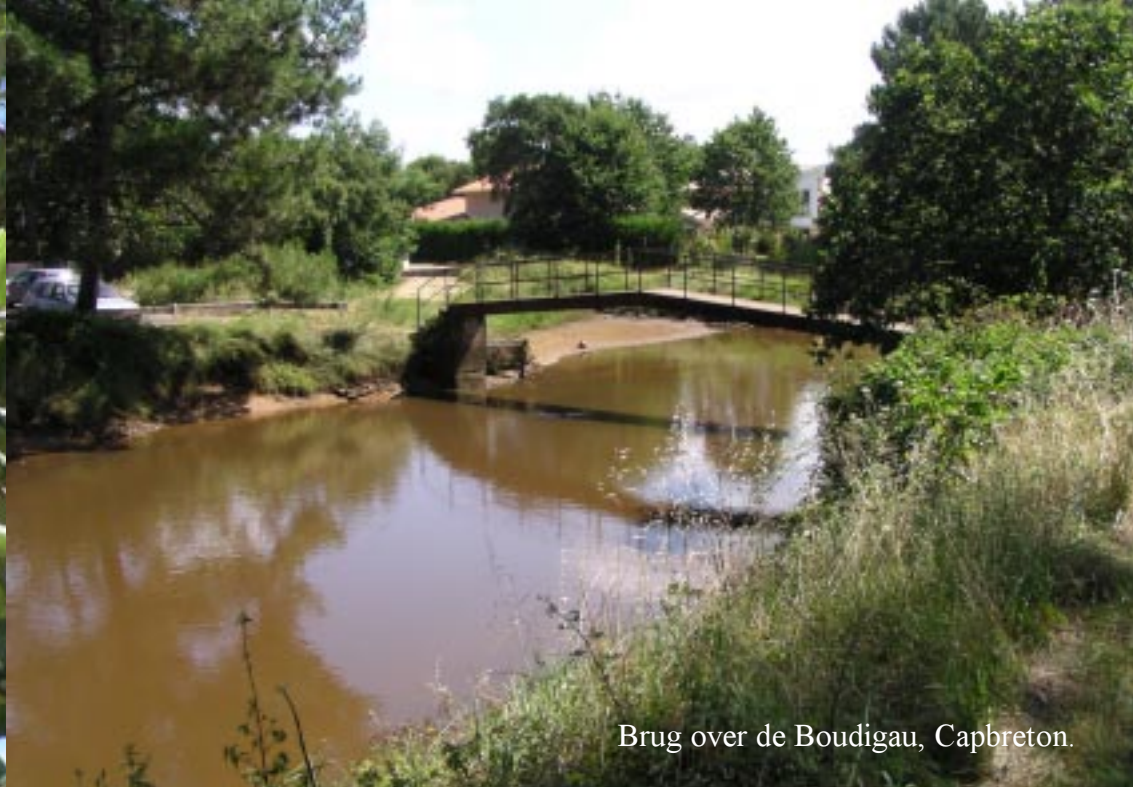
Brug over de Boudigau, Capbreton.