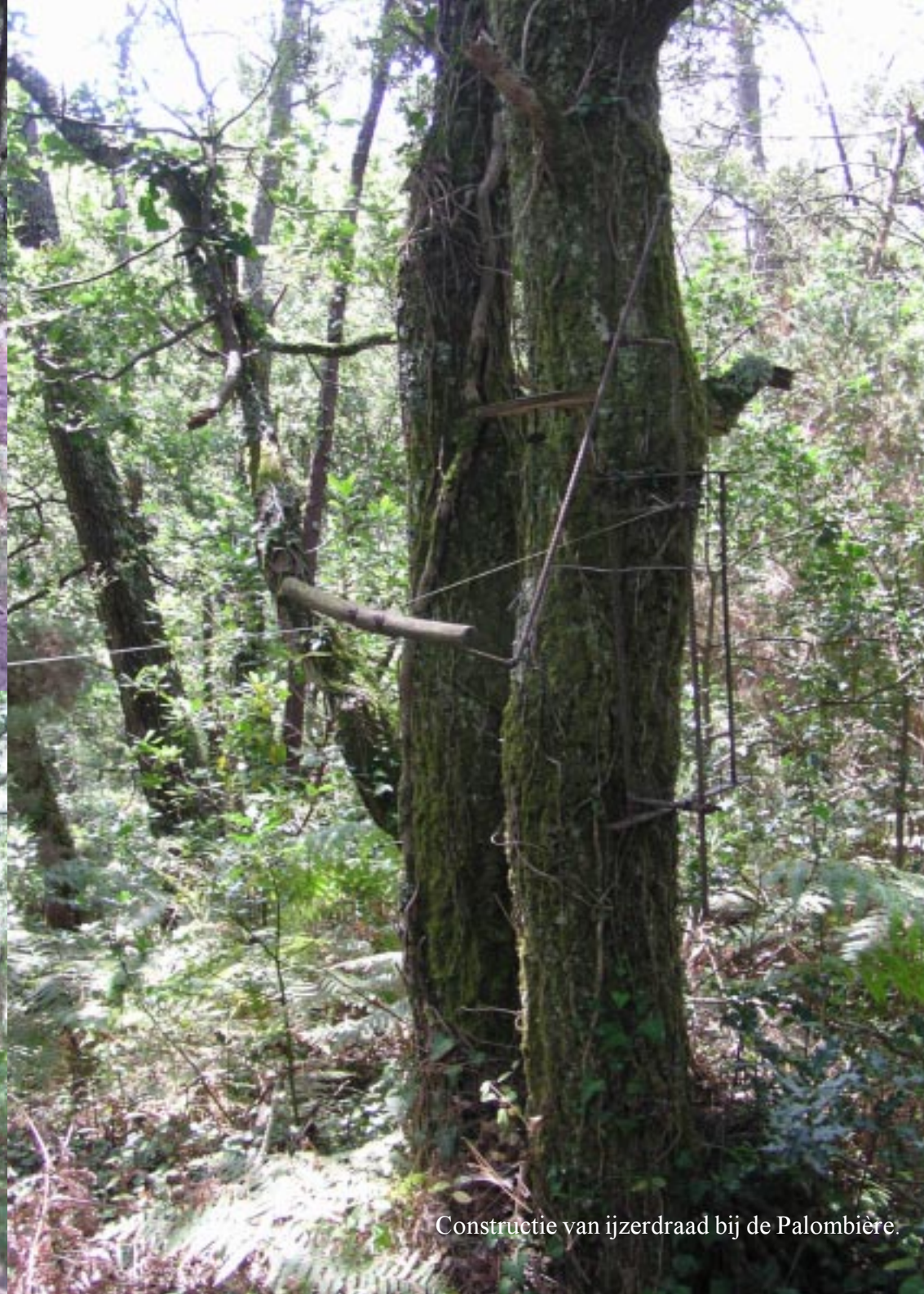
Constructie van ijzerdraad bij de Palombière.