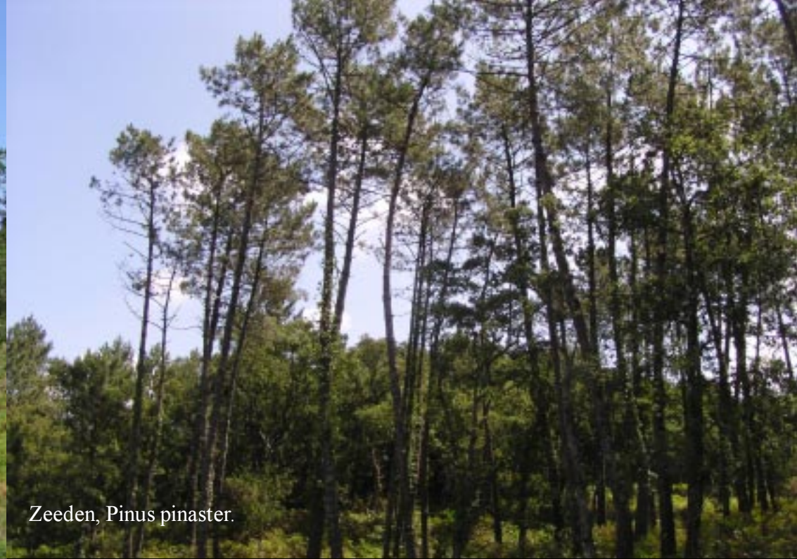
Zeeden, Pinus pinaster .