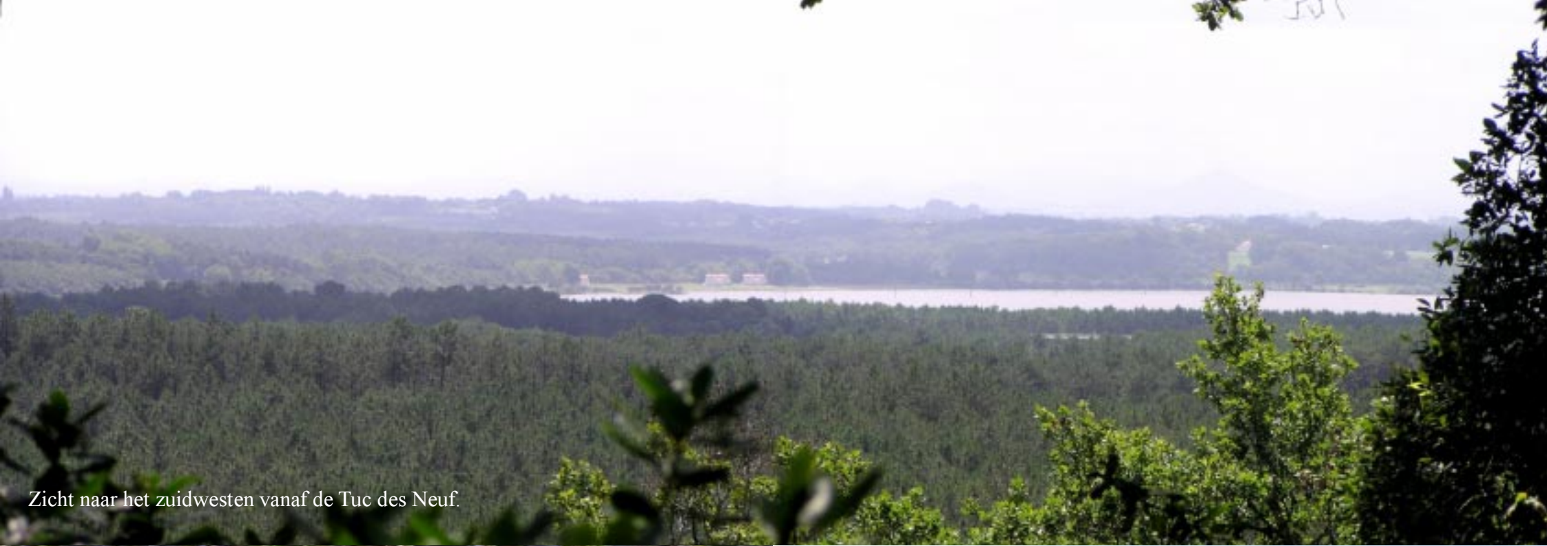
Zicht naar het zuidwesten vanaf de Tuc des Neuf.