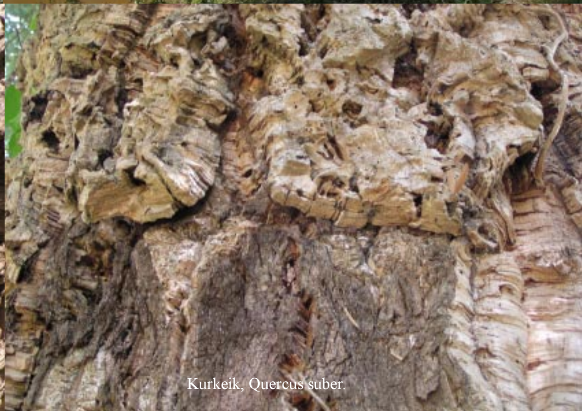
Kurkeik, Quercus suber .