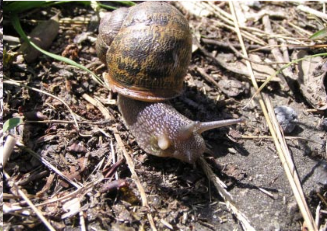
Wijngaardslak Helix pomatia .