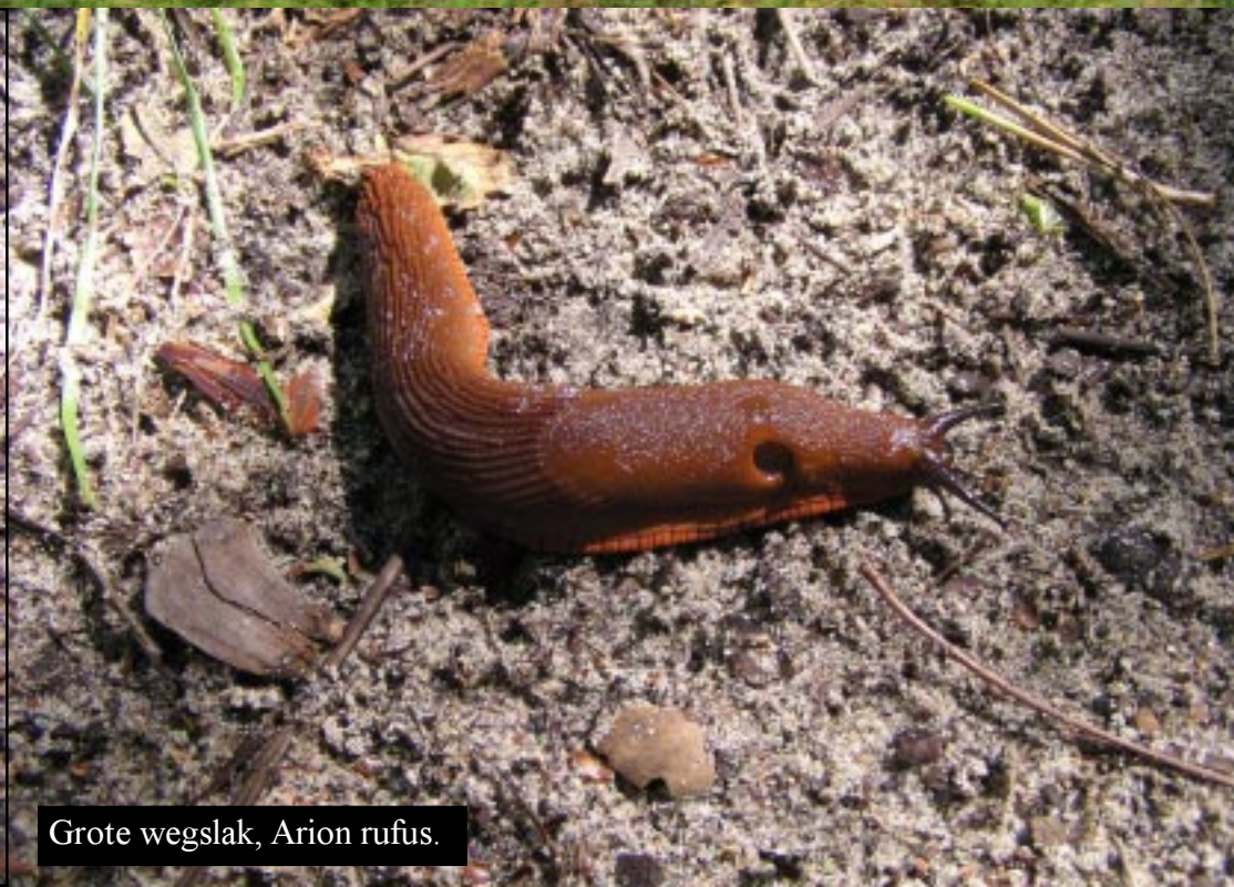
Grote weglak, Arion rufus .