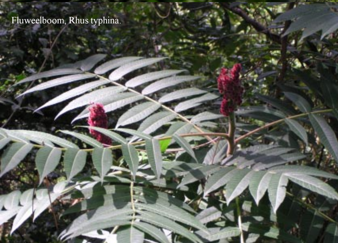
Fluweelboom, Rhus typhina .