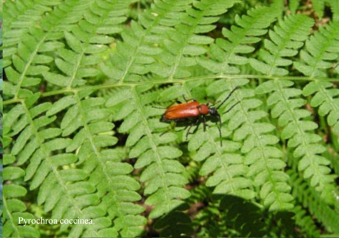
Pyrochroa coccinea .