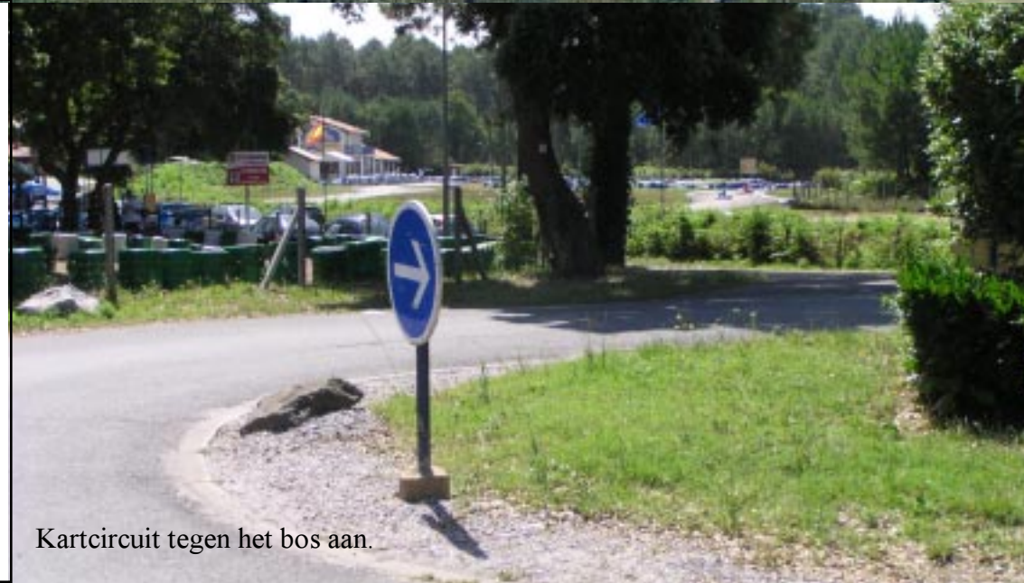
Kartcircuit tegen het bos aan.

Om een 2e camping heen gaat het door dure voorwijken van Capbreton heen. Niet interessant. Stoplichten zijn door een rotonde vervangen een manege zien we niet, maar blauwe strepen en pijlen houden ons op de route.