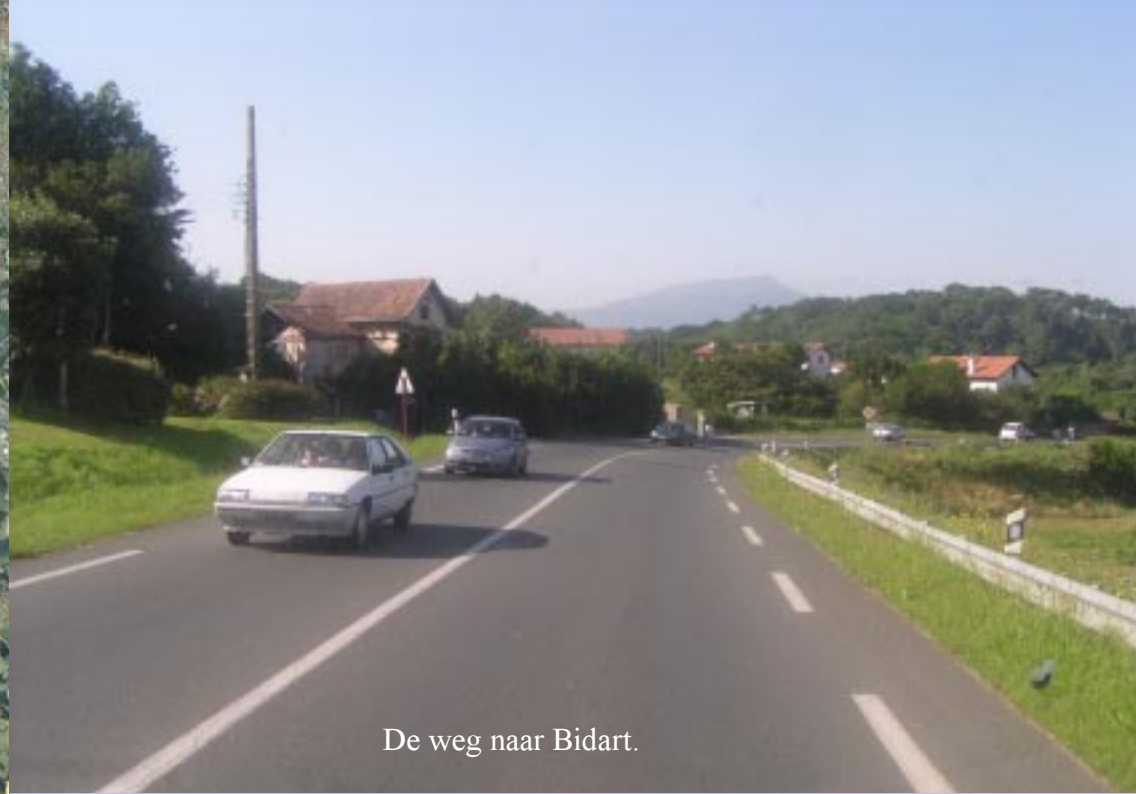
De weg naar Bidart.