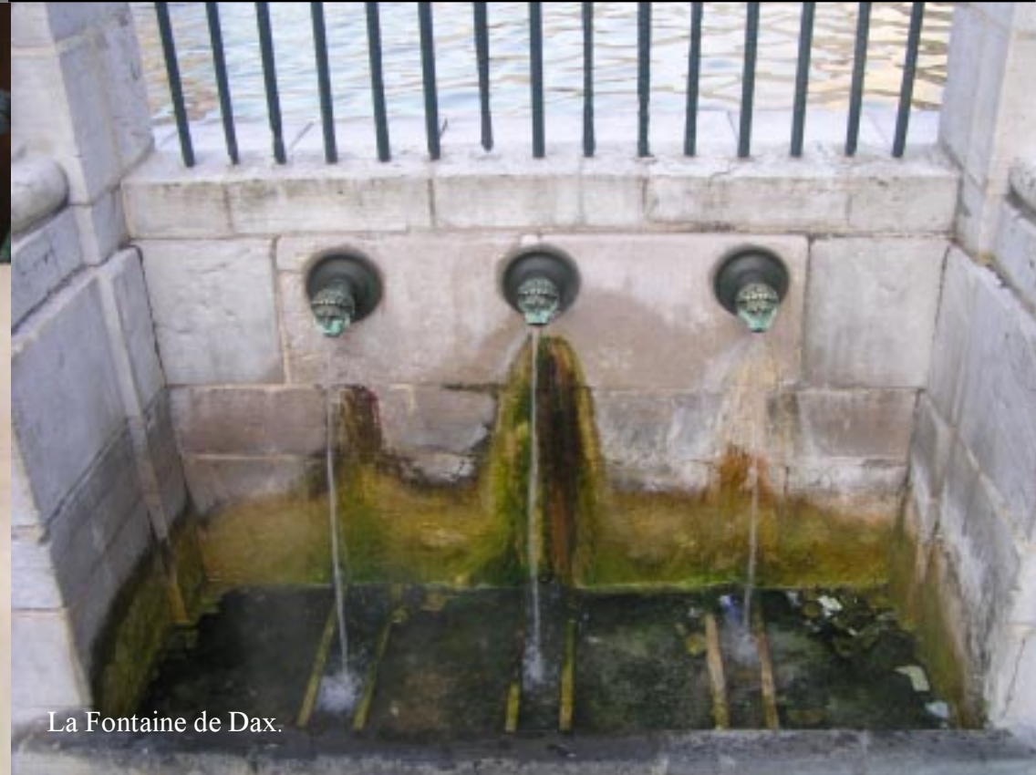
La Fontaine de Dax.