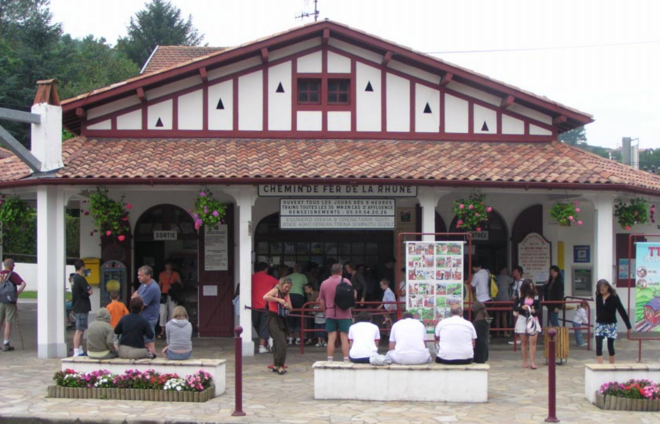
Van St. Jean-de-Luz via La Rhune naar Dax.