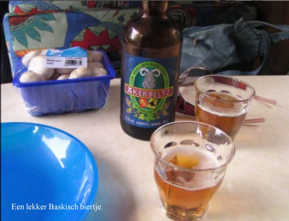
Een lekker Baskisch biertje.

Later als het donker is geworden en de muggen beginnen te bijten, maken we plannen voor morgen, schrijf ik het verslag bij.