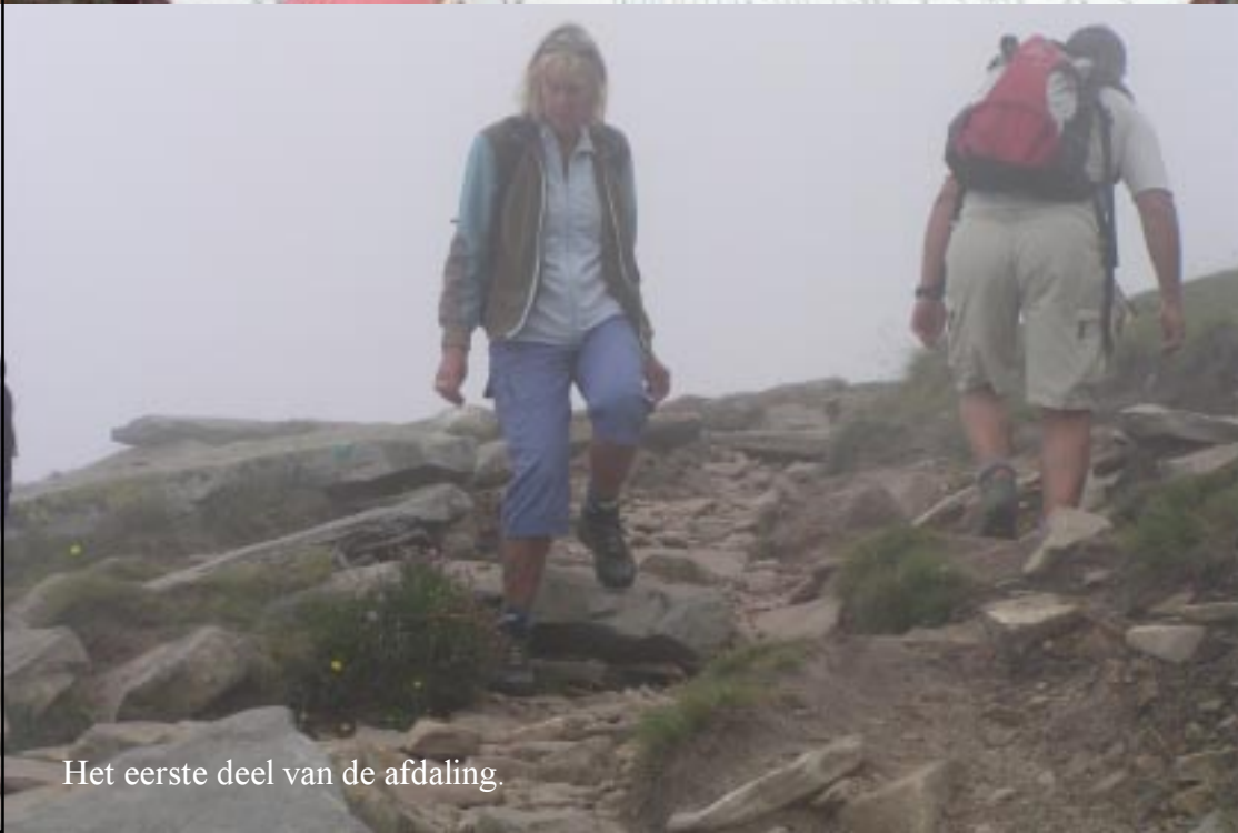
Het eerste deel van de afdaling.