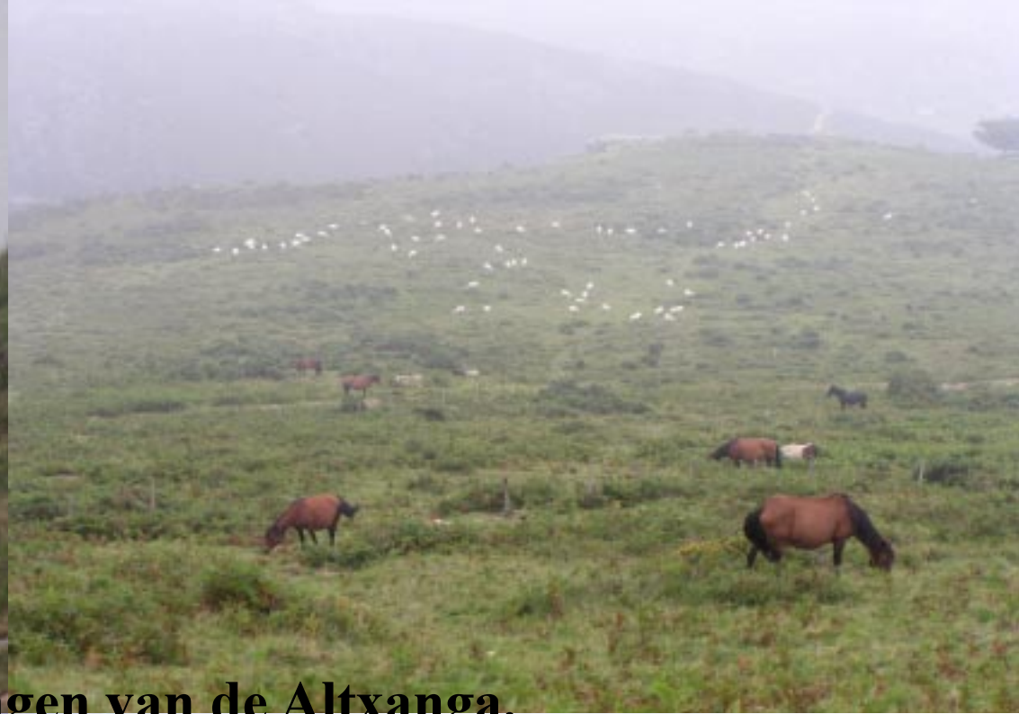
Pottok's op de hellingen van de Altxanga.