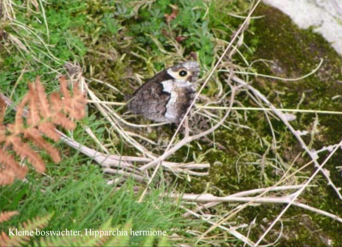
Kleine boswachter, Hipparchia hermione .