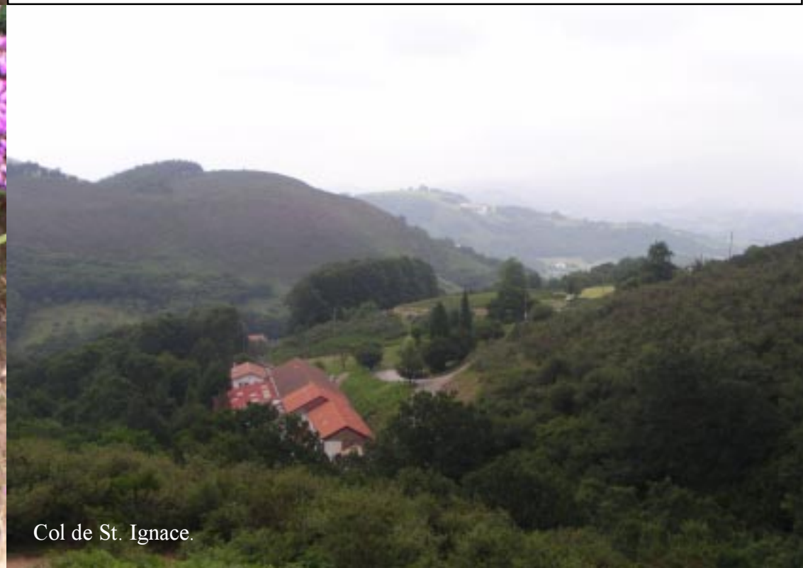
Col de St. Ignace.