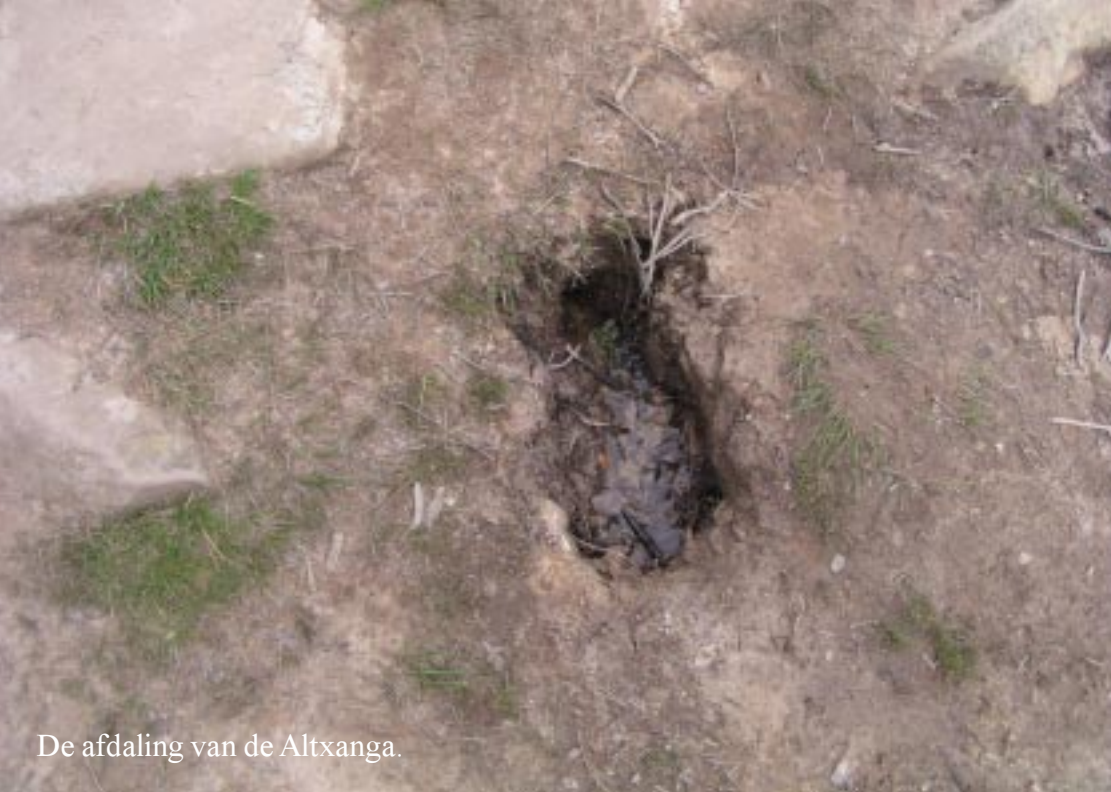
De afdaling van de Altxanga.

Mensen met kleine kinderen hebben zulke problemen niet. Kinderen hier zijn een soort klipgeiten.