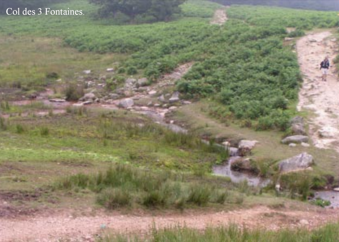
Col des 3 Fontaines.