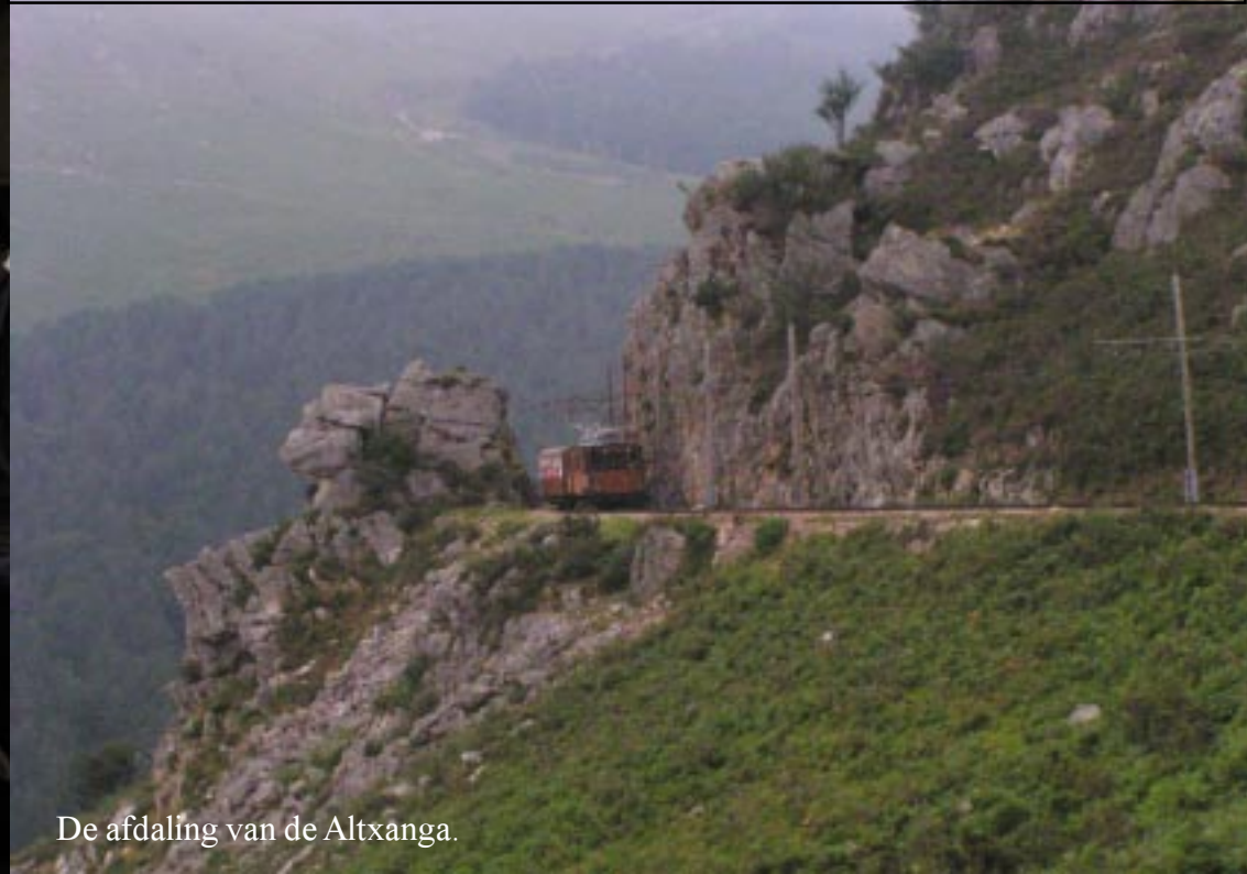
De afdaling van de Altxanga.