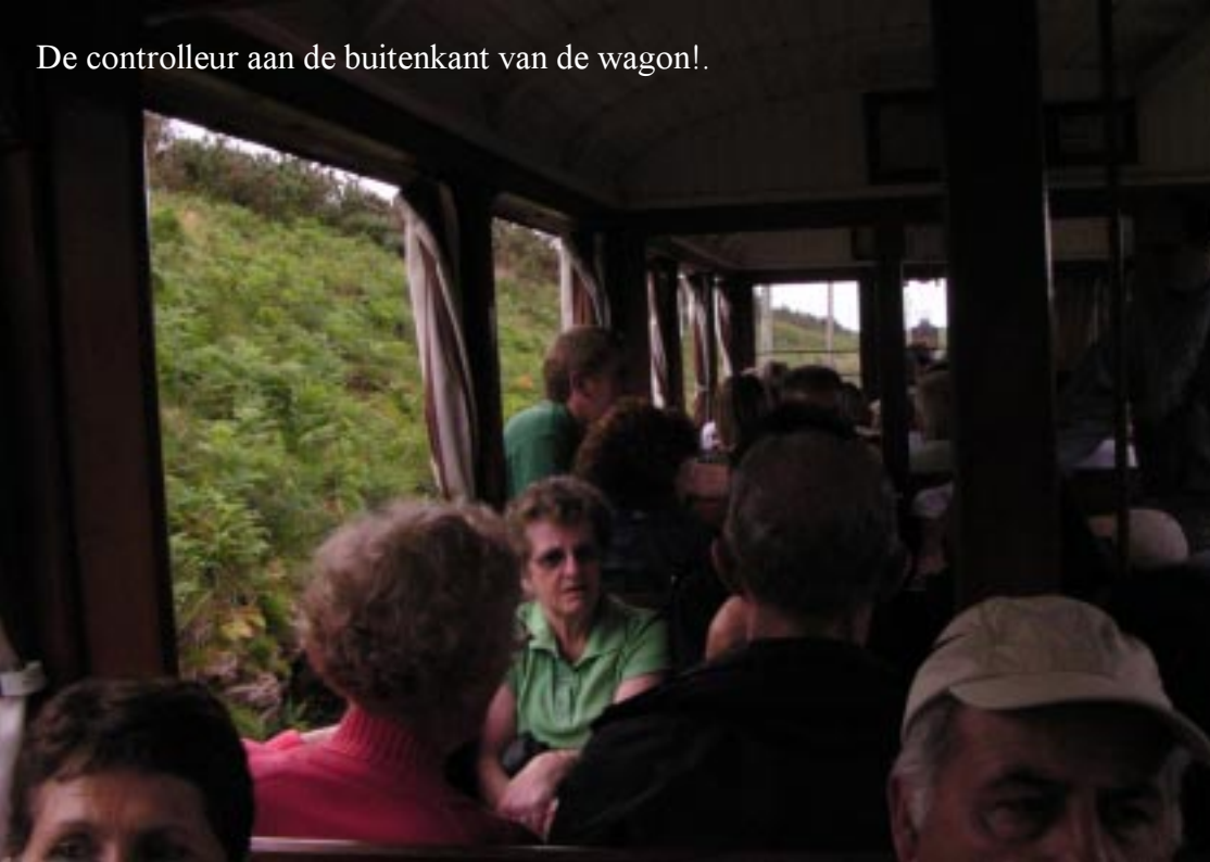
De controleur aan de buitenkant van de wagon!

Na zo'n 10 minuten komt iemand aan de buitenkant van de wagons de kaartjes controleren. Net na elven passeren we een uitgehakte passage. Het treintje bestaat overigens uit twee delen, die op gepaste afstand van elkaar rijden. Dus no1 kan ik mooi fotograferen.