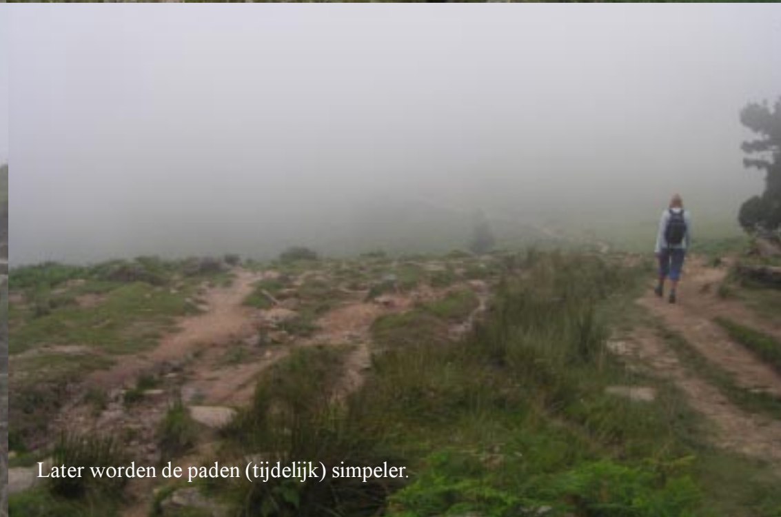
Later worden de paden (tijdelijk) simpeler.