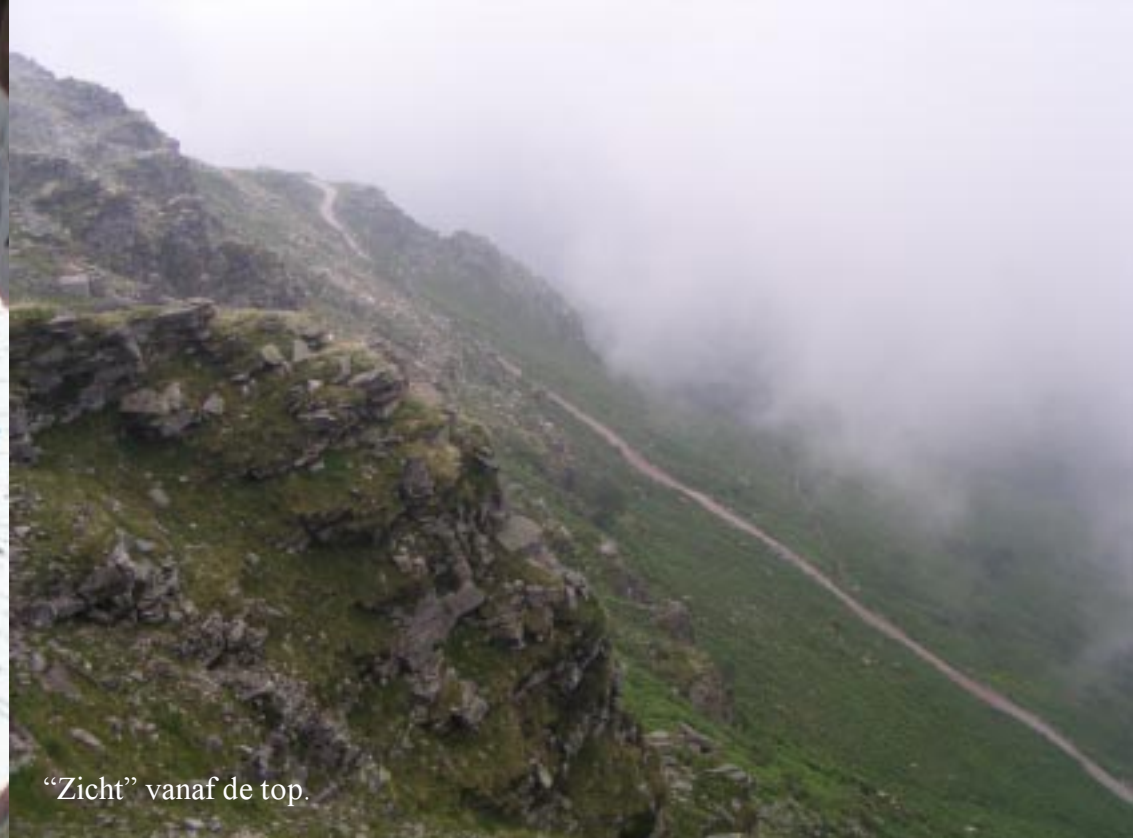
“Zicht” vanaf de top.