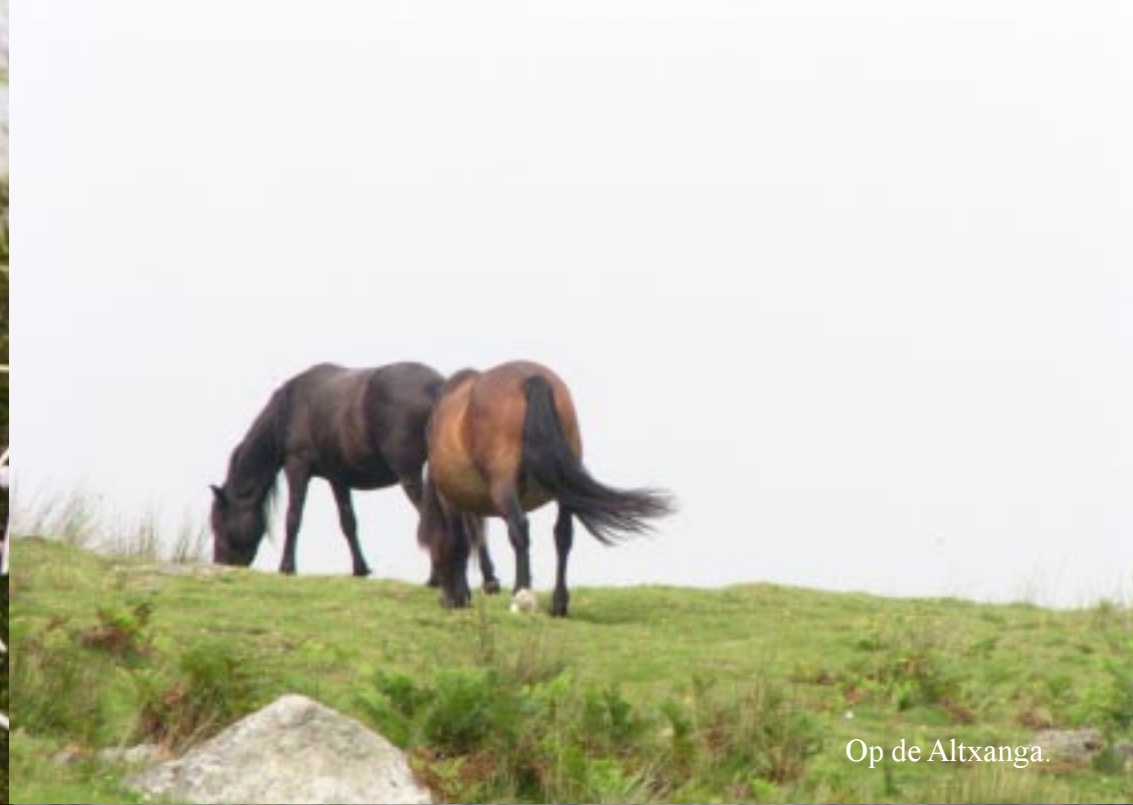
Op de Altxanga.

We moeten weer een stuk omhoog lopen en komen op een kam, waar we onze boterham en thee drinken. We gaan wel achter een rotsblok uit de wind zitten, want echt warm is het hier niet.