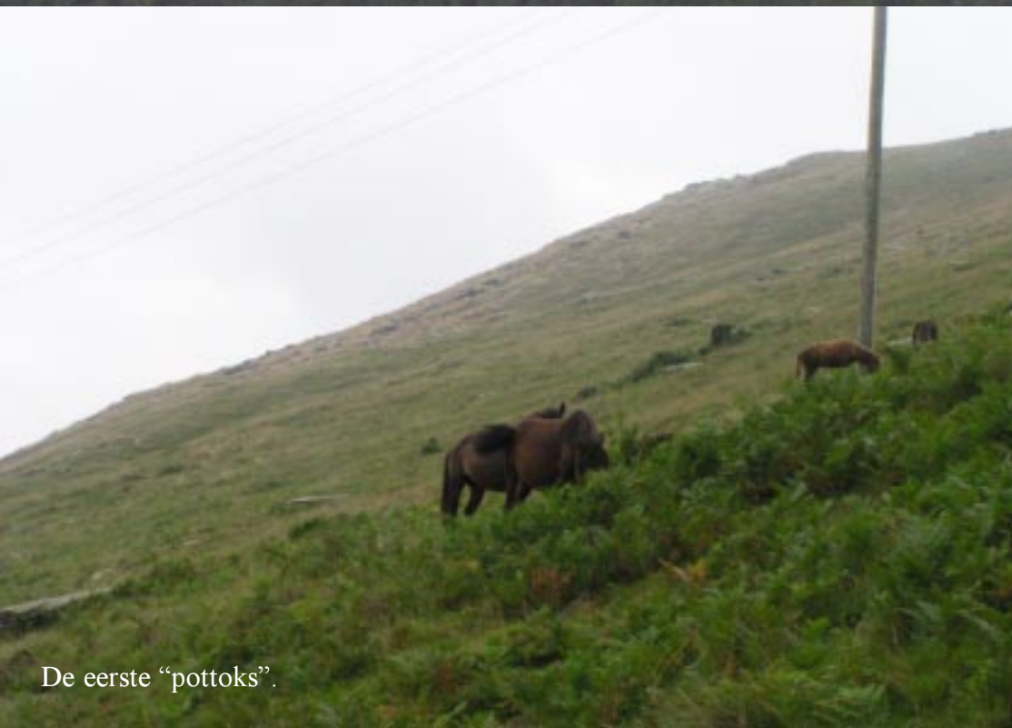
De eerste "pottoks".

Helaas wordt het steeds mistiger naarmate we steeds hoger komen. We passeren de eerste half wilde Pottok-paardjes.