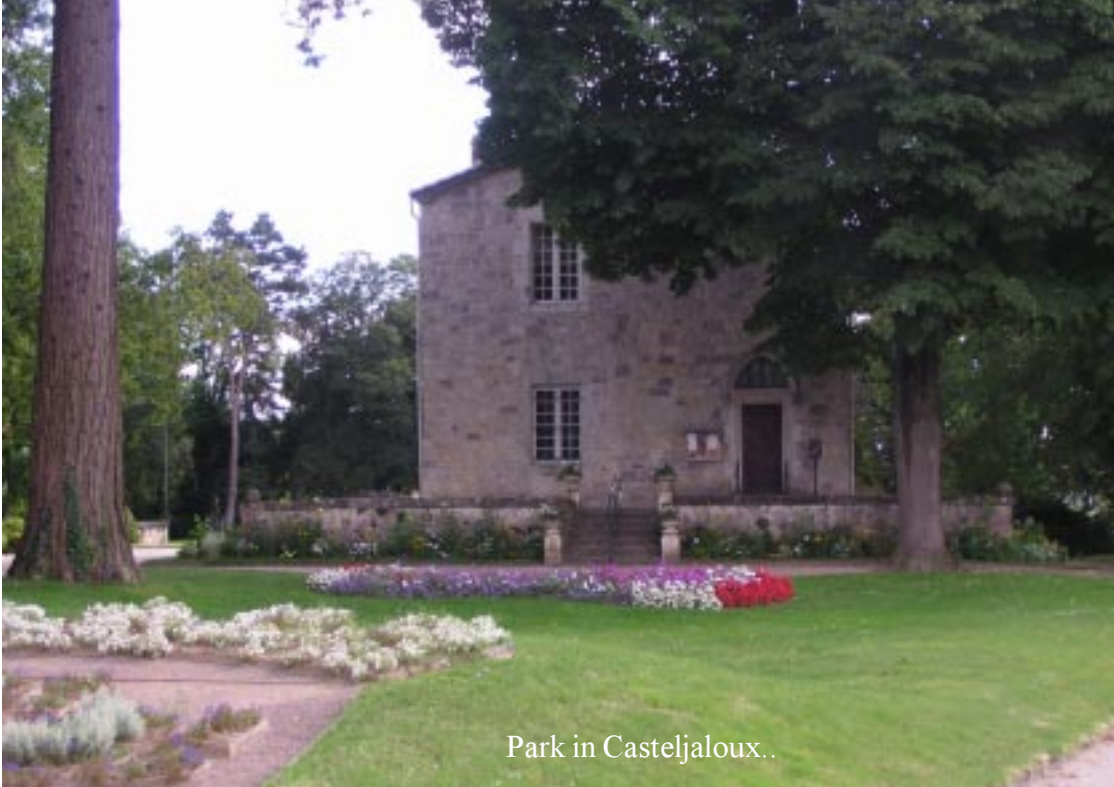
Park in Casteljaloux..