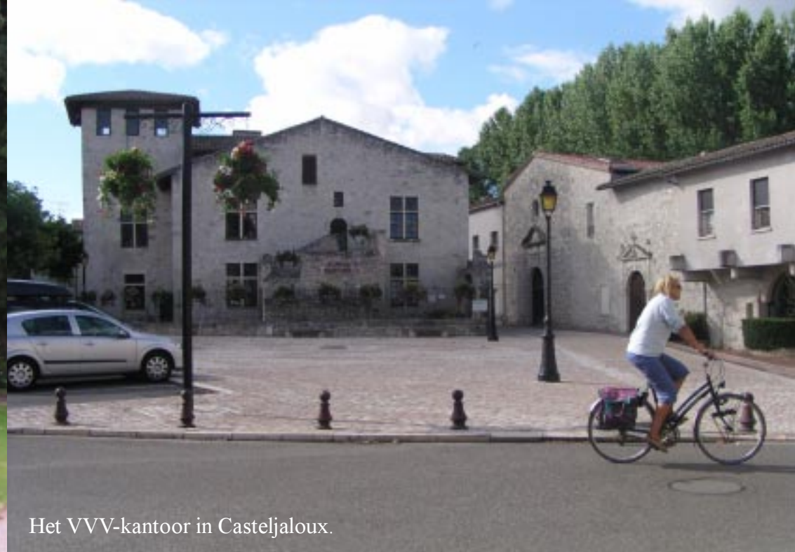
Het VVV-kantoor in Casteljaloux.

's Avonds stappen we op de fiets en rijden het dorp in en rijden daar wat rond om een restaurant te vinden. We krijgen zo enkele aardige gebouwen en een kleine winkelstraat te zien. Het oude "centrum" heeft enkele aardige steegjes.