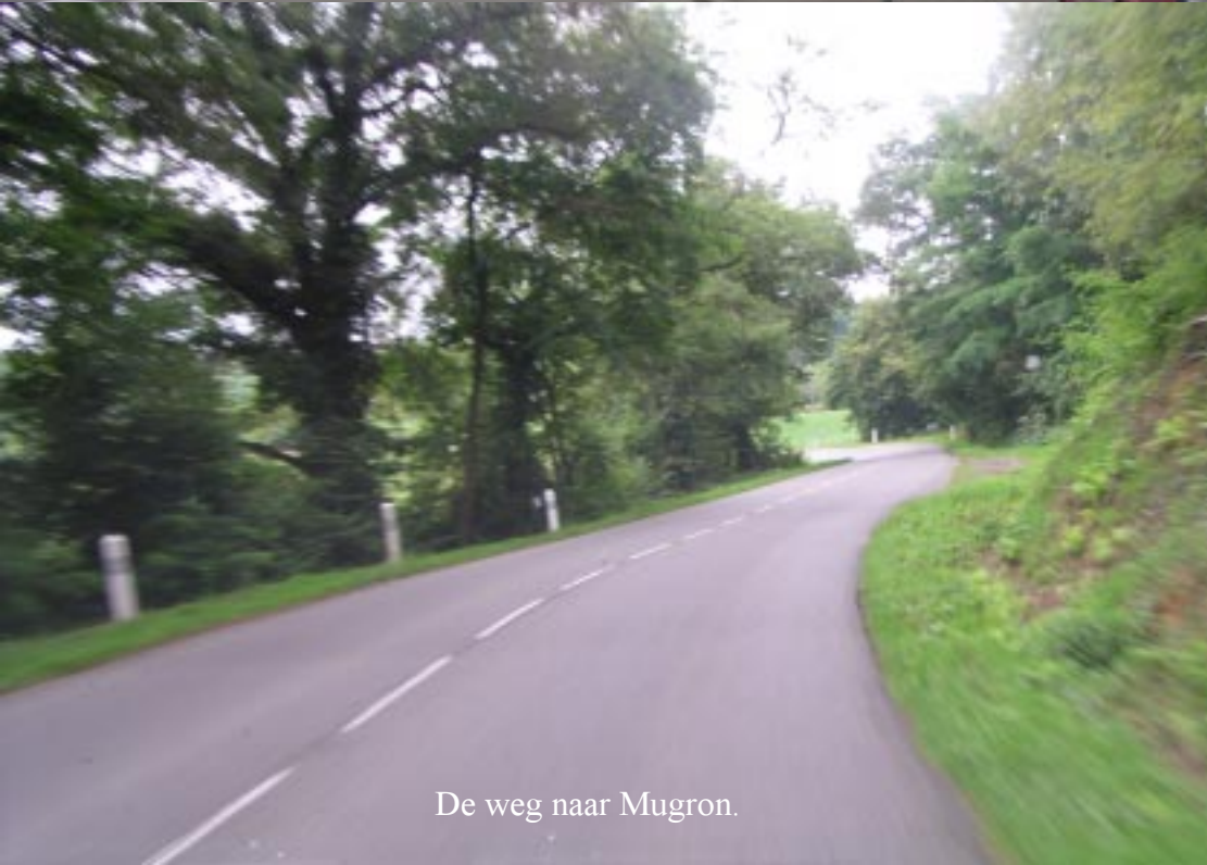
De weg naar Mugron.

Klik op de foto onder rechts voor het verslag van de wandeling.