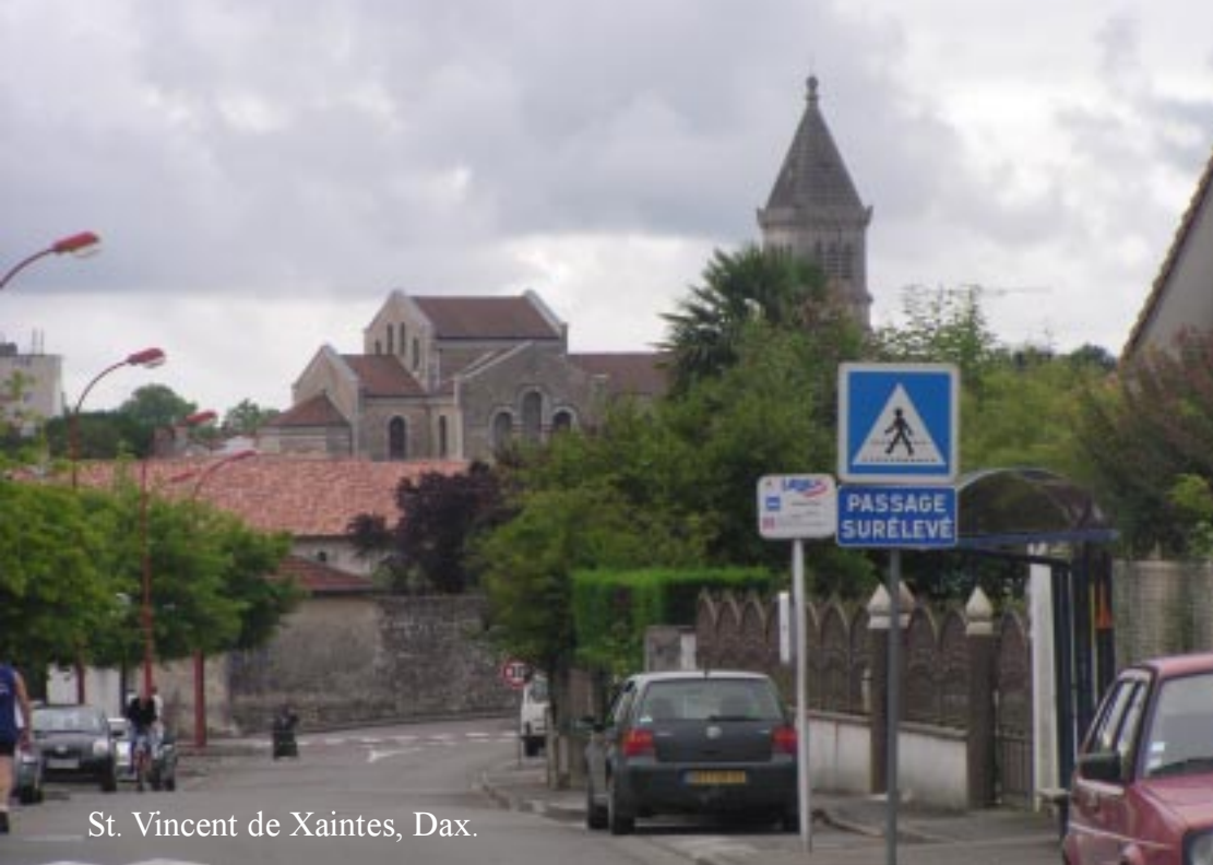
St. Vincent de Xaintes, Dax.