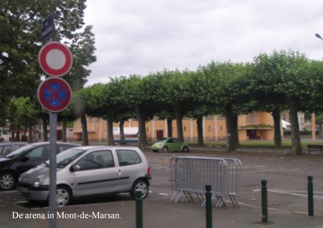
De arena in Mont-de-Marsan.