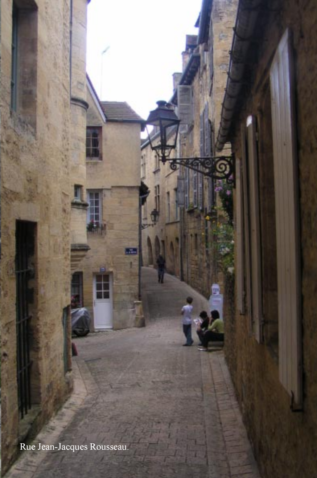
Rue Jean-Jacques Rousseau.