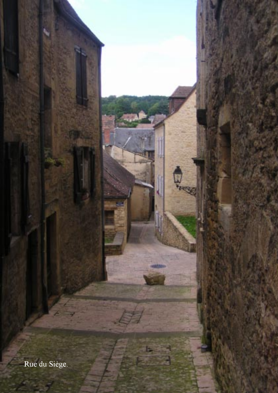
Rue du Siège.

We kijken onze ogen uit. Alles stamt hier nog van de middeleeuwen. Geen wonder dat zoveel mensen hoog opgeven van de Dordogne en dat het hier zo gruwelijk druk is.