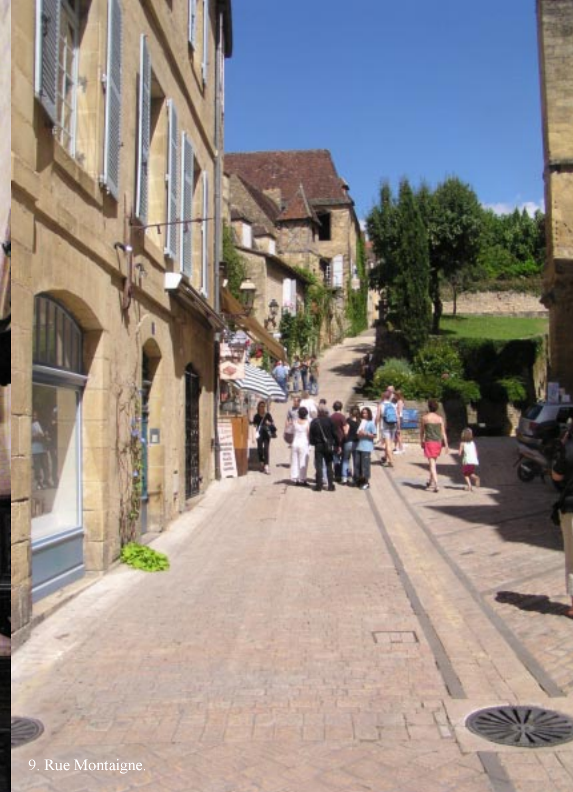
9. Rue Montaigne.

We maken een rondje over het drukke Place de la Liberté en kruipen door de Passage de Henri de Ségogne terug naar de kathedraal.