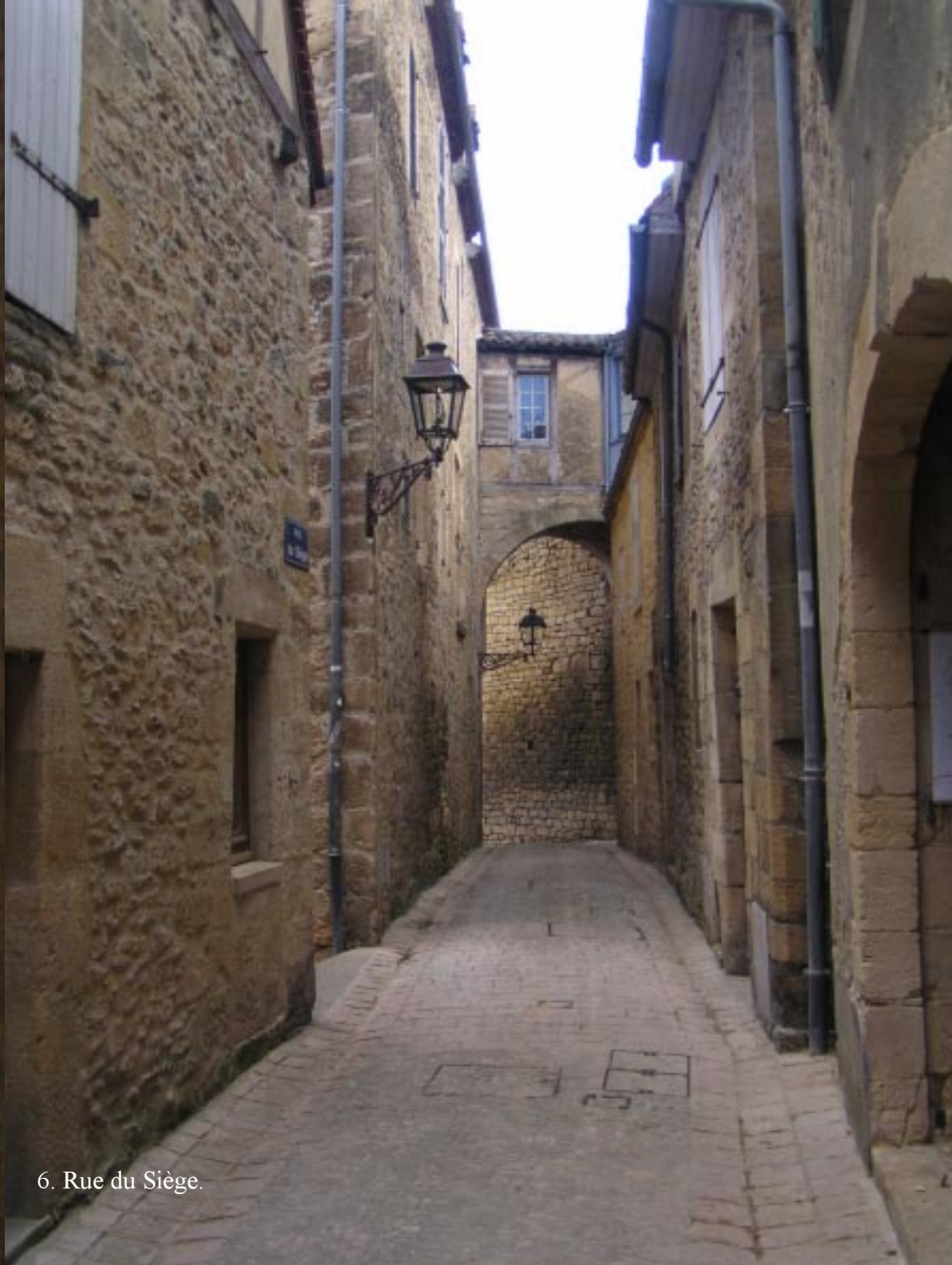
6. Rue du Siège.