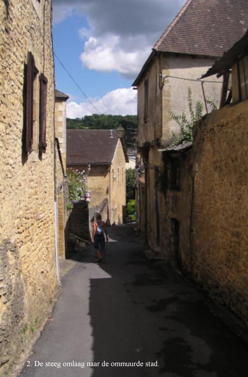
2. De steeg omlaag naar de ommuurde stad.