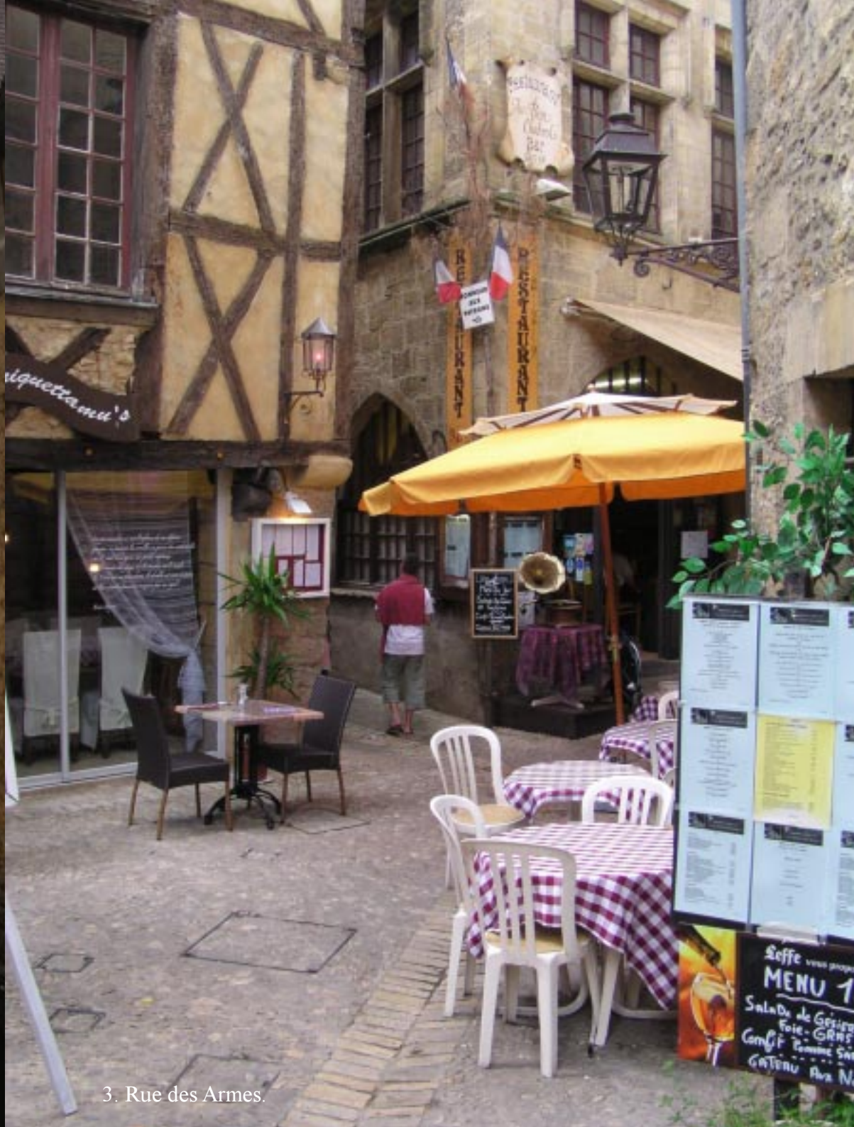
3. Rue des Armes.