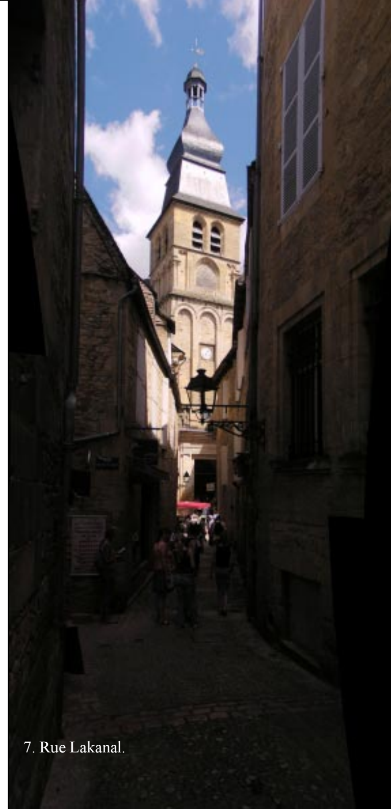
7. Rue Lakanal.

Via de Rue du Siège en een poort Passage Ernest Baudel lopen we een klein stukje buiten de muren om weer terug naar Rue du Siège. Dan gaat het omlaag over Rue Lakanal naar de kathedraal.