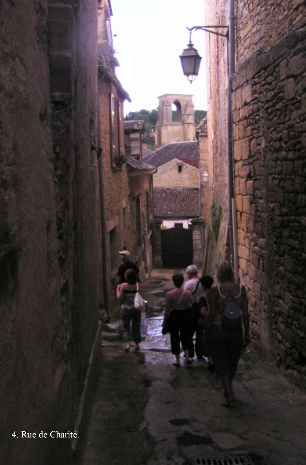
4. Rue de Charité.