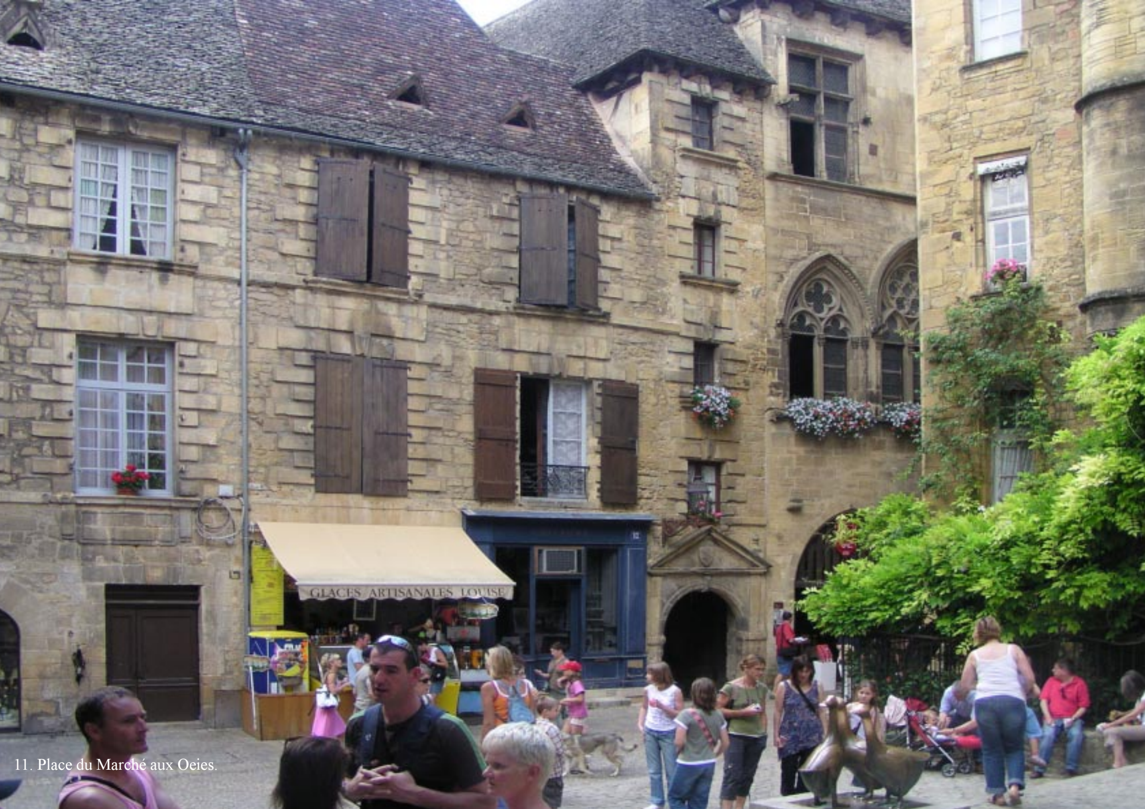
11. Place du Marché aux Oeies.