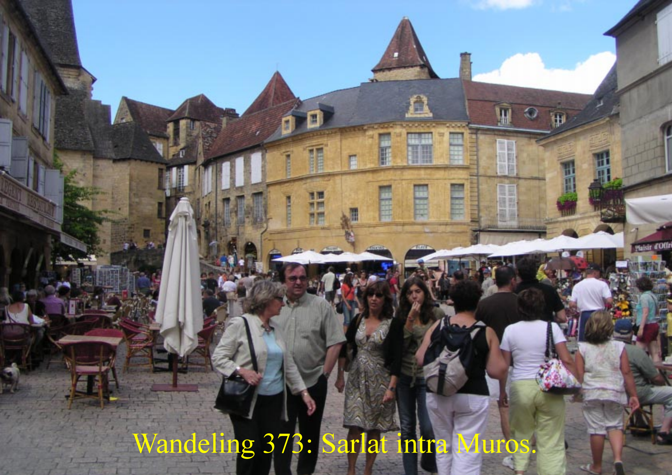
Wandeling 373: Sarlat intra Muros.