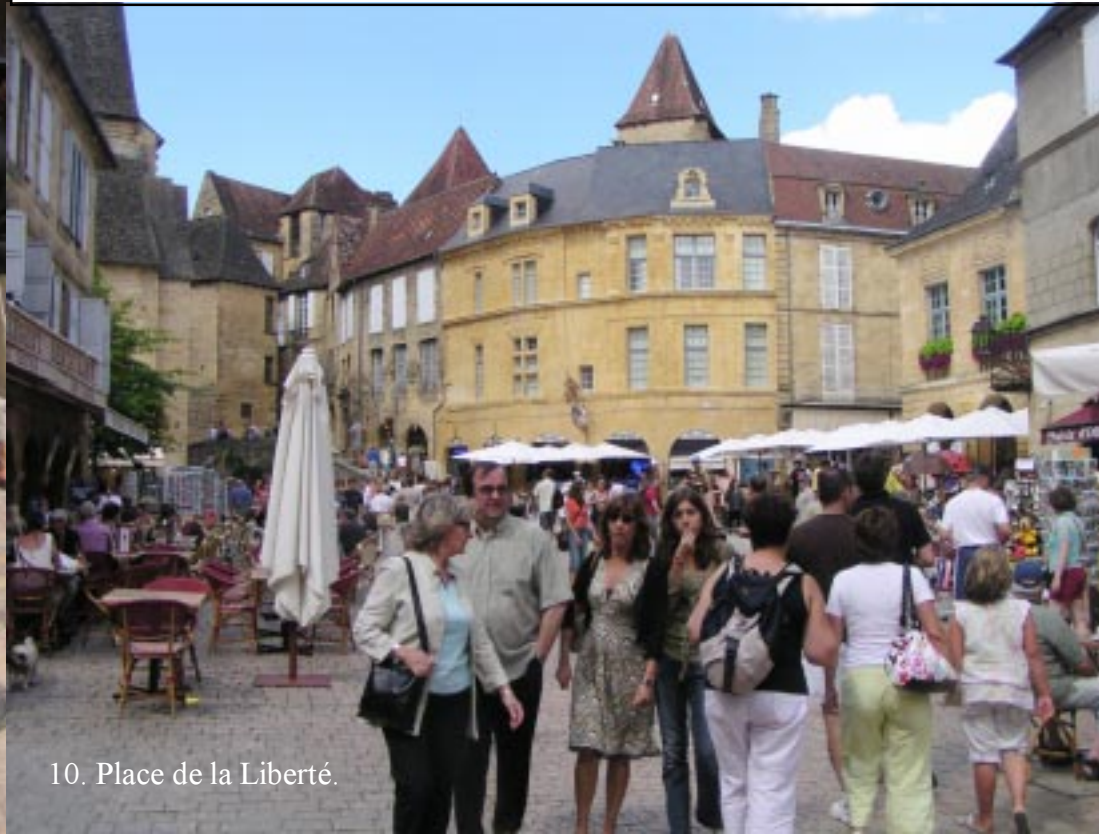
10. Place de la Liberté.

Via een poortje komen we op de Rue Montaigne.