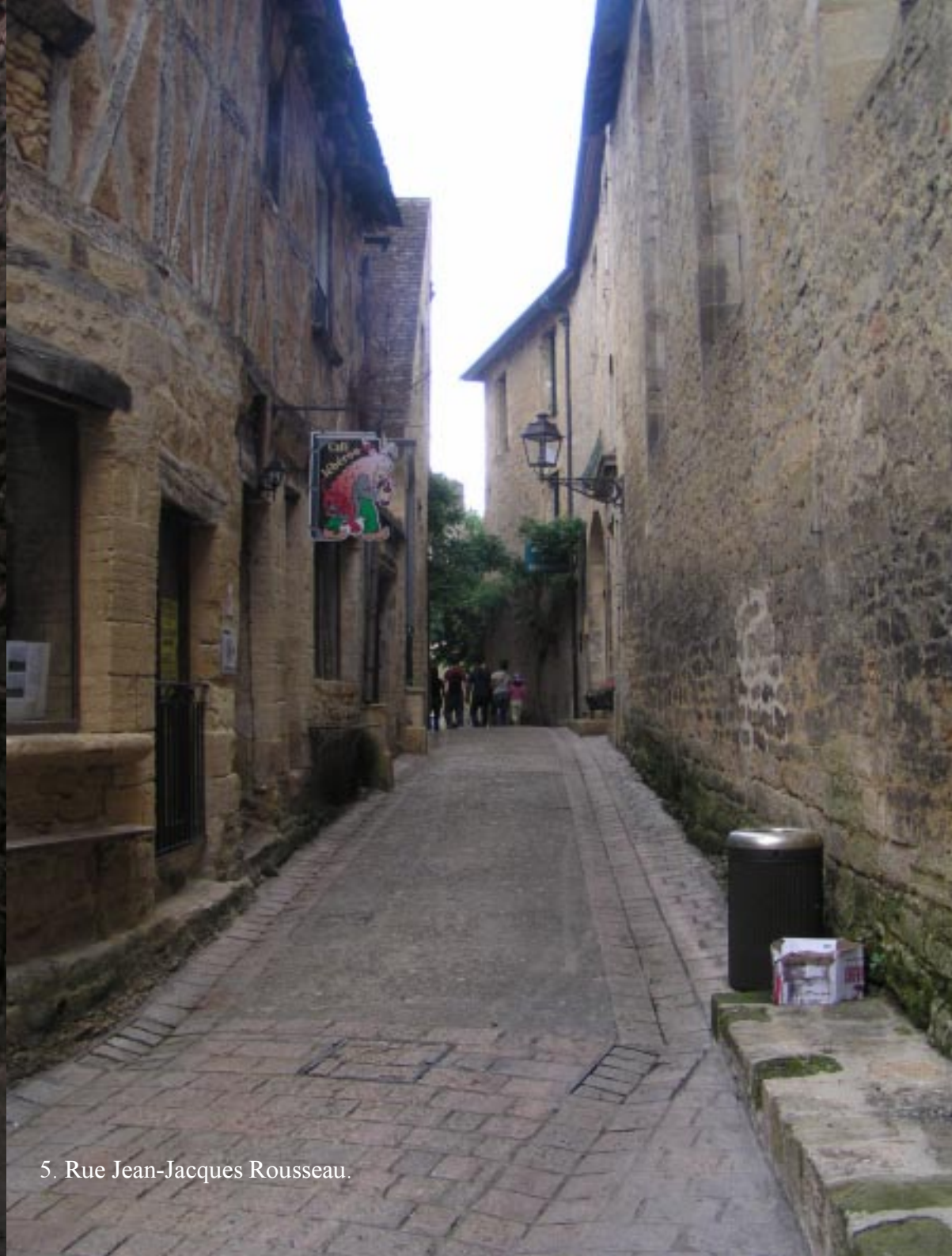
5. Rue Jean-Jacques Rousseau.