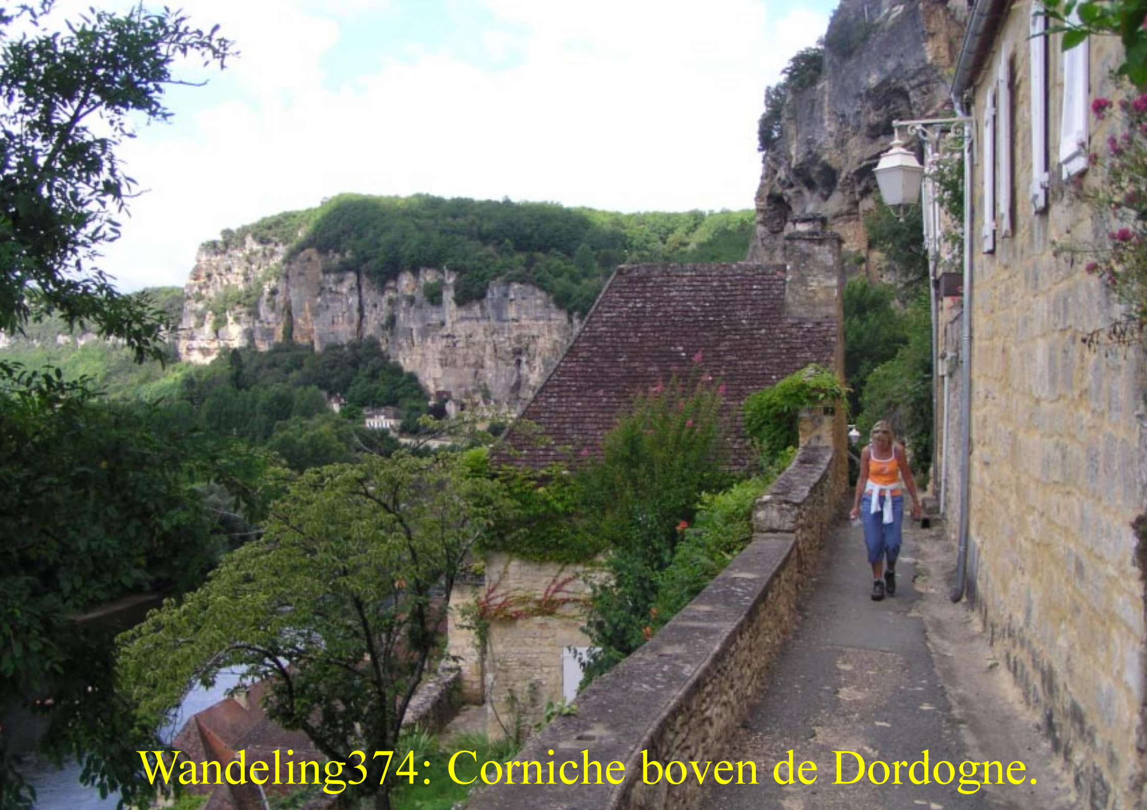
Wandeling374: Corniche boven de Dordogne.