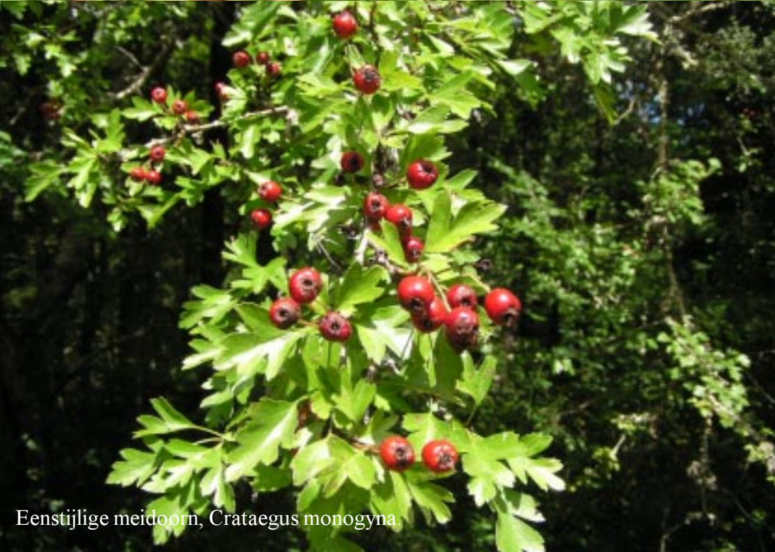
Eenstijlige meidoorn, Crataegus monogyna .

Dat smalle kronkelpaadje gaat aanvankelijk over en langs rotsen heel steil naar beneden, zodat we op losse stenen moeten passen.