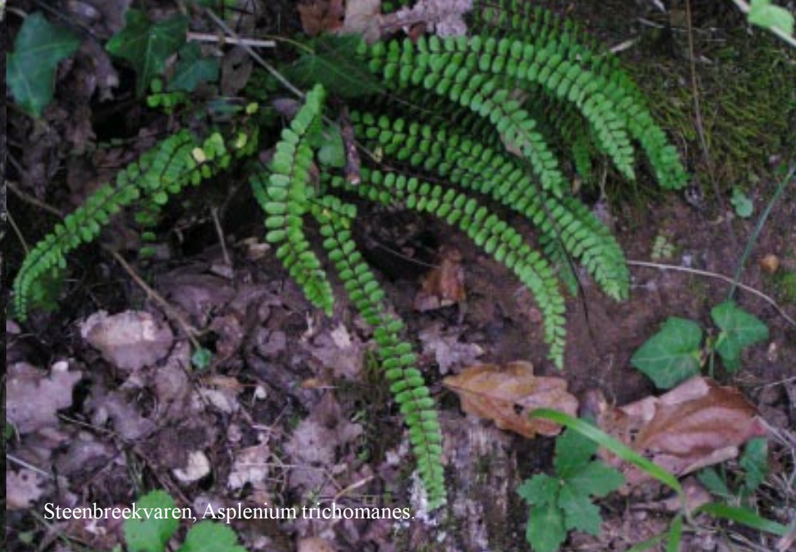
Steenbreekvaren, Asplenium trichomanes .