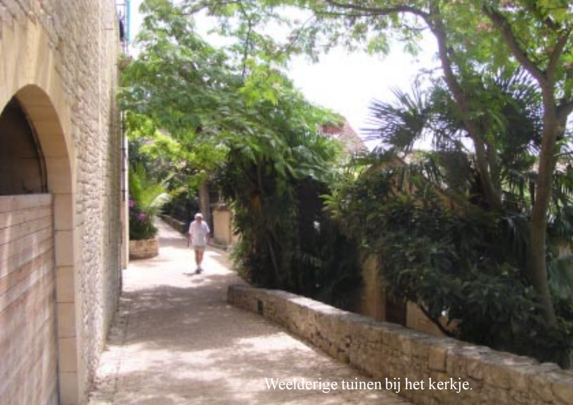
Weelderige tuinen bij het kerkje.