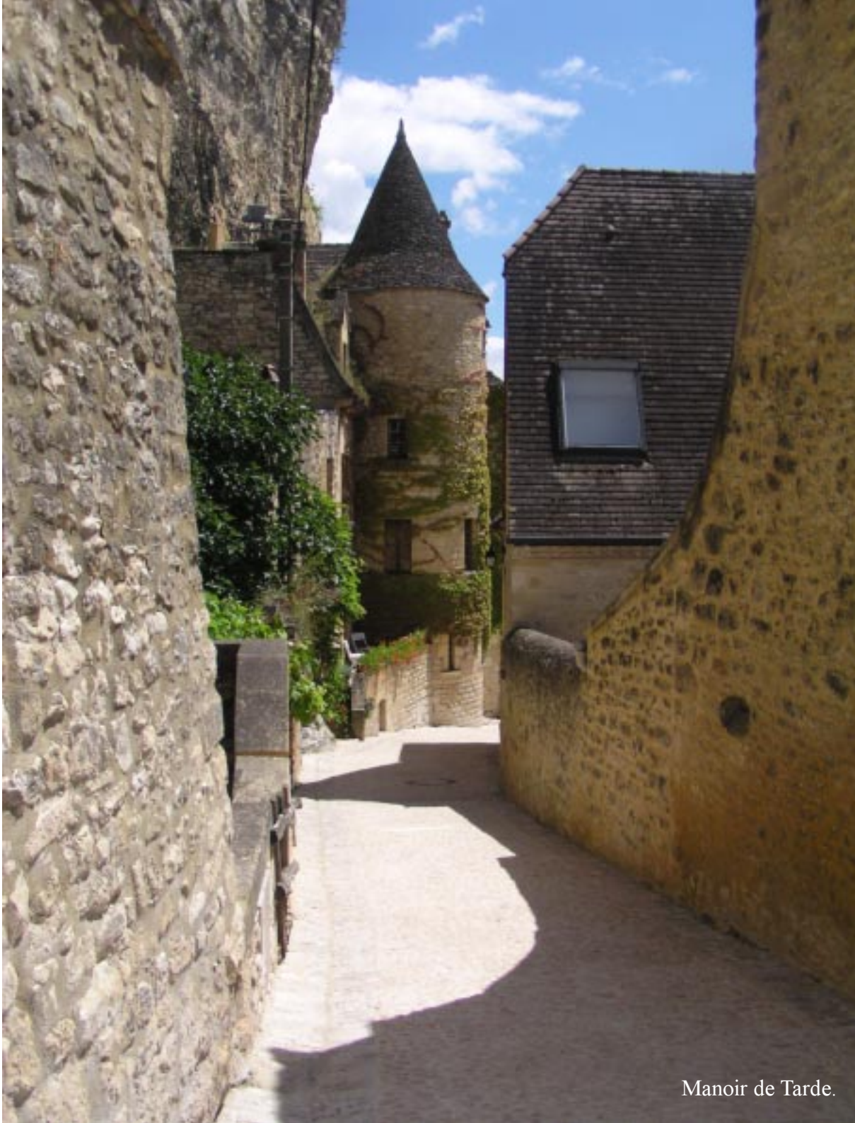
Manoir de Tarde.