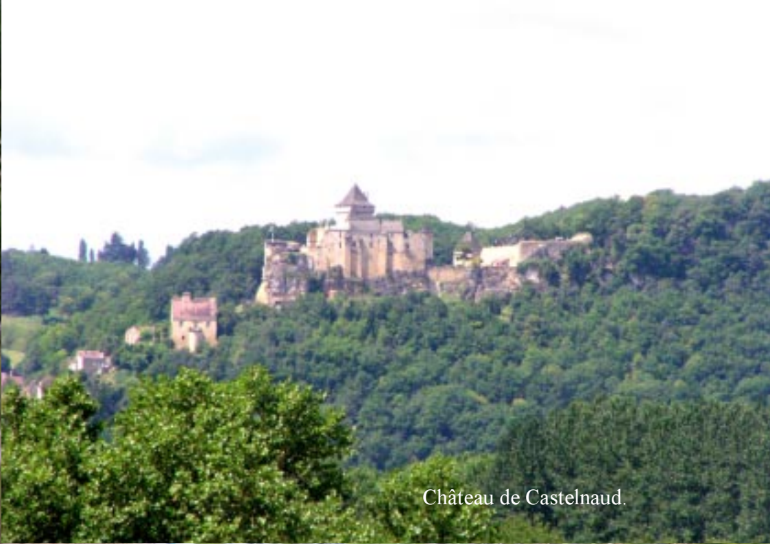
Château de Castelnaud.