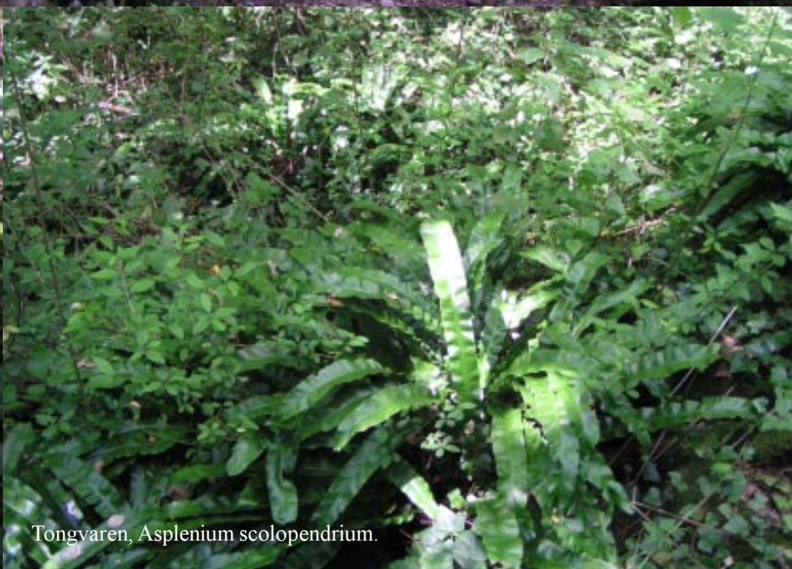
Tongvaren, Asplenium scolopendrium .

Na de afslag naar links (les Bouygues staat er op het kaartje) verlaten we het dal rechts en komen we in droger bos. Minder varens dus, soms open plekken. die dan steevast door braamstruiken zijn ingenomen.