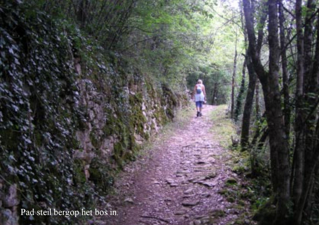
Pad steil bergop het bos in.