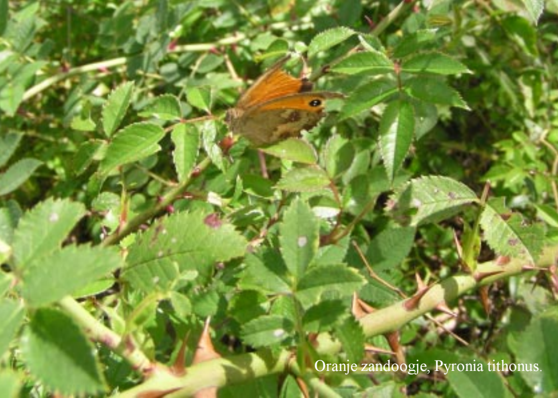
Oranje zandoogje, Pyronia tithonus .

Tegen 3/4 van de route ziet Tineke opeens een bleke vos voor zich op het pad! "Nee een katachtige met spitse oren! Een lynchx?"