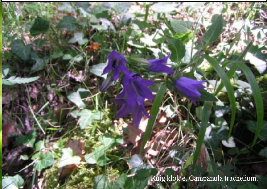
Ruig klokje, Campanula trachelium .